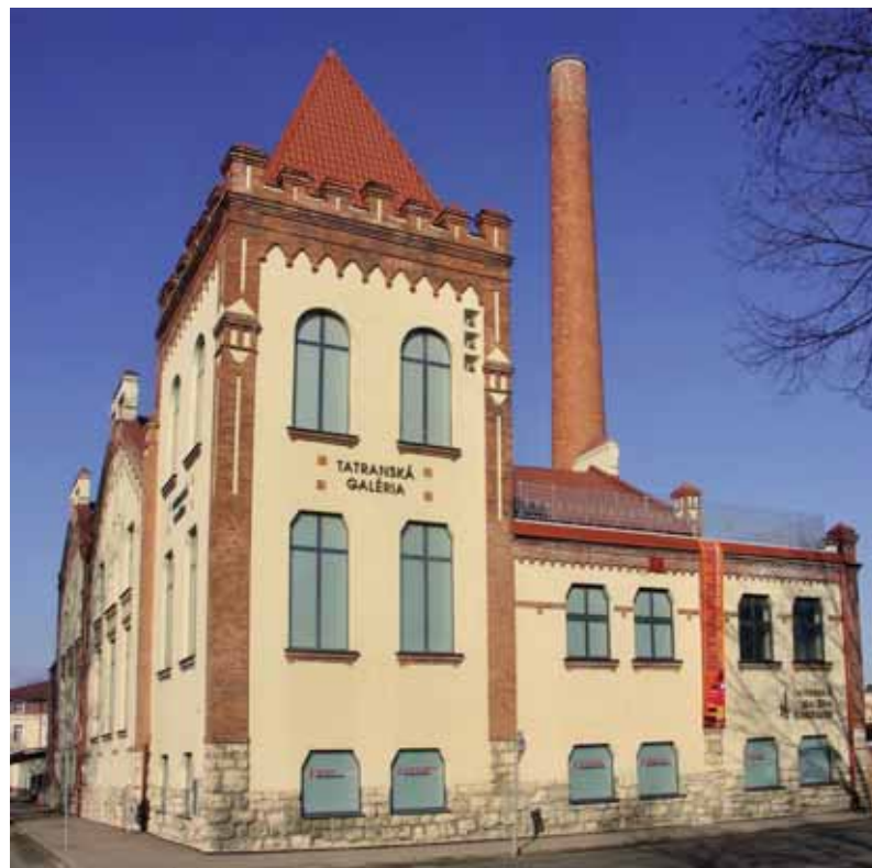
Tatranská galéria v Poprade je príkladom, ako možno bývalej priemyselnej architektúre dať novú funkčnú náplň.

• Po májovom uvedení stálej expozície Odkryté hodnoty prežila Tatranská galéria v závere minulého týždňa (20. októbra) ďalší významný – ani nie deň – ale medz-