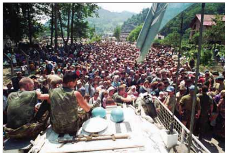
Začiatok zrodu srebrenického mýtu – zlyhanie ochranných síl OSN v etnickom konflikte...

v oblasti Podrinia okolo Srebrenice na základe jeho príslušnosti k srbskému národu, ktorému boli vystavení bez rozdielu muži, starci, ženy aj deti, nikto na Západe hystericky neoznačuje za genocídu, aj keď jej definíciou zodpovedá väčšina ako odsúdeniahodný zločin v Srebrenici, spáchaný bosniacko-srbskými jednotkami na srebrenických mužoch po obsadení mesta ako odvetu za