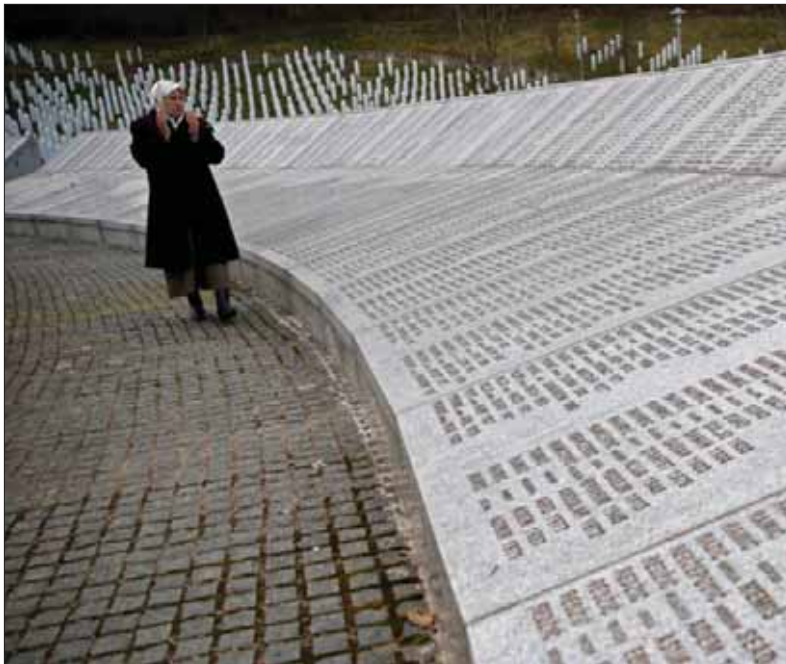
Na vytváranie obrazu vinníka môže propagande poslúžiť aj takáto starostlivo aranžovaná scéna a príslušné kulisy.

Toto systematické vraždenie príslušníkov jedného etnika s cieľom jeho úplného fyzického vyhladenia