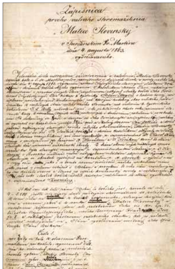
Zápisnica z ustanovujúceho zhromaždenia v roku 1863.