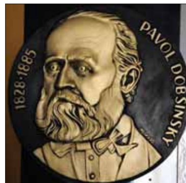
i múzeum slovenskej rozprávky, ktoré pripomína najslávnejšieho obyvateľa Drienčan, a tiež spomínaná súťaž.

Pavol Dobšinský prišiel do Drienčan v roku 1861 a ako evanjelický farár pôsobil tu dvadsaťštyri rokov až do svojej smrti v roku 1885. Hrob tohto spisovateľa štúrovskej generácie, folkloristu a vytrvalého zberateľa ľudovej slovesnosti sa nachádza neďaleko fary, v ktorej žil a tvoril. V zrekonštruovanej fare je