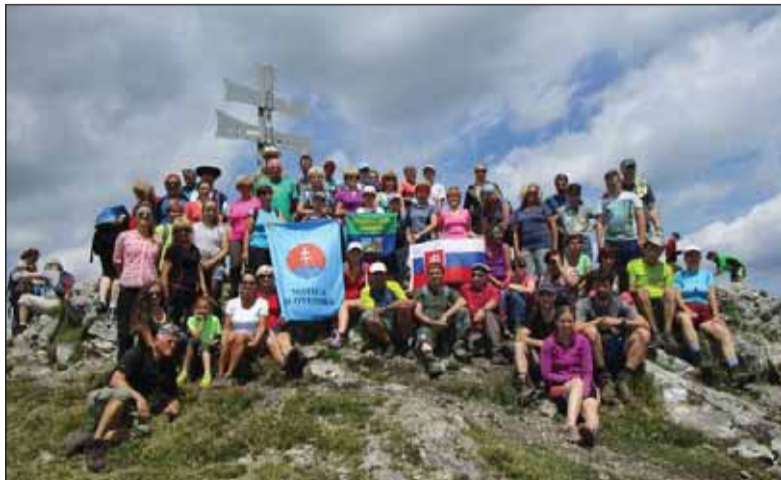
Okolo sto účastníkov sa zúčastnilo na 19. ročníku spomienkového pochodu od prameňa národnej rieky Nitry na vrchol Klaku, ktorý matičiari v Prievidzi organizujú ako hold svätým Cyrilovi a Metodovi.