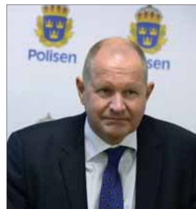
Švédsky národný policajný komisár Dan ELIASSON čelí kritike za nezvládnutie situácie s migrantmi v krajine. Na pomoc pri zmene stavu sú sily polície nedostačujúce – argumentuje. Pomocť musí celá spoločnosť!

Svenska Dagbladet konštatuje, že vláda musí zaviesť núdzový plán, ako čeliť problémom, s ktorými sa Švédsko predtým nikdy nestretlo. Pod tlakom okolností najmä obyvatelia na vidieku začínajú organizovať nočné občianske hliadky. Vláda vyčlenila prostriedky na ďalšie rozšírenie kamerových systémov v uliciach, do udržiavania verejného poriadku by mali byť viac zapojené aj rôzne súkromné bezpečnostné služby. Policajti v mestách požadujú viac osobných