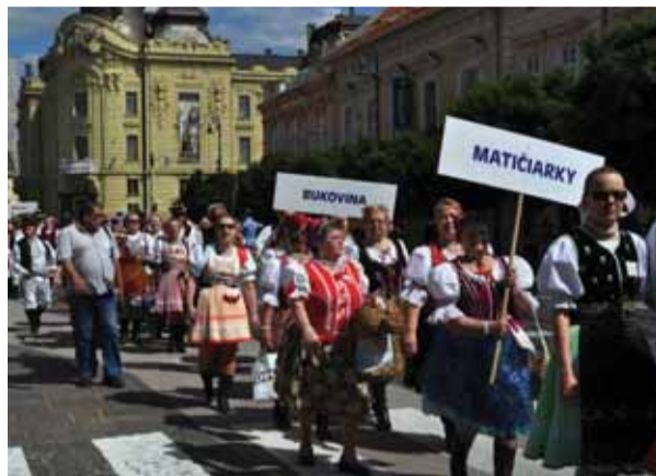
Tanečné a spevácke súbory zo Zemplína počas slávnostnej prezentácie v Košiciach.