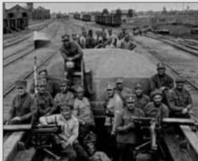
Českí a slovenskí legionári v jednom z ešalónov v Rusku na Transsibírskej magistrále.

Légiovlak, ktorý začal svoju terajšiu púť prvého augusta v Žiline, predstavuje vojenské ešalóny prepravované železnicou, ktorými sa desaťtisíce česko-slovenských legionárov prepravili naprieč Ruskom po Transsibírskej magistrále, pričom pri postupe neraz museli bojovať s bolševikmi. Vlak sa skladá z vozňa poľnej pošty, vozňa označovaného ako „tepluška“, ktorý slúžil ako pojazdná kasáreň, ďalej zo zdravotného, štábného, z obrneného, krajčirského, predajného, dielenského, ubytovacieho vozňa a z dvoch plošinových vagónov. Okrem toho má vlak aj premietač vagón, kde si návštevníci môžu pozrieť historické dokumenty z tohto obdobia. Navyše je jeho fundus doplnený o dobový arzenál a množstvo iných dobových dokumentov a artefaktov, ktoré odborné vysvetlí posádka vlaku oblečená do dobových kostýmov a uniforiem.