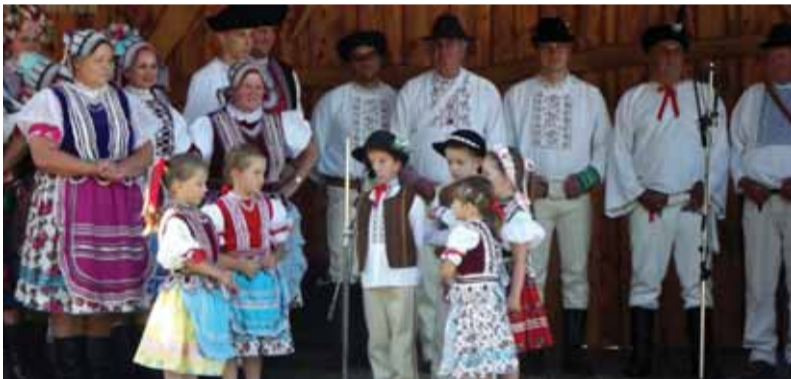
Vo vyšnoslanskom súbore Radzim sa za pol storočia vystriedalo niekoľko generácií miestnych obyvateľov. Aj teraz myslia na budúcnosť, ktorú pre tamojší folklór predstavuje detský súbor Radzimčok.