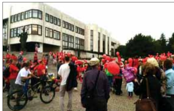
Súbežne s bujarým pochodom Bratislava Pride sa od parlamentu pohýnal pochod Za rodinu.