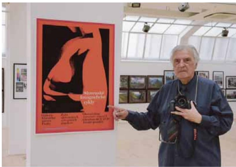
Autor vyniká v čiernobielej fotografii, kde zanechal trvalú stopu najmä charakteristickými a charakternými aktmi.