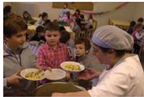
Školské stravovanie si vyžaduje azda najväčšiu mieru obozretnosti pri používaní surovín do jedál.

To všetko bez zbytočnej administratívy. Na tvorbe položiek katalógu bude spolupracovať Slovenská poľnohospodárska a potravinárska komora, Potravinárska komora Slovenska a Agrárna komora Slovenska. Komory majú pripravené vyškolených pracovníkov a poradcov pri práci s katalógom. Odborným garantom je Výskumný ústav potravinársky.