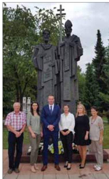
Predstavitelia Matice slovenskej a mesta Prievidza si uctili svätých solúnskych bratov pri ich pamätníku položením vencov.

Nitry pripomenuli aj 5. júla priamo pri prameni národnej rieky Nitry a výstupom na Klak. Na deväťnástom ročníku podujatia sa zúčastnilo okolo sto nadšencov turistiky.