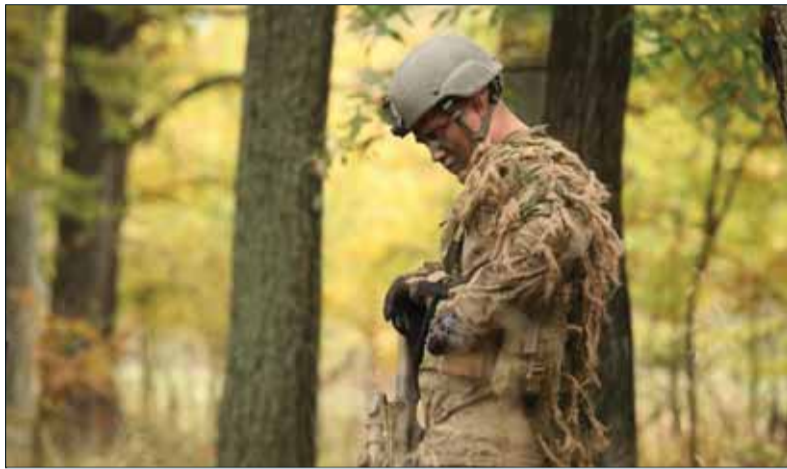
Americký vojak vo výcvikovom priestore Valaškovce – Kamenica nad Cirochou, počas cvičenia Ground Pepper...

Prečo je pre nás Slovákov dôležité o tom hovoriť? Pretože na Slovensku prevládla argumentácia Severoatlantickej aliancie NATO a vojensko-priemyselného komplexu USA. Teraz všetky médiá svorne hovoria o tom, že prezident D. Trump zmenil názor. Kým v predvolebnej kampani sľuboval opak, teraz tam