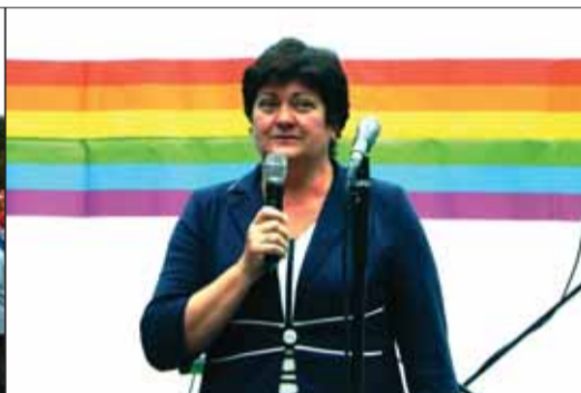
Ombudsmanka PATAKYOVÁ pochopila agendu verejnej ochrankyne práv veľmi svojsky.