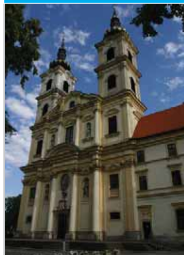
Pätnásteho septembra v deň štátneho sviatku Sedembolestnej Panny Márie tradične smerovali k národnej svätyni v Šaštíne pútnici aj osobitnými vlakmi.

Galanta – Trnava – Šaštín-Stráže a späť.