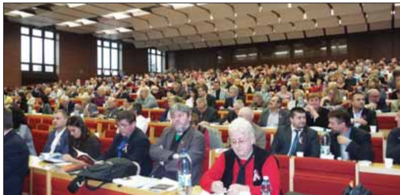
V Liptovskom Mikuláši sa zišlo takmer štyristo delegátov – matičiarov z celého Slovenska. Matica má viac členov ako ktorákoľvek politická strana – dvadsaťdeväťtisíc.