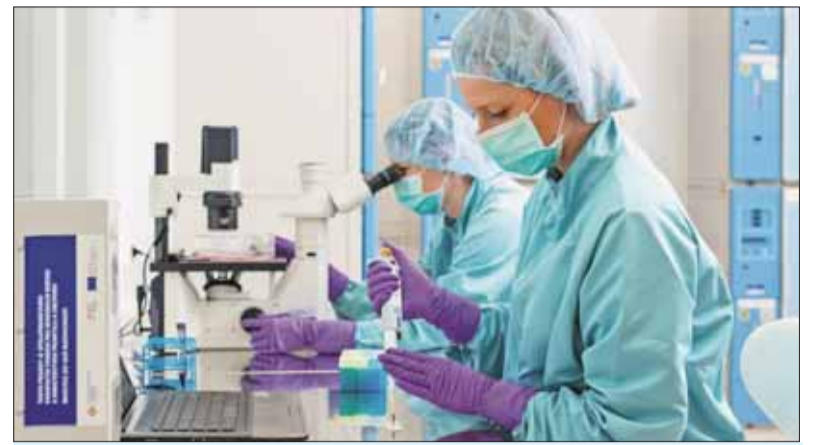
Laboratórne pracoviská Slovenského centra tkanív a buniek.

„Výhodou aj nevýhodou je, že sme na Slovensku. Nevýhoda je