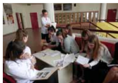
Deti v slovenskej škole v Sarvaši.

pre školy záväzný. Školy si preto túto učebnú pomôcku už na tento školský rok neobjednávajú.