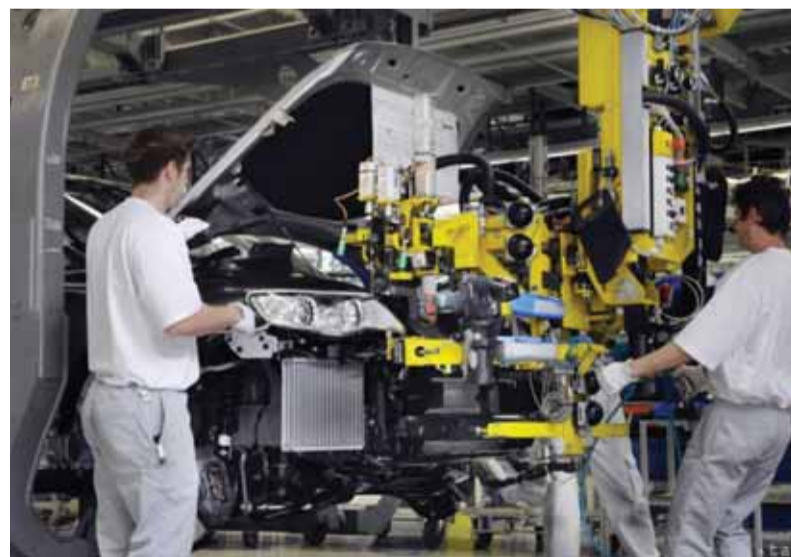
Na výsledky hospodárstva v Česku aj na Slovensku výrazne vplýva produkcia automobiliek.

Odzrazilo sa to na vyše dvojnásobnom raste slovenského priemyslu v porovnaní s Českom, na raste zamestnanosti aj s následným rastom miezd, ktoré sú dnes na približne rovnakej úrovni, keď hodinová cena práce dosahuje necelých desať eur. Priemerná mzda na Slovensku je 912 eur, zatiaľ čo v Česku je niečo nad 1 020 eur. Pokiaľ ide o starobné dôchodky, v Česku je priemerná výška penzie 11 828 českých korún, čo predstavuje štyridsaťtri percent priemernej českej mzdy. Na Slovensku máme priemernú výšku penzie 10 927 českých korún a jej podiel na slovenských priemerných