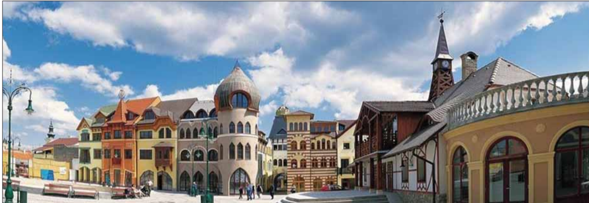
Komárno s necelými tridsaťsedemtisíc obyvateľmi nie je vyše trojmiliónová Barcelona, ale chcelo by ňou byť...

V pozoruhodnej televíznej relácii, ktorá bola vysielaná druhú novembrovú nedeľu ako príloha k nedeľnému rezňu, po prvý raz po župných voľbách predstaviteľ koalície strany Most – Híd kriticky poukázal na tú menšinu z neparlamentnej Strany maďarskej komunity, s ktorou sa nedá dohodnúť. A nielen to, táto menšina, jej okresné orgány v Komárne sa dokonca dovolávajú príkladu Katalánska a pomerov, ktoré nim hýbu.