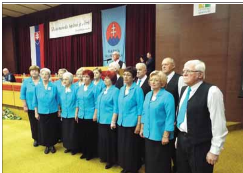
Hymnu zaspieval matičný spevokol.