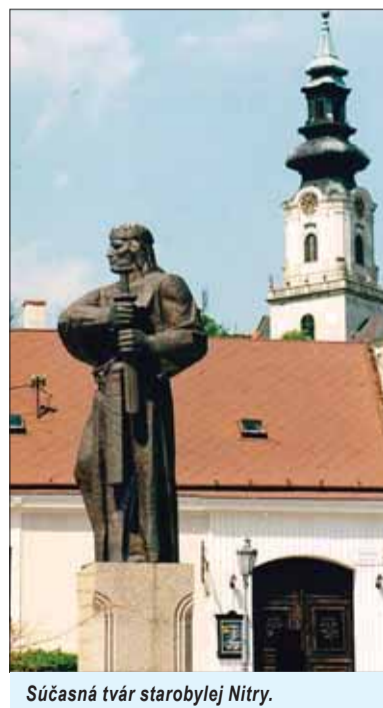
Súčasná tvár starobylej Nitry.