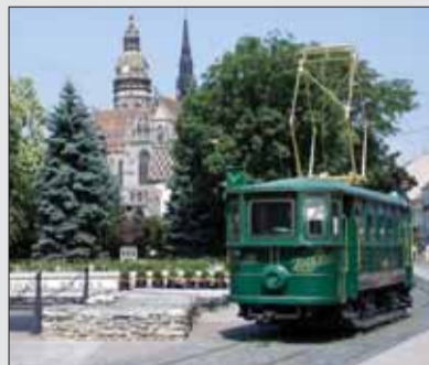
Mestská pamiatková rezervácia v centre Košíc ponúka mnoho jedinečností.

UNESCO Creative Cities Network založili v roku 2004 s cieľom združovať mestá, ktoré vymedzili kreativitu ako významný faktor na trvalo udržateľný rozvoj. Sieť týchto členských miest vytvára podmienky na medzinárodnú spoluprácu v oblasti kreatívneho priemyslu a zvyšuje ich sociálny a ekonomický potenciál. Donedávna mala po celom svete 116 členov. Každé mesto s týmto titulom sa orientuje na jedno zo siedmich kreatívnych odvetví – hudbu, literatúru, film, ľudové umenie a remeslá, dizajn, mediálne umenie a gastronómiu.