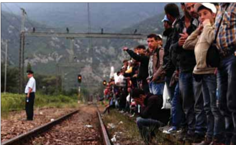
Kto by neobetoval niekoľko stovák dolárov na prevádzachov a nepodstúpil riziko i nebezpečenstvá cesty, na konci ktorej vám sľubujú modré z neba, dom, bezprácný príjem, povolené barbarky a potom aj možnosť príchodu ďalších rodinných príslušníkov, aby sa rodiny migrantov spojili...

„Je pravda, že väčšina moslimov je umiernená. Napriek tomu by sme