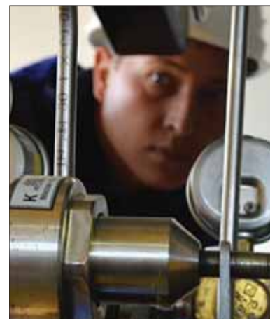
Od prvého mája sa zmenami Zákonníka práce má dosiahnuť zatraktívnenie viacerých profesií zvýšením zárobkov.

Príplatky za nočnú prácu sa zvýšia v dvoch etapách a budú závisieť