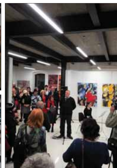
Umelecká beseda slovenská (1921) – najstarší spolok profesionálnych umelcov na Slovensku – sa až do 15. marca prezentuje v košických Kasárňach/ Kulturparku výstavným projektom Totum pro arte, ktorý odborná verejnosť i náročné košické publikum hodnotia mimoriadne priaznivo.

Chce predstaviť štýlové a výrazové znaky výpovede tvorby hlavných osobností a predstaviteľov jednotlivých výtvarných prúdov UBS tak, ako vznikali v posledných dvoch-troch rokoch, jasne deklarujúc úsilie načrieť do zložitej problematiky vývinu slovenskej výtvarnej tvorby. Súčasne sa usiluje ukázať paralelnosť nášho a európskeho výtvarného pohybu, kryštalizáciu jednotlivých tendencií a prúdov v slovenskom umeleckom prostredí sústredených na pôde UBS, ako aj vznik, rast a formovanie osobitých výtvarných prejavov slovenského umenia v celom spektre žánrov a technik.“