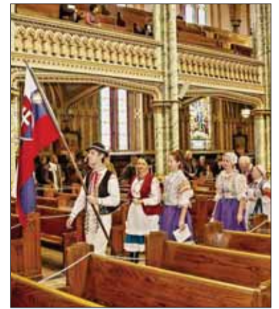
Národnú príslušnosť slovenských prisťahovalcov do Kanady, ktorí sem masovo prichádzali z hospodárskych i zo sociálnych pohnútok od roku 1873, v súčasnosti popri krojoch výrečne reprezentuje aj štátna symbolika.

Zabudnúť po toľkých rokoch jazyk, no, môže sa to stať. Spomínam si však z môjho povolania zdravotnej sestry, že ľudia vo vyššom veku sa vracajú k rodnému jazyku. Keď som mala možnosť mať pacienta Slováka alebo Slovenku, vždy som sa im prihovorela po slovensky alebo som ich volala menom, ktoré len pre nás Slovákov má význam. Keď to bol Ján, tak som ho volala Janičko,