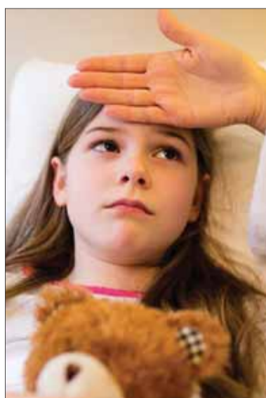
Takmer stotisíc ochorení na virózy horných dýchacích ciest a na chrípku zložilo do postele aj mnoho školákov a v minulých dňoch zatvorilo brány na vyše tristo školských zariadeniach.