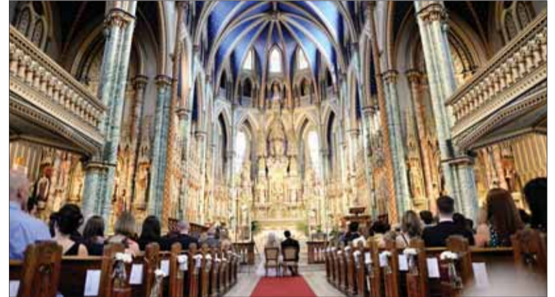
Kanadskí krajan, ktorí žijú v Ottawe a na okolí, sa celý rok tešia na svoj „víkend v krojoch“, keď zaplnia monumentálne chrámové priestory Katedrály Notre-Dame, aby si svoju pôvodnú vlasť pripomenuli aj v tradičných krojoch.

Sme tu už dlhšie rozdelení na niekoľko generácií. Sme tu tí, čo prišli pred rokom 1968, a tí, čo prišli v 1968 a potom je tu mladšia generácia, ktorá drží spolu, ďalej sú tu aj