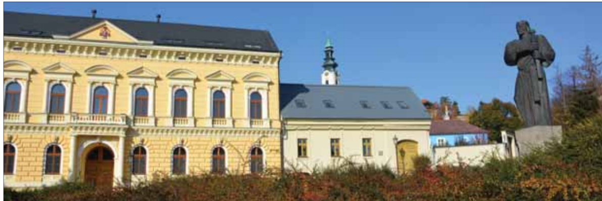
Slovenská republika nie je dlhoveký štát, ale dejiny a tradície, z ktorých vyrastá a na ktorých stavia, nás predurčujú nosiť hlavu hrdo vztýčenú a nehrbiť sa pred nijakou autoritou alebo ustupovať prikazníctvu, ktoré sa nám bridi.

Na titulnej strane tohto vydania Slovenských národných novín poukazujeme na závažnosť Parížskej výzvy európskych konzervatívcoov na ochranu jednej jedinej Európy ako symbolu určitých civilizačných hodnôt. V nasledujúcom texte z Výzvy vyberáme. „Domov je miestom, kde sú okolnosti, fakty i názory známe, domov je miestom, kde nás poznajú a rešpektujú, nech cestujeme kamkoľvek. Naším domovom je Európa. Európa v celej svojej bohatosti a veľkoleposti. Je však ohrozená falošným chápaním seba samej, svojich tradičných hodnôt,“ píše sa v úvodnej časti Výzvy.