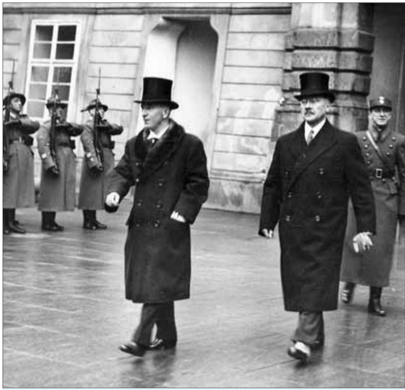
Milan HODŽA (vpravo) ako politický pragmatik prikyvoval centralistickým tendenciám Prahy, aj preto sa v roku 1935 stal ministerským predsedom ČSR. Na snímke s prezidentom E. Benešom pri prehliadke čestnej stráže na Hradčanoch.

„Beda národu, ktorý si nectí pamiatku svojich veľkých mužov. Národ taký, opovrhujúc sám sebou, nezasluhuje, aby bol vážený od iných. A akože ctia národy pamiatku svojich vynikajúcich osobností? Staváním pomníkov a vydávaním životopisov živia spomienku na nich...“ Tieto večne platné slová vyriekol predseda Slovenskej národnej strany Michal Mudroň pri odhalení pamätnej tabule na rodnom dome Michala Miloslava Hodžu v septembri 1911. Aby sme naplnili Mudroňov odkaz, aspoň v krátkosti si spomeňme na ďalšieho nositeľa priezviska Hodža – na politika, štátnika, publicistu a národného buditeľa Milana HODŽU, keďže práve uplynulo stoštyridsať rokov od jeho narodenia.