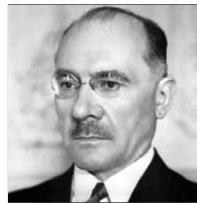
Milan HODŽA aj keď podporoval oficiálnu doktrínu predvojnového štátu a netlieskal autonomistickým snahám na Slovensku, odkazu hodžovského rodu sa nechcel spreneveriť a hľadal pre Slovensko dôstojné miesto v Európe.

Keď vypukla druhá svetová vojna, pokúsil sa opäť politicky