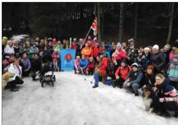
Na rozlúčku so zimou sa matičiari v Istebnom rozhodli pripraviť 18. ročník zimného Prechodu istebnianskou dolinou. Aj keď snehu už bolo pomenej, o to viac bolo radosť medzi jeho účastníkmi.