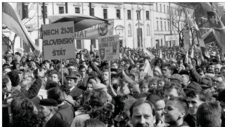
Atmosféra víťazstva pri vzniku Slovenskej republiky na Námestí SNP v Bratislave. Dnes tam rozhodujú celkom iné emócie o budúcom charaktere nášho štátu...

Veľmi intenzívne a emotívne. Boli veľmi dôležité na formovanie verejnej mienky. Tá postupne smerovala k tomu, že Slovensko musí vytvoriť samostatný štát, pretože sa české politické subjekty rôznymi spôsobmi – cez chytráctvo, zastrasovanie a vyhrážanie, usilovali zachovať čo najvyššie kompetencie federácie. Na začiatku bolo skoro zúfalstvo, že sa nám nepodarí prebudiť dostatočne slovenský národ, aby žiadal svoj samostatný štát, pretože čas, ktorý na to bol možný a vyhradený, veľmi rýchlo plynul. Medzinárodná situácia bola priaznivá. Svet bol uzročený s tým, že socialis-