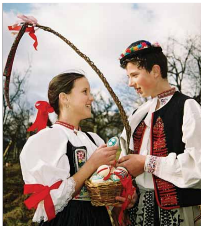
Na vidieku ešte možno zažiť nefalšovanú šibačku – dokonca i v krojoch, čo je aj zásluha mimoriadne úspešného televízneho formátu Zem spieva.

Ostatne, veľkonočná šibačka je jedným z tradičných zvykov, ktoré prežili pomerne najdlhšie aj v modifikovaných, sídliskovo-socialistických časoch. Stačí si prečítať skvostné spomienky Jula Satinského, ako bohemska umelecká chasa v Bratislave povýšila šibačku na skutočne úžasný happening. Na druhej strane, pokiaľ po novembri 1989 sa naše tradície začali prudko strácať v prospech Valentínov, tekvicovo-lebkových halloweenov či írskych svätých Patrickov, zdá sa, že Veľká noc už pokukuje spoza rohu. Mimoriadne úspešná šou Zem spieva