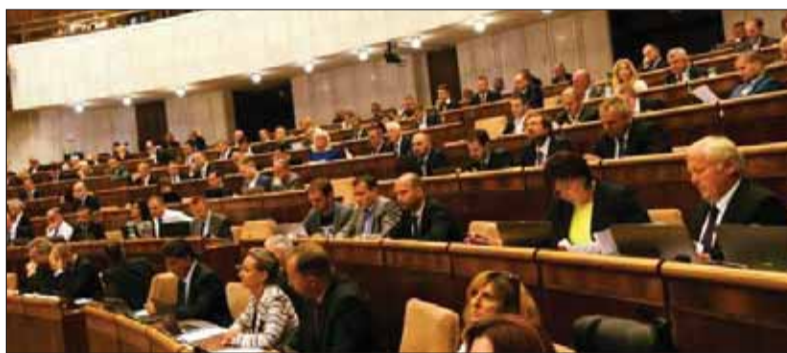
V čase politickej krízy a výmeny slovenskej vlády bola koalícia v parlamente na prekvapenie jednotná. Riadne zvolaná pracovná schôdza trvala neuvěřiteľne krátko.

Slovenskej národnej strane ako spolupredkladateľovi (spolu s Mostom – Híd) prešiel v parlamente aj ďalší návrh. Do druhého čítania sa dostala aj právna norma, ktorá upresňuje kompetencie príslušníkov Policajného zboru, zamestnancov obecných a mestských polícií a iných príslušných orgánov pri preverovaní, či maloletá alebo mladistvá osoba požíla alkohol alebo návykovú látku a či pritom došlo k porušeniu zákona.