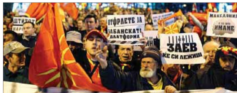
Macedónsko sa pre vidinu členstva v NATO rozhoduje vzdať sa svojho názvu. Macedónci túto vládnú kalkuláciu kabinetu premiéra Zorana Zaeva zatiaľ odmietajú.

Macedónsko sa pod vedením premiéra Zorana Zaeva vydalo cestou, z ktorej už nebude návratu. Macedónsky príklad sa stáva precedensom na riešenie štátoprávných otázok malých národov. Tento príklad – podobne ako svojho času agresia proti Juhoslávii – rozkolíše medzinárodné právo.