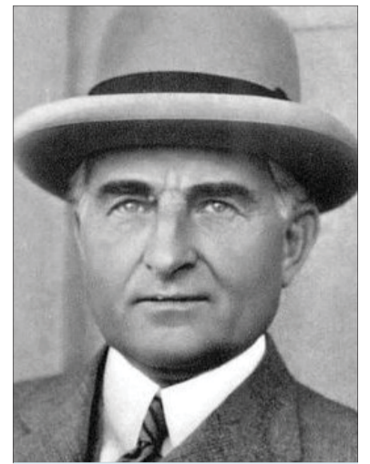
Básnik Ivan KRASKO v časech, keď pracoval v českých fabrikách.