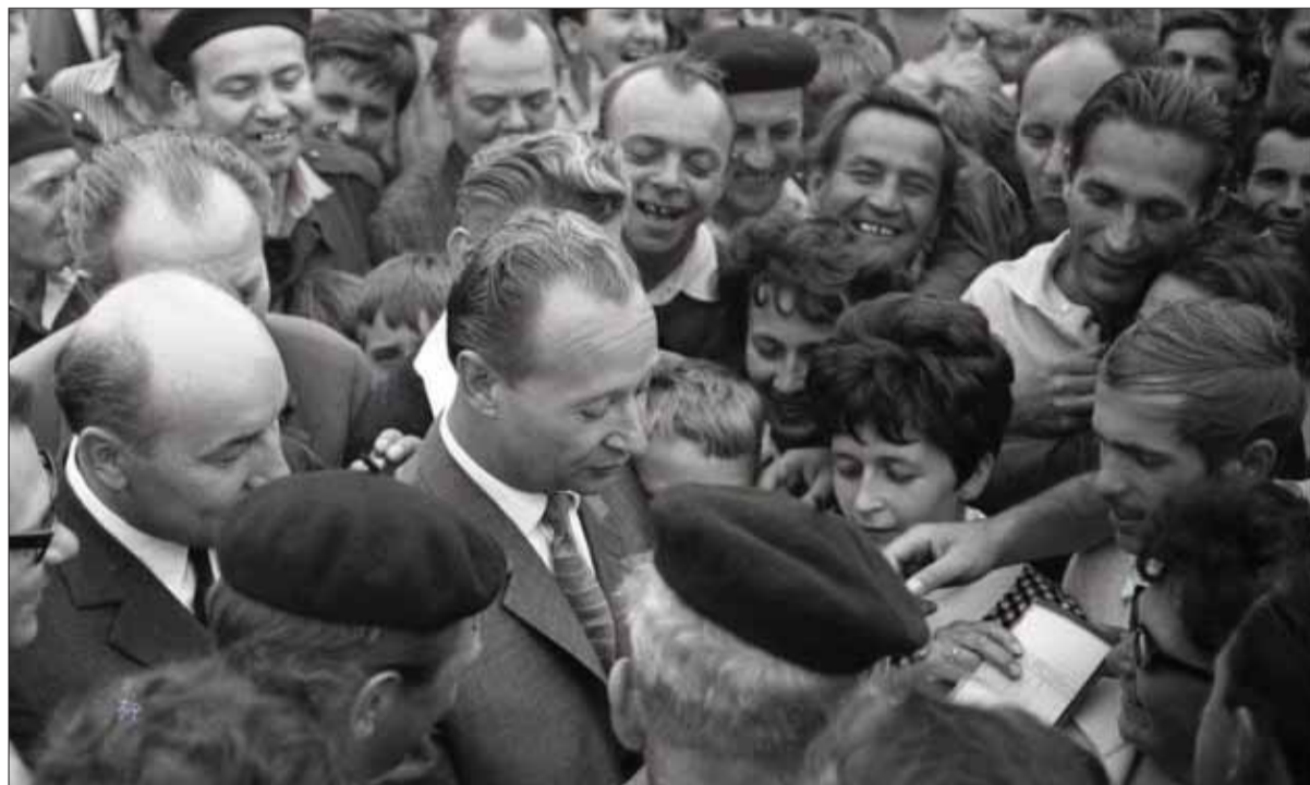
Politický odmäk začiatkom šesťdesiatych rokov sa vyznačoval úprimnou dôverou nás k tým, čo stáli na ich čele. Symbolom politiky s ľudskou tvárou sa stal Alexander DUBČEK, na obrázku uprostred davu priaznivcov na zhromaždení v Bratislave.

Tento rok si pripomíname polstoročie od veľkého pokusu slobodomyselných občanov Slovenska poľudštiť socialistický spoločenský poriadok v Česko-Slovensku. Nebolo to jednoduché, no ani bez nebezpečenstiev. Chcelo to veľa statočnosti, odvahy i taktiky, lebo tí prví, najmä tí prví, museli rátať s tvrdým revanšom straníckych aparátov a polície. O to viac si to zasluhuje našu pozornosť. V čase, keď odvaha zlacnela a rozum zdrážel.