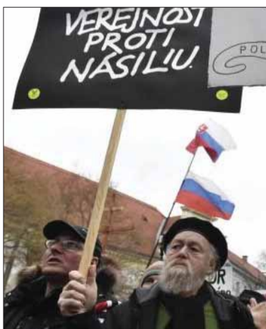
Demonstranti akoby zabudli na štvrtstoročie demokratických pomerov na Slovensku.

ak politická moc neporušuje ústavu. Pokus o deštrukciu fungovania štátu, pokus o zmenu pravidiel (medzi dvoma