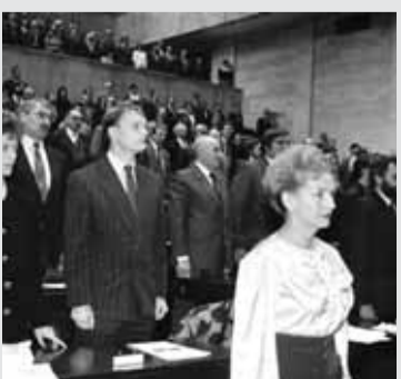
Ďalekosiahly okamih 25. novembra 1992 vo Federálnom zhromaždení ČSFR.