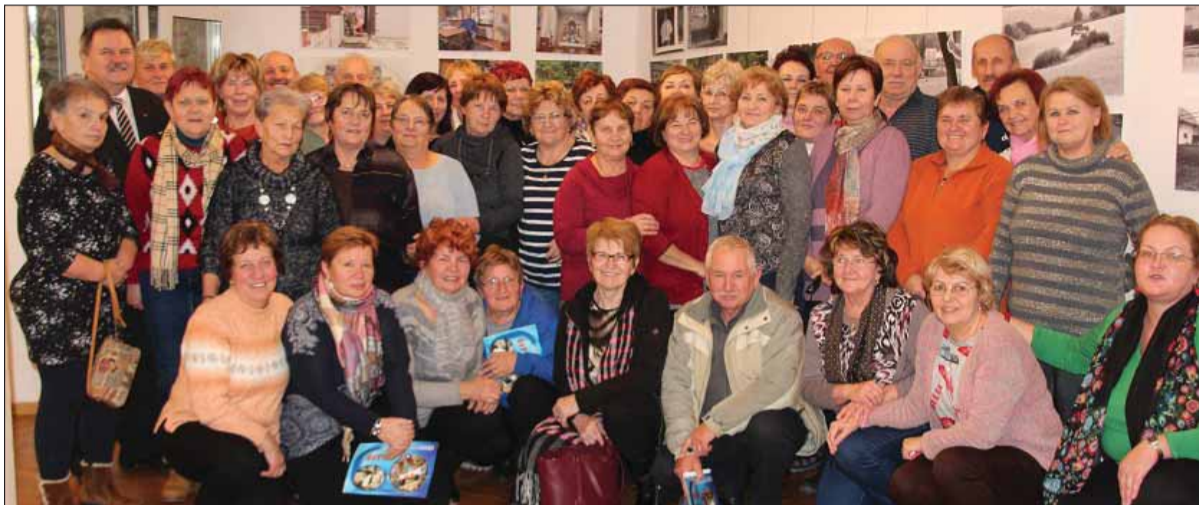
Významné výročie samostatnej Slovenskej republiky si matičari z Trstenej pripomenuli spoločne s funkcionármi a s členmi Spolku Slovákov v Poľsku u nášho generálneho konzula v Krakove za účasti predstaviteľov Malopoľského vojvodstva.

Sme krajina s bohatou históriou, ale svoj vlastný štát nemáme dlho. Za štvrtstoročie samostatnej štátnosti však Slovensko vyspelo ako sebavedomý, suverénny a medzinárodne rešpektovaný štát i partner.