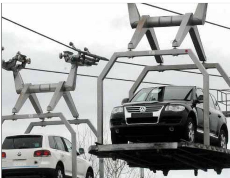
Slovenské hospodárstvo neustále napreduje a ekonomickí prognostici a experti mu predpovedajú rast aj v ďalšom období, keď má ďalej rásť hrubá domáca produkcia, mzdy aj spotreba domácností. Na tomto pozitívnom trende má výrazný vplyv produkcia automobilov a rast zamestnanosti, keď trebárs len bratislavský Volkswagen v tomto roku do nových výrobných kapacít opäť prijal pol tisícky pracovníkov.

Vzráha sa náš export. Došlo k nábehu novej výroby vo Volkswagen, v tomto roku bude uvedená do prevádzky britská automobilka Jaguar Land Rover a pripravuje sa dlho očakávaná výstavba bratislavského obchvatu. Domácnostiam sa zvýšili príjmy a mzdy ešte viac porastú, čo ovplyvní nielen domácu spotrebu, ale zvýši aj chuť viac peňazí si požičiavať na investovanie