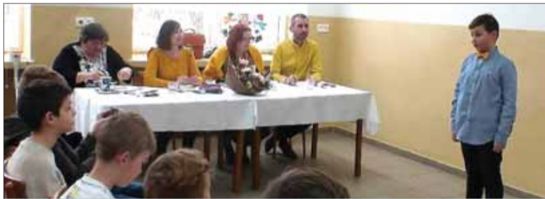
Vďaka nitrianskym vysokoškolským pedagógom aj členom Jazykovedného odboru MS má prednes umeleckých textov v Šintave výbornú úroveň.