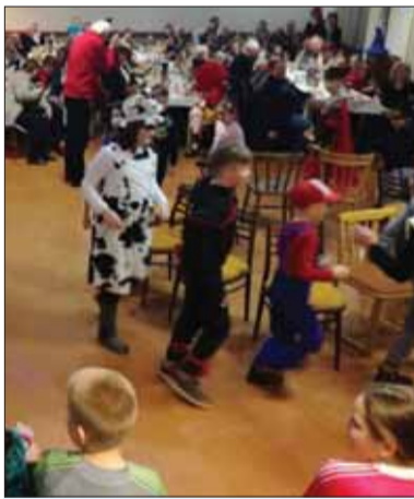
Na záver fašiangov si Dubinčania pripravili zabíjačkové hody, karnevalový sprievod aj maskárnu zábavu, ktorými sa rozlúčili s časom zábav a veselosti a pripravili na pôstné obdobie do Veľkonočných sviatkov.