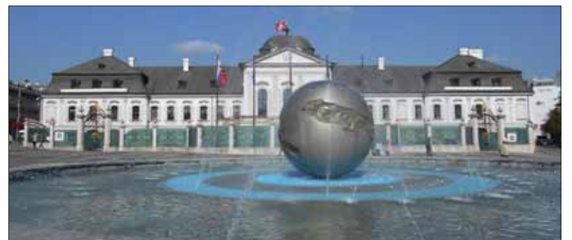
Kto zasadne v budúcom roku do kresla v Prezidentskom paláci v Bratislave?

Spoločný kandidát koalície zostáva nateraz iba želaním. Politické orgány koalície partnera Mosta – Híd už oznámili, že prídu so „svojím človekom“. Rozhodlo o tom ostatné republikové predsedníctvo strany.