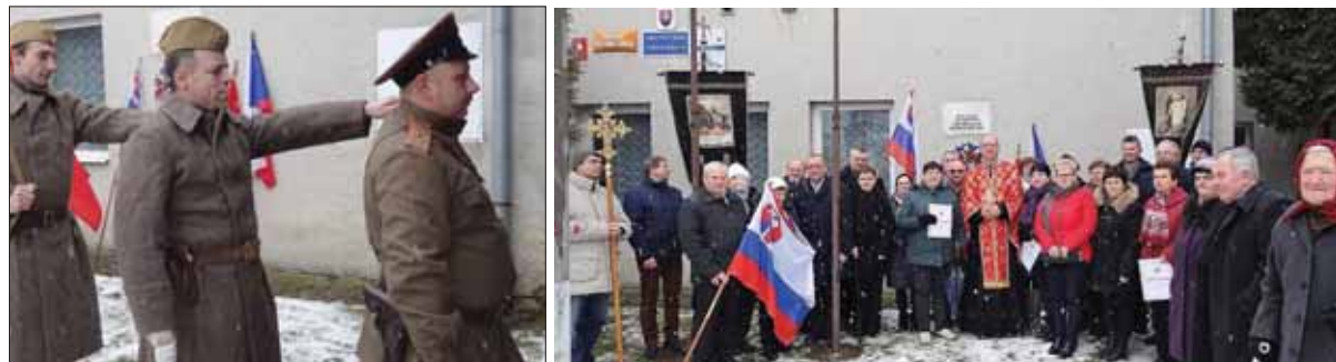
Vo Vyšnej Olšave si v minulých dňoch pripomínali výročie oslobodenia obce Červenou armádou, kde počas slávnostného aktu účinkovali popri farníchoch aj mladí matičiari v dobových rovnošatách.

Samospráva vo Vyšnej Olšave v okrese Stropkov, členovia miestnej ZO, matičiari z MO MS Hencovce a početní občania obce si v nedeľu 21. januára predpoludním po cirkevnom obrade pripomenuli pri pamätnej tabuli 73. výročie oslobodenia obce Červenou armádou.