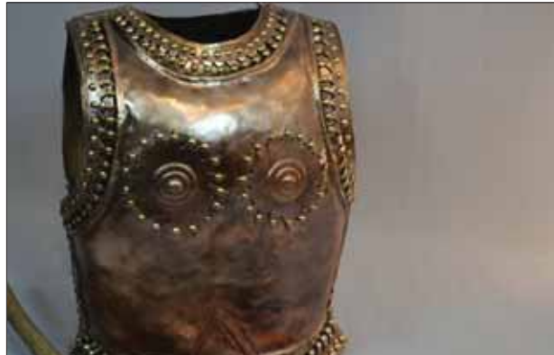
Rekonštrukcia bronzového panciera z Čaky, ktorý objavili archeológovia v tamojšej mohyle roku 1952.