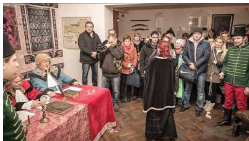
Matiční divadelníci v Liptovskom Mikuláši už dlhý čas na seba upozorňujú zaujímavými predstaveniami a aktivitami. Najnovšie účinkovaním v Múzeu Janka Kráľa, kde inscenujú zaujímavé epizódy z dejín mesta.

Matiční divadelníci združení v Matičnej divadelnej ochotníckej scéne (MADOS) v Liptovskom Mikuláši každoročne pravidelne pripravujú dramatické pásma alebo podujatia, ktoré sa tematicky viažu na históriu, pričom pútavou formou propagujú osobnosti a udalosti spojené s regiónom Liptova, ale i so slovenskými dejinami.