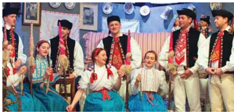
Batizovčania sú hrdí na svoju Kúdelnú izbu, ktorú pripravujú každoročne, aby sprítomnili zvyky predkov.

Ak chceme rásť, musíme mať korene a tie treba vyživovať. Sme tu preto, aby sme slúžili, rozdávali radosť, lásku... Kúdelnú izbu pripravujeme v tomto duchu, ved' počas roka sa toho v obci veľa udeje, a tak sa na javisku počas dvoch hodín koncentruje a premieta obraz života našej dediny v jednotlivých ročných obdobiach a aj ľudských príbehov. Úspechom je, že sa do prípravy programu hlásia mladí ľudia aj dorastajúca mládež vo veku dvanásť až pätnásť rokov. Dievčatá sa učia priasť a všetci pritom spievame a tancujeme. Všimli si nás aj naše médiá – na Dvojke RTVS budeme v relácii Kapura 3. februára a Rádio Regina