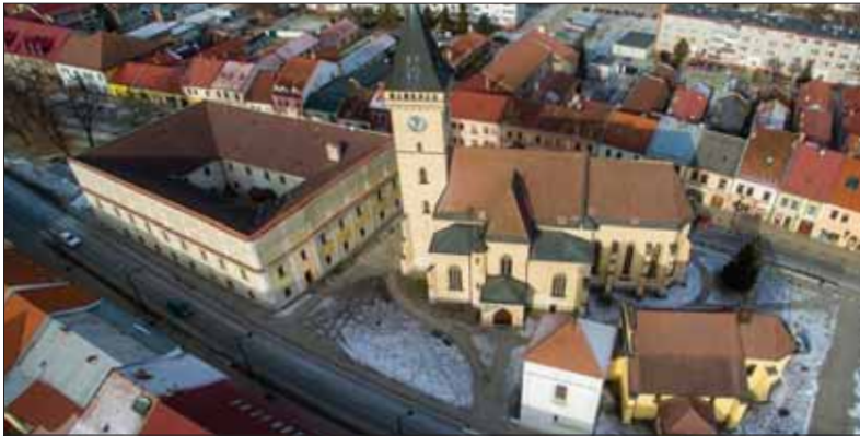
Posledné decénium života prežil Bohuslav NOSÁK-NEZABUDOV v Sabinove, kde sa venoval najmä prekladom zo zahraničnej literatúry.

telstve Tatran vyšla tristostranová zbierka Nosákovej poézie Spevy tatranské.