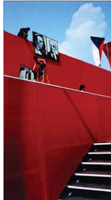
Z takýchto rečníckych tribún zaznievalo vždy najviac klamstiev a falzifikácií o dejinách a mieste Slovenska v nich.