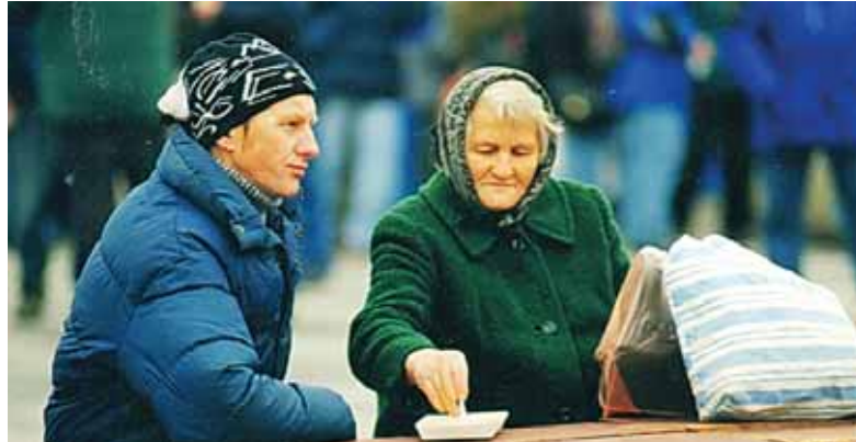
Situácia slovenských penzistov nie je dobrá. V ostatných desaťročiach sa v spoločnosti sformovala mienka, že na starcov mladí doplácajú; akoby sa zabudlo, koľko zle ohodnotenej práce pre štát vykonali počas aktívnej etapy života.

• V súčasnosti aj ľudia plní energie v produktívnom veku majú často problém „plávať“, udržať sa na hladine. O čo horšie to musia mať dôchodcovia. V akej kondícii (mentálnej, zdravotnej a pod.) sú stárki u nás na Slovensku?