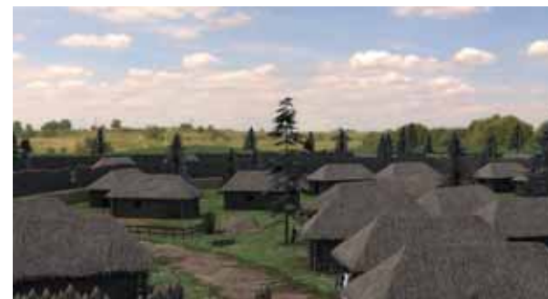
Model osady z ranej bronzovej doby, v akej mohol žiť aj hrdina tohto be- trizovaného príbehu.