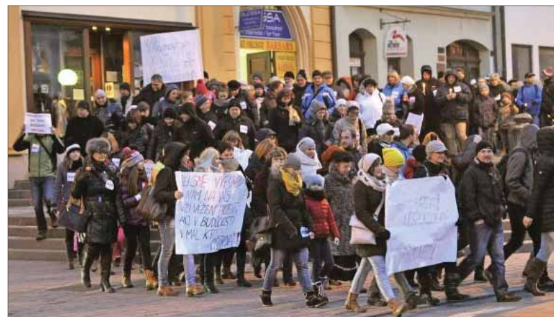
Cestu slovenského zdravotníctva po desiatkach proklamovaných aj uskutočňovaných reforiem, žiaľ, dodnes sprevádzajú aj takéto obrázky, keď zdravotné sestry demonštrujú svoju nespokojnosť priamo v uliciach miest.

Ak by slovenské zdravotníctvo malo menej problémov, ako ich práve má, naši zdravotníci by dokázali ročne zabrániť vyše jedenástim tisícom úmrtí. Priemer Európskej únie je nepomerne lepší, ako je momentálne na Slovensku. V EÚ vďaka úrovni súčasnej medicíny dokážu zachrániť až o tretinu viac ľudí ako na Slovensku. Svedčí to nielen o odbornej pripravenosti, ale najmä o úrovni materiálnej a prístrojovej bázy a o logistickom zázemí vrátane disponovanosti a motivácie zdravotníckeho personálu.