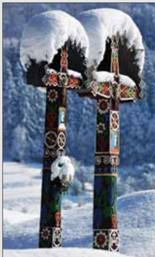
Vyrezávané detvianske kríže sa dostali do Reprezentatívneho zoznamu nehmotného dedičstva Slovenska.