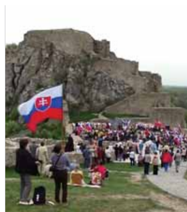
Devínske hradné bralo bolo už po siedmy raz dejiskom Národnej slávnosti, ktorú tentoraz organizačne pripravila Mladá Matica, ale médiá o nej neinformovali.

v Banskej Bystrici, z Evanjelického lýcea v Bratislave a Evanjelickej spojenej školy v Martine. Potešiteľná bola aj účasť ich