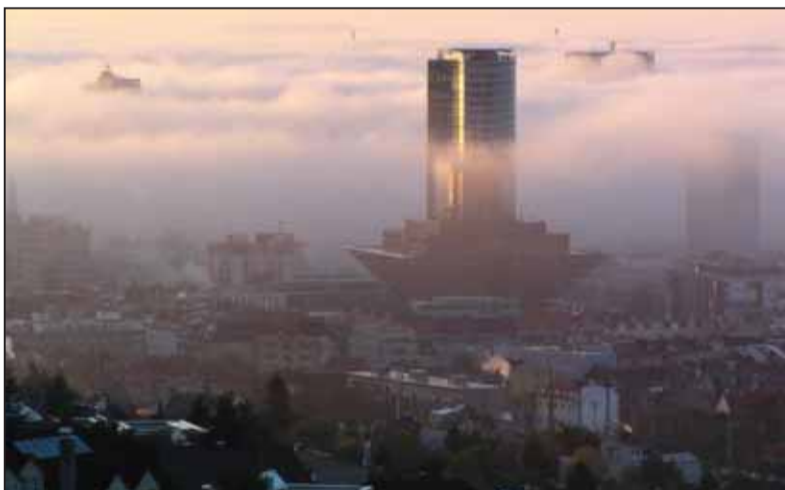
Nejasno, hmlisto, zamračené – tak akosi by znela aktuálna predpoveď „počasí“ vo verejnoprávnej RTVS, kde si skupinka redaktorov spravodajstva osobuje rozhodovať o tom, čo má a čo nemá robiť jej vedenie, aby sa toto verejnoprávne médium priblížilo svojmu zákonnému poslaniu.

Formou otvorených listov, výziev a iniciatív sa manipulátori pravdy usilujú vybičovať emócie v prostredí laickej verejnosti. Zneužívajú pritom všetky zásady nestrannosti a pravdivosti informácií, ktoré jej podsúvajú. K ich snahám sa však nepridali mnohí významní novinári, ktorých skutočne možno považovať za tých,