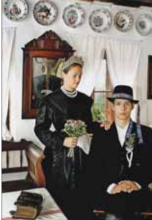
Mladí krajanovia v Maďarsku.

Že presídľovanie bolo v priamej súvislosti s udalosťami počas druhej svetovej vojny, bolo nad slnko jasnejšie. Cieľom československo-maďarskej výmeny obyvateľstva (presídľovania) bolo zo strany ČR, ako to