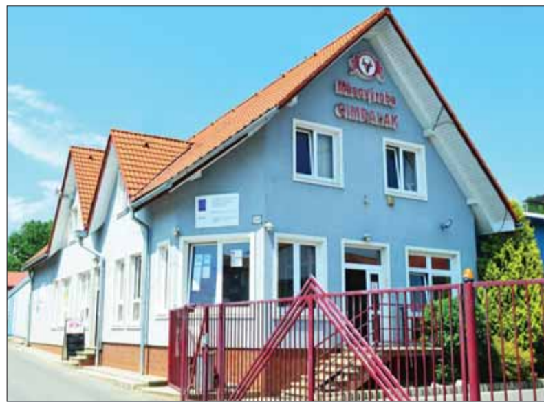
Bardejovské sídlo firmy Cimbalák, ktorá zásobuje slovenský trh mäsom a mäsovyimi výrobkami už dvadsaťpäť rokov.

Dá sa o tom písať celé stránky, ale aj zhrnúť jednou vetou. Nemáme družstvá. Kde-tu ešte poľnohospodárske podniky existujú, ale na severovýchode Slovenska je ich ako šafranu. Aj pre zánik mnohých niekdajších roľníckych družstiev Slovensko už niekoľko rokov nie je sebestačnou krajinou v produkcii potravín. V minulosti družstvá produkovali nielen základné, vstupné suroviny, na čo nadväzoval potravinársky priemysel, ale úzko súviseli, ba priam podporovali strojársky, textilný aj obuvnícky priemysel. Ľuďom dávali prácu aj zárobok. Slováci tak mohli konzumovať viac slovenských produktov a podporovať náš trh. Dnes je situácia iná. Výraznú vnútroštátnu podporu získavajú a majú štáty, ktoré na územie Slovenskej republiky dovážajú mäso alebo výrobky z neho a slovenský výrobca by aj pri existujúcich družstvách a bitúnkoch nevedel zamestnancov primerane finančne odhodnotiť – zaplatiť. V súčasnosti je to tak, že nejednotná legislatíva určuje cenovú politiku. Slovenský výrobca sa predáva dovtedy, kým nepride k cene (zvlášť v našom regióne). A keďže u nás je nedostatok vstupných