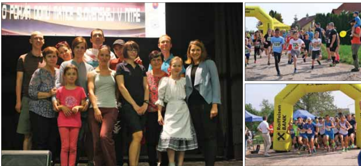
Matičné behy majú v meste pod Zborom dlhoročnú tradíciu. Matičiari sa k nim po dlhšej prestávke opäť vracajú, ale tentoraz ich pripravujú ako behy v prírode k Párovským hájom. Na snímkach je štart najmladšej a hlavnej kategórie a spoločná snímka najlepších tohtoročných bežcov.