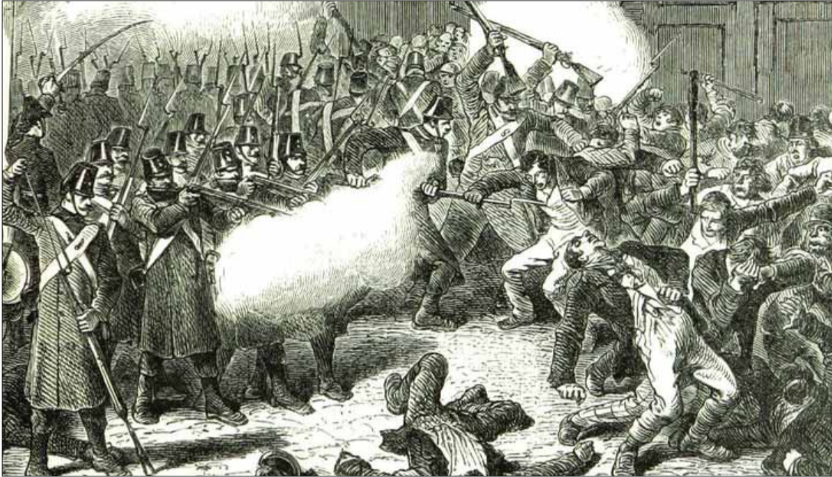
Revolučný rok 1848 hlboko zasiahol celú Európu; monarchistické režimy krvavo potlačali demonstrácie a vzbury v uliciach veľkých miest, v ktorých sa obyvatelia dožadovali demokratickejších pomerov a zbavovali pút feudalizmu.

Do Bratislavy sa revolučná vlna prihnala zo západu, kde 24. februára 1848 francúzski republikáni a ľud z predmestí zaplavili ulice Paríža, zrušili monarchistický systém a vyhlásili republiku. Úspech revolúcie vo Francúzsku mal na ďalší priebeh európskej jari rozhodujúci vplyv. Zvesti o udalostiach v Paríži po novej telegrafickej linke dorazili do Bratislavy už na konci februára. Pod vplyvom vzrušujúcich správ sa radikaloval aj uhorský snem, ktorý v budove dnešnej Univerzity knižnicou zasadal od novembra 1847. Iniciatívy sa ujal Ľudovít Košút a 3. marca vystúpil s prísom adresovaným panovníkovi. Žiadal zrušenie poddanstva, zrovnoprávnenie všetkých obyvateľov v právach i povinnostiach, vytvorenie samostatnej uhorskej vlády a zastúpenie ľudu na vláde a správe krajiny. Dolná komora Košútovu iniciatívu jednohlasne prijala. V hornej komore sa