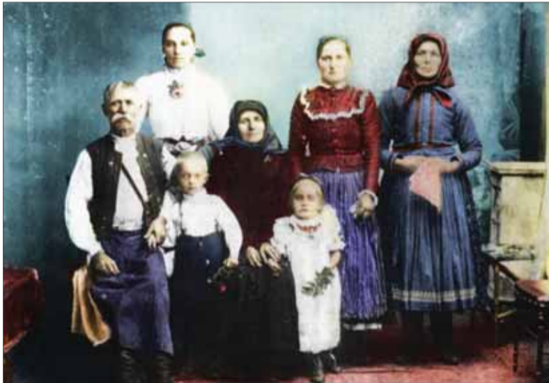
Dobová fotografia presídlených Slovákov z maďarských oblastí obývaných slovenským obyvateľstvom.

ja vidím, zaplniť opustené a prázdne domovy, ktoré ostali po presídlení či vysídlení Maďaroch a Nemcoch. Kde konkrétne kto dostane obydlie, to dopredu presídlenci vedeli len veľmi orientačne. Riešila to presídľovacia komisia neraz až po prekročení hraníc podľa toho, ako a kde sa ubytovacie kapacity uvoľnili. Určite však nikto z nich neočakával (ani im to nikto nesľuboval), že sa im tu budú stavať nové príbytky. Krajanovia v súvislosti s výmenou dostali šancu presídliť sa do starej vlasti. Uskutočnila sa agitácia – informovanie o podmienkach a možnosti sťahovania sa a o situácii na Slovensku. Nikoho na odchod nenútili a ani žiadne hory-doly na Slovensku sa nesľubovali. Na každom jednotlivci bolo, či sa rozhodne ponuku prijať, alebo nie.