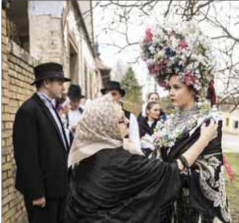
Svadobný obrad Slovákov žijúcich v srbskom Banáte.