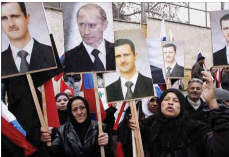
Ruský vojenský vplyv v Sýrii je evidentný. Mnohí Sýrčania ho vítajú a považujú Rusov za jediných, ktorí dokážu poraziť terorizmus.

V tejto situácii je zaujímavé pozrieť sa na pozície susedného Rakúska s jeho novou vládou, v ktorej hlavné liace zahraničnej politiky drží kancelár Kurz. Ministerka zahraničných vecí Kneisslová, považovaná len za vykonávateľku direktív, sa stala prvou členkou vlády členského štátu Európskej únie, ktorá cestovala na rozhovory do Moskvy. A to ako predstaviteľka významného štátu