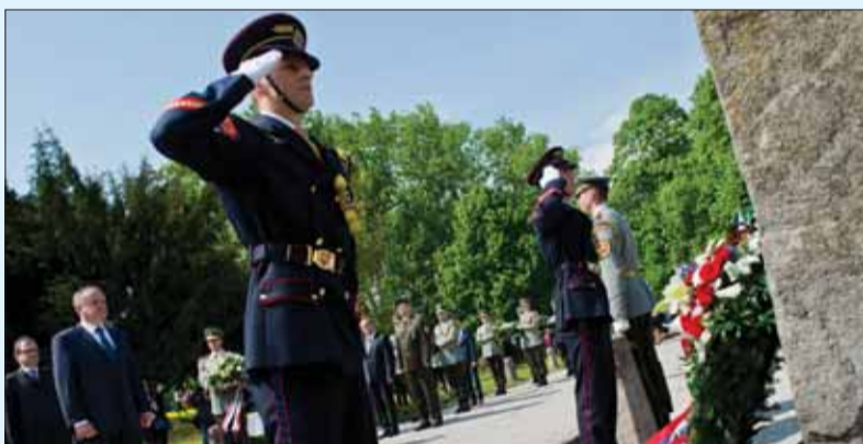
V Ivanke pri Dunaji sa každoročne na mieste tragickej smrti generála M. R. Štefánika kladú vence na jeho počesť.

My účastníci 28. ročníka pietnej spomienky na tragickú smrť gen. Dr. M. R. Štefánika a jeho talianskeho sprievodu zo 4. mája 1919 pri príležitosti stého výročia ukončenia prvej svetovej vojny vzdávame osobitnú úctu a vďaka všetkým Slovákom a Slovanom, ktorí bojovali alebo položili životy v rokoch 1914 – 1918 za našu slobodu. Svojimi obeťami vniesli do európskeho a sve-