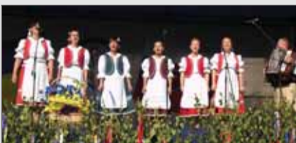
Jeden z folklórnych krajských súborov účinkujúcich na Dedovizni v Slovenskom Novom Meste.

Hudobné a tanečné vystúpenia, folklórne ukážky, predstavenie zručností majstrov ľudových remesiel, no aj tradičné jedlá. To by ešte taký zážrak nebol, hoci príťažlivý program vždy poteší. Obec Slovenské Nové Mesto však pri tejto príležitosti už tradične organizuje aj festival Slovákov žijúcich