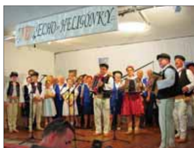
Záverečná „ďakovačka“ účinkujúcich

ale aj návštevníkov z celých Kysúc doslova dojala vynikajúca skupina