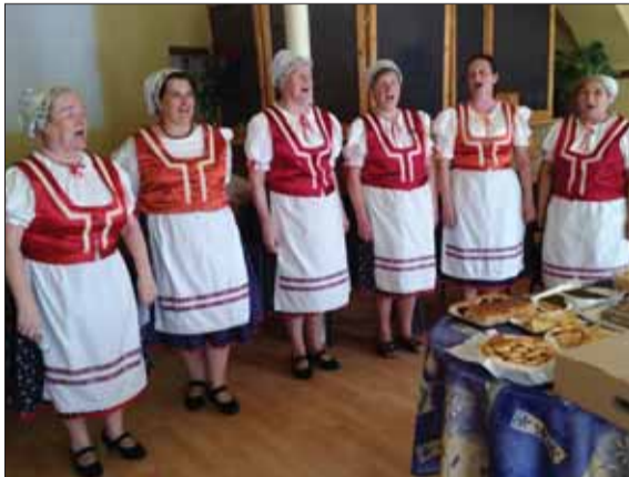
Do slávnostnej atmosféry schôdze MO MS v Moldave nad Bodvou k sto päťdesiatému piatému výročiu vzniku maticnej organizácie v meste prispeli aj členky folklórnej skupiny Živena.

Na začiatku zneli detské hlásky v ľudových piesňach, ktoré zaspievali členovia detskej folklórnej skupiny Pantilka, a žiakov ZŠ na Ulici Československej armády v Moldave nad Bodvou,