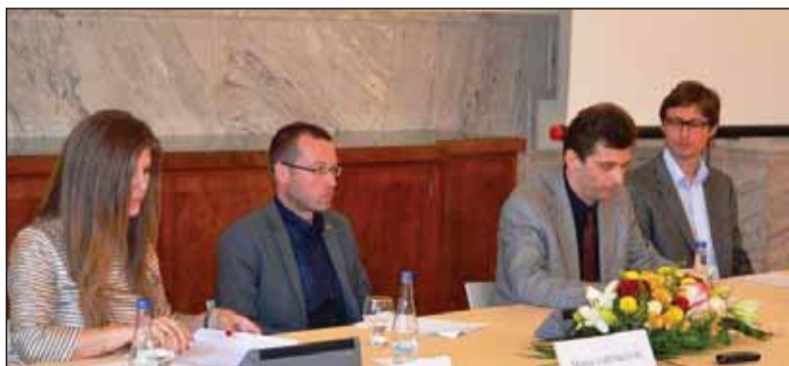
Účastníci druhého diskusného panelu konferencie sa zamerali na novšie dejiny vzťahov od druhej svetovej vojny po súčasnosť.

V odbornej časti konferencie vystúpili v dvoch blokoch veľvyslanectvami oslovení historici zo Slovenska, z Čiech i zo Srbska, ktorí sa venujú skúmaniu dejín vzájomných vzťahov. Prvý panel moderoval dlhoročný žurnalista a v súčasnosti riaditeľ belehradskej kancelárie Nadácie