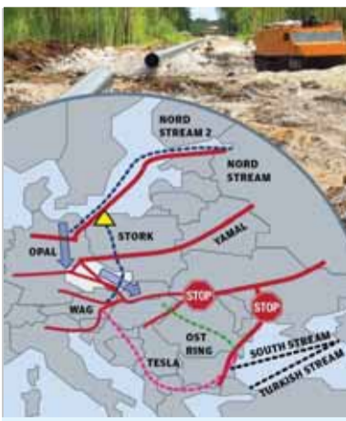
Trasy ruských plynovodov a ropovodov smerujúcich do Európy a na Blízky východ

je známe, či zmierlivý tón dvoch vrcholných politikov tejto časti sveta na stretnutí v Soči čosi so sankciami napokon urobí. Neprosievajú ani jednej zo zúčastnených strán. V otázke dodávok plynu potrebuje