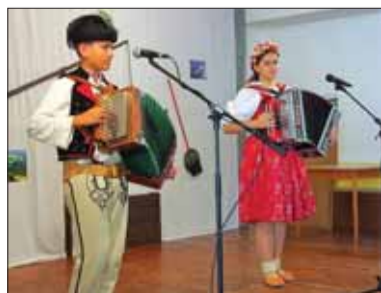
Mladí preberajú hudobnú štafetu.