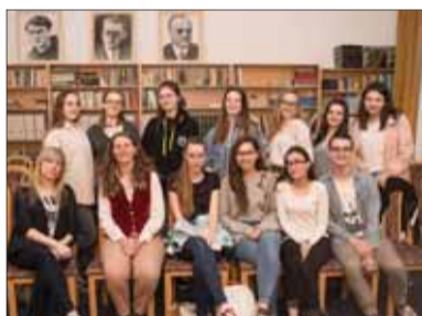
Besedujúci žilinskí stredoškôláci

ako prvému mestu v Európe udelil erbovú listinu.