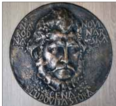
Medaila Národná cena L. Štúra