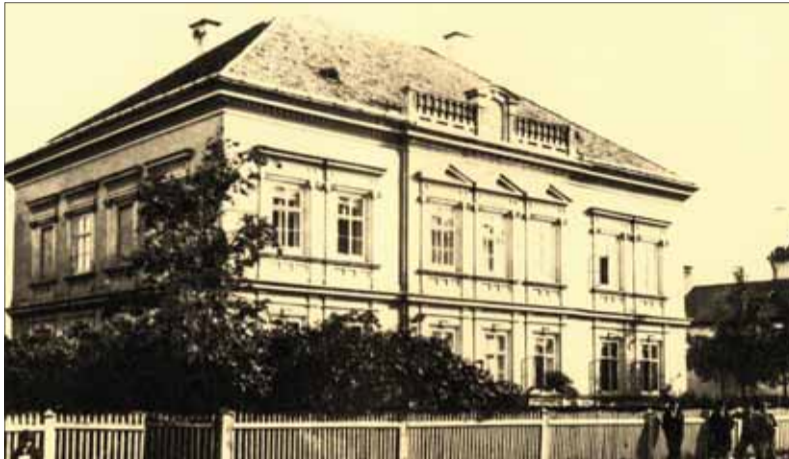
Mudroňovský dom v Martine bol centrom vlasteneckých iniciatív.