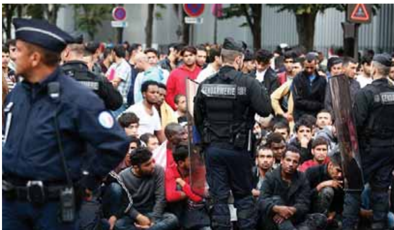
Francúzi si nevedia rady s masou migrantov; neutržateľnú situáciu rieši jedna aj druhá strana násilím...

Francúzsky prezident Emmanuel Macron nedávno vo svojom vystúpení v Európskom parlamente hovoril o svojej predstave budúcnosti Európskej únie. Podstatou jeho vystúpenia bolo odstránenie suverénnych štátov v Európe a jej zaplavenie miliónmi ľuďmi z Afriky, ktorú on pravdepodobne aj vzhľadom na koloniálnu minulosť Francúzska považuje za najbližšiu časť sveta, s ktorou sa má Európa doslova spájať. Politik, ktorý len pred niekoľkými dňami v spoločnosti s ďalšími dvoma štátmi bezdôvodne a bez mihnutia oka agresívne opätovne zaútočil na suverénny štát Sýriu a hrubo porušil normy medzinárodného práva,