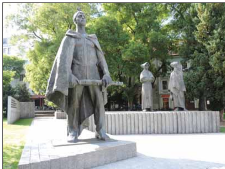
Pôsobivá symbolika protifašistického odboja na Námestí SNP v Bratislave

k jubilejnému výročiu Slovenského národného povstania a získava ocenenie za súbor šiestich plakiet. Práve tu vzniká ten nie často badateľný súvis, že obraz a odkaz SNP možno vyjadríť aj ako skutočné výtvarné dielo, bez tematického nánosu, ako vzácnu autentickú národnú spomienku.