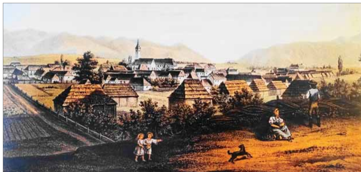
Martin na prelome 19. a 20. storočia bol síce centrom národného života, ale stále pripomínal „metropolu pod slamou“.