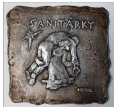
Medailóny v Kolumbáriu na Dukle

na piedestáli architektúry pamätníka vytvorenej Josefom Grusom (1949). Možno síce predpokladať opatrné príčiny českých a slovenských vojensko-bezpečnostných zložiek proti anti-sovietskej pomníkovej „ikonoklazme“ v Ukrajine a Poľsku, lenže u nás nemožno tolerovať nezákonnosť a ani defetizmus a devalvovanie antifasistického odkazu dejín.