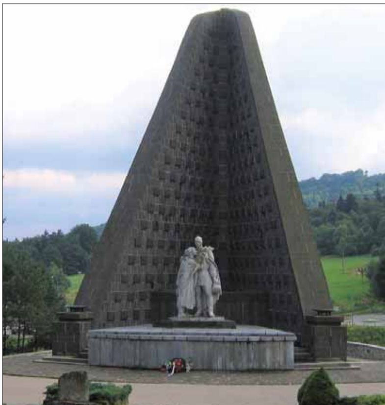
Dukliansky memoriálny areál s plastikou Žalujem