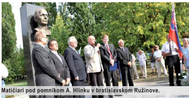
Matičiarci pod pomníkom A. Hlinku v bratislavskom Ružinove.

bol Hlinkov portrét na tisícikorunovej bankovke doslova červeným súknom.