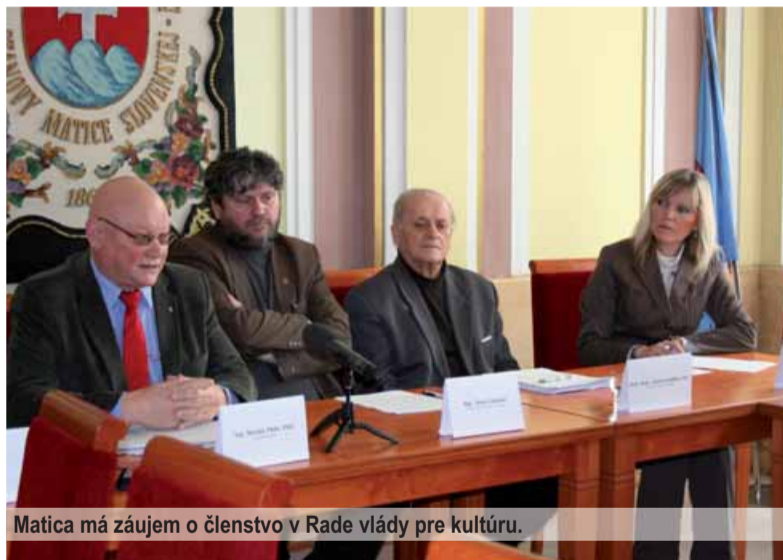
Matica má záujem o členstvo v Rade vlády pre kultúru.