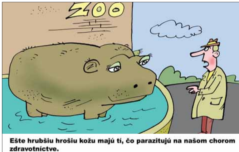
Ďalšie hrubšiu hrošiu kožu majú tí, čo parazitujú na našom chorom zdravotníctve.

Ak má liek vyrobený v Bratislave alebo v Hlohovci pri expedícii na východ republiky prejsť reťazcom niekoľkých distribučných spoločností, z ktorých každá potrebuje generovať zisk v podobe marže, je pochopiteľné, že rozpočet poisťovní vykazuje – a aj v budúcnosti musí za daných podmienok vykazovať – záporné saldo. Na nedostatku príjmov štátu, ktoré by mohli pokrývať výdavky na zdravotníctvo, sa podpisuje aj marketingová politika týchto spoločností – rôznymi