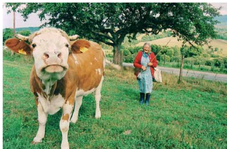
Ktorým dôchodcom sa dnes žije ľahšie - mestským alebo na dedinách?

Novela zákona o sociálnom poistení prináša zásadné zmeny v druhom dôchodkovom pilieri, ktorý spravujú dôchodkové správcovské spoločnosti (DSS). Medzi ne patrí sprísnenie podmienok nároku na priznanie predčasného starobného dôchodku, dobrovoľný vstup prvopoistencov, otvorenie druhého piliera na päť mesiacov a zmena pomeru odvodov do prvého a druhého piliera z 9:9 na 14:4 percent.