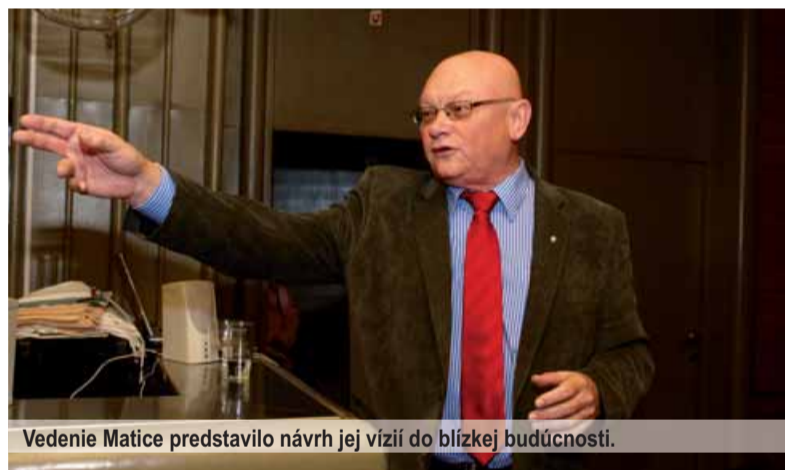
Vedenie Matice predstavilo návrh jej vízií do blízkej budúcnosti.