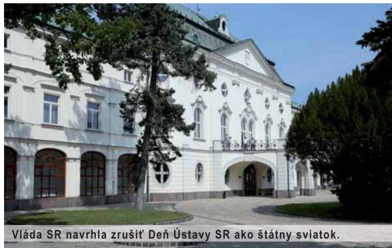
Vláda SR navrhla zrušiť Deň Ústavy SR ako štátny sviatok.

ústave používať ako fakt osobitne v matičnom prostredí priamo späť so štátoprávnym usporiadaním Slovenska prinajmenšom od Memoranda slovenského národa prijatého v Martine v roku 1861 a priamo späť so vznikom SR a jej ústavy v roku 1992.