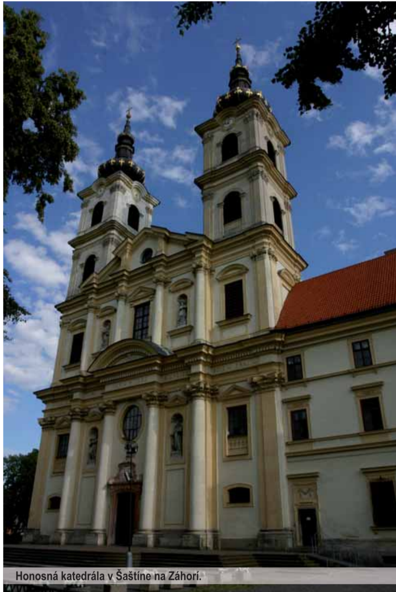
Honosná katedrála v Šaštíne na Záhorí.

„Som tvoja matka, a to navždy. Som matka tých, ktorí sú tvoji. To si mi povedal, keď si visel na kríži,“ prihovára sa v trinástom zastavení žena synovi, ktorého drží v náručí. Tomu, ktorý o tri dni vstane z mŕtvych. Mária, Matka Božia. Z času na čas aj ako Matka Šaštínska zvonmi zvoláva rodákov do svojej svätynie na Záhorí. V druhú augustovú nedeľu tak bolo už dvestopäťdesiaty raz.