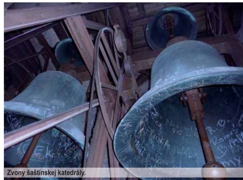
Zvony šaštínskej katedrály.

Vy šaštínske zvony, hlaholte slávnostne, nech sa váš zvučný hlas Slovenskom roznesie. Zaznej radosťou každá dedina, slávou zajasaj celá krajina! Slovenský národ náš ochraňuj v každý čas!“