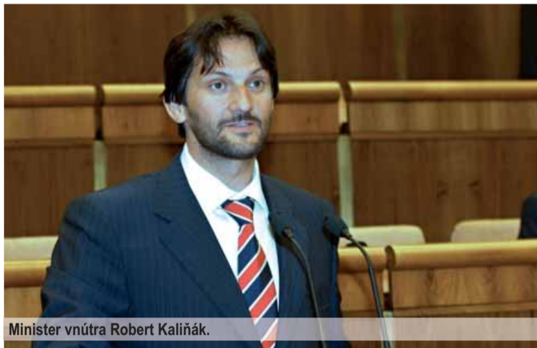
Minister vnútra Robert Kaliňák.

Škrtenie je hitom súčasnosti. Žiaľ, naozaj nepopulárnym. Minister financií hľadá v rezervách milióny, rezorty sa uskomňujú. Je milión tritotisíc eur málo alebo veľa? Z pohľadu štátneho rozpočtu naozaj málo. Z pohľadu dôchodcov, ktorí poberajú priemerný dôchodok vo výške 375 eur, je však skutočnosť, že až 288 z nich by mohlo dostávať počas jedného roka dvojnásobnú rentu, určite významná.