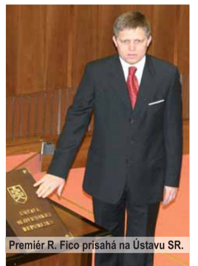
Premiér R. Fico prisahá na Ústavu SR.