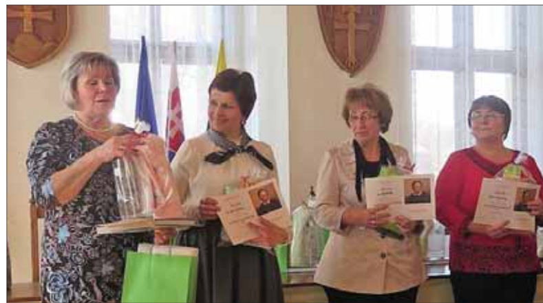
Víťazky 51. ročníka krajského kola Vansovej Lomničky v Žiline.