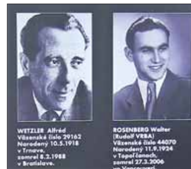
WETZLER Alfréd Väzenská číslo 29162 Narodený 10.5.1918 v Trnave zomrel 8.3.1988 v Bratislave.

Obaja si v koncentráku žili, ak sa dá v týchto podmienkach také slovo vôbec použiť – slušne. Rudo Vrba dokonca po panský – štrnásť hodín denne triedil židovský majetok: vybaloval kufre, tašky a uzličky, zapisoval „tovar“ a ukladal ho do presne špecializovaných a oddelených skladov, označujúcich ich aj „triedou hod-