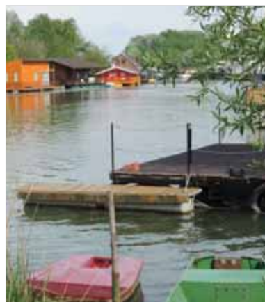
Hausbóty a iné plávajúce obydlia lemujú brehy kanálov a ramien neraz tak husto, že doslova bránia rybárom v prístupe k ich revírom a vo výkone ich rybárskeho práva.

pri tom rybárske organizácie pridelené ministerstvom poľnohospodárstva, tieto zarybňujú aj ochraňujú. Treba tu asi čosi zmeniť. No rybárom nevy-