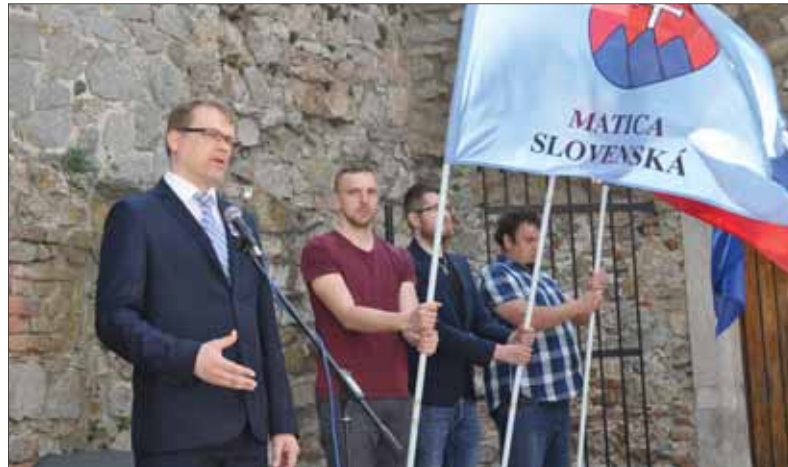
Predseda Matice slovenskej počas príhovoru na devinskom brale.

Výlet štúrovcov na Devín 24. apríla 1836 bol jedným z najvýznamnejších historicko-obrodeneckých podujatí slovenskej mládeže v procese národného uvedomovania v prvej polovici 19. storočia. Nie je preto náhoda, že práve Matica slovenská a v súčasnosti najmä Mladá Matica rozhodli sa pripomínať tento dôležitý dejinný medzník Národnou slávnosťou na Devíne. Tá tohtoročná sa konala, ako ináč, v utorok 24. apríla a dokázala, že je tu šanca vytvoriť priťažlivé podujatie nielen pre vlasteneckú mládež, ale pre všetkých, ktorým osud Slovenska leží na srdci.