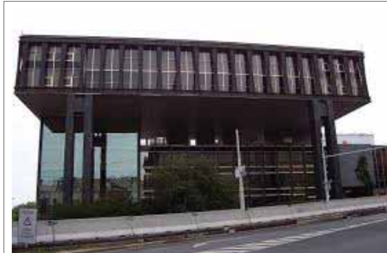
V tejto teraz pražskej reprezentatívnej budove sa kedysi pred štvrtstoročím rozhodovalo, či bude, alebo nebude Slovensko samostatným štátom.

oveľa neskôr, tým menej by sme dostali zo spoločného majetku. Vtedy totiž platil zákon o delimitovaní majetku (zmena jeho vlastníckych štruktúr; poznámka