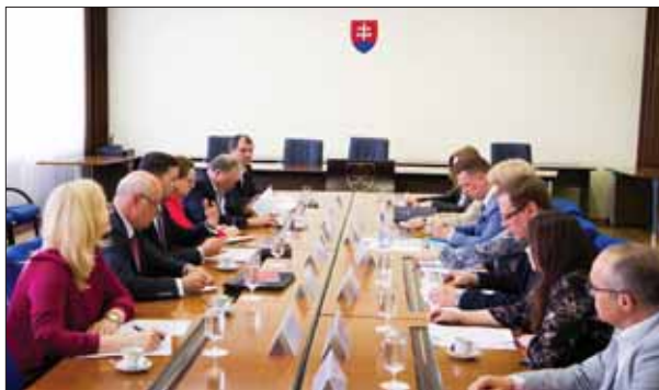
Delegácia Matice slovenskej a Úradu pre Slovákov žijúcich v zahraničí pri rokovaní o vzájomnej kooperácii postupu v krajskej politike.

Krajanské múzeum MS poslalo na slovenské univerzity návrhový list na spoluprácu, na ktorý zareagovali tri univerzity a jedna akadémia (PU PO, TU KE, UMB BB a Akadémia umení v BB), ktoré prejavili záujem a vyžiadali si spresňujúcejšie informácie. Ústredným problémom spustenia realizácie výskumov sú financie, ktoré sa MS snaží získať z dostupných relevantných zdrojov.