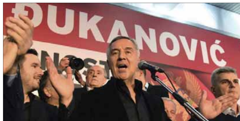
Vítaz čiernohorských prezidentských volieb Milo DJUKANOVIČ vkormidloval krajinu do náručia NATO a vedie ju do EÚ.

Čierna Hora má za sebou tretie voľby prezidenta od svojho osamostatnenia. Voľby, ako sa už za ostatné roky stalo v Čiernej Hore zvykom, nijaké prekvapenie neprinesli. Už v prvom kole zvíťazil s jednoznačným náskokom Milo Djukanovič, ktorý je na výslni čiernohorskej politickej scény už dvadsaťsedem rokov.