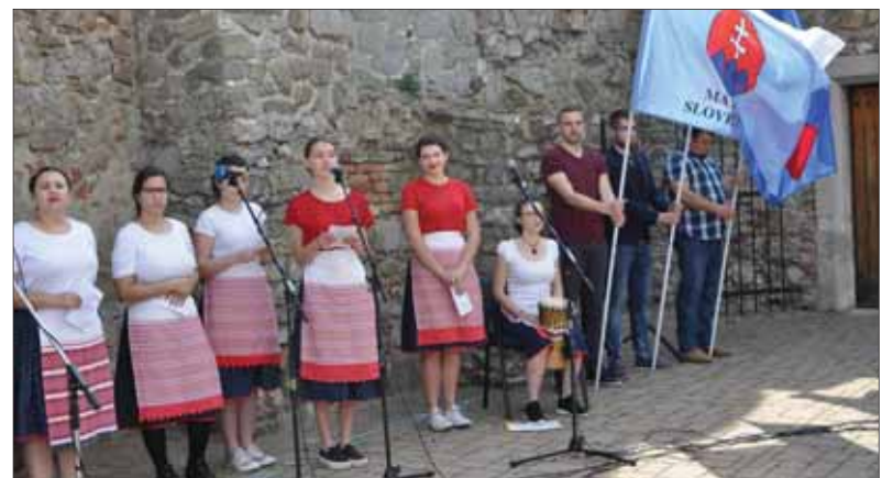
Kultúrny program pripravili študenti evanjelických gymnázií z Bratislavy, Banskej Bystrice a Martina.

Už po siedmy raz privítalo malebné devínske bralo na sútoku Dunaja a Moravy účastníkov matičnej Národnej slávnosti na Devíne, pričom tento rok sa k Matici slovenskej pridala aj Evanjelickej cirkvi augsburského vyznania na Slovensku. Prejavilo sa to najmä v slávnostnom programe, o ktorý sa postarali študenti z Evanjelickej školy v Bratislave a Evanjelickej školy v Martine.