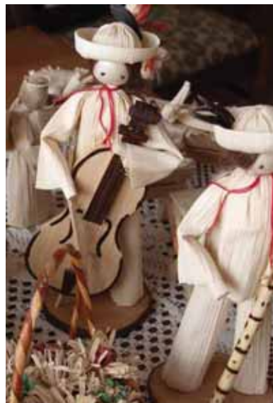
Figúrky z kukuričného šúpolia patria do pestreho registra výrobkov majstrov ľudovej umeleckej výroby.