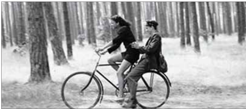
Ružové sny – jeden z azda najúspešnejších slovenských filmov.

Dušan Hanák sa narodil 27. apríla 1938 v Bratislave, kde vychodil základnú a strednú školu. Na pražskú FAMU sa dostal až na druhýkrát a absolvoval ju v roku 1965 pod vedením Bořivoja Zemana. V rokoch 1964 až 1991 pôsobil ako režisér a scenárista v Slovenskej filmovej tvorbe v Bratislave, kde najprv svoj talent uplatňoval v Štúdiu krátkych filmov, neskôr v Štúdiu hraných filmov. Do filmového sveta Hanák vstúpil krátkomet-