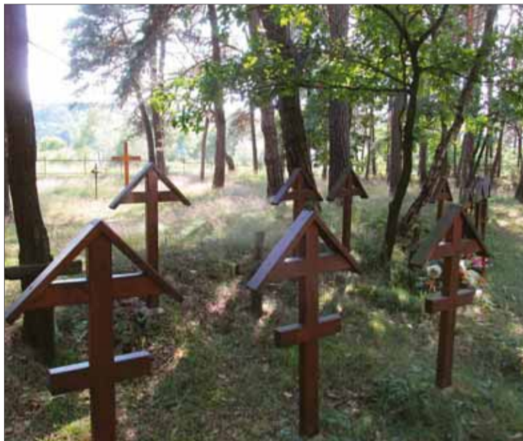
Svoj večný sen na cintoríne v Jangrote spia vojaci rakúsko-uhorskej i cárskej ruskej armády.