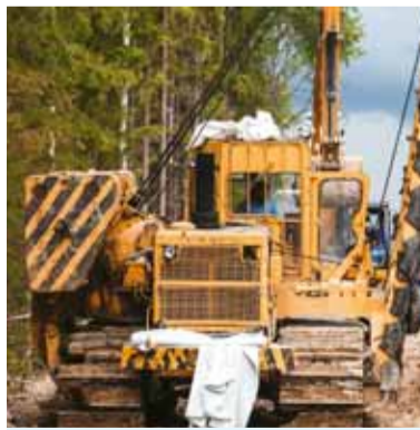
Plynovod Nord Streamu dovezie ruský plyn do Nemecka. Bude obchádzať Ukrajinu, a teda aj Slovensko. Stratíme sto-vky miliónov eur ročne.

Aj preto oznámenie eurokomisára Maroša Šefčoviča o tom, že Únia, Ukrajina i Rusko súhlasili s tým, že treba oddeliť staré problémy od nových, a dohodli sa poveriť expertov na vysokej úrovni, aby spoločne