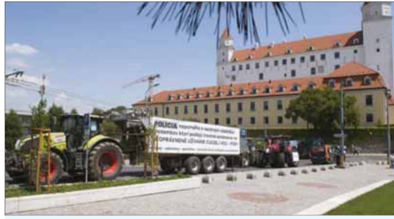
Malí i väčší farmári sa najmä na východe Slovenska stretávajú s nekalými praktikami pri získavaní pôdy do nájmu. Zapojili sa preto do protestov Za slušné Slovensko a zorganizovali protestný výjazd mechanizmov do Bratislavy. Azda bude štát ich práva obhajovať.

Nevyužili ho, alebo len slabó. Ak by to bolo inak, museli by už začať odstraňovať príčiny tohto stavu. A to sa, bohužiaľ, nedeje. Riešia sa len následky prípadov, na ktoré musel upozorniť niekto iný. Pôdohospodár-