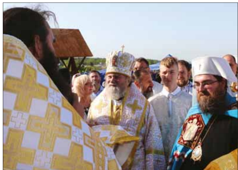
Na slávnostnom vysvätení chrámu sa podieľali takmer tri desiatky duchovných.