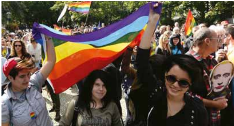
Rozhodnutie Európskeho súdneho dvora v otázke manželstiev dvoch osôb rovnakého pohlavia jednoznačne prekračuje svoje kompetencie. Myslí si sudca Štefan Harabin.

Štát je suverénny, teda je nezávislou najvyššou organizovanou mocou nad určitým územím a jeho obyvateľstvom. V právnom slova zmysle nad štátom už nie je nijaký iný subjekt, ktorý by mal nad ním zákonodarnú alebo donucovaciu moc. Preto sú štáty ako subjekty medzinárodného práva navzájom v rovnoprávnom postavení.