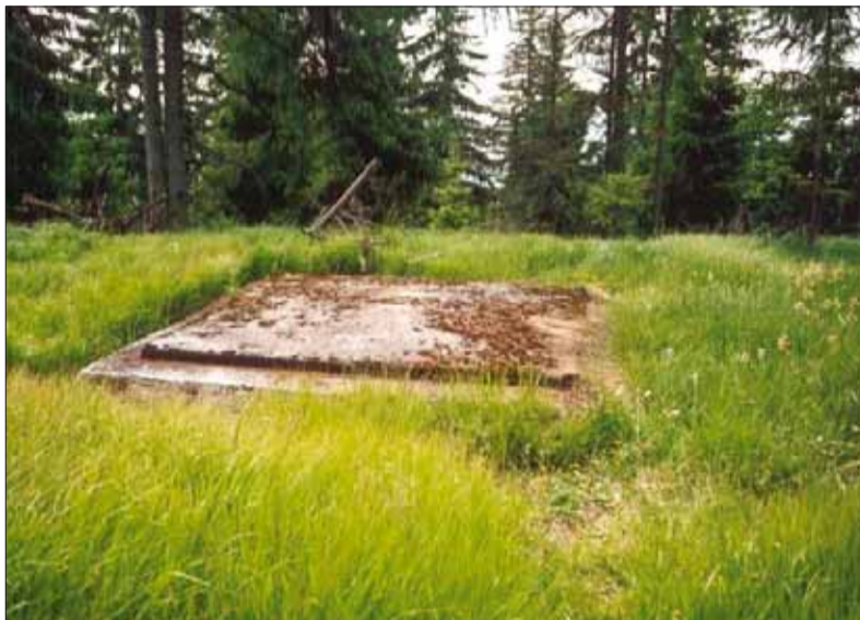
Takto vyzerá miesto kde sa dvojkríž nachádzal. Ostalo tu len smutné torzo v podobe pevných základov.