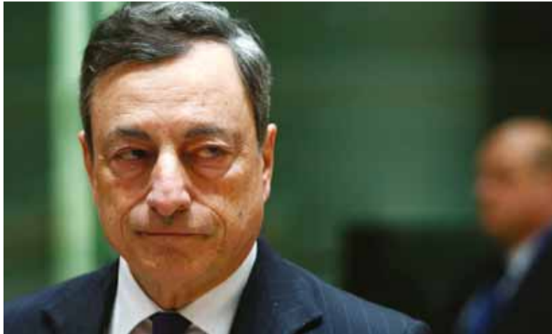
Uvidíme, ako bude na situáciu v Taliansku reagovať Európska centrálna banka, ktorú riadi práve Mario DRAGHI. Ten zostavoval v minulosti talianske rozpočty...

Za poklesom výkonnosti ekonomiky na starom kontinente však môžu byť aj dlhšie trvajúca zima, nečakané štrajky vo Francúzsku, neistota pri zostavovaní vlád v Nemecku a Taliansku, ale aj vyššia chorobnosť na starom kontinente. Najväčším retardérom je však obrovská zadlženosť talianskych bánk. Nová vláda na Apeninskom polostrove mieni požiadať ECB o odpustenie ich dlhu, lenže krajina má aj obrovský deficit verejných financií k HDP na úrovni sto tridsiatich percent, čo je po Japonsku najviac. Podľa predstavy terajšej talianskej koalície vlády sa má jej nikdy nesplateľný dlh s objemom dvestopäťdesiat miliárd eur v štátnych dlhopisoch odčleniť od talianskeho rozpočtu a evidovať na