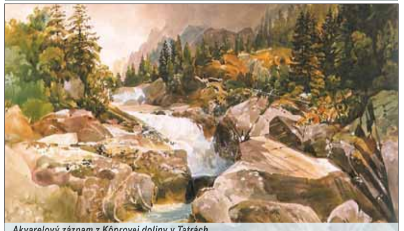
Akvarel z Kóprovej doliny v Tatrách

osud kaštieľa? Už pred, počas a po druhej svetovej vojne ho postihlo plienenie a vykrádanie občanmi. A následne objekt rozbírali a materiál použili na stavbu domov.