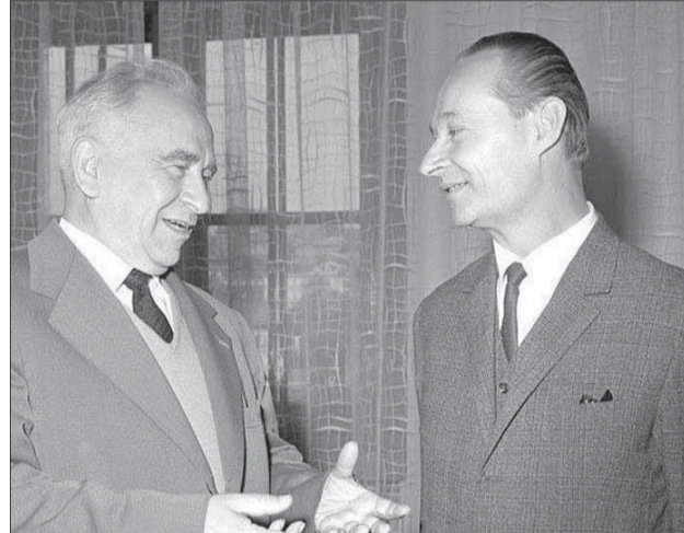
Alexander DUBČEK bol aj pre talianskych komunistov a demokratov rešpektovanou autoritou, čo mu prejavili aj v rokoch perzekúcií.