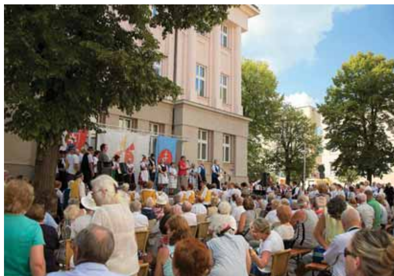
Matičné nádvorie v Martine počas Národných matičných slávností zaplnili stovky slovenských vlastencov.

Terajšie jubileum nie je a nemôže byť len oslavou všetkých dobrých skutkov z minulých období, ale je aj záväzkom, aby sme v rámci neochabujúceho matičného ducha v budúcich obdobiach naplnili odkaz matičiarov, odkaz Matice slovenskej, že tak ako bola, aby aj zostala jednoznačne národnou kultúrnou ustanovizňou, ktorej výsledky činnosti budú nielen na prospech matičiarom, ale aj na prospech nášmu národu a všetkým, ktorí spolu s nami žijú a pracujú v našej vlasti.