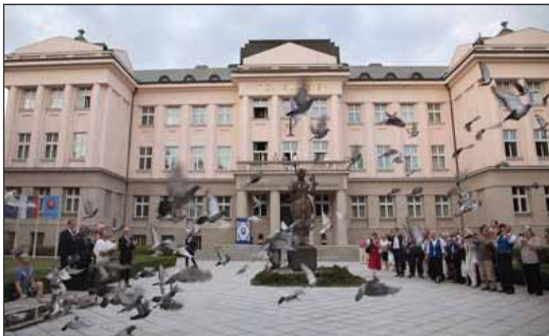
Z matičného nádvorja vyletelo stopäťdesiatpäť holubov...