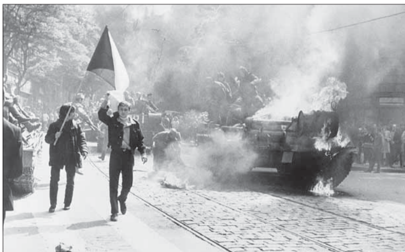
Predstavitelia štátu vyzývali česko-slovenských občanov na zachovanie pokoja a rozvahy, ale bola to rozvaha so zatátnymi zubami a pástami.