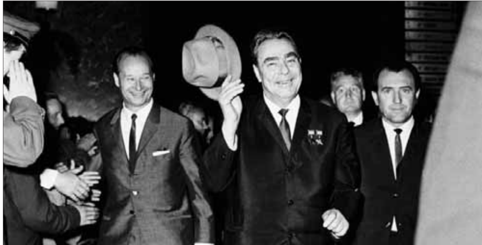
Leonid Brežnev s falošným úsmevom falošného hráča, ktorý po schôdzke v Čiernej nad Tisou hodil DUBČEKA cez palubu a ku kormidlu v ČSSR posunul Biľaka (vpravo).

Postoj jednej z najmohutnejších západoeurópskych komunistických strán – Talianskej komunistической strany, k reformnému hnutiu Dubčekovej jari je slovenskej verejnosti takmer neznámy. Pritom talianski komunisti sa zaslúžili o to, že Dubček ako symbol „socializmu s ľudskou tvárou“ pretrval obdobie normalizácie a v konečnom dôsledku bol aj ich zásluhou rehabilitovaný. Januárové plénum Komunistickej strany Československa v roku 1968, na ktorom bolo zvolené nové proreformné vedenie, talianska komunistická tlač hodnotila pozitívne.