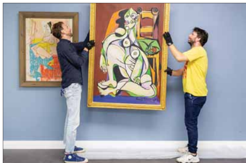
S takýmito vzácnymi dielami sa v depozitoch aj vo výstavných galerijných sálach zaochádza „v rukavičkách“...

roku 1911 adaptovali poetiku analytického a syntetického kubizmu nadviazaním na tvorbu Pabla Picassa a Georgea Braqua. Bol členom skupiny Osma a Spolku výtvarných umelcov Mánes (od 1909). Pred prvou svetovou vojnou veľa cestoval po Európe a v roku 1911 sa jeho záujem sústredil na Paríž, predovšetkým na kubizmus. Po vypuknutí prvej svetovej vojny odišiel do exilu, žil v Holandsku, zapojil sa do zahraničného odboja a po skončení vojny pôsobil ako diplomat (1914 – 1920). V roku 1920 sa vrátil do Prahy, kde sa venoval tvorbe i organizačnej, publicistickej a umelecko-teoretickej činnosti. Po vypuknutí druhej svetovej vojny ho zatkli, bol väznený v koncentračnom tábore Dachau, neskôr v Buchenwalde (1939 – 1945), odkiaľ sa vrátil s podloženým zdravím. Po návrate bol vymenovaný za profesora Vysokej školy umeleckopriemyselnej v Prahe, štát mu ako formu uznania prepožičal kridlo zámku v Peruci (1947), kde umiestnil časť svojich bohatých zbierok umenia. V štyridsiatych a päťdesiatych rokoch sa venoval veľkoformátovým kresbám na motívy slovenských ľudových piesní a realistické krajinnomalbe. Bol často podrobovaný ideologickej kritike zo stalinistických pozícií, zomrel na šiesty infarkt.