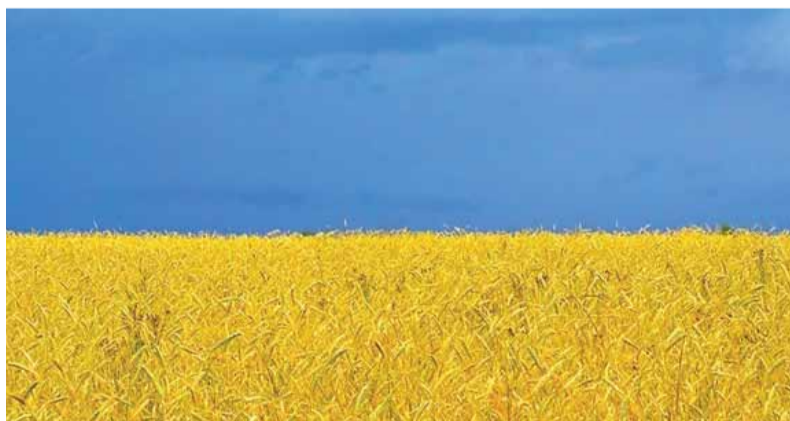
Ukrajina svoju štátnu symboliku na ciele propagandy dotvára aj pomocou takto štylizovaných a fotošopom upravených fotografií.