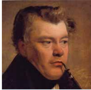
Thomas ENDER, 1796 – 1876