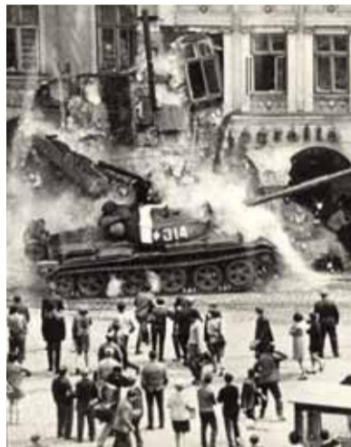
Zaravno s pásmi šesťtisíc tankov hrkotalo v ľuďoch obľudné slovo: OKUPÁCIA!