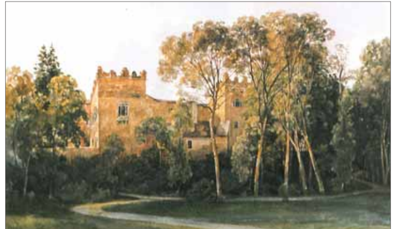
Thomas ENDER: Kaštieľ Medňanských v Strážkach