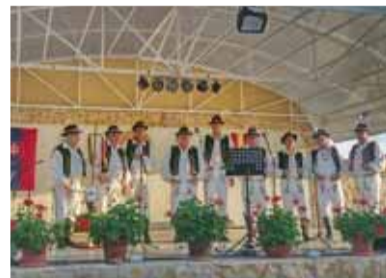
V Cejkove už dvadsiaty šiesty raz oslavovali zvrchovanosť SR a spojili to so 730. výročím vzniku obce.

V kultúrnom programe, ktorý potešil nejedného diváka, vystúpili folklórne