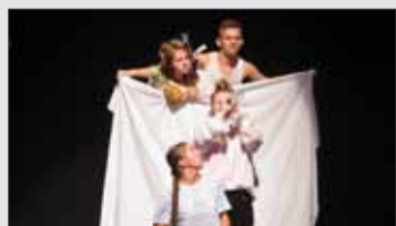
Aj ochotníci vedú vytvoriť príťažlivú scénickú kreáciu a získať si publikum.