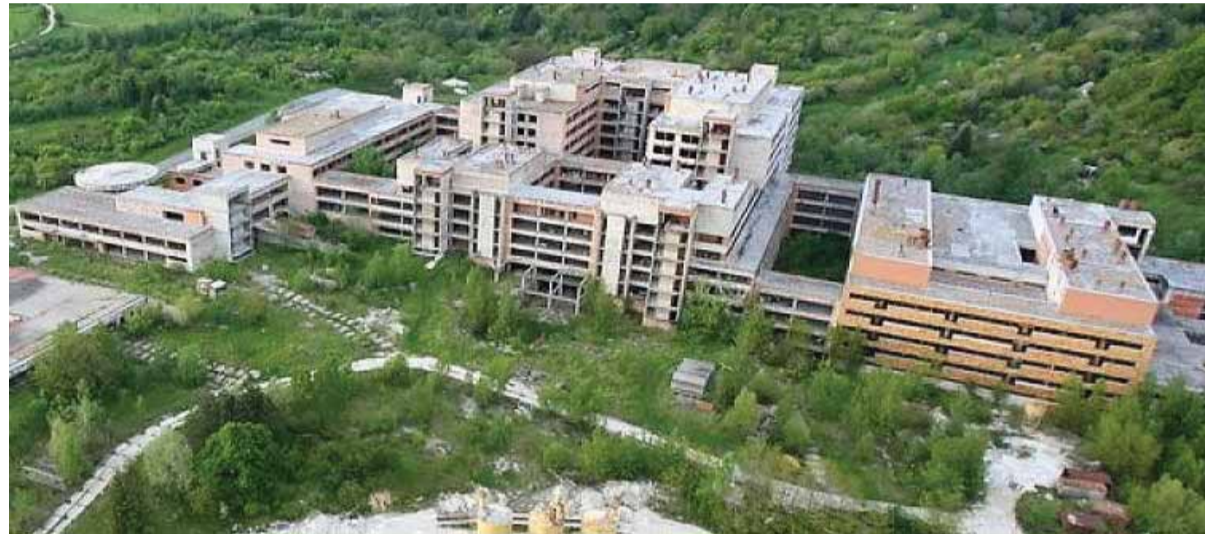
Búranie tohto rozostavaného nemocničného komplexu na Rázsochách v Bratislave si má vyžiadať sedemnášť miliónov eur...

• Ministerstvo zdravotníctva vyhlásilo druhé kolo výberového konania na vydanie povolenia na prevádzkovanie štyridsiatich siedmich ambulancií pevnej ambulantnej