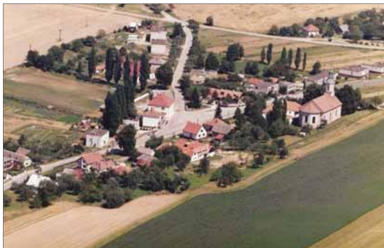
KOŠARISKÁ – rodisko generála Milana Rastislava ŠTEFÁNIKA

Spomenul som si na malý príbeh zo živej prírody. Záhradkár si po rannej námahe sadol na lavičku a zrazu začul tichučké „puk“. V zátočku na halúzke vedľa neho sa zjavila tmavá bodka. Zaujalo ho to. Pochopil, že zrejme uvidí moment zrodu motýľa – a ešte tak zblízka!