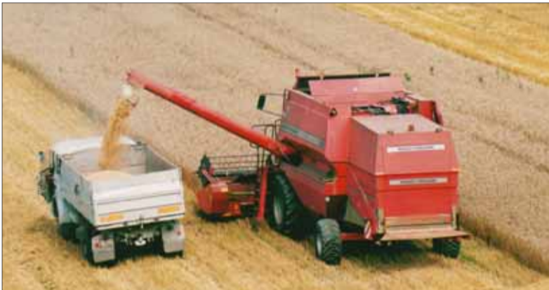
V mainstreamových médiách by ste márne hľadali zmienku o tom, že na Slovensku vrcholila žatevná práca, ale keď do hlavného mesta prišlo desať traktorov s protestujúcimi farmármi, boli z toho mediálne orgie.

ceými „užívateľmi“ sa priame platby neposkytli ani jednému žiadateľovi a na vyriešenie prípadného sporu sa využilo preukazovanie prenájmu, resp. vlastníctva. Ak by Slovensko