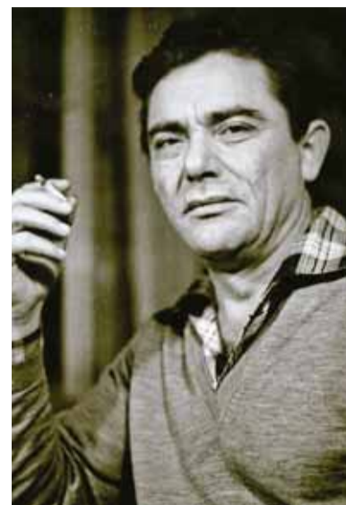
Vladimír MINÁČ v čase, keď viedol Maticu slovenskú.

Keď tak spätne hľadím na to obdobie, ktorému sa u nás hovorí normalizačné, akoby sme ho do výbore MS ani nepoznali a nemali ani čo normalizovať. Myslím si, že jedine, čo poznalo normalizačnú prácu predsedníctva a výboru MS, bola ich malá aktivita pri podpore oživenia činnosti miestnych odborov MS, ktoré boli po roku normalizáciou utlmené. A to bola dosť veľká chyba. Treba totiž jednoznačne povedať, že matičari a ich miestne