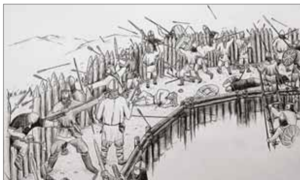
Ochrana palisádovej hradby poskytovala obrancom značnú strategickú výhodu voči útočníkom.

Najstarším typom opevnenia bol jednoduchý plot alebo palisáda. Bývala zapustená do hlinitého násypu a oblepená hlinou.