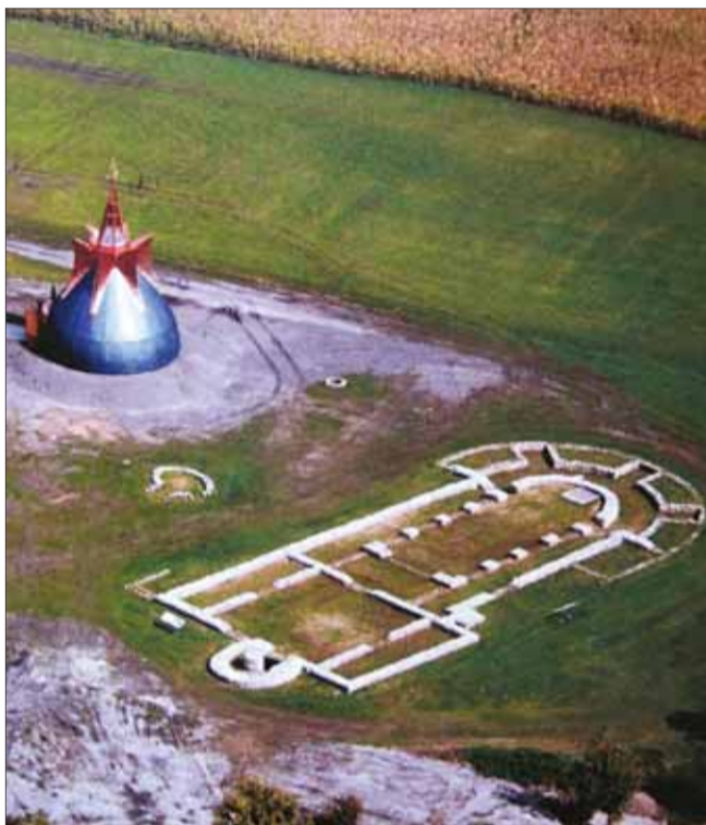
Na leteckej snímke vpravo základy Baziliky sv. Hadriána, vľavo hore miléniový pamätník sv. Štefana od Imre MAKOVECZA, vľavo dole a v strede došiaľ neprebádané historické nálezy.