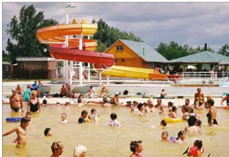
Letné prázdninové a dovolenkové obdobie prináša nielen relax a regeneráciu, ale aj množstvo infekčných nástrah.

Vzdelávacie kampane v materských, základných a stredných školách, u zamestnávateľov, skupinové vzdelávanie a výchova k zdraviu sú významné. Aj individuálne poradenstvo, ako zostať zdravý, tvorba indi-