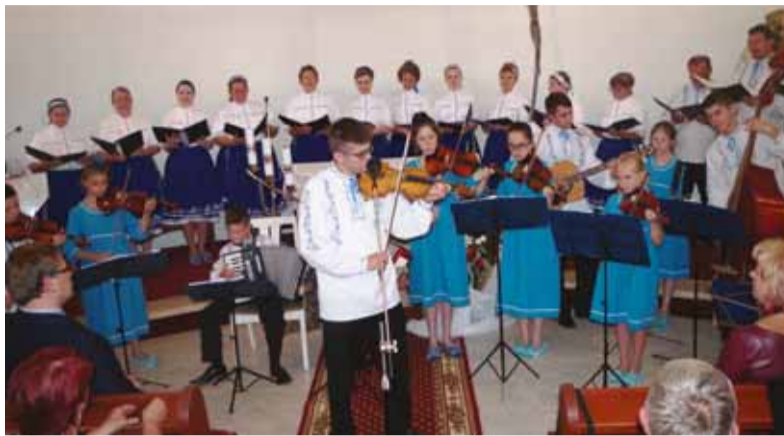
Veľký podiel na slávnostnej atmosfére Močarianských dní malo účinkovanie súboru Zvony zo Selenče, ktorý je pýchou slovenského zborového spevu v Srbsku.