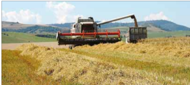
Serióznosť požiadaviek a návrhov niektorých vlastníkov pôdy a farmárov je po obštrukciách a odmietaní rokovania s predstaviteľmi rezortu i vlády problematická. Najnovšie sa vyhovávajú, že im v tom bráni veľa práce počas žatvy...

Predseda vlády sa zrejme aj úprimne usiluje o rokovania. Aj to deklaruje: „Na to veľké stretnutie