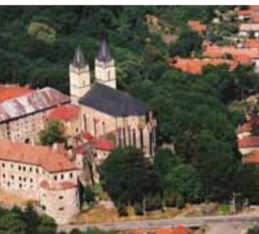
Existencia slovanského hradiska sa predpokladá na miestach dnešného areálu opátstva v Hronskom Beňadiku.

O začiatkoch slovanských hradísk na Slovensku môžeme uvažovať až na sklonku 8. storočia. Do obdobia okolo roku 800 sa datuje nálež bronzového kovania z Hradca pri Prievdizi. Hradisko bolo vybudované v 1. storočí pred Kristom a na prelome 8. a 9. storočia bolo znovu využité slovanským kmeňom usade-