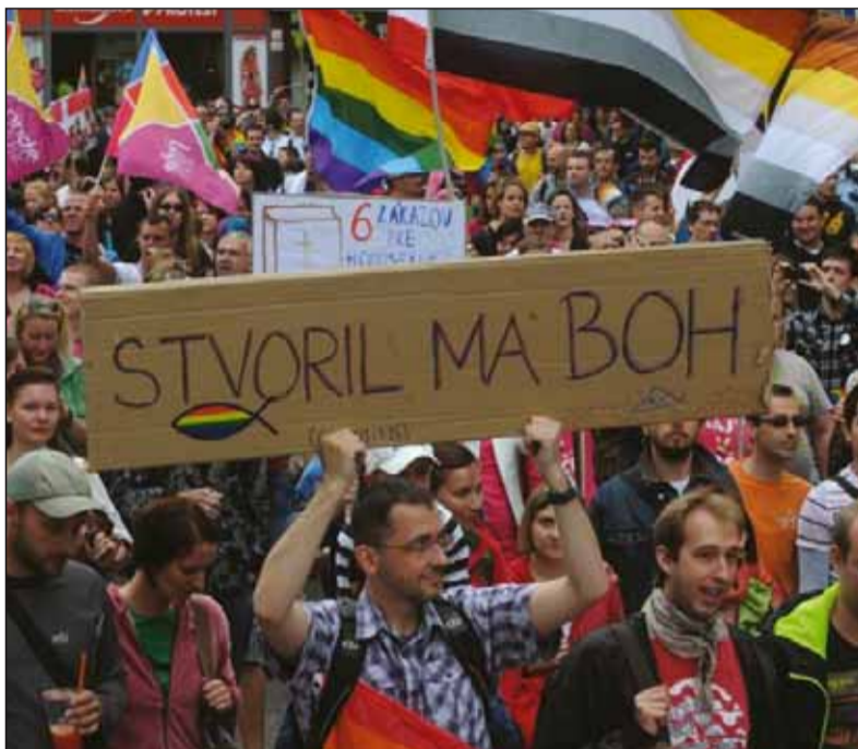
Zaujímavosťou je, že dúhové pochody homosexuálnych skupín sa stále organizujú aj v krajinách Európy, kde je priznané manželstvo homosexuálnych párov a adopcia detí. O čom im teda ide?

Nechajme bokom nezodpovedané otázky – homosexualita je medzi nami, sprevádza ľudstvo od kolísk, odsudzovať ju, ale aj propagovať je scestné. Aj vtedy, ak Dúhový pochod v Bratislave podporia domáce herecké hviezdy a neoliberalní politici i političky a zúčastní sa na ňom excelencie viacerých veľvyslanectiev európskych krajín