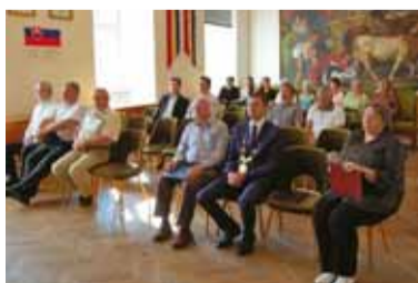
Pietna spomienka sa uskutočnila tentoraz na MsÚ v Kremnici.