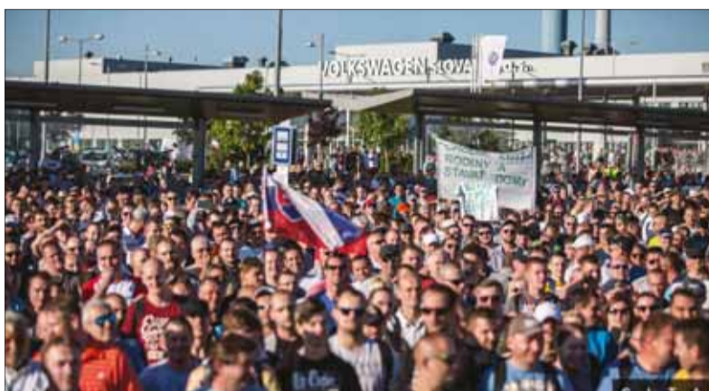
Bratislavski odborári v známej automobilke ostrým štrajkom získali plošné navýšenie miezd.

Šesť dní štrajku bolo pre nás všetkých organizačne veľmi náročných. Veď bolo treba zabezpečiť stravu a iné potrebné veci pre vyše päťtisíc ľudí denne, ktorí sa zúčastňovali na štrajku. K tomu samotné rokovanie, ktoré prebiehalo každý deň a na ktoré sme sa