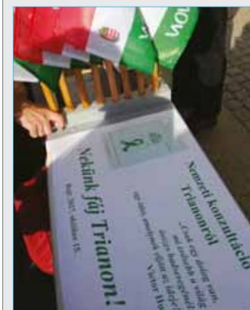
Iredentistická propaganda a maďarský revizionizmus sa rôznymi spôsobmi a formami dávajú počuť aj vidiel...