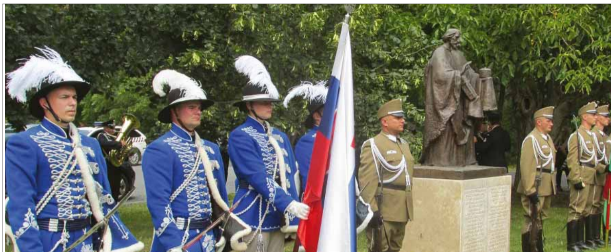
Čestná stráž pri soche Cyrila a Metoda