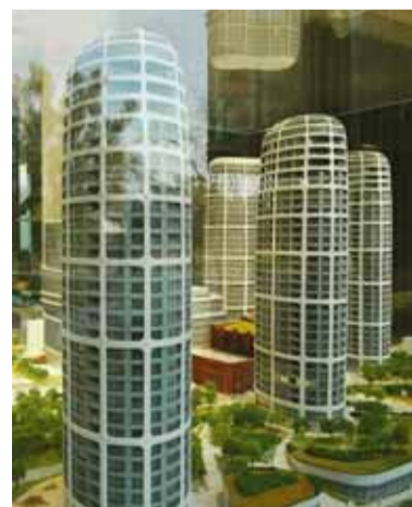
Vežiaky budúceho bratislavského Sky Parku Zaha HADID od rovnomennej svetovej architektky s pôvodnou tepláriu Dušana Jurkoviča uprostred.

zachovaného objektu priemyselnej teplárne skvelého slovenského architekta Dušana Jurkoviča, ktorá je