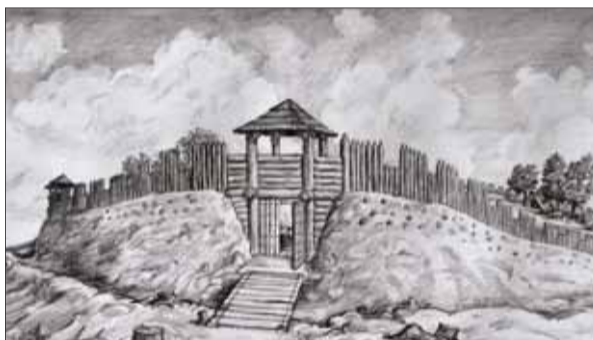
Typická fortifikačná architektúra opevneného slovanského sídliska s valmi, so strážnou vežou a s opevnenou bránou.

To základné a prvé, čím sa fortifikačné práce začínali, bola priekopa, ktorá bola spoločná pre všetky epochy, v ktorých Slovia svoje hradiská stavali. Ak materiál vyťažný pri hĺbení priekopy nestačil, vyhlbili ešte priekopu aj na vnútornej strane hradieb. Šikminy násypov pred hradbami boli hlinené, ale aj kamenné, ak staviteľia mali v okolí vhodný materiál.