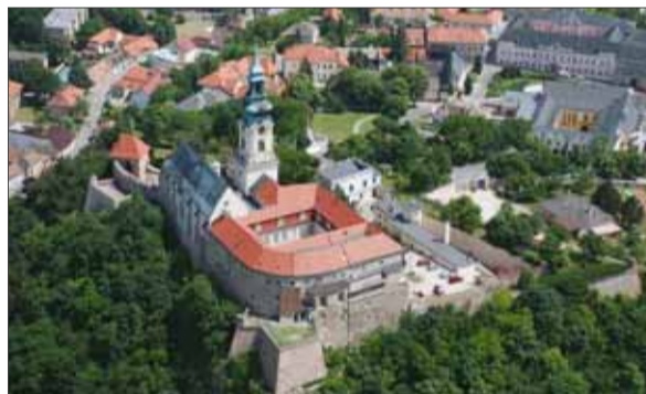
Už v prvej polovici 9. storočia bolo na mieste dnešnej akropoly v Nitre opevnené hradisko našich slovanských predkov.

územiach, ale že v opevnených osadách a strediskách sa sústreďoval hospodársky život oblasti a vládnuce knieža ho mohlo na svoj prospech viac a efektívne kontrolovať.