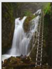
Nová cesta uľahčí prístup ku krásam Slovenského raja.

Stála pozornosť venovaná tomuto skvostnému územiu prispieva k žiaducemu skvalitňovaniu infraštruktúry. Najčerstvejším príkladom je, že začiatkom letnej turistickej sezóny oficiálne otvorili zrekonštruovanú Kopaneckú cestu s cieľom výrazne zlepšiť dostupnosť juhu národného parku, osobitne stredísk cestovného ruchu, akými sú Dedinky, Mlynky, Stratená. Komunikácia 3. triedy vedie serpentínami od Hrabušíc cez Kopanecké sedlo až k obci Stratená. Dlhší čas bola vo veľmi zlom stave, čo vyústilo do slabného záujmu o lokality v okolí Dobšinej. O skvalitnenie prepojenia severu NP s juhom sa postaral Košický samosprávny kraj investíciou 497 tisíc eur na úsekoch s celkovou