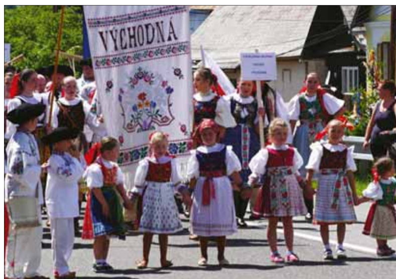
Tradičný slávnostný sprievod účastníkov FFV 2018