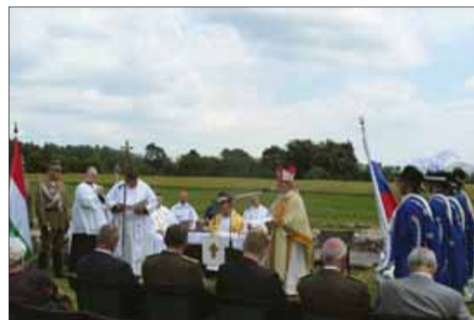
V rámci podujatia v Blatnohrade sa konala aj svätá omša v priestoroch baziliky sv. Hadriána II.