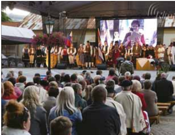
Otvorenie 40. Gemerskej Rontouky na novom pódiu

Gorazdov Močenok vďaka iniciatíve Miestneho odboru Matice slovenskej v Močenku myslí aj na vzdelávanie a poznanie vlastných koreňov tunajších študentov, preto jeho dlhoročným projektom, ktorý v tomto roku tradične predchádzal už XXVI. ročníku Celonárodného festivalu kresťanského divadla, je cyrilo-metodská akadémia.