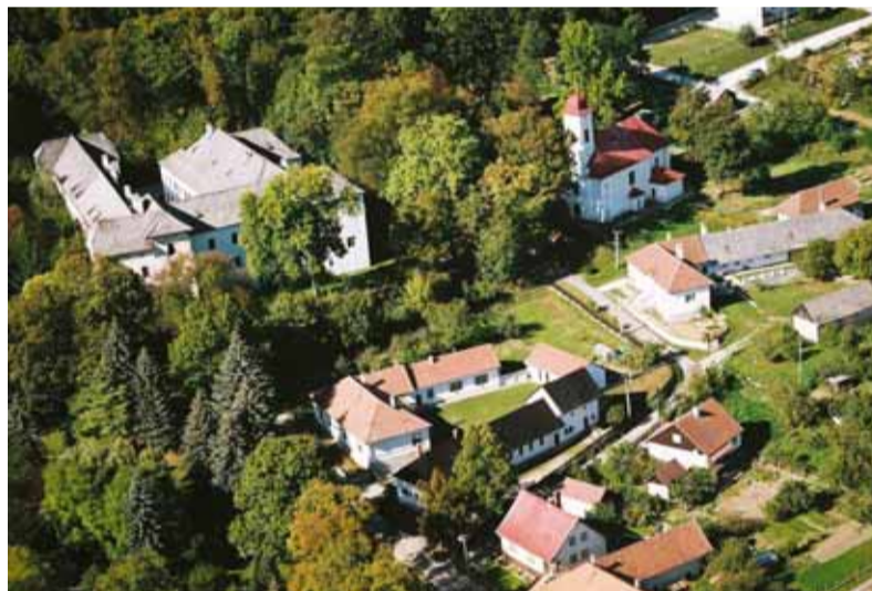
UHROVEC – s historicky unikátnym rodným domom Ludovíta ŠTÚRA a Alexandra DUBČEKA (s tmavou strechou uprostred)