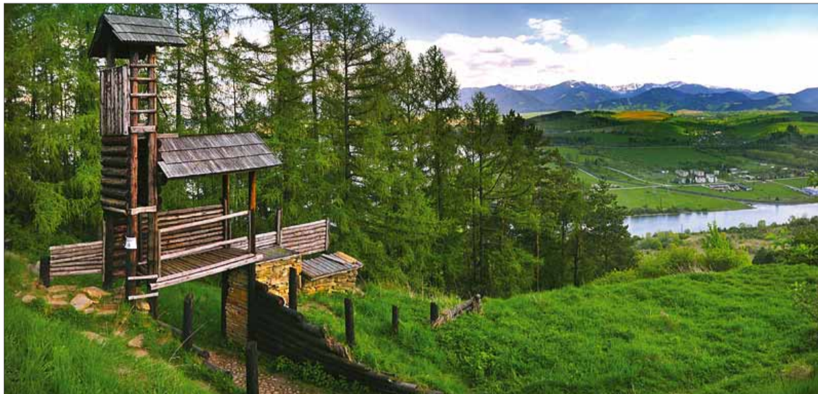
Predobrazom budúcich slovanských hradísk môže byť aj keltské opevnené oppidum Havránok s druidskou svätyňou na východnom úpätí vrchu Úložisko nad vodami Liptovskej Mary, kde už v 12. storočí stála slovanská osada a neskôr zemepanský drevený hradok.

Spoločný koreň slova hrad, gorod, gard má starý slovanský základ. Na celom veľkom území slovanského osídlenia svedčia o tom, že spôsob obrany za hradbami bol vlastný všetkým Slovanom už od pradávnych čias. Dokonca medzi akropolou v Mykénach, Tyrintom, slávnou Trójou a vyspelými slovanskými hradiskami môžeme nájsť istú podobnosť. Vytváraná poloha mykénskeho hradu, členitosť hradného areálu s dominantnou akropolou, s palácami a vymedzený sakrálny priestor i areál, určený pre kráľovské hrobky, nás presvedčujú o určitých spoločných rysoch klasických kultúr východného Stredomoria druhého tisícročia pred Kristom a stredoeurópskymi kultúrami v tom istom časovom úseku.