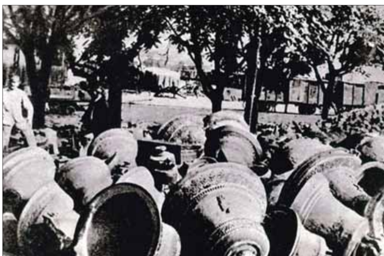
Najprv „padli“ tisícky zvonov a potom tisícky vojakov všetkých štátov zapojených do Veľkej vojny

Ani poľsko-ukrajinské pohraničie neobišli hrôzy prvej svetovej vojny.