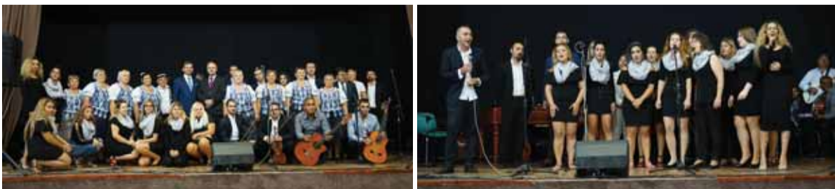
Účinkujúci slávnostného koncertu k 26. výročiu Dňa Ústavy SR v Haniske pri Košiciach

Maticári spolu s Univerzitou PJS v Košiciach a so Súkromným hudobným a dramatickým konzervatóriom v Košiciach na Požiarnickej ulici si v septembri pripomenuli dvadsiate šieste výročie Dňa Ústavy veľkým