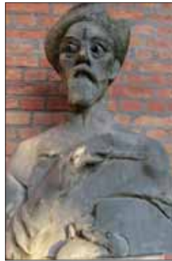
Plastika Teodora KOSZTKU CSONTVÁRYHO v panteóne osobností