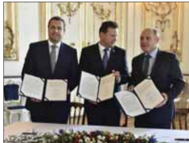
Predsedovia parlamentov susedných krajín rokovali vo formáte S3 – Slavkov

V Slavkove pri Brne sa predsedovia troch parlamentov rozprávali o koordinácii národných politik vo vzťahu k regiónu strednej Európy. „Pre nás V4 nie je alternatívou EÚ, a ani nikdy nebude. Cítíme sa byť integrálnou súčasťou Európy a naše úsilie je zamerané na posilnenie Európy. V4 považujeme za pragmatickú platformu na podporu spoločných záujmov,“ povedal v tejto súvislosti predseda slovenského parlamentu Andrej Danko.