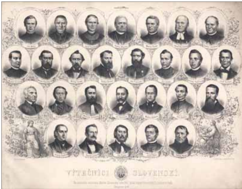
Plejáda národných dejateľov, ktorí formovali slovenský národný život v pohnutých revolučných rokoch 19. storočia, keď sa Slováci vymaňovali zo stáročnej poroby a dvíhali hlavy aj hlas za vlastnú svojbytnosť.