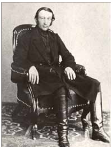
Jozef Karol VIKTORIN patril medzi tých katolíckych kňazov, ktorí súbežne so štúrovcami kládli základy národného života.

Prvého mája 1863 oznámil Ján Francisci radostnú správu, že na Maticu slovenskú sa pozbieralo päťdesiat tisíc zlatých, čo bolo desaťnásobne viac, ako bola požadovaná kaucia na povolenie Matice slovenskej z roku 1851. Pribežne so zbierkou sa pripravovali všetky náležitosti potrebné na založenie