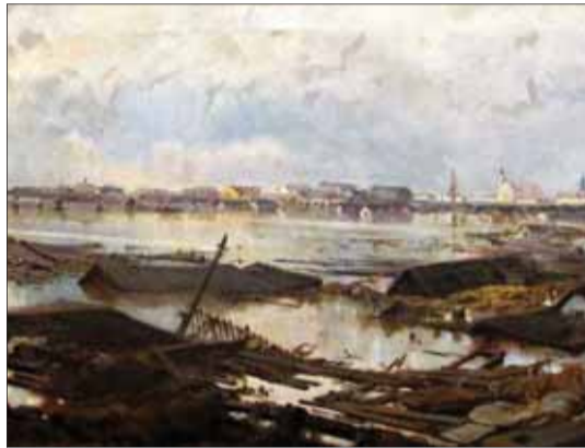
Zničujúca potopa Segedína, ako ju zachytil umelec

Segedínom preteká Tisa, najdlhšia rieka Maďarska. Pramení sa v východných Karpatoch, kľukatí sa východnými regiónmi Maďarska a v Srbsku sa vlieva do Dunaja. Jedným z najväčších projektov 19. storočia vo vtedajšom Uhorsku bola úprava jej toku, ktorú začal Štefan Sečeni. Po nej sa riekou mohli plaviť lode a niekdajšie záplavové územia sa začali využívať na poľnohospodárske ciele. Popri úžitku úprava toku mala aj odvrátenú stranu, lebo v niektorých miestach koryta Tisy voda tiekla rýchlejšie a veľké záplavy hrozili častejšie. Najväčšiu potopu zažil Segedín v roku 1879. Voda mesto takmer celkom zničila. Takto si na povodeň vo svojich zápisoch zaspomínal vtedajší študent Budapeštianskej univerzity, rodák zo Sabinova, maliar Teodor Kosztka Csontváry: „Rieka Tisa sa znovu vyliala. Katastrofálna situácia je v Segedíne. Nasadili nás ako vojenských dobrovoľníckych záchranárov. Prežité udalosti a hrôzy počas povodne, stretnutia s ľudským utrpením a nešťastím poznali nielen moju psychiku, ale aj telesné zdravie. Vrátil som sa odtiaľ veľmi prechladnutý a bolo to také vážne, že som mal ťažkosti s písaním a čítaním. Lekári mi odporúčali dlhší odpočinok, a tak som sa dostal do Tatier do jednej spišskonovoveskej lekáreň ako dočasný pomocník.“