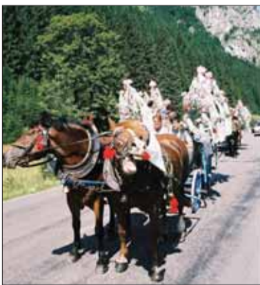
V magazíne Slovensko nechýba reportáž o ďalšej z terchovských výnimočností – o vyzdobenom vozovom sprievode, ktorý ohlasuje slávnosti folklóru, akými sú už niekoľko desaťročí Jánošíkove dni.

začalo 21. augusta 1968 a na ktoré reagovali i literáti v exile. Paradoxne sa len pár desiatok hodín pred oným