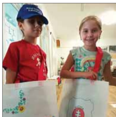
Maľovanie typických slovenských ornamentov si mohli vyskúšať aj deti v tvorivých dielňach

problém – nedostatok mladých členov, zreteľná ľahostajnosť mládeže o národnú otázku a nezáujem o podieľanie sa na akomkoľvek vytváraní a dotváraní našej kultúry.