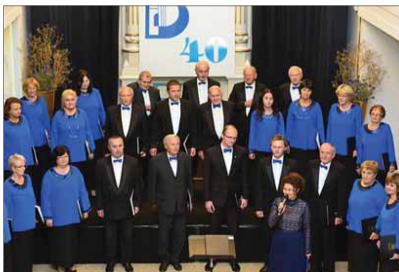
Spevácky zbor mesta Brezno oslavuje štyridsať rokov účinkovania