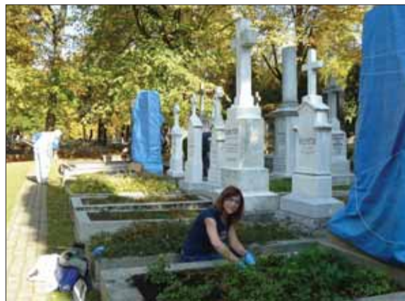
Zamestnanci Matice slovenskej obeťavo pred Sviatkami všetkých svätých a Pamiatky zosnulých dobrovoľne čistili hroby na Národnom cintoríne v Martine, ktorý je národnou kultúrnou pamiatkou.

Pred blížiacimi sa oslavami storočnice prijatia Deklarácie slovenského národa a vzniku prvého štátu Slovákov a Čechov si matičiari uctili slovenských dejateľov očistením tridsaťjeden hrobov na Národnom cintoríne v Martine. Ich nezištnú aktivitu na národnej kultúrnej pamiatke v centre mesta uvítala aj martinská samospráva.