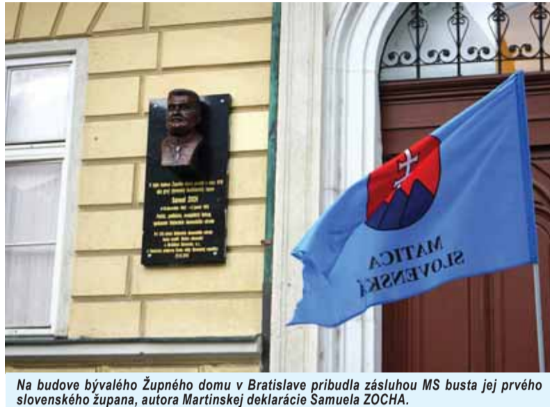
Na budove bývalého Župného domu v Bratislave pribudla zásluhou MS busta jej prvého slovenského župana, autora Martinskej deklarácie Samuela ZOCHA.