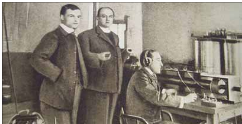
Známy slovenský vynálezca Jozef MURGAŠ sa v patentovaní prenosu telegrafných správ v Morseovom kóde nepresadil. Patrí mu jediné prvenstvo – a to v dvojtónovom prijímaní správ v Morseovom kóde.

Prvá medzinárodná vedecká konferencia o živote a diele J. MURGAŠA k sto päťdesiatemu výročiu jeho narodenia v roku 2014 nanovo objasnila podmienky formovania jeho osobnosti a profesionality. Podujatie zorganizovali Štátna vedecká knižnica – Literárne a hudobné múzeum v Banskej Bystrici s úmyslom „prezentovať nové poznatky výskumu postavené na dôkazoch a artikulovať tak miesto Jozefa Murgaša v dejinách“. Zborník príspevkov z konferencie s prílohou elektronickej verzie textovej časti, vydaný v tomto roku, stal sa vítaným dokumentom záujemcov o históriu.