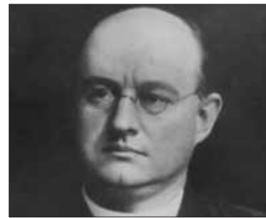
Reverend Jozef MURGAŠ