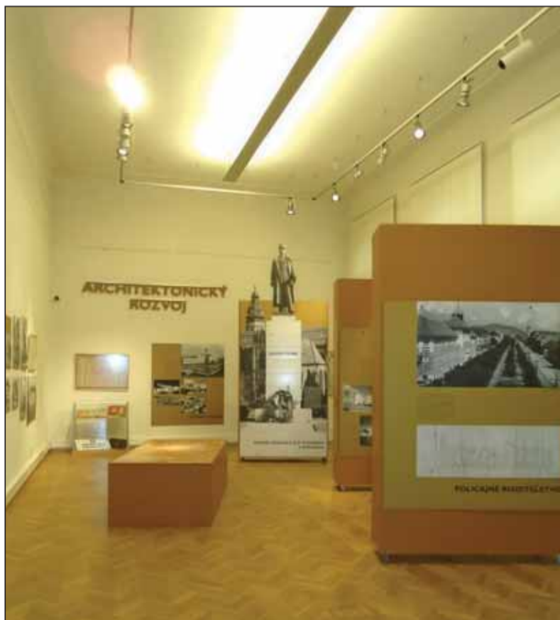
Výstava, ako vznikla metropola východu Košice, bola súčasťou celoštátnych osláv vzniku prvej Československej republiky, ktoré sa konali niekoľko dní po celom Slovensku.

Zámerom tvorcov výstavy bolo pripomenúť si obdobie dvoch decénií trvania prvej Československej republiky, počas ktorých sa vytvoril Košická župa po prvý raz v histórii východného Slovenska stalo administratívnym celkom s Košicami ako prirodzeným centrom tohto regiónu. Ambíciou autorského a realizačného kolektívu bolo prezentovať túto tému inovatívnym spôsobom aj za pomoci využitia najnovších technických vymožeností. Návštevníci tak na výstave môžu vidieť počítačovou 3D vizualizáciu dvoch najvýznamnejších objektov – hlavnej pošty a policajného riaditeľstva, symbolizujúcich modernizačný rozvoj Košíc za éry prvej republiky. Vďaka veľkorysej podpore Košického samosprávneho kraja sa zas podarilo do výstavných priestorov nainštalovať dve technické novinky, tzv. „Monkeybooky“, teda elektronické knihy umožňujúce návštevníkom pohodlným spôsobom čítať a listovať v množstve naskenovaných originálnych dobových dokumentov a fotografií. Samotná výstava je priestorovo poňatá naozaj veľkoryso, keďže je rozložená na ploche vyše päťsto štvorcových metrov a zaberá celé prvé nadzemné podlažie historickej účelovej budovy Východoslovenského múzea v Košiciach.