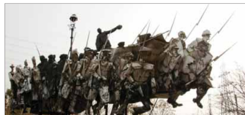
Takéto pamätníky stavali naši južní susedia na oslavu svojich Červených gard a Kunových hrdľorezov, ktorí vyčítali aj na území Slovenska.

a o to tragickejšie, že o niekoľko dní – 11. novembra 1918, sa definitívne skončila prvá svetová vojna. Samotná Habsburská ríša podpísala prímerie s Dohodou už 3. novembra 1918 vo Ville Giusti pri Padove a 11. novembra rakúsky cisár Karol I. abdikoval, čím sa Rakúsko-Uhorsko definitívne rozpadlo. Ani nasledujúce diplomatické manévry predsedu vlády M. Károlyiho a ani represie jednotiek Maďarskej národnej rady nemohli zvrátiť rozpad Uhorska. História