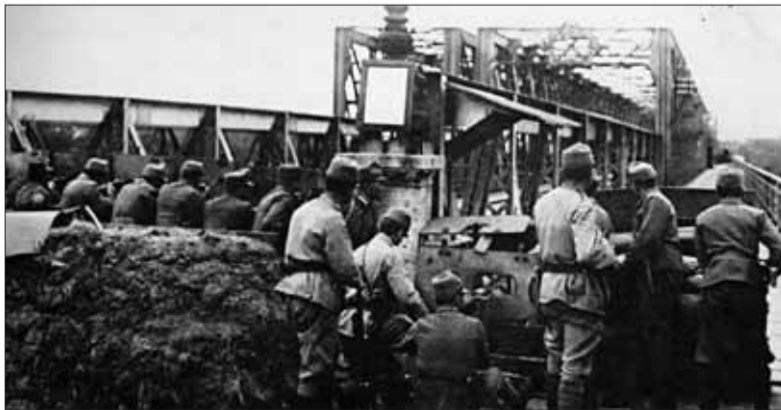
Česko-slovenská stráž na zaminovanom Moste Františka Jozefa (Starý most) cez Dunaj