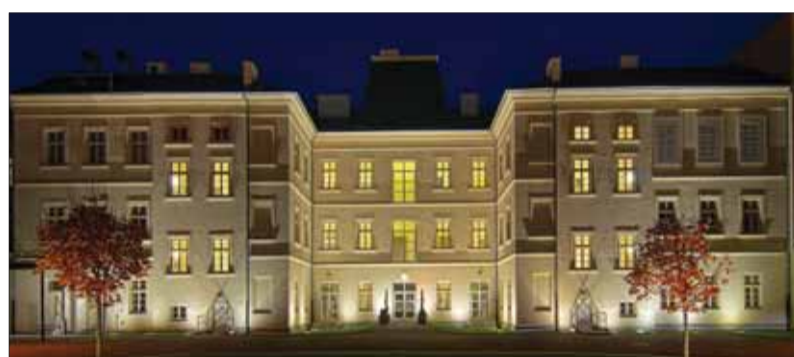
Budova Ústavného súdu SR v Košiciach

Za sudcu ústavného súdu môže byť vymenovaný občan Slovenskej republiky, ktorý je voliteľný do Národnej rady Slovenskej republiky, dosiahol vek štyridsať rokov, má vysokoškolské právnické vzdelanie a je najmenej päťnásť rokov činný v právnickom povolani. Tá istá osoba nemôže byť opakovane vymenovaná za sudcu ústavného súdu. Sudca ústavného súdu je volený na dvanásť rokov a do funkcie