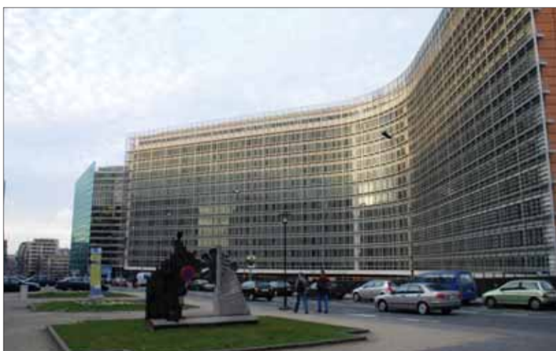
Aj v bruselskej a štrasburskej centrále Európskeho parlamentu sa očakáva personálne zemetrasenie

Voľby do EP ukážu náladu obyvateľstva a jeho záujem o zmeny aj na domácej pôde. Pravda, v parlamentných voľbách nemusí byť poli-