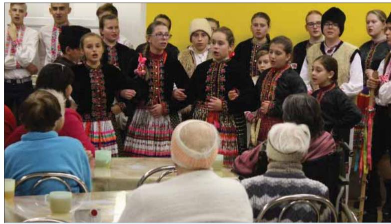
Počas predvianočnej misie po sociálnych zariadeniach a detských domovoch navštívili malí-velkí hrušovskí folkloristi šesť zariadení, aby v nich rozdelili veľa optimizmu a radosti

Z príjemného prostredia spod vychádzajúcim slnkom ožiareného