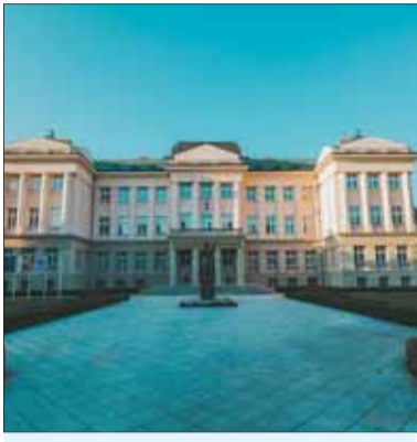
Matica slovenská v Martine