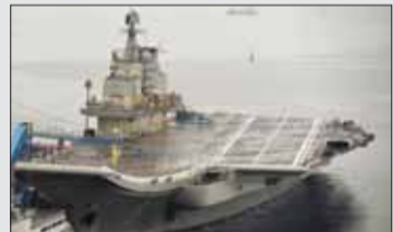
Čína tento rok pod svojou vlajkou spustí po rekonštrukcii svoju prvú lietadlovú loď, ktorú kúpila od Ukrajiny

Menšie ako polovicu tohto objemu dosiahla Európska únia ešte s Veľkou Britániou – 23,8 percenta. Na treťom mieste skončilo Rusko – 9,5 percenta z oficiálne registrovaného obchodu so zbraňami. Čína sa v tabuľke nenachádza, lebo svoj vývoz zbraní neoznamuje. V prvej stovke exportujúcich zbrojovníkov podľa objemu vývozu sú už aj spoločnosti dvoch menších krajín – Belgicka a Česka, inak aj v tejto tabuľke vedie USA – amerických firiem je tu štyridsaťdva. Najrýchlejší rast zbrojárskej výroby v roku 2018 zaznamenalo Turecko, najvyšší rast dovozu Saudská Arábia.