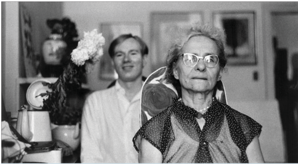
Júlia VARCHOLOVÁ so synom Andym

Aj brat Paul bol rád, že si mama Júlia našla miesto v Andyho byte na rohu Osemdesiatej deviatej a Lexin-