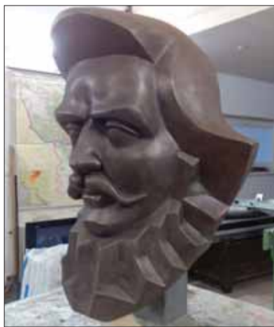
Tak toto je ten „obor“, ktorý poniektorým Štúrovčanom prekáža vo výhlade na Ostrihom...