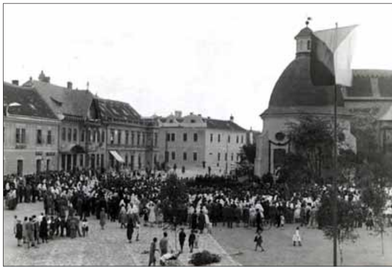
Oslavy príchodu dočasnej vlády do Skalice v novembri 1918

Bratislavská radnica reagovala na udalosti úplne inak. V novembri sa tu zdvihla vlna demonstrácií a rabovania. Radnica musela vyhlásiť v meste výnimočný stav. Pod hrozbou najprísnejších trestov zakázala akékoľvek zhromaždenia, nočné vychádzanie a predaj alkoholu v obchodoch a pohostinstvách. Tak prešiel november i december. Správu mesta prevzalo vojsko pod velením generála Károlyho. Nočné podniky museli končiť o dvadsiatej tretej hodine. Vyčerpaní vojaci, ktorí sa vrátili z frontu, namiesto odpočinku alebo pobytu