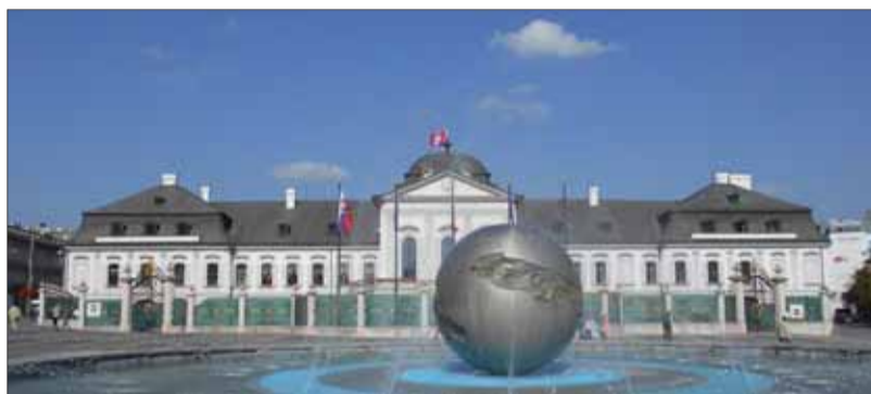
V Grasalkovičovom paláci v Bratislave sa po tridsiatom marci zmení jeho prezidentský nájomník

Nuž, predseda parlamentu nepotrebuje nijakú špeciálnu kampaň, denne je na očiach voličov. Ak by išiel