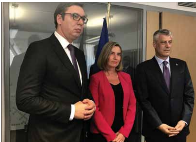
Srbský prezident Aleksandar VUČIČ a kosovský prezident Hashim THACI hľadali spoločnú reč na rokovaniach so zástupkyňou Európy Federicou MOGHERINIOVOU. Zatiaľ ju nenašli...

Výzva amerického prezidenta prichádza v čase, keď na jednej strane americká politika slávi úspech v Čiernej Hore a Macedónsku, ktoré podľa očakávaní v roku 2019 pristúpia k NATO (tento proces nezvratia ani aprílové macedónske prezidentské voľby s očakávaným víťazstvom kandidáta z radov vládnej socialistickej albankej koalície). Na druhej strane v čase, keď kosov-