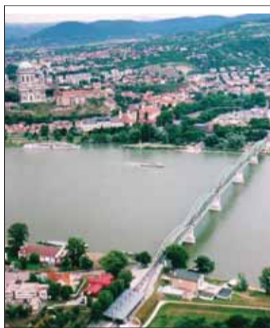
Aroganciu maďarských nacionalistov v Štúrove dokumentuje argument, že busta by bránila vo výhlade na Ostrihomskej baziliku.

„Keď pred tromi rokmi matičiari poklepkávali základný kameň Štúrovho pamätníka, ozvali sa podobné vyhrážky, čo bolo ako voda na mlyn k nálepkovaniu matičných tabulí extrémistickými nálepkami a základný kameň sústavne vulgárne poškodzovali neznámi páchatelia. Navyše, zdĺhavý a neštandardný