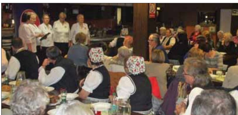
Podmaňujúca atmosféra matičných vianočných slávností v Košiciach

Po úvodných oficialitách prítomným zaspievali vianočné koledy známe Matičiarky a sviatočnú atmosféru vystúpením spestrila aj folklórna skupina Studzenka z Plechotíc. Pravdaže nechýbala povznášajúca Tichá noc, úprimné priania