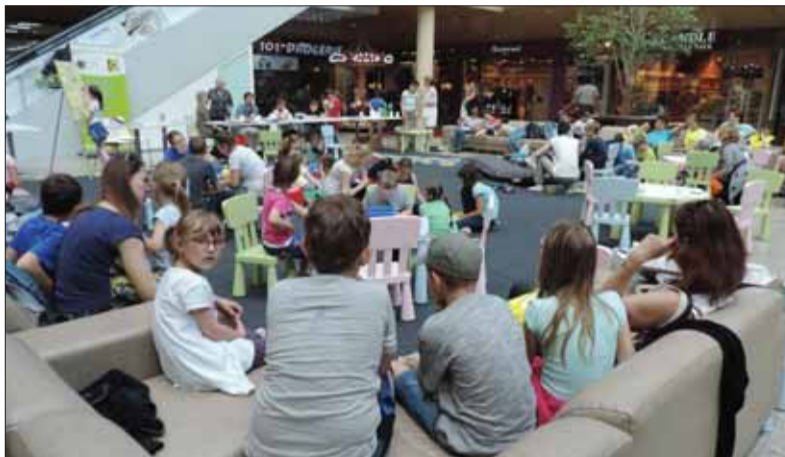
Záujem detí a mládeže o knihy a čítanie možno prebúdzajú aj vynachádzavými spôsobmi priamo v prostredí, ktoré je im blízke.

Trenčín je mesto s bohatou a so zaujímavou históriou. Na túto otázku by vedeli erudovane odpovedať skúsení