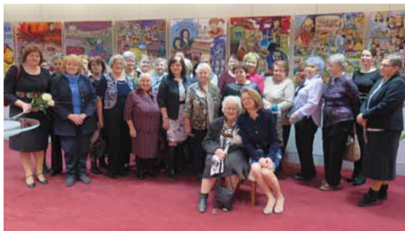
Účastníčky projektu Vyšívaná história počas predstavenia dokončeného diela v Slovenskom národnom divadle