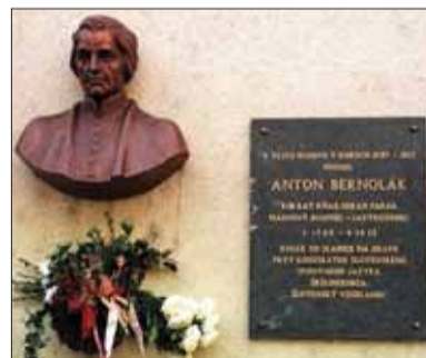
Busta a pamätná tabuľa kňaza a jazykovedca Antona BERNOLÁKA na budove novozámckého farského úradu Marianum

soche Antona Bernoláka, prvého kodifikátora slovenčiny, na Hlavnom námestí v Nových Zámkoch, v bezprostrednej blízkosti kostola a fary, kde tento veľikán pôsobil šesťnásť rokov, je prekrásnou udalosťou, ktorej my Novozámčania pripisujeme nesmierny význam. Pripomeňme si v tejto slávnostnej chvíli slová Jozefa Miloslava Hurbana: Povstal v útlom veku mládeňec slovenský, ktorého duch smelo letel nad zaprášené cesty zastara-