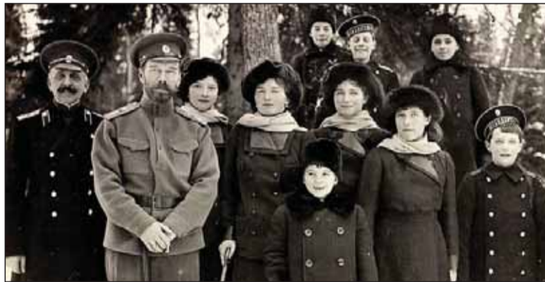
Cárska rodina Romanovcov v Jekaterinburgu krátko pred tým, ako jej členov aj sprievodcov zavraždili bolševici.

V nedeľu 30. júla 1917 opustili cársky palác. Spreádzali ich ľudia, ktorí sa dobrovoľne rozhodli rodinu neopustiť: cárův pobočník generál Tatišev, dvorný maršal knieža Dolgorukov, lekár Botkin, vychovávateľ Francúz Giliard, dvorná dáma grófka Gendrichovová, učiteľka madam Sneiderová, pestúnka Tegovová, chyžné Demidovová a Erstbergová, komorníci Černodurov, Makarov a Volkov, lokaj Ivanov, Alexejev opatrovník Nagornyj, kuchár Charitonov so synovcom Sedňovom, čašník Žuravskij, holič Dimitrijev a ešte pár sluhov a kočišov, spolu štyridsať ľudí. Neskôr za nimi pricestoval učiteľ angličtiny Gibs, lekár Derevenko a barónka Buxhevedenová, cárovna dvorná dáma. Na dlhšej ceste ich strážilo tristošesťdesiat vojakov. Ráno 4. augusta prekonali uralské