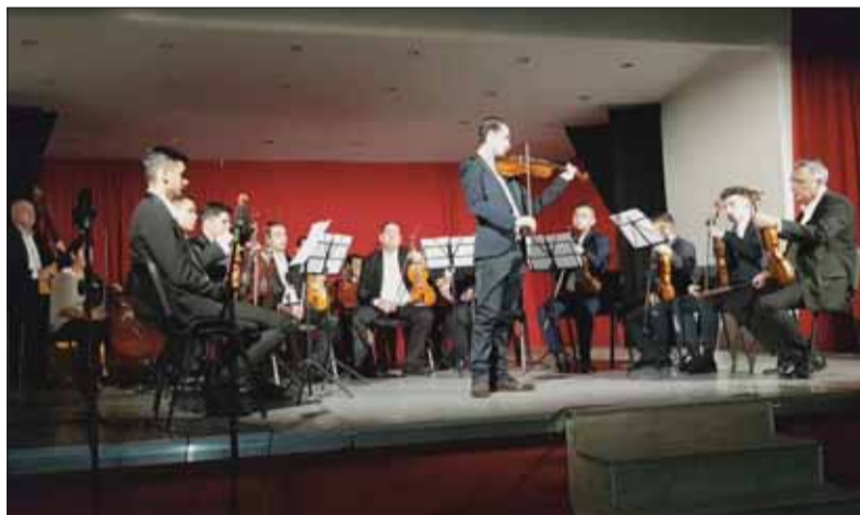
Orchester počas svojich vystúpení na festivale v Prešove

V závere minulého roka sa študenti konzervatória so svojimi pedagógmi zúčastnili na 1.