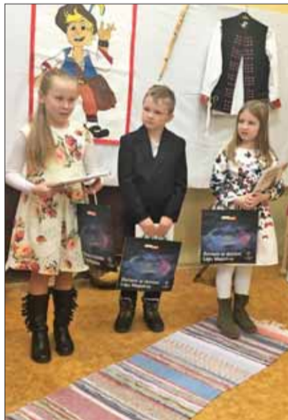
Ocenení a postupujúci súťažiaci v jednotlivých kategóriách na 26. ročníku okresného kola Šalianskeho Matka v Levoči.