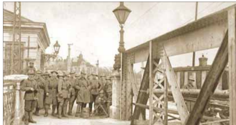
Talianští legionári mali Bratislavu chrániť pred ozbrojenými provokáciami a útokmi Maďarov, ale viac sa venovali vyjadžatčným slečinkám v miestnych bohatých rodinách...

Začiatkom roka 1919 bratislavskí Nemci postupne pochopili nezvratnosť situácie a zväčša sa jej snažili prispôbiť, aspoň tí, čo bývali v meste a vo vinohradníckom okolí. Petržalskí Nemci sa ešte nádejali, že územie za Dunajom pripadne do Maďarska, vysúdia si ho Rakúšaniam alebo sa stane medzinárodným koridorom. Odpor väčšiny maďarských meštíakov však každým týždňom rástol. Akoby im nedávna strelba na legionárov a slovenských dobrovoľníkov pred mestskou tržnicou dodala odvalu a chuť riskovať. Napriek sprisneným nariadeniam o pohybe a zhromažďovaní.