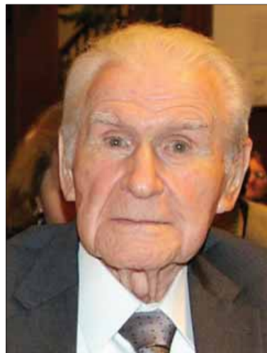
Doyen slovenského povojnového exilu sa dožil požehnaného veku.