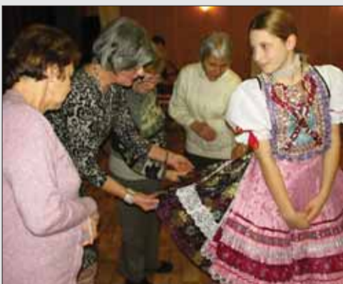
Kroje parchovianskych folkloristov vyvolávali v Jágri počas Slovenského večera zaslužený obdiv.