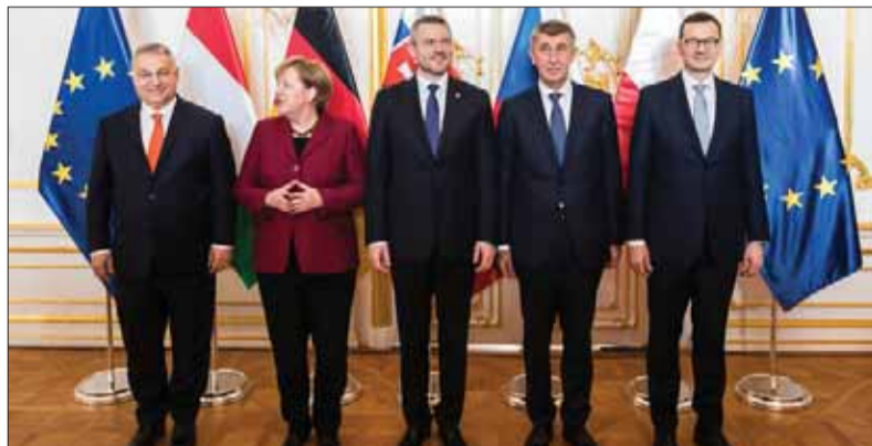
Fotografia pre diplomatické dejiny – nemecká kancelárka s premiérmi krajín V4 v Bratislave – zľava Viktor ORBÁN, Angela MERKELOVÁ, Peter PELLEGRINI, Andrej BABIŠ a Mateusz MORAWIECKI

Okrem brexitu, ktorý sa masívne dotýka všetkých, a pokiaľ ide o počet Východoeurópanov v Británii najmä Poliakov a Slovákov, má Nemecko, jeho politika, práve tak ako silná ekonomika neutichajúci spor, do ktorého je zamiešaná aj Európska komisia, týkajúci sa poľsko-amerického kampane proti Severnému prúdu, priameho plynového prepojenia Ruska a Nemecka. Okrem toho je najnovšie zrejme, že dlhoročné poľské potravinárske problémy sú len vrcholom ľadovca a Poľsko ich nezvládlo, ale rozšírilo do mnohých štátov Európy. Európania majú nemalý problém s namáhavo dosiahnutou dohodou o nerozširovaní jadrových zbraní s Iránom, z ktorej vystúpili Trumpove USA, ale Európa ju ďalej dodržiava. Takisto sa Európa a bezprostrední susedia Ukrajiny boria s nepremysleným procesom, do ktorého vyjednávajúci EÚ hazardne vohľadli Ukrajinu a s tým aj rusko-ukrajinské, ako aj rusko-európske vzťahy. Otvorené sú nielen rusko-európske, ale aj európsko-čínske vzťahy, najmä