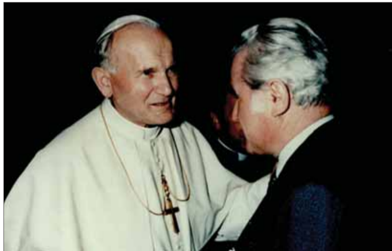
Na audiencii u pápeža Jána Pavla II. vo Vatikáne