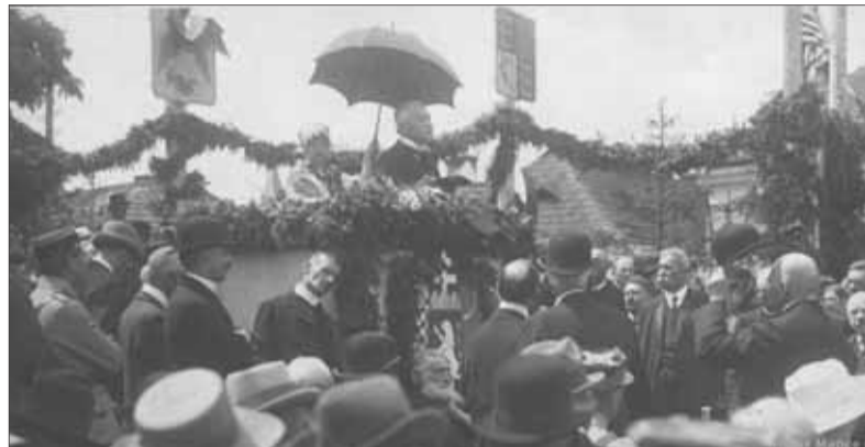
Advokát a básnik Pavol Országh HVIEZDOSLAV recituje svoju poéziu na slávnosti oživotvorení Matice slovenskej v Martine, kde sa stal aj jedným z predsedov ustanovizne.

Pavla Országha Hviezdoslava ako predsedu Matice slovenskej v roku 1919 v týchto dňoch verejnosti pripomenula Matica slovenská na podujatí pri básnikovej soche v Dolnom Kubíne. Príležitosťou na to bolo sto sedemdesiate výročie jeho narodenia, ako aj aktuálne sté výročie obnovenia činnosti Matice slovenskej práve v roku 1919.