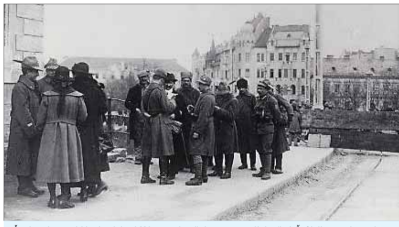
Česko-slovenskí legionári pri Mýtnom domčeku – v pozadí dnešné Šafárikovo námestie

mäkkou hontianskou slovenčinou minútu po minúte opísal udalosť bez vzrušenia, pokojne, bez hrozieb, čím všetkým vyrazil dych. Reč uzavrel krátkou úvahou v troch jazykoch: múdry človek musí vedieť, že nemá význam sa vzájomne obviňovať. Občania a vláda nesmú stáť proti sebe, inak to bude na škodu aj jedným, aj druhým a Bratislava sa nápravy nedočká. Môžu mu veriť, lebo neprišiel medzi nich ako politik, čo si chce na ich úkor robiť kariéru, ale ako človek, čo sa usiluje o ich spokojnosť. Tá sa dá dosiahnuť len spoluprácou. Ani raz nezdvihol hlas. Ničím nestražil. Slovom sa nevyhrá-