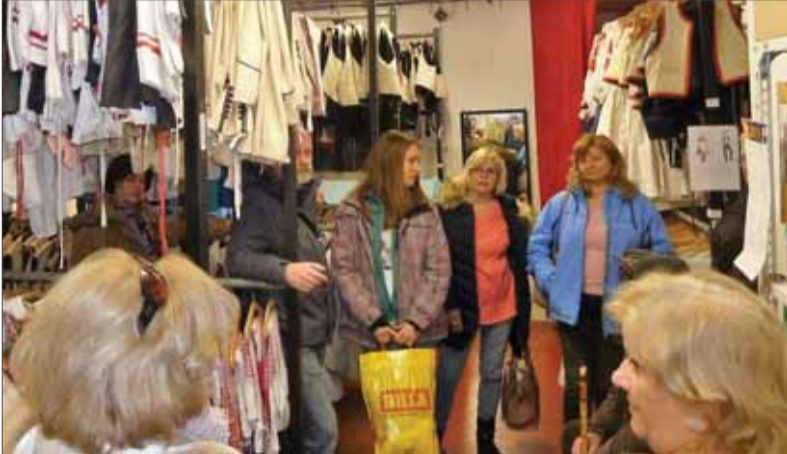
Priestory v martinskej šatnici majú rozlohu vyše 700 metrov štvorcových, ktoré slúžia ako sklad niekoľko tisíc krojov a kostýmov.

Koncom januára sa členovia Miestneho odboru MS v Martine zúčastnili na exkurzii do Požičovne krojov a kostýmov, ktorá je pracoviskom Matice slovenskej od roka 1993. V minulosti aj u mnohých zákazníkov bola známa pod názvom Šatnica. Zbierkami krojov, kostýmov, doplnkov a rekvizít podporuje ochotnícke, poloprofesionálne a profesionálne súbory pri prezentácii kultúrneho dedičstva a spomienkach na významné osobnosti a udalosti národnej a literárnej histórie Slovenska.