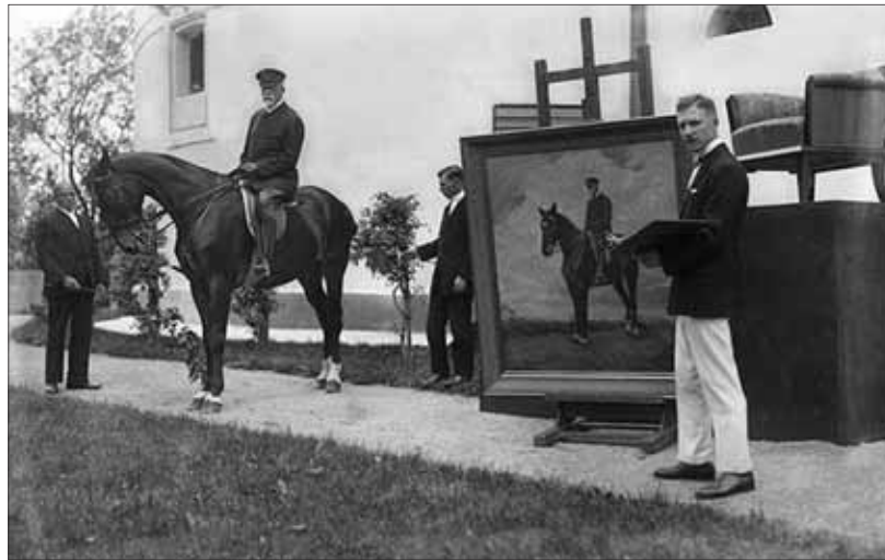
Prezident novej republiky T. G. MASARYK neraz od štátnických záležitostí oddychoval v prezidentskom sídle v Topoľčiankach, kde takto pozvoval portrétistovi...

Nová republika koncepčne sklamala – nestala sa federáciou a postupne sa menila na unitárny štát. Dokonca s vymysleným národom československým. Napriek prijatej zásade federálneho usporiadania, potvrdenej podpisom prezidenta Masaryka na Clevelandskej zmluve s americkými Slovákmí, ktorých podiel na vzniku štátu bol v zlomových chvíľach dokonca aj rozhodujúci: vplyvom na politikov, najmä na prezidenta Wilsona, účasťou amerických Slovákov v armáde USA a v česko-slovenských légiiach, aj finančnou podporou. To je nesporné. Napriek tomu treba uznať rýchlosť a kvalitu formovania štátu vo všetkých smeroch – hospodárstve, legislatíve, obrane, školstve, kultúre, sociálnom systéme, zdravotníctve, bytovej výstavbe, doprave a zásobovaní. Veľa európskych krajín sa až do vypuknutia svetovej hospodárskej krízy, teda zhruba desať rokov, nespamätalo z následkov prvej svetovej vojny, keď ČSR už bola dávno úspešným štátom 20. storočia s deväťdesiatimi percentami elektrifikovaného územia, modernou železničnou a cestnou sieťou, vyspelým právnym, školským, zdravotníckym a sociálnym systémom na báze silnej ekonomiky.