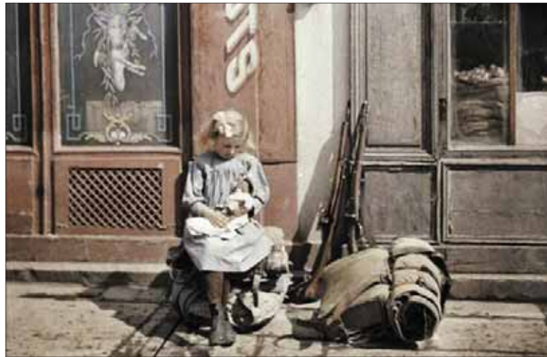
Po rokoch bojov a útrap legionári odložili pušky a deti sa mohli pokojne hrať v slobodnej jari.

Pritom to naši pradedovia nemali ľahké. Veľkú zásluhu na obrovských zmenách mala národná inteligencia – pochopila potrebu doby a svoju úlohu v nej. Slovenské osobnosti išli vtedy do politiky ozaj ako do služby národu. Za poriadok v štátnej správe patrila vďaka aj českým úradníkom, vychovaným v časoch monarchie a so skúsenosťami z najvyšších miest videnskej administratívy. Ich spôsoby neskôr prekážali, ale v prvých rokoch zabránili chaosu, ktorý je sprievodným znakom každého prevratu.