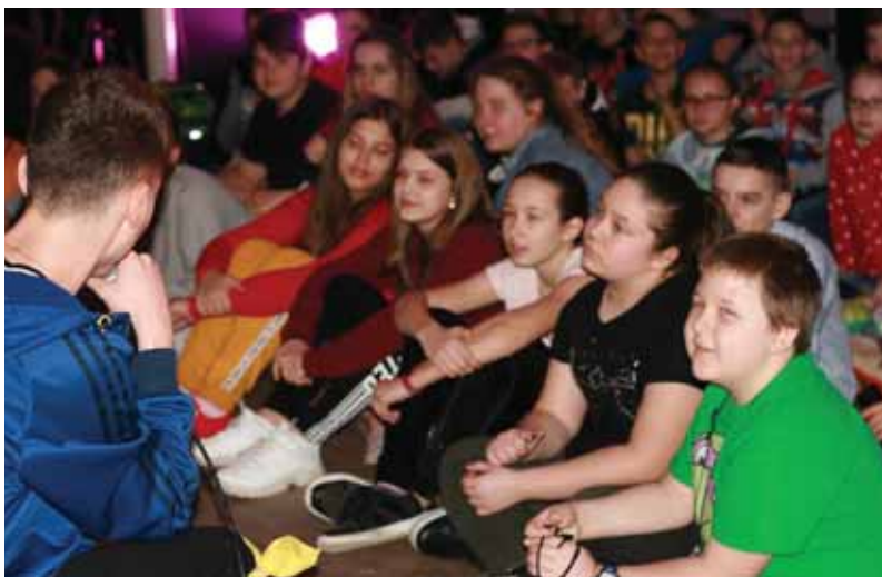
Počas nedávneho Svetového dňa poézie usporiadali knižniční pracovníci, pedagógovia, ale aj matičiari množstvo podujatí, kde zneli verše našich i zahraničných básnikov.