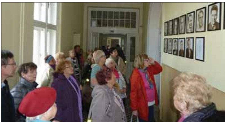
Návštevníkom veľa prezradia aj chodby archívu s portrétmi významných osobností.