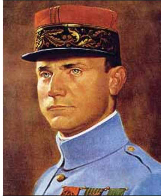
Každoročne si matičná verejnosť a mládež pripomína úmrtie M. R. ŠTEFÁNIKA na mieste jeho tragickej smrti v blízkosti Ivnky pri Dunaji.