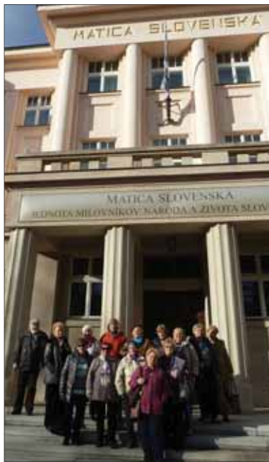
Účastníci exkurzie pred budovou Matice