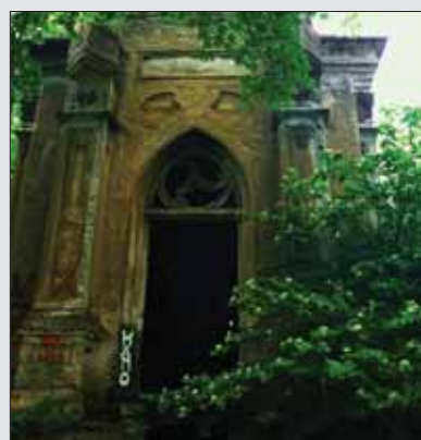
V takomto stave je na bývalom evanjelickom cintoríne v Košiciach národná kultúrna pamiatka – pohrebna kaplnka rodiny Pohle-Roth.