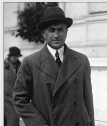
Diplomat Štefan OSUSKÝ

Čože krajan, rovno z Brezovej pod Bradlom, dnes by sme povedali spádovej obce Štefánikových Košarísk a okolitých kopaníc. Štefan Osuský, ani nie o desaťročie od Milana Rastislava mladší šuhaj, bystrý v škole, už ako maturant vedel okrem materinského jazyka (čo tiež nebola vtedy samozrejmosť) po maďarsky, nemecky, francúzsky a anglicky a ďalej sa jazykovo zdokonaľoval. Slovenčina však bola preňho po celý život lúbeznou piesňou – tak sa o nej vyjadroval aj v starobe, ktorú prežíval v ďalekej Amerike.