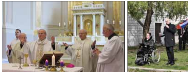
Atmosféra spomienky na svätého Metoda v Devíne a na slovenského Homéra – básnika Jána HOLLEHO v Bratislave