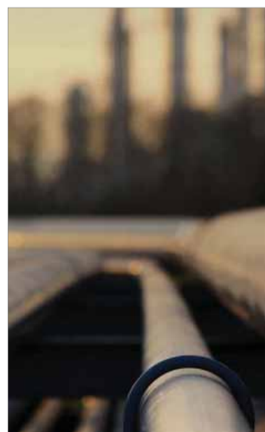
Budúcnosť plynovodu Severný prúd II. dočasne zahmlila požiadavka dánskych energetických orgánov ešte starostlivejšie preskúmať jeho projektové parametre a možný dosah tohto energetického nosiča na životné prostredie.

druhú alternatívnu trasu. Agentúra Moody's predpokladá, že to je pre Gazprom veľmi neprijemná situácia. Narastajú totiž riziká spojené s neskorým uvedením plynovodu do prevádzky, čo spôsobí veľké finančné straty. Posudzovanie žiadosti z Dánska môže trvať až niekoľko mesiacov. A po ňom nasleduje, ak by žiadosť bola posúdená kladne, niekoľko mesiacov samotnej výstavby. Posuny v čase určite oslabia obchodné pozície Gazpromu.