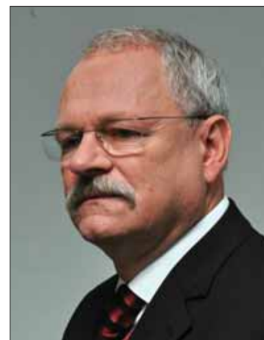
Ivan GAŠPAROVIČ bol hlavou štátu dve volebné obdobia.

Slovenská republika dobrovoľne vstúpila tak do Európskej únie, ako aj do NATO. Z týchto členstiev nám vyplývajú určité povinnosti, ale aj zodpovednosť. Pokiaľ ide o túto konkrétnu otázku, je to bilaterálna zmluva medzi SR a USA, ktorá je mimo NATO. Nedo- volím si jednoznačne ju hodnotiť, pretože som ju nečítal. Nevie, čo je v nej, viem len obrisy z debát. Ale môj názor je asi takýto. Odmietnuť vyše sto miliónov dolárov na úpravu našich vojenských letísk, ktoré zostanú na Slovensku, sa neodmieta. Druhá otázka