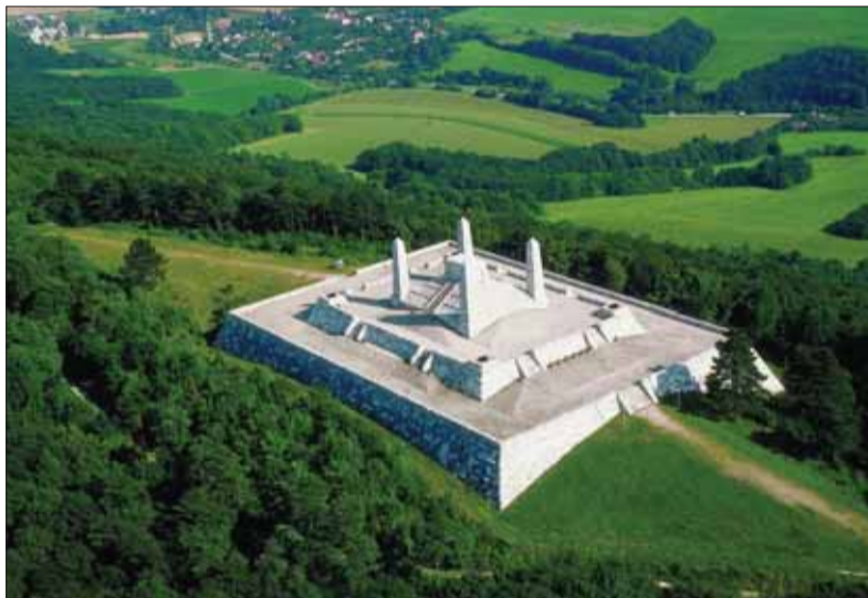
Mohyla Milanovi Rastislavovi ŠTEFÁNIKOVI na Bradle, ktorú svojmu priateľovi po tragickej smrti vyprojetoval a postavil architekt Dušan JURKOVIČ, je citlivo zasadená do prírodného prostredia a pôsobí monumentálnym dojmom.

Počas spomienkových slávností na sté výročie úmrtia Milana Rasti-