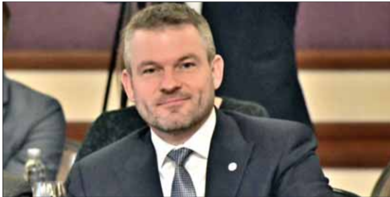
Pozvanie na návštevu USA a rokovania do Bieleného domu sa oficiálne považujú za uznanie partnerstva a tiež dôležitosť a kvalitu pozvaného.

USA sú pre slovenských exportérov desiatym najdôležitejším trhom. Americké spoločnosti patria medzi najvýznamnejších investorov na Slovensku a zamestnávajú dvadsaťtisíc pracovníkov. V rámci obrannej spolupráce sa partneri dotknú modernizácie Ozbromených síl SR a zvyšovania obranných výdavkov v súlade so záväzkami vyplývajúcimi z členstva SR