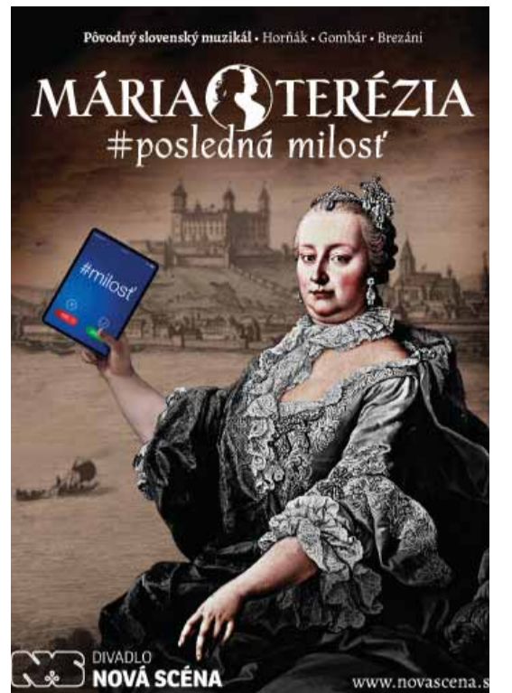
Propagačný plagát na muzikál

Práve nezorientovanosť diváka v príbehu a vo vzťahoch postáv a nejasná informovanosť o tom, čo sa pred ním odohráva, ho mátie a zahmlieva mu, na čo sa pozerá. Viditeľná a nesporná bola len tá „podivnosť“ – na kostýmy, scénu a tanec. Navyše, pri spievaných replikách a dialógoch dominovali decibely. Nezachránila to ani skladateľova melodická vynachádzavosť. Žiaľ, ani