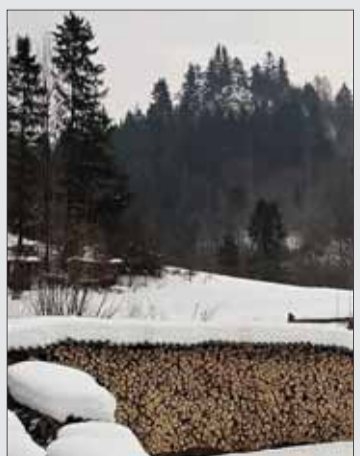
Nie je hriech tieto stromy páliť v peci? Koľko sa ich stratí v kotloch na tuhé palivo?