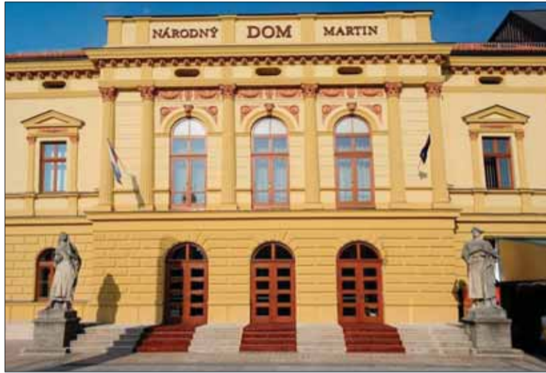
Mesto Martin je zákonom z roka 1994 vyhlásené za národné kultúrne centrum Slovákov, čo popri sídle našej národnej ustanovizne Matice slovenskej dokladá aj množstvo iných kultúrnych a architektonických pamiatok.

Strečna je každým rokom stále viac a viac nepriechodná. Tento problém donúti akúkoľvek vládu, aby sa ním intenzívne zaoberala. Martin týmto stráca. Po dokončení tunela Višňové