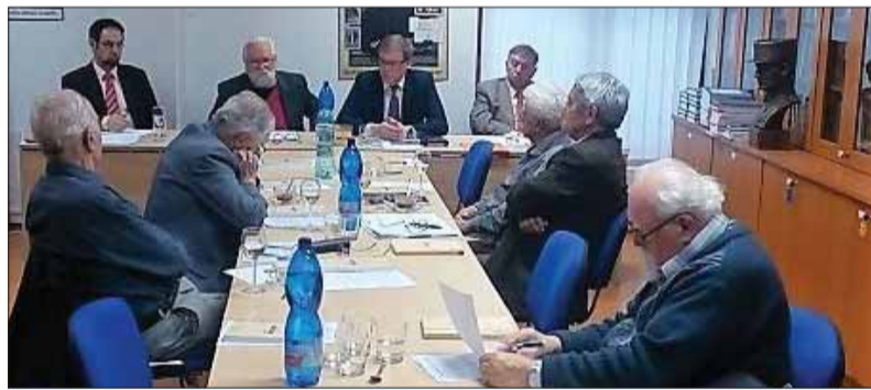
Významné osobnosti slovenského národa a oduševnení vlastenci v prezídium Matice slovenskej sa schádzajú na pravidelných rokovaniach pri riešení otázok ďalšieho fungovania MS ako poradný orgán jej predsedu.

Prezídium Matice slovenskej je podľa stanov MS jedným z poradných orgánov predsedu MS. Je zložené z významných osobností slovenského kultúrneho, politického a spoločenského života. Práve preto je pre predsedu MS jedným z dôležitých poradných orgánov v jeho rozhodovaní o ďalšom fungovaní MS. Tento rok zasadalo prezídium MS v utorok 19. februára 2019 v priestoroch MS v Bratislave.