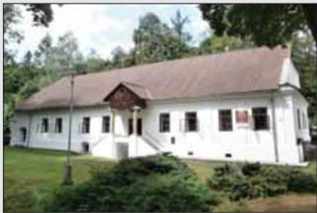
Galéria Márie MEDVECKEJ sa nachádza v klasicistickej kúrii v Tvrdošine-Medvedzom a tento rok vstúpila do štyridsiatej výstavnej sezóny.

kyne v októbri 1979 v budove tvrdošinskej klasicistickej kúrie. Oravská galéria v tejto svojej vysunutej expozícii vystavuje súbor jej stoosemdesiatich obrazov a takmer deväťdesiat kresieb. Od roka 2000 sa podkrovné priestory Galérie Márie Medveckej – výstavná sieň Ateliér – využívajú aj na krátkodobé prezentácie výtvarného umenia. Na aktuálnu jubilejnú štyridsiatu sezónu pripravila dramaturgia Oravskej galérie, ktorá bola v roku 2015 galériou roka na Slovensku, zo svojich zbierok výstavu diel Ernesta Zmetáka pri príležitosti stého výročia narodenia tohto jedného z najvýznamnejších slovenských výtvarných umelcov a zberateľov umenia.