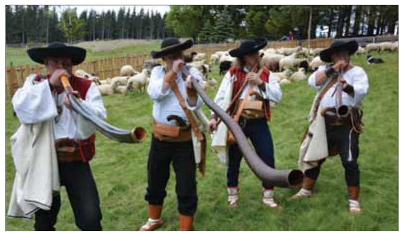
Autentické „zrkadlo“ slovenského folklóru má rôzne podoby, tóny, zvuky, ornamenty a farby, ale všetky sa na palete národnej kultúry zlievajú do prítlačného, inšpiratívneho obrazu.

„Ktože by si bol v roku 1948 pomyslel, keď videl tých pochodujúcich hlupákov, ktorí celý svoj rozum držali nad hlavou vo forme červenej zástavy, že skončí bez majetku, na desaťročia v žalári či rovno na popravisť?“ povedal na úvod. A pokračoval: „No a majstri pokroku aj s ich červenými zástavami sú späť! Pomaly, nebadane, ani nevieme ako a opäť sú ich plné noviny či internet. A opäť nemajú najmenšie zábrany hlásať svoje hlúposti.“ Ďalej uviedol niekoľko konkrétnych príkladov preto, „aby sme podržali v pamäti verejnosti spomienku na nezmyselný režim a jeho obeť. Robíme tak hlavne preto, aby k niečomu takému, čo sme tu zažili za čias ‚budovania socializmu‘, už nikdy nedošlo. Aby sme upozornili na konkrétnosti aj aby sme ukázali na to, že zločiny sa nedajú len tak ľahko zamiesť pod koberec. Aby sa obyčajní ľudia nemuseli opäť báť o svoj život, ak sa odmietnu pridať na stranu vrahov.“