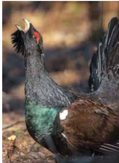
Bezohľadnosť, nevšímavosť aj sebeckosť vyháňajú z našej prírody jej najkrajšie tvory... Tetra hlucháňa je žalostný príklad.

rezort bude požadovať od ministerstva vnútra voči zamestnancom okresných úradov, odborov starostlivosti o životné prostredie aj discipli-