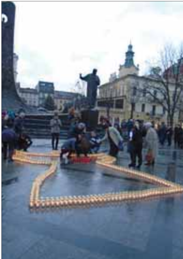
Kyjev po tieto dni, keď si jeho obyvatelia pripomínajú piate výročie dramatických, tragických dní na Majdane.

Svojským úvodom k spomienke na piate výročie udalostí na Majdane, ktorým súčasný režim chce