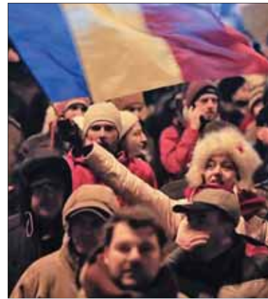
Rumuni prijali predsedníctvo EÚ s nadšením, ale každé nadšenie raz pomínie po konfrontácii s neúprosno realitou – a tá rumunská nie je veru radostná!

Úbytok obyvateľstva nie je malý; od roka 1989 tri až štyri milióny Rumunov, pätina právoplatného obyvateľstva, opustilo štát, väčšina z nich natrvalo.