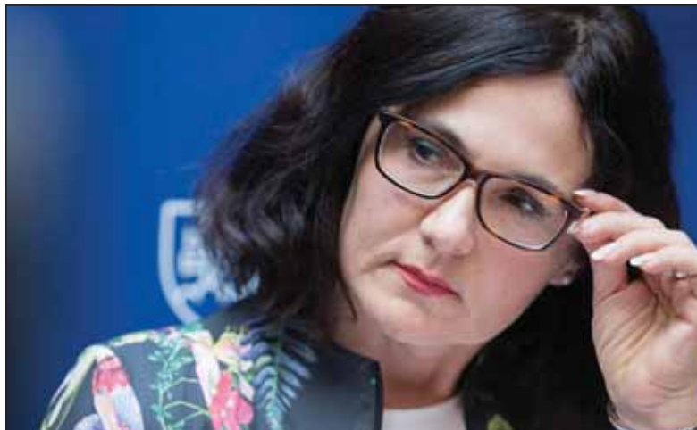
Ministerka LUBYOVÁ je všestranne disponovaná odborníčka s vynikajúcou manažérskou výstavou, ktorú prínosne uplatňuje pri riadení rezortu školstva.

Áno, už som tu osemnásť mesiacov a som na to pyšná. Naozaj je škoda, že