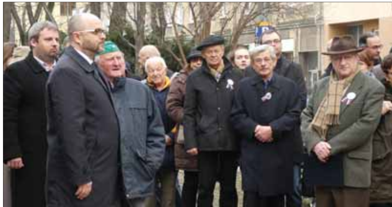
Funkcionári organizácií politických väzňov, Ústavu pamäti národa aj viacerí poškodení perzekúciami komunistického režimu počas pietnej spomienky na Jakubovom námestí v Bratislave.