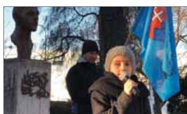
Na slávnostnej spomienke na spisovateľa a činovníka Matice slovenskej Jozefa Cigera Hronského vo Zvolene účinkovali aj účastníci súťaže Šaliansky Mat'ko v recitácii jeho povestí.

Matičiari a niekoľko vlastenci si 22. februára v Parku Ľudovíta Štúra vo Zvolene pripomenuli 123. výročie narodenia Jozefa Cigera Hronského (1896 – 1960). Hronského zvyknú označovať aj ako filozofického mediátora, čo vystihuje i názov jednej z jeho esejí – Lepšie začať svetielko ako prekĺňať tmu... Je v nej aj táto podnetná myšlienka a možno aj odkaz pre súčasníkov: „Dobrá myšlienka má nesmiernu moc, nezastaví ju