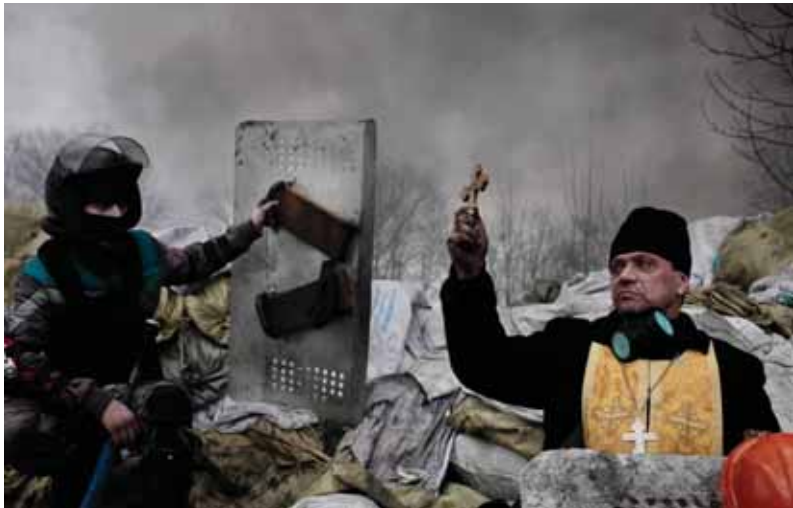
Pravoslávny pop žehná zasahujúcim príslušníkom bezpečnostných síl, z ktorých sa ojedlho stanú obeť bezprecedentnej masovej vraždy – tá ani po piatich rokoch nie je objasnená – kto inicioval strelbu v uliciach ukrajinského hlavného mesta a kto boli strelci, čo zabíjali aj nevinných civilistov?

účastníci zapálili sviečky vyskladané do podoby anjela, a mestská rada pred historickou radnicou umiestnila výstavu pripomínajúcu revolučné dni. Plagatiky s podobizňami hrdinov „Nebesnej sotne“ sa objavili dokonca aj vo výkladoch obchodov a predajni. Spoločným znakom týchto podujatí bola však nízka účasť verejnosti, čo signalizuje, že heroický mýtus majdanskej revolúcie sa medzi obyvateľstvom pomaly stráca pod záplavou nových starostí, existenčných problémov, ako aj v dôsledku postupnej samokompromitácie vodcov Majdanu, ktorí už stihli ukázať, že nie sú oveľa schopnejší (skôr naopak) a čestnejší ako ich zosadení predchodcovia.