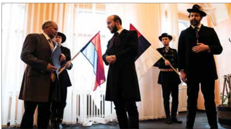
Divadelný kolektív Janka Jesenského predviedol v košickom Dome MS dramatiáciu udalostí z meruósmych rokov pod názvom Štúr a Hurban s nami!