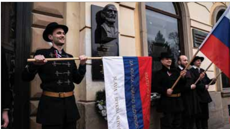
Matičiari pod historickými zástavami pri buste Jozefa Miloslava Hurbana na Hlavnej ulici v metropole východu