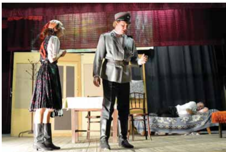
Snímka je z poslednej uvedenej úspešnej hry Truc na truc, alebo čary a kúzla.