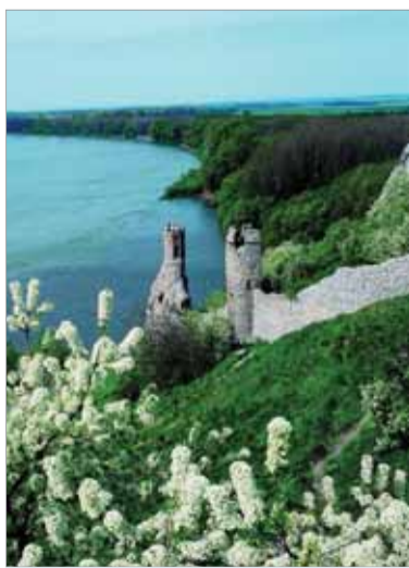
Nový Malokarpatský národný park má zahŕňať aj Devínsku Kobylu s hradom Devín.

ných parkoch a v najhodnotnejších územiach v rámci chránenej oblasti Malé Karpaty by mnohé z nich bolo možné začleniť do nového národného parku. „Išlo by o národný park nového typu, ktorý by v sebe od začiatku