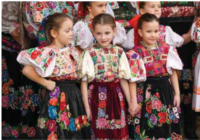
K tradičnému folklóru má stále bližšie aj najmladšia generácia, čo je záruka jeho zachovania a napredovania.

aj ľudovým umelcom či umeleckým remeselníkom. Začiatkom marca sme sa stretli za účasti médií v Očovej, v rázovitej podpolianskej obci, veľmi živej na folklórne tradície, kde sme predstavili náš spoločný zámer.