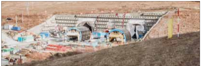
Tunelové rúry v úseku Višňové – Dubná Skala si na motoristov ešte počkajú.

„Nový zhotoviteľ vzide z transparentnej súťaže, v ktorej nastavíme konkrétne transparentné podmienky, pričom rýchlosť dostavby bude jedným z kritérií. Vyhlásenie novej súťaže predpokladáme v horizonte niekoľkých mesiacov, keďže údaje z inventarizácie stavby budú tvoriť súčasť súťažných podkladov,“ informovala verejnosť Michaela Michalová, hovorkyňa NDS.