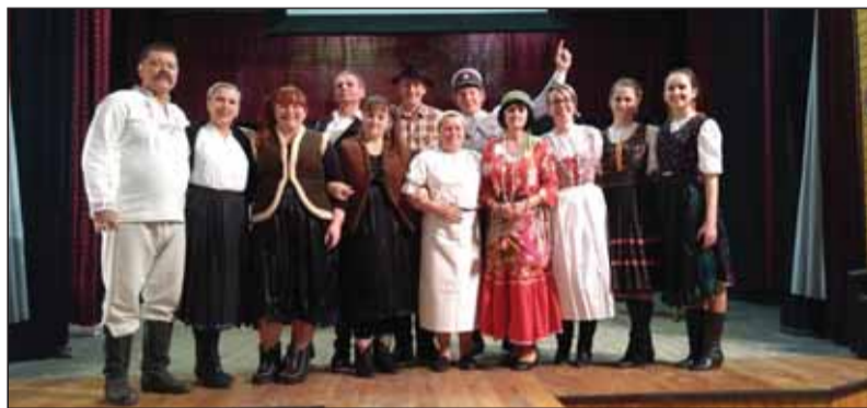
Divadelným ochotníkom v Skýcove tleskajú vďační diváci už celé jedno štvrtstoročie.