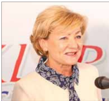
Ministerka Ľubica LAŠŠÁKOVÁ

Záujem pána premiéra o túto formu umenia je úprimný a stotožnil sa s mojím presvedčením, že folklór si zaslúži väčšiu pozornosť od štátu. Na svojich výjazdoch po celom Slovensku sa stretávam priamo s ľuďmi, ktorí sa tejto autentické formy národného dedičstva venujú s nadšením a zo srdca. Som rada, že v tejto téme sme našli zhodu a spoločne tak prichádzame s projektom, ktorý môže pomôcť množstvu folklórných súborov a skupín, ale