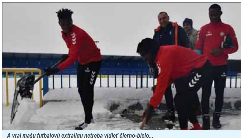
A vraj mašu futbalovú extraligu netreba vidieť čierno-bielo...

Prečítal som si Čomajov úvodník o cudzincoch v našej futbalovej lige a hovorím si: Konečne to niekto napísal! Je to do neba volajúce! A to je rozhodne aj príčina, prečo som prestal chodiť na futbal. Na chalupe v Recí podpíchnem susedov, kedy si aj ich mužstvo Poľnohospodár Reca kúpi nejakého černoča, napríklad z Mali, veď tam už bol aj náš pán prezident. Napriek tomu cez gogolovský úsmev pripomínam, že Slovan sa drží svojho mena – okrem neja-