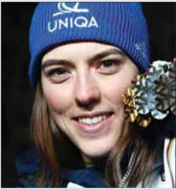
Petra VLHOVÁ sa v alpskom lyžovaní zaradila medzi absolútnu svetovú špičku.

Už v tomto veku sa zapísala nielen do národnej, ale aj svetovej športovej histórie, keď na jedinom vrcholnom podujatí v alpskom lyžovaní jej na hrudi zasvietili medaily všetkých troch farieb. To nedokázala v tomto športovom odvetví nijaká lyžiarka a pred Petrou sa to podarilo jedine predvlani fenomenálnemu rakúskemu pretekárovi Marcelovi Hirscherovi.