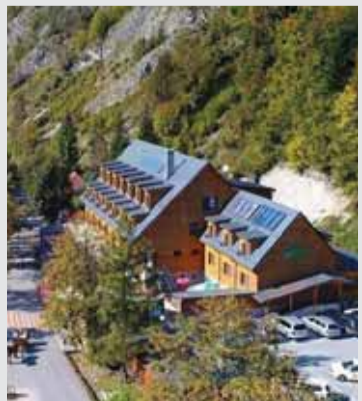
SNS navrhuje výrazné zníženie DPH na ubytovacie služby, čo má pomôcť rozvoju turistického ruchu na Slovensku.