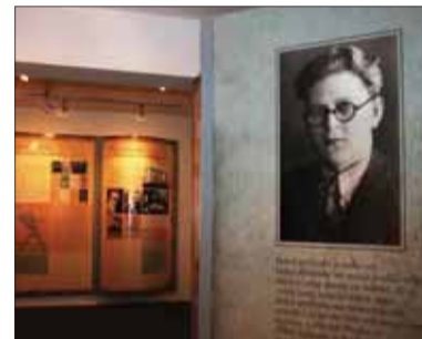
Takmer všetky školské exkurzie do Martina smerujú aj do Múzea Jozefa Cigera Hronského.

tvorby. Priamo v sídelnej budove Matice slovenskej sa oboznámili s jej históriou, poslaním a činnosťou, ktorú vykonávala v minulosti aj dnes. Cestou do Liptovského Mikuláša sa zastavili i v obci Černová, rodisku Andreja Hlinku, kde je na obecnom cintoríne pomník tým, čo zomreli pri smutne známej udalosti pri vysviacke tamojšieho