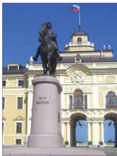
Rokovania slovenskej a ruskej delegácie o ďalšej spolupráci v ekonomickej oblasti sa uskutočnili v reprezentatívnych priestoroch Kongresového (Konštantínovho) paláca neďaleko Petrohradu, ktorého dejiny siahajú až k Petrovi I.

v Konštantínovskom paláci v Petrohrade. Minister zahraničných vecí a európskych záležitostí SR Miroslav Lajčák, ktorý v tomto roku zastáva aj funkciu úradujúceho predsedu Organizácie pre bezpečnosť a spoluprácu v Európe, rokoval v Petrohrade so svojim ruským partnerom Sergejom Lavrovom. Prediskutovali široký okruh tém s dôrazom na slovenské predsedníctvo v OBSE v roku 2019 a jeho priority, ktoré sú zamerané najmä na riešenie konfliktov na území niektorých účastníckych štátov tejto organizácie. Osobitnú pozornosť venovali situácii na východe Ukrajiny vrátane možnosti zlepšenia životných podmienok