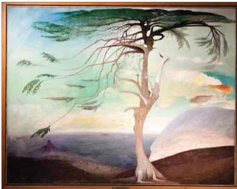
Teodor KOSZTKA-CSONTVÁRY – Osamelý céder