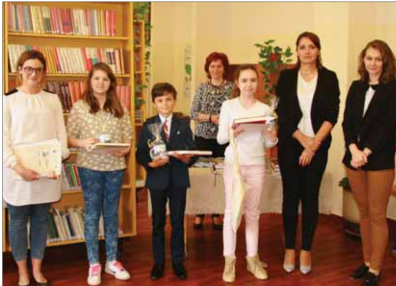
Najtalentovanejší spomedzi básnikov slovenského romantizmu Janko Kráľ inšpiroval zlatomoravských matičiarov k tomu, aby na jeho počesť už po tretí raz pripravili recitačnú súťaž.

Presne v deň spomienky na básnikovu smrť sa v Mestskej knižnici v Zlatých Moravciach uskutočnil tretí ročník v prednese jeho poézie a prózy. Vyhlasovateľom a organizátorom