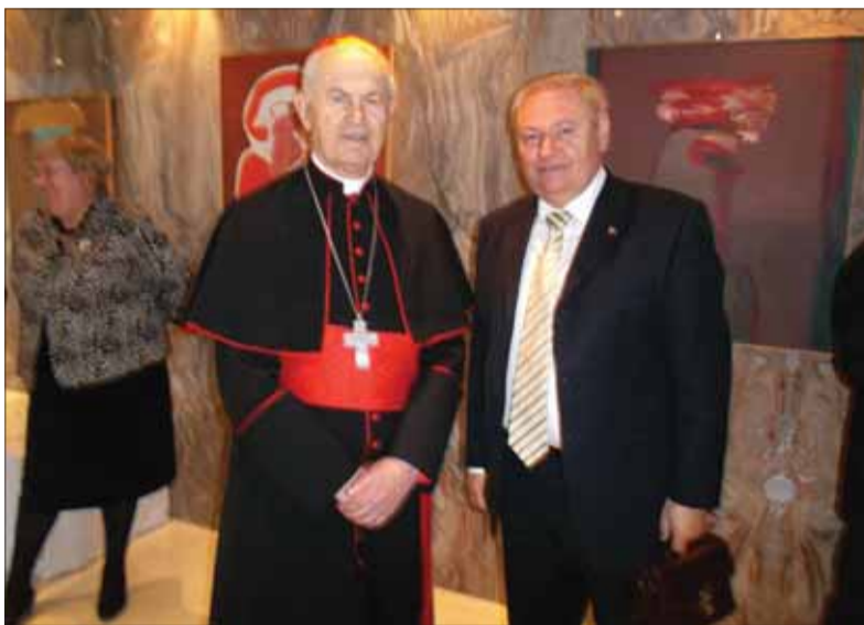
Dlhoročné pôsobenie v exponovanej štátnej pozícii znamenalo pre sekretára Kancelárie prezidenta SR prípravu a zabezpečenie mnohých významných návštev aj prijatí a stretnutí s mnohými významnými svetovými osobnosťami – ako povedzme s kardinálom Jozefom TOMKOM.

návrhu programu až po jeho definitívne schválenie, pričom sa museli zladit' všetky protokolárne požiadavky a zvyklosti každého štátu. Teda na základe schváleného programu sa pripravovali obsahové materiály