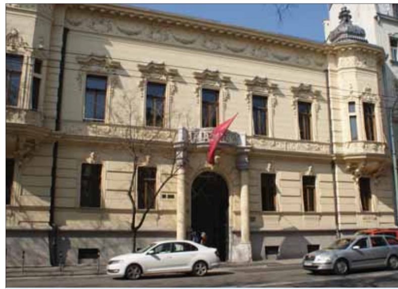
Pistoriho palác, nekdajšie sídlo Domu zahraničných Slovákov

Je smutné, že ministerstvo, ktoré po novembri '89 pripravilo prvý návrh vládneho zákona o zahraničných Slovákoch a presadzovalo jeho prijatie v parlamente, sa po dvoch desaťročiach správa, akoby takáto povinnosť preň nejestvovala!