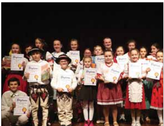
Vynikajúce spevácke výkony charakterizovali už XXIV. ročník súťaže žiakov v speve ľudových piesní Matičný sláviček, ktorú pripravili matičiari v Trstenej spoločne s tamojšou Základnou umeleckou školou, a zúčastnilo sa na nej takmer sto malých spevákov.

Dom kultúry v Trstenej patril 15. mája malým spevákom, ktorí súťažili na XXIV. ročníku súťaže v speve ľudových piesní Matičný sláviček 2019. Podujatie zorganizovali miestni matičiari spoločne so Základnou umeleckou školou v Trstenej. Na súťaži sa zúčastnilo štyridsaťšesť detí zo ZŠ v Čimhovej, Hladovke, Liesku, Podbieli, Vitanovej, Zuberci, domácich ZŠ R. Dilonga, P. O. Hviezdoslava a Š. Šmálika, z Nižnej, zo Suchej Hory, z Gymnázia Tvrdošín a zo ZUŠ Nižná.