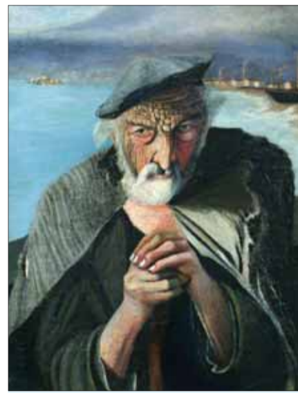
Teodor KOSZTKA-CSONTVÁRY – Starý rybár