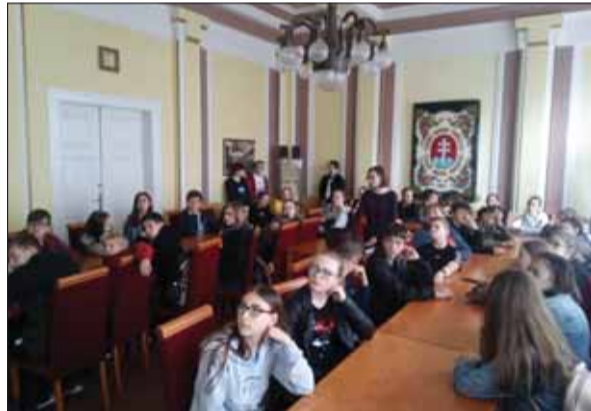
Školáci zo Zemplína nemerajú dlhú cestu do Turca a na Liptov nadarmu. Ich vedomosti o Matici slovenskej, Národnom cintoríne v Martine, tragédií v Černovej aj o bojoch v II. svetovej vojne na Liptove obohatila nedávna exkurzia.