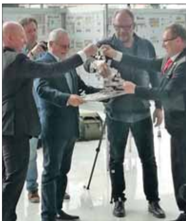
Krst príležitostnej známky k 50 výročiu Zväzu slovenských filatelistov.

Súčasťou podujatia bolo aj vyhodnotenie ankety o najkrajšiu známku roka 2018. Podľa vyhlásenia výsledkov predsedom M. Ňaršíkom najväčší počet hlasov a prvé miesto obhájila poštová známka Ikonu Krásnobrodskéj Bohorodičky, druhé miesto získala poštová