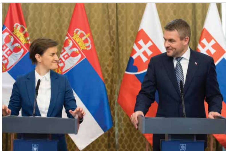
Predseda vlády SR Peter PELLEGRINI a jeho srbský náprotivok premiérka Anna BRNABIĆOVÁ počas slávnostného aktu prijatia pred vládnym Palácom Srbiya v Belehrade treťieho mája tohto roka

Srbské médiá o udalosti pomerne obsérne informovali. Za najvýstižnejšie zhretnie tejto udalosti, ale aj významu Slovenska pre dnešné Srbsko možno považovať výrok premiérky Anny Brnabićovej, ktorá uviedla: „Nemáme mnoho priateľov a partnerov, akým je Slovensko.“ Podľa Brnabićovej vzťahy medzi oboma krajinami sú dobré, priateľské, čo sa stále viac odráža aj v hospodársko-ekonomickej spolupráci, na rozširovanie ktorej sa obe krajiny v budúcnosti zamerajú. Podľa štatistiky sa celkový hospodársky obrát za minulý rok vyšplhal na päťstošesťdesiatšesť miliónov eur, čo predstavuje zvýšenie o desať percent oproti roku 2017. Za jedinou otvorenú otázku označila premiérka Brnabićová problém srbského dlhu voči Slovensku, ktorý sa však doriešil práve počas návštevy premiéra Pellegriniho. Slovensko veľkorysým gestom časť dlhu odpustilo s tým, že