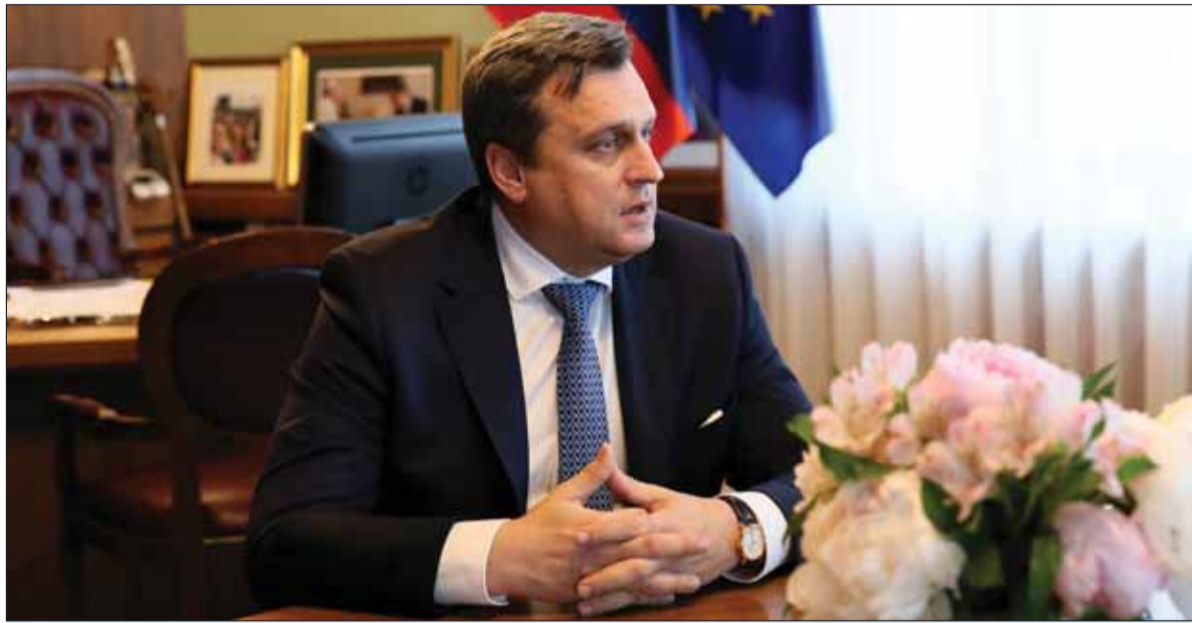
Predseda NR SR a predseda SNS Andrej DANKO je presvedčený, že Slovensko nemôže vstupovať do takých zmluvných záväzkov, ktoré by poškodzovali suverenity Slovenskej republiky a nastrobovali dôveru našich dlhodobých partnerov i spojencov.

Prijatím zákona o politických stranách som chcel zabrániť drobeniu a rozštiepeniu politických strán. Na Slovensku máme viac politických strán, ako napríklad v Ruskej federácii alebo v Brazílii. Podarilo sa nám zaviesť systém, že každá politická strana, ktorá má podľa zákona nárok na príspevok zo štátneho rozpočtu, musí ho použiť len na jej politickú činnosť. Máme tu politické strany, ktoré si zo štátnych príspevkov nakúpili vlastný nebytový priestor, prípadne pozemky. Sú to neefektívne a neadresne vynaložené peniaze. Ja za Slovenskú národnú stranu viem zdokladovať každé euro, ktoré ide na jej