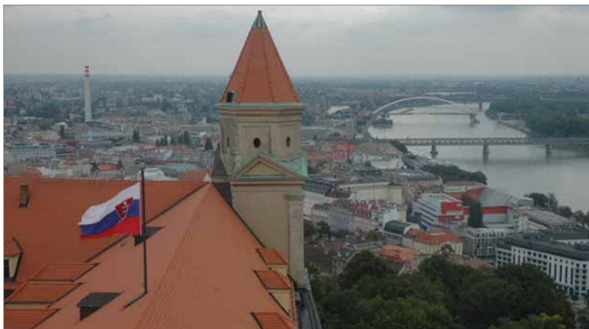
Možno politický pat, v každom prípade však výrazný nástup nových politických subjektov s neskrývanou ambíciou po vláde sa čaká na bratislavskom hradnom kopci.

Zatiaľ to vyzerať tak, že súčasná protivládna opozícia nechce mať nič spoločné so súčasnými vládnymi stranami. Jej snahou bude vo voľbách získať väčšinu. To sa jej síce môže podariť, ale len