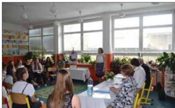
Dilongova Trstená mala aj v tomto roku vysokú úroveň a dobrý ohlas u publika.

Umelecké slovo prináša krásu do života každého človeka, a ak má pridanú hodnotu duchovného obsahu, priťahuje interpretov i poslucháčov o to viac. Nečudo, že na XXVIII. ročníku súťaže v umeleckej recitácii slovenskej a svetovej spirituálnej poézie a prózy pod názvom Dilongova Trstená, ktorý sa uskutočnil 9. júna v básnikovom rodisku, sa zúčastnilo vyše sto recitátorov a prednášateľov.