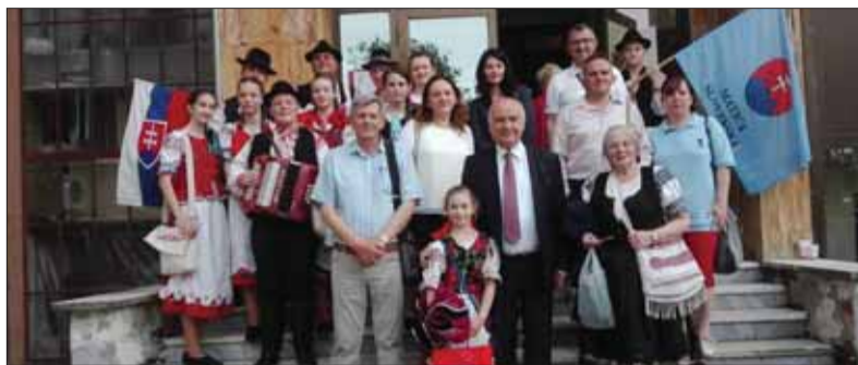
Členovia MO MS v Čakajovciach na družobnej návšteve v Osijeku

Už desať rokov Miestny odbor Matice slovenskej v Čakajovciach rozvíja družobnú spoluprácu s Matice slovenskou Osijek v Chorvátskej republike. O rok neskôr sa k tejto spolupráci pripojil aj Miestny