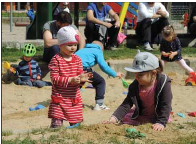
Prudký pokles sobášnosti a pôrodnosti v celej Európe spôsobuje vrások demografom, ktorí nabádajú na zmenu neradostného vývoja.

To, čo prichádza, je stagnujúci alebo v horizonte niekoľkých dekád klesajúci počet obyvateľov. Populačné starnutie už je, a aj bude najviac relevantnou črtou budúceho demografického vývoja. Ďalej sa bude zvyšovať priemerný vek, počet neproduktívnych osôb vzhľadom na počet osôb produktívnych, index starnutia. Konferencia konštatovala, že populačné starnutie je nezvratné a nastane s pravdepodobnosťou hraničiacou s istotou. Výrazné regionálne rozdiely v demografickom vývoji sú taktiež fundamentálnou črtou demografického vývoja na Slovensku. Urýchlene musíme mať jednoznačnú, koherentnú a najmä reálne aplikovateľnú populačnú politiku – to znamená systémový súbor opatrení zameraný na ovplyvnenie populačného vývoja prostredníctvom sociálnej, rodinnej, migračnej, bytovej i zdravotnej politiky. Populačná politika sa týka aj priamych a nepriamych pronatalitných opatrení. Hoci efektívnosť pronatalitných opatrení je obmedzená, treba ich uskutočniť, pretože aj nárast úhrnnej plodnosti o 0,1 dieťaťa