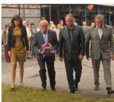
Predstavitelia mesta Liptovský Mikuláš a Maticie slovenskej kladú veniec k symbolickému miestu, ktoré pripomína prijatie Ústavy SR.