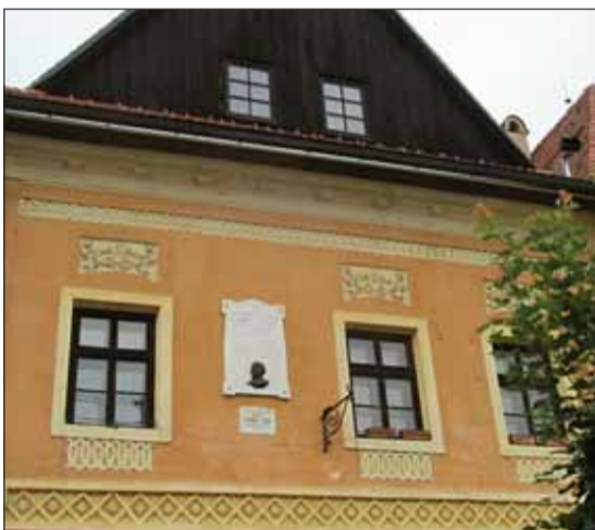
Priečelie rodného domu skladateľa Bélu KÉLERA v Bardejove

Napokon mu k vysnivanému hudobnému životu napomohla náhoda: švagor v Haliči, u ktorého pracoval na veľkostatku, na následky vyčinenia prírodných