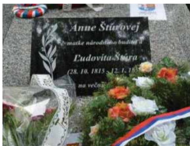
Hrob matky Ľudovíta Štúra v Trenčíne bol v dosť žalostnom stave, kým sa oň nezачali starať miestni matičiari.

Napriek tomu, že Trenčín je rodiskom mnohých významných osobností slovenskej histórie, mesto si akosi nevie adekvátnym spôsobom uctiť ich celoživotné dielo. To platí aj v prípade matky nášho kodifikátora spisovnej slovenčiny Ľudovíta Štúra, bez ktorého by sme ako národ dnes azda ani neexistovali.