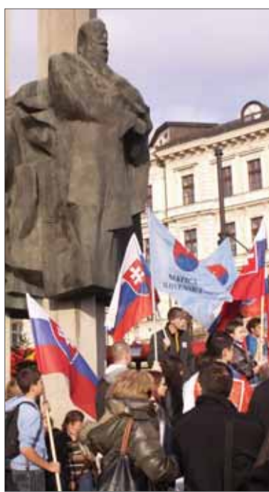
Bráňme si vybojované, bráňme si náš štát...

„O kľúčovom význame osobností pre národ a dejiny žiadny vzdelaný a rozumný človek nepochybuje. Je to nesporný fakt. Skutočná osobnosť sa však – na rozdiel napríklad od dobrodruhov a hazardérov – vyznačuje vysokou nielen osobnou, ale aj spoločenskou zodpovednosťou, a tým sa stáva vzorom či dokonca uznávanou autoritou