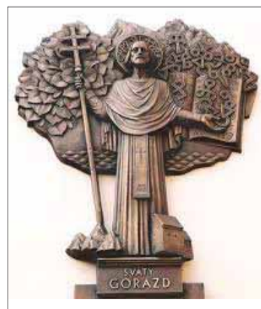
Reliéf sv. Gorazda od majstrov Mariána a Tomáša Polonských

Organizátormi tohoročnej bratislavskej spomienky boli Gréckokatolícka cirkev, Bratislavská eparchia, Matica slovenská v Martine, Spoločnosť svätého Gorazda, Bratislava, Rada Konferencie biskupov Slovenska pre