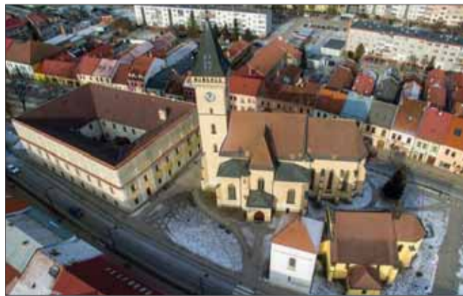
Sabinov v stredoveku patril medzi hospodársky prosperujúce mestá a spoločne s Košicami, Prešovom, Bardejovom a Levočou vytvoril záujmové, spolupracujúce združenie Pentapolitána, ktoré dosiahlo nezvyčajný ekonomický a spoločenský význam.

Okresné mesto Sabinov nájdeme ani nie desať kilometrov severozápadne od Prešova. Rozprestiera sa na periférii Spišsko-šarišského medzihoria, hraničiaceho s rozsiahlym podkovovitým horstvom Bachureň s rovnako nazvaným najvyšším vrchom. Výhodnú polohu a celkovú prírodnú scenériu dotvára pohorie Čergov vo forme výrazne sformovanej bariéry smerom na východ.