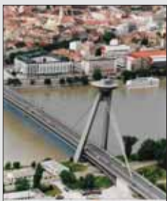
Americké noviny referujú o našom hlavnom meste priaznivo.

Tento žurnalista porovnáva a tvrdí, že hlavné mesto Slovenska patrí k najrýchlejšie sa meniacim mestám v Európe a jeho prítlačivosť sa každým rokom rapídne zväčšuje. V úvode porovnáva svoje dojmy: „Bratislava, hlavné mesto Slovenska a kedysi večerami takmer mesto duchov, je jedným z veľkých prekvených miest nedávnych čias... Ak tu však máte stráviť len niekoľko hodín, neváhajte a zamierte hneď do Starého Mesta a Podhradia, potulíte sa po uliciach a na záver výletu zájdite na jednu z nádherných vyhládok: Vystúpte na ploštinu piliera nového mosta ponad Dunaj alebo na Hrad.“