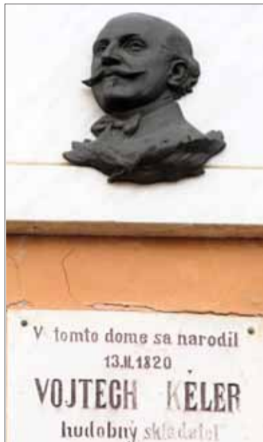
Detail pamätnej tabule