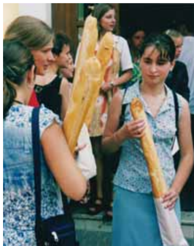
Nielen chlebom je človek živý – pripomína ľudová múdrosť, a rovnako stále platná najmä pre školákov je aj ďalšie: „Ohýbaj ma mamko, ... Výsledky našich žiakov napovedajú, že akosi málo sa na to myslí v laviciach aj za katedrami...“

Lenže správanie, konanie ľudí v spoločnosti veľmi nepomáha výchove mladých ľudí vo veku od šiestich do devätnástich rokov, ktorí v rukách