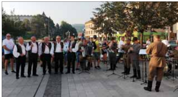
Na zvolenskom hlavnom námestí pripravili matiční organizátori 28. augusta nielen pietny akt kladenia vencov a vystúpenie súborov, ale aj pútavú dramatickú udalosť pred sedemdesiatimi rokmi.

Matica slovenská si tento rok pripomenula výročie Slovenského národného povstania (SNP) nezvyčajnou formou – priamou účasťou na centrálnych oslavách v Banskej Bystrici. Matičiari sa zúčastnili už na pietnych aktoch vo Zvolene 28. augusta 2019 a na druhý deň počas štátneho sviatku priamo v Banskej Bystrici-Kremničke. Súčasťou programu i pripomenutie významnej udalosti v dejinách nášho národa bola už na úvod prísaha slovenskej partizánskej brigády Za slobodu Slovanov v podaní matičných divadelníkov a mladých matičiarov.