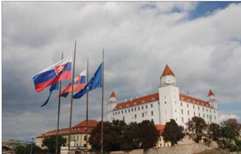
Občania Slovenska pripájali vlajku európskeho spoločenstva k svojmu národnému symbolu s nádejou na lepší život, ale stále zreteľnejšie smerovanie k európskemu superštátu s rozhodovacím dirigizmom a oslabovanie národnej suverenity ich proeurópsky optimizmus značne oslabuje.

Strednú Európu, ktorú predstavujú krajiny Vyšehradskej štvorky, považujú