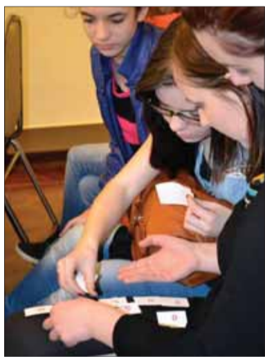
Písmenko po písmenku, slovo k slovu, múdrosť k múdrosť – takto by sa mala od vstupu do školy formovať vnímavá detská duša, lenže reálny život je často o inom.

jeho vyjadrenie (z osemdesiatych rokov 20. storočia), v ktorom zdôraznil, že najmä „... kultúrnosť človeka podmieňuje aj také veci, ako je plnenie... pracovných povinností“. Dá sa to aplikovať na akúkoľvek komunikáciu človeka s človekom, pretože prostredníctvom vysloveného slova každý prejavuje svoj vzťah k partnerovi v komunikácii. Tu aj školská prax by mala väčšiu pozornosť venovať tvorbe jazykových prejavov vo vzájomnom napätí osi pravdivosti – nepravdivosti, logickosti – nezmyselnosti, spriazračovaniu – zahmlievaniu podávanej informácie. Žiaľ, pri viacerých komunikačných aktivitách tzv. novinárov sa dôsledne nerespektujú, resp. vôbec nerespektujú určité normy