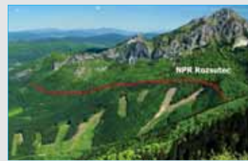
ŠOPSR – Výrubu v Národnom parku Malá Fatra