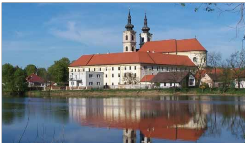
Mesto Šaštín-Stráže s národnou svätyniou Bazilikou Sedembolestnej Panny Márie sa stalo na Slovensku dominantným pútnickým centrom.

Istú kontinuitu všeobecnej mariánskej úcty šírenej práve byzantskou misiou s neskoršou úctou k Sedembolestnej Panne Márii vyzdvihol aj pápež Ján Pavol II. Ak sa nad tým zamyslíme, má to logiku, pretože príchod staromaďarských kmeňov na územie Veľkej Moravy neznamenal zánik pôvodného obyvateľstva. Časť veľkomoravských politických a kresťanských centier ostala nedotknutá a v sedemdesiatych rokoch 10. storočia sa aj arpadovské knieža Gejza obrátilo ku kresťanstvu. Vytvorili sa tým predpoklady na čiastočnú kontinuitu s predchádzajúcou veľkomoravskou tradíciou, na ktorú po svojom nadviazalo aj formujúce sa uhorské kráľovstvo. Prvý uhorský kráľ svätý Štefan stal sa ústrednou postavou mariánskej úcty, ktorú preukazovalo pôvodné staroslovenské obyvateľstvo. Tieto tvrdenia umocňuje ostrihomský arcibiskup Juraj Selepčeni. Vo svojom rukopise Historia Hungariae sa zmiňuje, že naši predkovia sprostredkovali staromaďarským kmeňom svoju vieru práve cez mariánsku úctu.