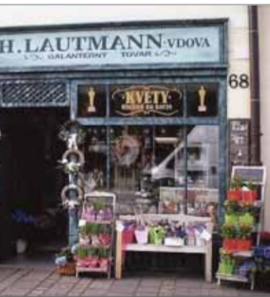
Pôvodne sa mali exteriéry filmu Obchod na korze nakrúcať v inom slovenskom meste, ale voľba napokon padla na „starosvetký“ Sabinov, ktorý viac vyhovoval. Aj keď teraz nájdeme v meste takýto obchod, ani jedna zo scén sa v ňom nefilmovala...

O niekdajšom významnom postavení Sabinova svedčí torzo zachovaného pevnostného systému, niekoľko obranných bástí a vretenovité námestie s radovou zástavbou pôvodných meštiackych domov. Centrum očarí súborom unikátnych stavieb, ktoré spolu s historickým jadrom boli vyhlásené za pamiatkovú zónu. Opätovný vývoj mesta nastal