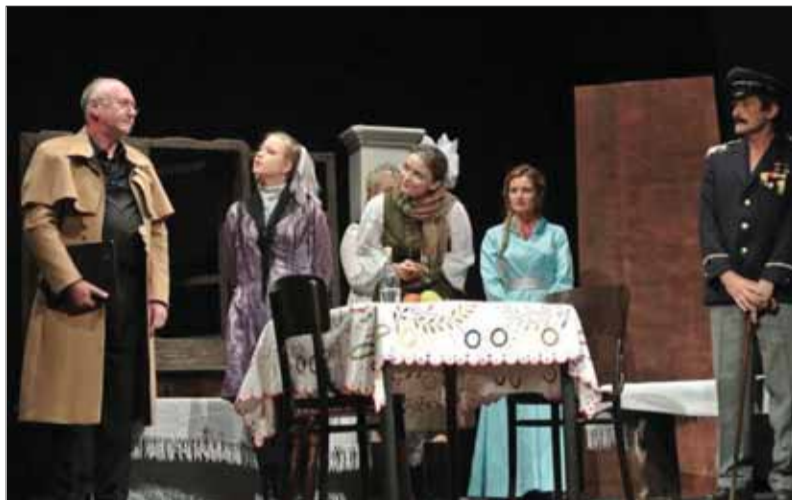
Divadelný festival to sú najmä scénické vystúpenia a výkony aktérov, ale tiež plodné debaty účinkujúcich s porotcami pri rozboroch jednotlivých predstavení. Taký bude aj štvrtý Divadelný festival Ivana Stodolu v Liptovskom Mikuláši, kam koncom septembra prídu divadelní amatéri z celého Slovenska.