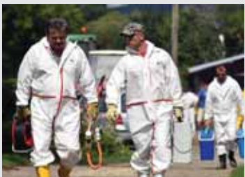
Doterajšie veterinárne opatrenia šírenie moru ošipaných neprekazili.

Veľmi vhodné by bolo, aby nosili reflexné oblečenie, najlepšie motoristami dobre známe vesty. Ide o cykloturistov, turistov, hubárov a psičkárov. Najmä posledné dve skupiny podstupujú vysoké riziko – hubári pri zohýbaní môžu pripomínať štvornohú zver a psičkári zas musia do dôsledku rešpektovať všetky bezpečnostné nariadenia pre pohyb so psom v tomto území.