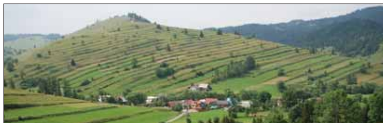
Vidiecke katastre a rozdrobené parcelky v nich na prvý pohľad dokladujú, že to s pozemkovými úpravami nebude také jednoduché.

Rozhodovať budú jednak takzvané vlastnícke kritériá, ako je počet parciel na jedného vlastníka, počet vlastníkov na parcelu, priemerný počet parciel na liste vlastníctva na hektár, podiel špeciálnych kultúr poľnohospodárskej výroby, podiel poľnohospodárskej pôdy bez špeciálnych kultúr či podiel lesných pozemkov v katastrálnom území. Medzi takzvané užívacie kritériá v katastrálnom území potom patria počty žiadateľov o priame podpory, viacnásobné