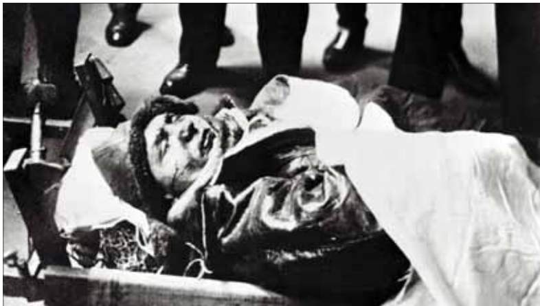
Telo mŕtveho generála Štefánika, ktorý sa ponáhal do vlasti vonkoncom nie na zdvorilostnú návštevu, ale s dôležitým poslaním, ktoré nemuselo byť vtedajším mocnostiam a ich predstaviteľom „po chuti“ a netešili sa na neho ani viaceré vládne špičky nového štátu Čechov a Slovákov.