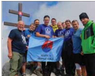
„Vrcholové družstvo“ mladých matičiarov a činníkov Matice na symbolickom tatranskom štíte

Ďalší program v popoludňajších hodinách prebiehal v ATC Račkova dolina. Tu sa okrem turistov, účastníkov výstupu a verejnosti zišli aj organizátori tohto tradičného podujatia. Pod moderátorským dohľadom sa prítomným