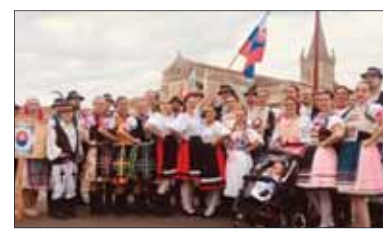
Súbor Slovenskí rebeli vo Francúzsku

publikácie MS. Do reprezentačného programu Komárňanskí rebeli zaradili tance z východného Slovenska, ale i z Horehronia a francúzskemu publiku predstavili aj náš typický zvyk čepčenia nevesty.