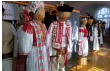
Kroje z matičnej šatnice

O pôvodné slovenské kroje z národopisnej Šatnice Matice slovenskej je čoraz väčší záujem. Po výstavách vo Vrútkach a v Novej Bani sa v auguste 2019 predstavili na výstave Party v 21. storočí v Bratislave a na Hontianskej paráde v Hrušove.