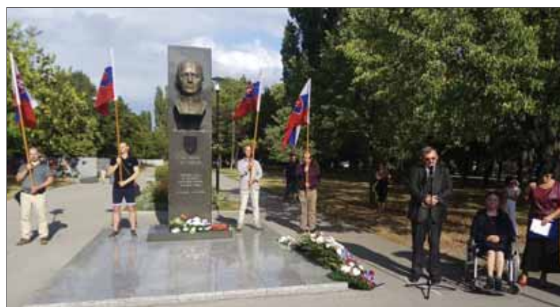
V bratislavskej mestskej časti Ružinov sa pri pamätníku Andreja Hlinku uskutočnila uprostred augusta spomienková slávnosť na otca národa.

Hlinka nie je medzi nami. Už osemdesiatjeden rokov Slováci, ktorí majú radi svoju vlasť, svoj národ, svoj jazyk, svoju kultúru a svoje bytie, spomínajú na Andreja Hlinku ako na otca národa. Keď ho na Nitrianskych slávnostiach vypli, tak povedal, áno techniku môžete vypnúť, ale Andreja Hlinku nevympnete