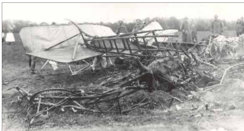
Rozbité a zhorené lietadlo Caproni 450 na mieste katastrofy v katastri Ivanke pri Dunaji, ktorú sa oficiálne miesta a propaganda už sto rokov usilujú vykresliť ako zhodu nešťastných okolností, ba dokonca ako zlyhanie posádky.

Ani štvrt' slova o tom, kto bol Štefánik naozaj. Významný astronóm na vrchole svetovej vedy, v prvej svetovej vojne za tri roky urobil závažnú kariéru z vojaka na generála. Zozbieral armádu dobrovoľníkov väčšiu ako Alexander Veľký a postavil sa s nimi