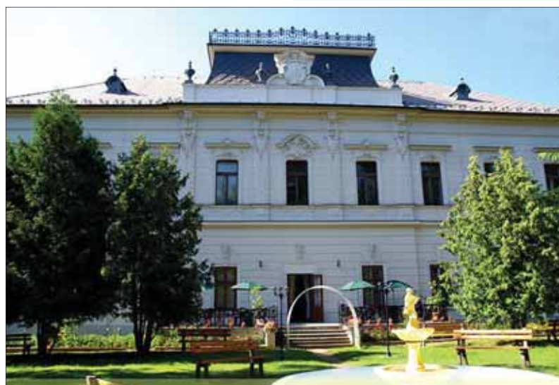
Kaštieľ v Pribeníku predstavuje dobrou predstavu panstva o pohodlnom, ale aj účelnom živote, aj keď sa okolité hospodárske stavby v jeho areáli nezachovali.