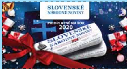
Náhľad na darčekovú poukážku

TELEFÓN: + 421 43/38 12 838, +421 918 904 925 MAIL: snnredakcia@matica.sk WEB: www.snn.sk , https://snn.sk/redakcia/predplatne-2