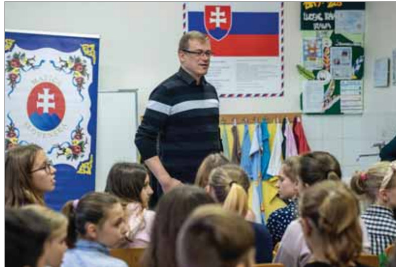
Matica slovenská v uplynulom období stavila na bezprostredné stretnutia s mládežou pri približovaní historických medzníkov a osobností národných dejín a tento trend prináša pozitívne výsledky.

• Tlačiareň Neografia, a. s., tiež prináša do matičného roz-