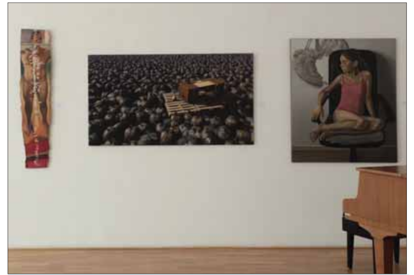
V Senici vystavovalo vyše tretiny absolventov banskobystrickej Fakulty výtvarných umení vedenej profesorom HOLOŠKOM. Na snímke časť vystavených diel.

Pavol Holeštiak zostavil reprezentatívnu publikáciu o exulantskom literátovi