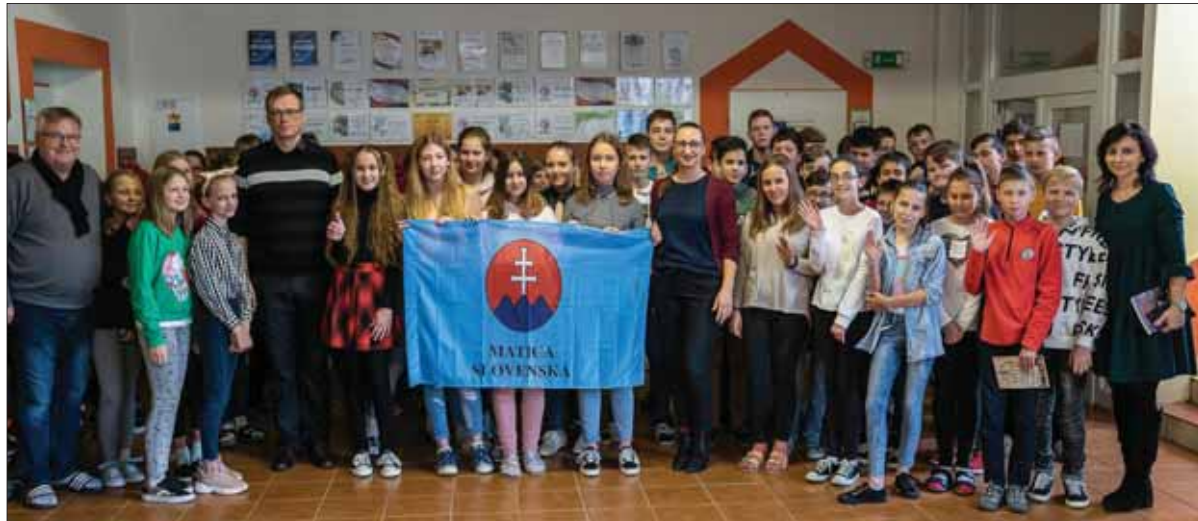
Matičné memorandá so školami a ďalšie aktivity predstaviteľov MS, najmä prednáškové cykly, ale aj scénické ilustrácie dejinných udalostí prinášajú svoje konkrétne plody v záujme najmladšej generácie o národné dejiny.