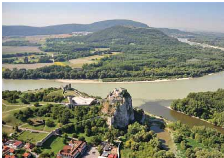
Devín je spojený s mnohými významnými udalosťami slovenskej minulosti, ale aj prítomnosti. Už viackrát sa pod týmto mohutným bralom rozhodovalo o zásadných dokumentoch – takým je aj Generačný program 2020.