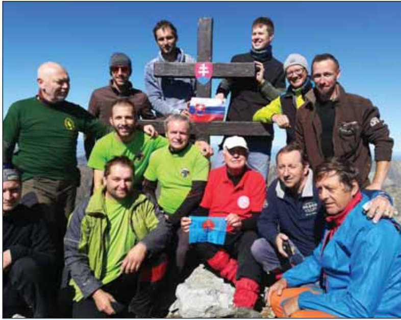
Vlastenci, matičiari a turisti, ktorí sa postarali o obnovu dvojkríža na Kriváň.