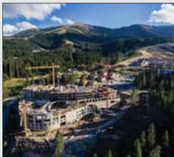
Jasnú zmenila chamtivosť na developerské eldorádo.