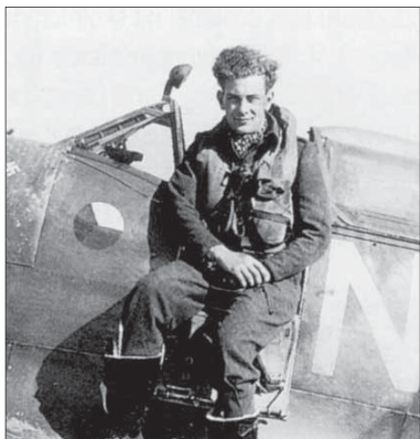
Stíhač RAF Otto SMIK počas invázie do Normandie.

Hneď pri prvých útokoch na nepriateľské ciele na Nemcami okupovaných územiach prejavil neskuutočnú odvahu a chladnokrvnosť. Prvý zostrel nemeckého messerschmitta si pripísal na konto 13. marca 1943. „Obaja – Smik a ja – sme krst ohňom