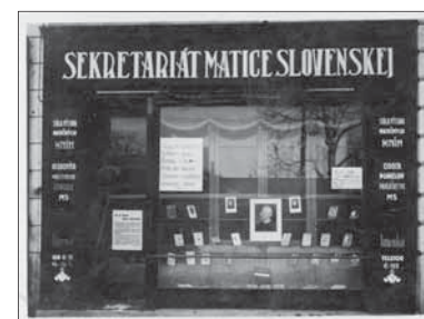
Sekretariát Miestneho odboru Matice slovenskej v Spišskej Novej Vsi

V tridsiatych rokoch začal v Matici vychádzať moderný ilustrovaný časopis Slovensko s rubrikou Organizačných zvestí pre členskú základňu, ktorá bola v ňom uverejňovaná v rokoch 1934 – 1943. Od septembra 1934 vychádzal v mesačnej periodicite a okrem členstva sa zameriaval aj na širokú verejnosť. Na stránkach časopisu prinášali informácie o aktivitách spolku, významných udalostiach, propagovali maticnú myšlienku i jej knižné vydania, prinášali informácie o stave členskej základne, uverejňovali v ňom súhrnné výročné správy, výkazy o činnosti vrátane organizačných pokynov pre MO MS, no aj o ich podujatiach. Časopis vychádzal s nákladom až do tridsaťtisíc výtlačkov, pričom členstvo