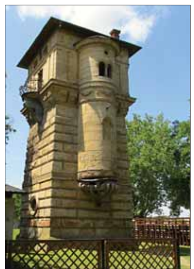
Vodojem pri kaštieli je technická pamiatka.