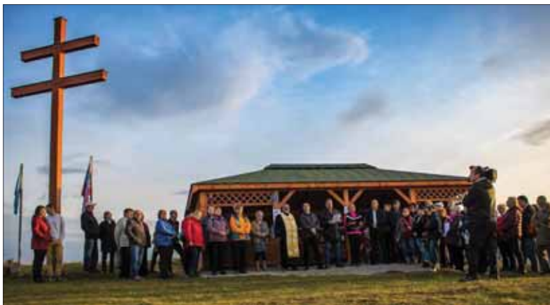
Levočskí matičiari aj členovia SNS sa pravidelne stretávajú pri rôznych príležitostiach, ale aj za rôznorodého počasia na kopci Strompeš, odkiaľ ich už nepriazeň nevyženie, keďže si tu postavili vkusný altánok.