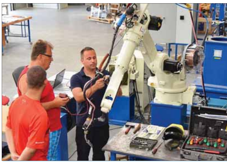
Do výrobných procesov stále viac prenikajú automatizované pracoviská s robotmi.

V západných krajinách s ešte s horšími ukazovateľmi pôrodnosti sa spoliehajú aj na masívnu migráciu, ktorej sme sa zatiaľ na Slovensku ubránili. Aj preto z Bruselu, ale i z krajín, kam migranti prichádzajú vo veľkom, zaznieva požiadavka sankcionovať najmä krajiny V4 predovšetkým krátením príspevkov z európskych fondov, pokiaľ budú trvať na odmietaní migrantov. Ako sa to napokon vyvrší, ťažko predvídať. Starnutie starého kontinentu vplyva