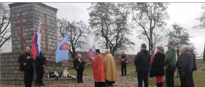
Vyššie 8600 vojakov je pochovaných na vojenskom cintoríne vo Veľkrope, kde sa v minulých dňoch uskutočnila pietna spomienková slávnosť s panychídou.

Práve 11. novembra 2019 o jedenástej hodine a jedenástej minúte uplynulo sto jeden rok od ukončenia prvej svetovej vojny. V tomto symbolickom dátume a čase plnom jednotiek sa na najväčšom vojenskom cintoríne prvej svetovej vojny na Slovensku v obci Veľkrop uskutočnila pietna spomienková slávnosť venovaná týmto obeť. Podujatie sa začalo pri obecnom úrade, odkiaľ prítomní prešli v sprievode obcou až na vojnový cintorín, a pokračovala pri pamätníku uprostred cintorína. Panychídu za obeť vojny celebraval duchovný otec