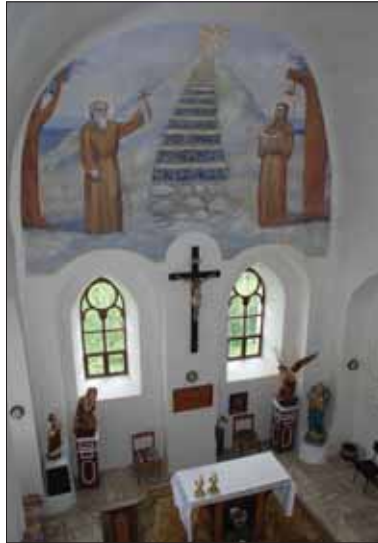
Interiér farského Kostola sv. Svorada a Beňadika na Skalke

Na strednom Považí pred tisíc rokmi platilo, že Boh je vysoko a ochranné štíty nitrianskych kniežat ďaleko. Obyvatelia v tvrdí sa museli chrániť najmä sami. Raz utekali do hustých vážskych močarísk, častejšie sa celé rodiny aj s dobytkom ukrývali v zalesnených dolinách a horách. Bránili sa za zásekmi stromov nad potokmi a úvratami, zákopmi na