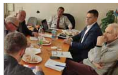
Rokovanie dozorného výboru Matice slovenskej

bie rokov 2018 – 2019. S výsledkami, ako aj s prijatými opatreniami bude oboznámený okrem DV MS aj výbor MS, vedúci funkcionári MS, následne aj funkcionári aktív a členská základňa MS. V ďalšej časti sa DV MS zaoberal financovaním Matice slovenskej, rozpočtom MS na rok 2020, úspornými opatreniami, ako aj došlými námetmi, podnetmi a sťaž-