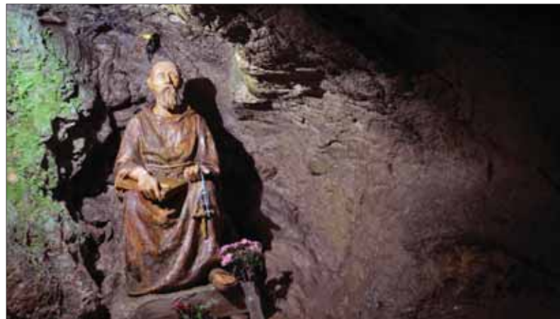
Staršie i nové archeologické nálezy v útrobách i na povrchu zeme na strednom Považí pri Trenčíne rozprávajú o materiálnej i duchovnej kultúre našich predkov.

Samotné veľkomoravské usporiadanie v strednej Európe s jej cyrilometodskou kultúrou bolo v rozklade. Postavenie kniežacieho a biskupského Nitrianska, ktorému administratívne i politicky a duchovne podliehalo stredné Považie, sa sčasti síce konsolidovalo a nanovo iba kryštalizovalo, no v neistých podmienkach premenlivých mocenských súradníc. A považský ľud v tieni chabej správy a ochrany slabého trencianskeho komitátu žil akoby daný napospas osudu. Ani v najhoršej každodennosti nesmel strácať vieru a nádej. Prítom oprieť sa mohol len o svoju odvahu prežiť a spoľehať sa na vlastnú pracovitnosť, na tradície