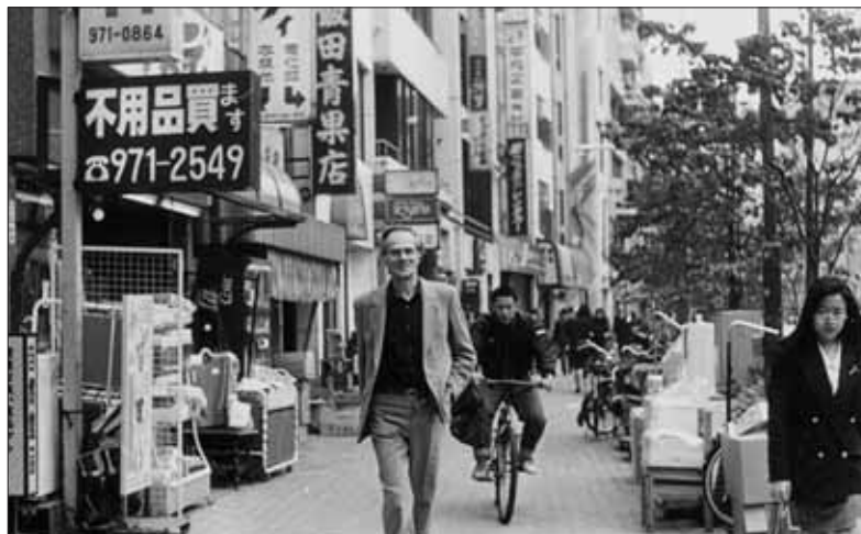
V uliciach Tokia

Ludo bol a aj zostal skromným človekom. „Som dedinský chlapec. Pochádzam zo sedliackej rodiny, od detstva som musel pracovať na poli, mali sme dva a pol hektára pôdy. Aj preto mám k nej dodnes veľmi silný vzťah,“ povedal pri jednom z našich stretnutí. Ludo v sebe nikdy nezaprel hrdého Slováka. Vyrastal v čisto slovenskej rodine a obci, ktorej chotár tvoril hranicu medzi Maďarskom a Slovenskom. Doma sa o tejto krivde veľa hovorilo aj po obnovení Československa. Už od malička nasával starú slovenskú múdrosť: „Svoje si nedáme a cudzie nechceme“. Maďarizácii v rodnej obci stáročia odolávali takmer všetci. Vyrastal v akejsi izolovanej enkláve tekovských dedín, do ktorých nikdy neprenikla maďarizácia. Ľudia si v Hronských Kosiach zachovávali krásny slovenský jazyk až do dnešných dní. Neskôr, počas gymnaziálneho štúdia, sa mladý Ludo odrazu ocitol v prostredí, kde slovenčina nebola samozrejmosťou. V Leviciach v tých časoch