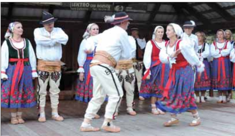
Goralské tance a spevy tvoria pevnú súčasť repertoáru súboru, ktorý nedávno oslavil piate výročie účinkovania.

nych telies, ktoré neboli populuškou. Bokom nebola armáda. Z Ružomberka som narukoval do vojenského útvaru v mestečku Liné pri Plzni, odkiaľ sme sa dostali na celoštátne