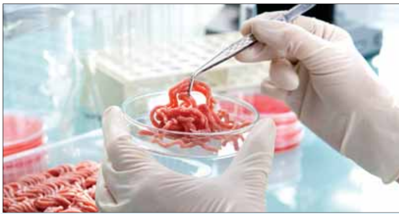
Kontroly potravinových produktov stále prinášajú negatívne zistenia.

„Nízka cena v žiadnom prípade nie je ospravedlnením za mizernú kvalitu. Pravidlá platia pre všetkých bez rozdielu a ohľadu na cenu. Spotrebiteľ by však mali byť pri nakupovaní produktov za nižšie ceny ostražití aj z iného dôvodu. Jeden z trojice najväčších reťazcov na Slovensku zvykne