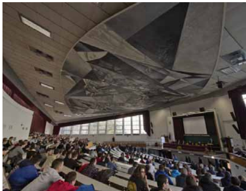
Pohľad do auly Strojnickej fakulty Slovenskej technickej univerzity, ktorá si v minulých dňoch pripomína osemdesiate výročie svojho založenia.