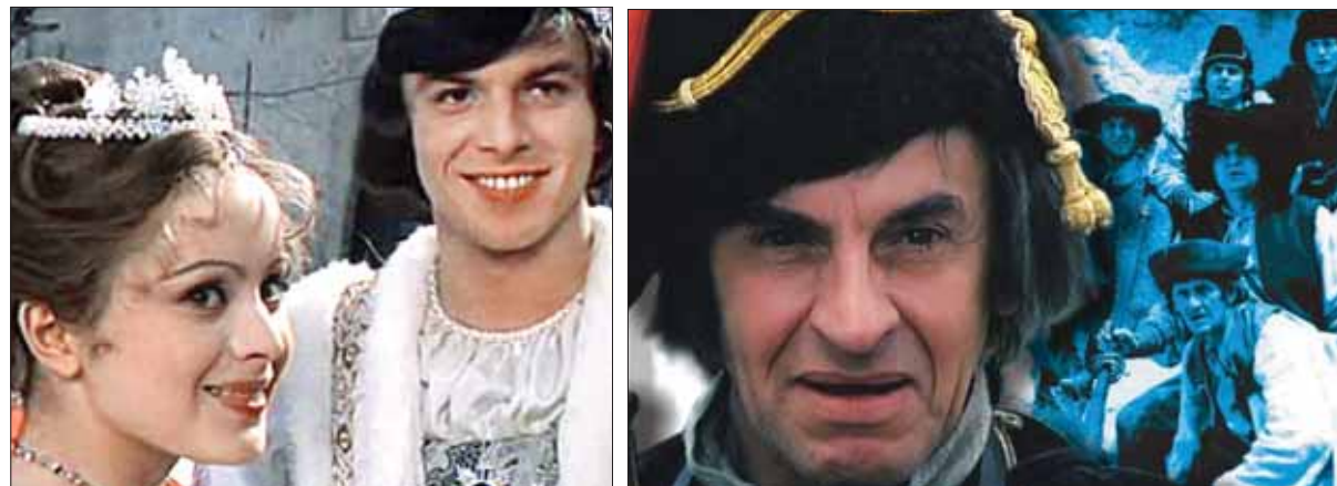
Televízie na Slovensku pripravili na záver roka a na sviatočné dni osvedčenú ponuku titulov pre divákov – už, samozrejme, sú v nej Tri oriešky pro Popelku aj Pacho, hybský zbojník .

Aj keď svetová literárna tvorba, vrátane ľudových rozprávok, viažuca sa k Vianociam – alebo komponovaná tak, aby sa v tejto mimoriadnej atmosfére vysielala – je nepredstaviteľne bohatá, slovenské televízie už dlhé roky hrajú na jednu nôt, uvádzajú dávno takmer výlučne osvedčené hry, filmy a rozprávky, takže nečudo, ak niektorý divák bude sledovať film Tri oriešky pro Popelku tretí-, štvrtý- či siedmykrát, ak vopred vie, čo vyvedie baba Jaga, teda bosorka, ako sa zachová macocha a ako skončí dievčina v ľadovom kráľovstve. Ako by sa redakcie a dramaturgovia báli riskovať. V nepochybne najexponovanejšom období roka a v najsledovanejších vianočných časoch uvedú opäť prevažne evergriny.