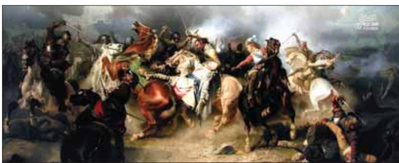
Bojový výjav zrážky kresťanských a moslimských jazdeckých jednotiek