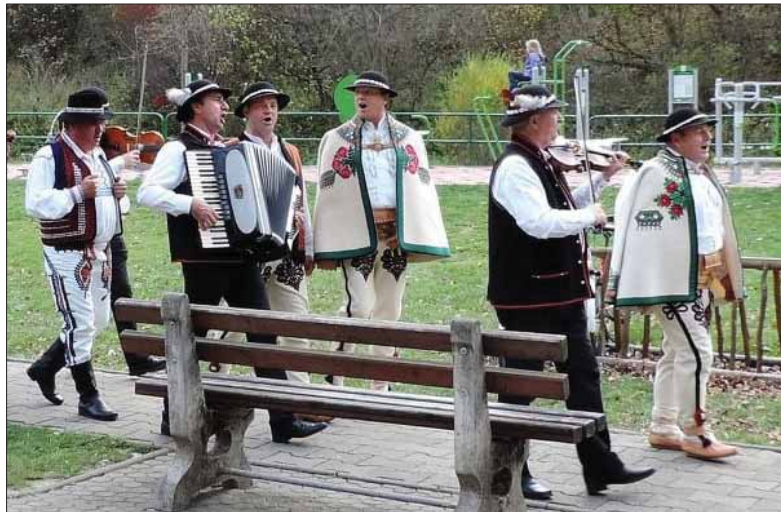
Takto sa v goralskej Lesnici pod Pieninami pripravovali na nakrúcanie propagačného videofilmu muzikanti a speváci Starolubovníana.

Zmenil sa svet, a nie vždy na lepší. Duálne vyučovanie bolo u nás kedysi samozrejmosťou. Závody si vychovali robotnícky dorast a mládež vedeli podchytiť aj na rôzne aktivity, zapojiť ju povedzme do folklór-