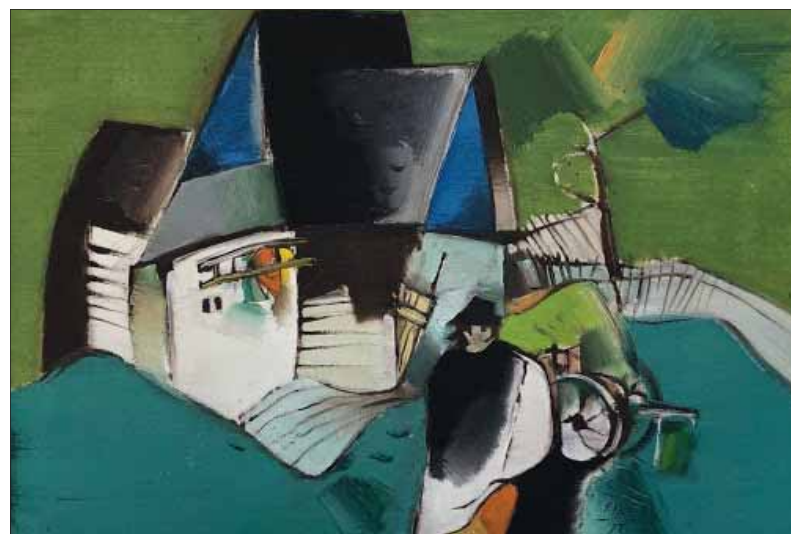
Ferdinand HLOŽNÍK: Dedina, tempera 1975

Ferdinand Hložník sa už v rokoch vysokoškolských štúdií spoznal a zblížil s viacerými budúci výtvarníkmi. Kamarátstvo s Imrichom Vysočanom prerástlo do rodinného priateľstva. Spriatelil sa aj s Orestom Dubayom, Viliamom Chmelom, Alojzom Klímom, Ervinom Semianom. Pekný dlhoročný vzťah vznikol s Jozefom Šturdíkom, ktorý v škole pôsobil ako asistent. S ním sa neskoršie stal aj členom Skupiny výtvarných umelcov 29. augusta. Z profesorov ho najviac zaujal Ján Mudroch. Hoci s ním sa dostal do kontaktu len v závere štúdiá na Slovenskej vysokej škole technickej, jeho vplyv sa v mnohých smeroch stal pre neho určujúci. „Študenta priťahovalo profesorovo koloristické čítanie, dynamický aj splyvavý rukopis, vnútorný význam kompozície. Rovnako pochopil, že humanistický, protivojnový charakter obrazu môže a musí zužitkovať prvky asociatívneho, a pritom závažného významu. Presvedčil sa, že obraz tohto posolania je nutné vybudovať bez vonkajšieho páťosu.“