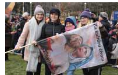
Na „ružencovom pochode“ sa zúčastnila aj mládež.

Mohla cirkev na Slovensku zostať ľahostajná k Istanbulskému