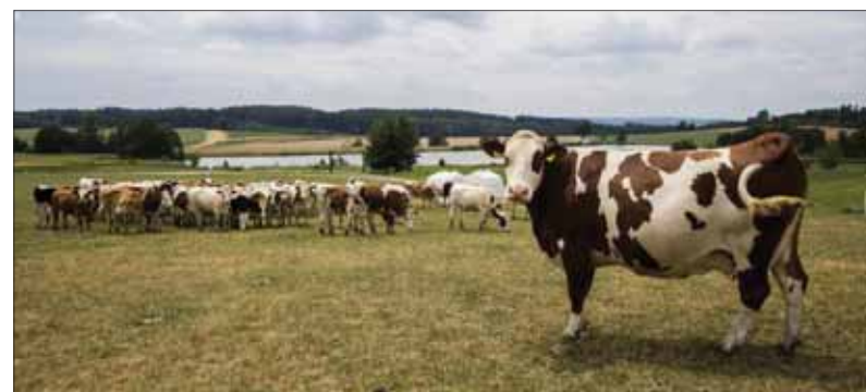
Doterajšie problémy chovateľov hospodárskych zvierat pri ich uhynutí chce systémovo riešiť opatreniami na ich odstraňovanie a likvidáciu rezort dotáciami od štátu.

piatich percent nákladov na likvidáciu týchto mŕtvych hospodárskych zvierat. Žiadosti o poskytnutie dotácie možno podávať do 4. marca 2020. Žiadosť o poskytnutie dotácie na odstraňovanie a likvidáciu mŕtvych hospodárskych zvierat podáva Pôdohospodárskej platobnej agentúre výlučne poskytovateľ služby – právnická osoba oprávnená na podnikanie, ktorá je prevádzkovateľom zariadenia na odstraňovanie a likvidáciu živočíšnych vedľajších produktov. „Vďaka našej niekoľkoročnej intenzívnej práci na digitalizácii PPA sme mohli výzvu vypísať rekordne skoro, už vo februári kalendárneho