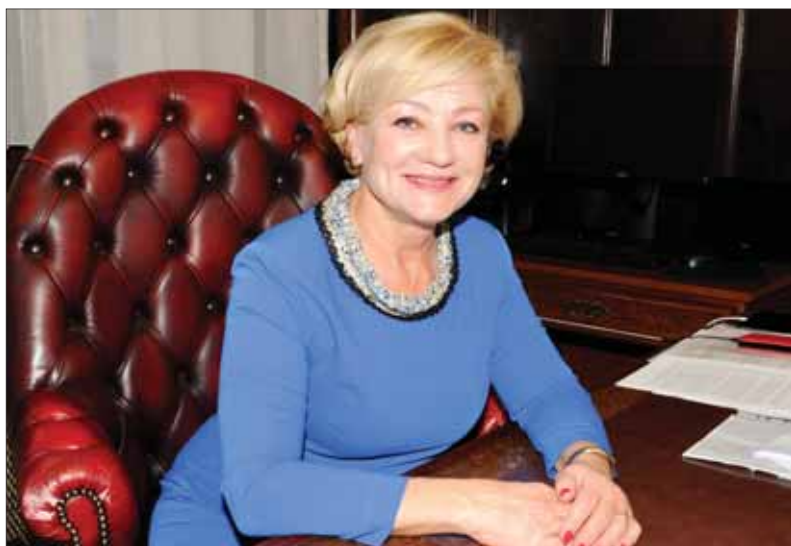
Ministerka kultúry začiatkom februára navštívila bratislavské sídlo Matice slovenskej. Informácia o podujatiach regionálnej kultúry Matice za rok 2019, vyhodnotenie projektov osádzania búst a pamätných tabúl a spolupráca pri organizácii kultúrnych podujatí v tomto roku boli hlavnými bodmi rokovania ministerky Ľ. LAŠŠÁKOVEJ s predstaviteľmi ustanovizne.

Parlament tiež schválil dve novely Autorského zákona vrátane tej, ktorá sa zamerala na zlepšenie dostupnosti diel a iných predmetov ochrany (kníh, novin, časopisov či audiokníh) v prístupných formátoch pre nevidiace osoby, osoby so zrakovým postihnutím alebo postihnuté inou poruchou čítania. Prvého januára 2020 nadobudol platnosť aj Zákon o finančnej podpore