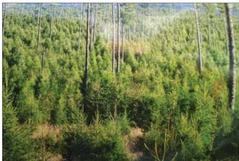
Optimistický, ba priam ľubebný je pohľad na nový les založený lesníkmi ŠL TANAP-u nad osadou Starý Smokovec.