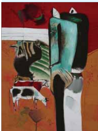
Ferdinand HLOŽNÍK: Na paši, tempera 1974

dreva, kónských pluhov, poľnohospodárskych brán, kolies z voza, drevených rebríkov i hrablí, kôš či rebrniakov. To všetko sa ako znak aj symbol uchovalo v jeho neskorších obrazoch.