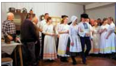
Záverečná scéna, keď je všetko dohodované a „ruka je už v rukáve“ – mladý pár vykročil na spoločnú cestu životom.