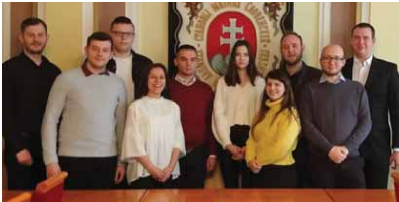
Aktuálny výbor Mladej Matice po svojom prvom tohtoročnom rokovaní

Mladí maticári sa ďalej zaoberali rozpočtom organizácie, ktorý tvorí dotácia z rozpočtu Matice slovenskej a príspevok na činnosť