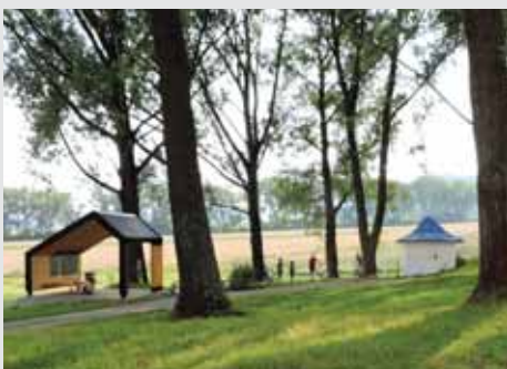
Aj v katastri obce Kamienka je prameň minerálnej vody, ktorú miestni nazývajú Štáva (Anna) a okolo vedie vetva cyklotrasy Aquavelo od Hniezdného smerom na kúpele Vyšné Ružbachy.

Nedávno dokončená slovenská časť cyklookruhu Aquavelo meria vyše dvestotridsať kilometrov. Spája poľské a slovenské kúpeľné mestečká v slovensko-poľskom pohraničí, ako sú Bardejovské Kúpele, Krynica, Muszyna a Szczawnica.