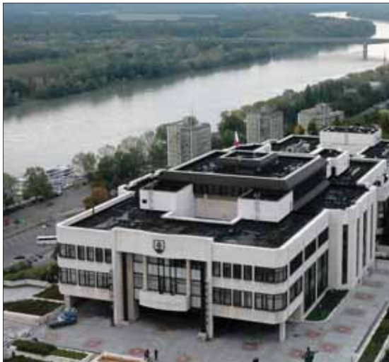
Slovenský parlament bude v permanencii zrejme až do parlamentných volieb.

Zvýšenie prídavku na dieťa bude v budúcom roku zaujímať okolo 1 087 900 ľudí a dotkne sa 651 830 detí, na ktoré štát takto vyplatí takmer tristo miliónov eur. Násobne viac, v stovkách miliónov eur zataží štátny rozpočet trinásť dôchodkov. Ten by sa mal vyplatíť už v decembri tento rok všetkým poberateľom dôchodkov, nielen starobných. V kapitole sta-