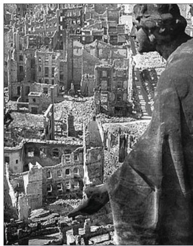
Z vojensko-strategického hľadiska nemali Drážďany prakticky nijaký význam, boli historicko-kultúrnym klenotom s množstvom architektonických a umeleckých pamiatok, preto zničujúce nálety Spojencov s obrovským množstvom civilných obetí dodnes vyvolávajú otázky nad ich zmyslom.

americké divízie stáli na Rýne a Červená armáda prekročila Odru a vytvorila si niekoľko predmostí, vzdialených len šesťdesiat kilometrov od Berlína. Preto masívny letecký útok na Drážďany bol zo strategických dôvodov zbytočný. V prvých týždňoch roka 1945 v meste žilo takmer šesťstotisíc obyvateľov a prechodný útulok tu našlo asi šesťstotisíc utečencov z nemeckých území obsadzovaných Červenou armádou. Ešte v januári hlavné veliteľstvo Wehrmachtu premiestnilo z Drážďan niekoľko batérií protiletadlových diel na obranu Berlína a Porýnia. Drážďany sa tak stali ľahkým cieľom vzdušného úderu. Ten prvý prišiel v noci 13. februára krátko po desiatej. Na centrum mesta zaútočilo vyše tristo ťažkých bombardérov zápalnými bombami, ktoré ho premenili na more plameňov. Keď sa hasičské družstvá a dobrovoľníci pokúšali požiare zdolať, zaútočili bombardovacie perute druhýkrát. Tentoraz vyše päťsto strojov triestimi a zápalnými bombami rozohnalo