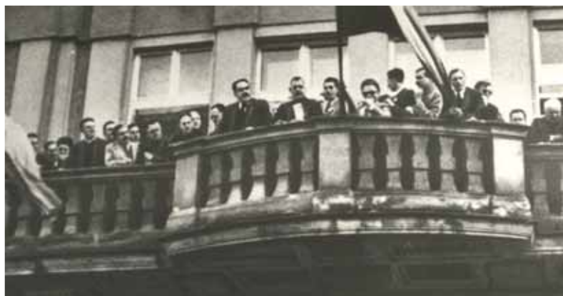
Vyhlásenie autonómie z balkóna budovy v Žiline bolo politickým predvojom vyhlásenia samostatnosti 14. marca 1939.