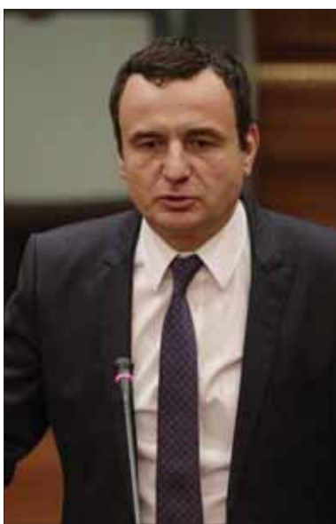
Nový premiér samozvaného Kosova Albin KURTI

Aj keď Kurtiho vláda predstavuje svojský obrát v doterajšej politickej tradícii Kosova, pestovanej od straty priamej kontroly Belehradu nad svojou južnou oblasťou, k zásadným zmenám v politike Prištiny nedôjde. Moc síce po prvý raz stratilo „vojnové“ krídlo Kosovskej oslobodzovacej armády (UČK), no ku kormidlu sa dostal predstaviteľ najradikálnejšieho