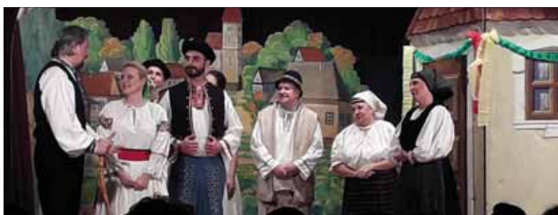
Nevšedné jubileum si v týchto dňoch pripomínali ochotníci zo súboru Ozvena v Strážach, ktorí tak ako pred sto rokmi uviedli na domácej scéne hru Ferka Urbánka Kamenný chodníček.

Tou istou hrou si prvého a druhého februára tohto roku pripomenuli výročie založenia súboru miestni ochotníci v divadelnej sále v Strážach. Súčasná