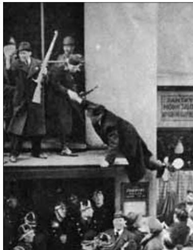
Homolov puč ešte viac vystupňoval protičeské nálady

Je historický fakt, že Slovinci nemali vtedy iný plán len udržať autonómiu, ktorú práve dosiahli. Situácia na Slovensku po šiestom októbri 1938 bola dyna-