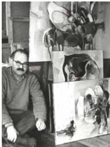
O kultivovanom maliarstve Ferdinanda HLOŽNÍKA na rozdiel od jeho staršieho brata Vincenta sa na škodu vecí menej hovorí azda aj preto, že v istom období venoval paletu motívom oslobodzovacieho boja proti fašizmu. Jeho výtvarný prejav je však výsostne kultivovaný a farebne harmonický.

Vo vnútri budúceho umelca sa rodil jeden z ikonografických okruhov jeho diela. V pamäti mu navždy utkveli „zákutia“ nevelkého milovaného Svederníka. Bol tu pôvabné murované aj drevené stavby s dominantnou štítovou strechou, rímsami, nadčasovou krásou drevených plotov, jednoduchými aj dekoratívnymi malými oknami. V ich blízkosti sú dodnes funkčné pivničky. Nesmierne inšpiratívne na neho pôsobili ikonické roľnícke dvory plné krňáčiek na zväzanie