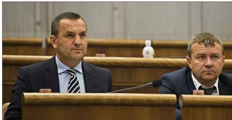
Dvaja významní slovenskí reprezentanti vo futbale Tibor JANČULA (vpravo) a Dušan Tittel ostatné štyri roky pôsobili ako poslanci v parlamente za Slovenskú národnú stranu a presadili okrem iného nové legislatívne úpravy pracovných zmlúv vrcholových športovcov.

bajdžanu v tureckom Trabzone sa mi podarilo skórovať. Vyhrali sme 1 : 0. Bolo to v roku 1995. V najcennejšom drese som odohral niekoľko výborných zápasov až do roka 2001. Moje posledné vystúpenie v slovenskej reprezentácii bolo opäť v zápase proti Azerbajdžanu v Trnave. Žiaľbohu, ten nás nepotešil.