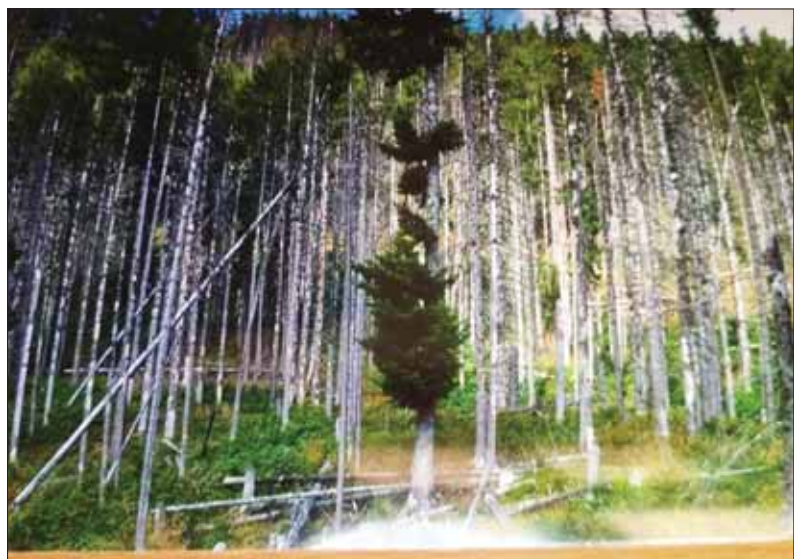
Umierajúce stromy – rozpad smrekových porastov na hornej hranici lesa vo Vysokých Tatrách pokračuje, povolený vstup tam má iba pažravec lykožrút...

Ako lesníci na dôchodku mi pri nedávnom rekreačnom pobyte vo Vysokých Tatrách nedalo, aby som neupriamil pozornosť na to, čo mi je celý život najbližšie a najmilšie – na les a prírodu našich veľhôr. A zaujímalo ma to najdôležitejšie – nakoľko sa tatranský les vystrábil z bolestivých rán po hrôzostrašnej veternej smršti v novembri 2004.