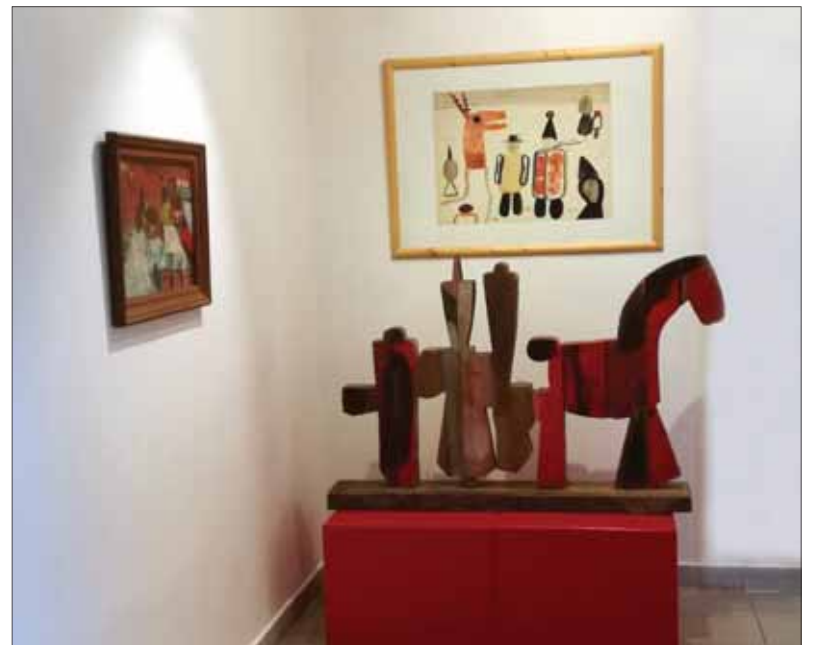
Galéria mesta Bratislavy, ale tiež aj Oravská galéria v Dolnom Kubíne pripravili v tomto fašiangovom čase výstavy zo svojich zbierok, ktoré sa tematicky viažu na toto obdobie vrcholiacich zábav, maškarných sprievodov a pochovávaní basy.

nejšie ručne zhotovené masky, k najstarším patrili muži preoblečení za staré ženy alebo cigánky, mladuchu a mladého zaťa... Tradičné masky – turoň, koza, kôň, medveď, slameník – symbolizovali mužskú silu, plodnosť, úrodu. Masky predvzdávali najčastejšie smrť a ožitie zvierata, čo malo vyjadriť obnovu, prebúdzanie prírody k životu po zime. Nesmeli chýbať tanečné rekvizity, ako boli zvonce a hrkálky. Mládenci – fašiangovníci – prezlečení do masiek sa poslednú fašiangovú nedeľu vydávali na obchádzku z domu do domu, v ruke držali ražeň alebo šablu, na ktorú im ľudia napichovali slaninu,