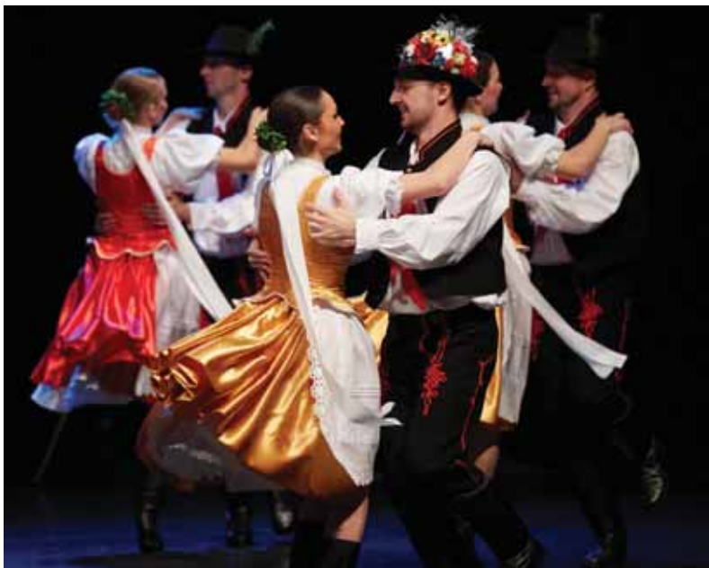
Prostredníctvom rôznych dotáčných schém ministerstvo kultúry podporovalo predovšetkým slovenský folklór. Žiaľ, Matica slovenská bola z niektorých projektov vylúčená.

Vzhľadom na rozšírenie dotačnej pôsobnosti ministerstva kultúry o podporu folklóru a knižnic dotáciami bude folklór i naďalej podporovaný. V rámci dotačného programu Podpora miestnej a regionálnej kultúry sa budú podporovať aktivity, ako napríklad zakúpenie alebo obstaranie ľudových krojov, kostýmov, hudobných nástrojov, hudobnej aparatury, náradia a prístrojov na tvorbu umeleckých výrobkov, potreb pre tvorbu výtvarníkov. O finančnú dotáciu sa mohli do 12. februára 2020