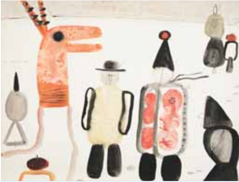
Vladimír KOMPÁNEK, Turoň a maškary