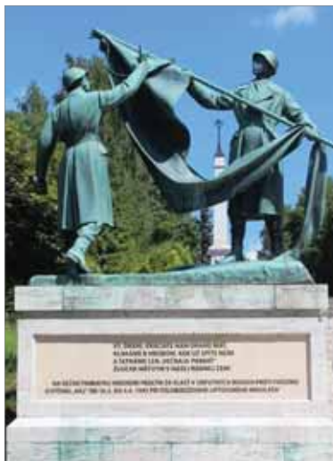
Centrom celoštátnych osláv sedemdesiateho piateho výročia oslobodenia našej vlasti bude pamätník čs. armády v Háji-Nicovom pri Liptovskom Mikuláši, ktorý tiež prejde rozsiahlou obnovou.

sa uskutočnia 8. mája 2020 v Liptovskom Mikuláši. Diváci sa môžu