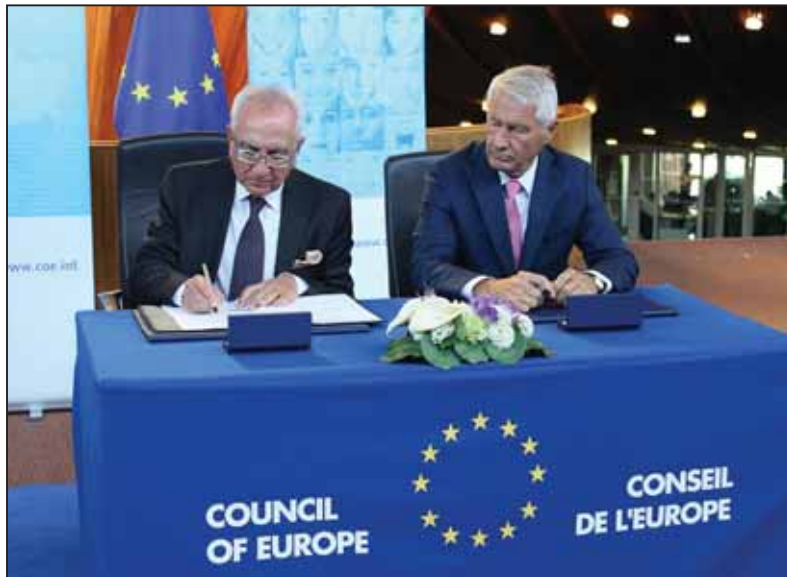
Podpis Istanbulskeho dohovoru na pôde Rady Európy 13. júna 2017

Vláda SR svojím uznesením uložila všetkým členom kabinetu povinnosť postupovať v rámci možnosti voči inštitúciám Európskej únie a Rady Európy v súlade s uznesením NR SR. V tomto uznesení parlament vyjadril nesúhlas s tým, aby Slovenská republika bola prostredníctvom rozhodnutí a opatrení Európskej únie viazaná Istanbulským dohovorom a aby Európska únia pristúpila k uvedenému dohovoru bez akýchkoľvek obmedzení. Parlament už skôr požiadal vládu, aby postupovala voči inštitúciám EÚ a Rady Európy v súlade s týmto uznesením „s cieľom zabrániť prijatiu záväzkov a dosahom záväzkov, ktoré nie sú upravené v slovenskom právnom poriadku“ a vyplývajú z Istanbulskeho dohovoru na právny poriadok SR.