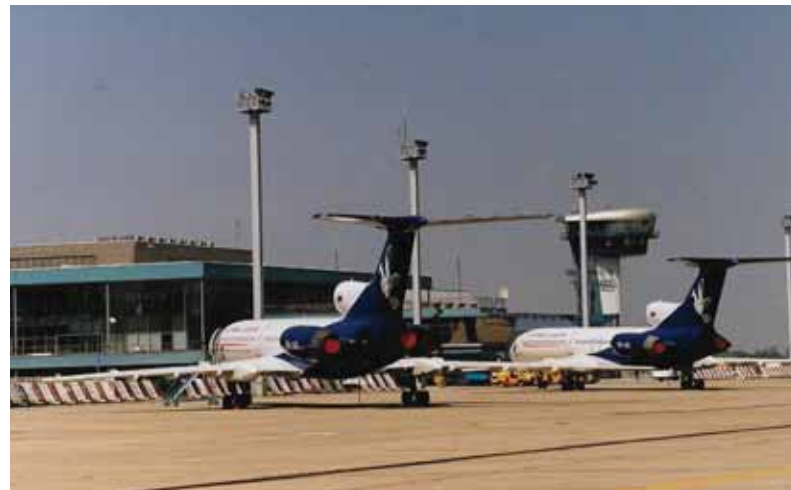
Slovensko roky nevie pohnúť s predstavou vytvorenia národného leteckého prepravcu. Aj v závere minulého roka ministerstvo dopravy oznámilo, že nič také nepripravuje.

Liberalizmus je nesmierne nebezpečné giga zlo, najmä jeho progresívna protištátna forma. Liberalizmus reprezentuje a presadzuje záujmy mikromenšín. Pre túto malú časť môže byť aj atraktívny a lákavý. Aj pre časť nerozmýšľajúcich alebo menej osvietených a zbabelých. Lenže liberalizmus ide jednoznačne proti záujmom a potrebám drvivej väčšiny normálnych ľudí. Aj tej, ktorá jeho lákavým podvodom podľahne. Liberalizmus presadzuje nadpráva inakosti na úkor práv