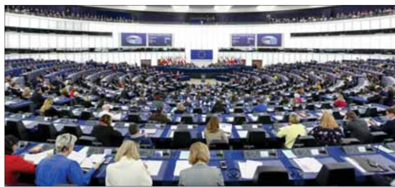
V laviciach Európskeho parlamentu pribudla Slovensku ešte jedna stolička.

Spojené kráľovstvo plánuje od prvého januára 2021 spustiť novú schému pre pobyt migrantov z tretích krajín. Po odchode Británie z EÚ tam bude patriť aj Slovensko. „Občania Slovenskej republiky, ktorí prídu na územie Spojeného kráľovstva s cieľom zamestnať sa po tomto dátume, rovnako ako tí občania Slovenskej republiky, ktorým uplynie platnosť dočasného pobytu,