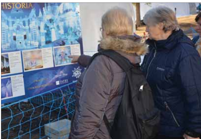
Slovenskí dôchodcovia oceňujú sociálne opatrenia vlády od stabilizovania veku odchodu do dôchodku cez jeho neustále zvyšovanie, a tiež aj cestovanie zadarmo.

Sociálna poisťovňa pripravila tiež kalkulačku na určenie dôchodkového veku, ktorá je prístupná na jej webovej stránke socioist.sk. Po vyplnení budúceho dôchodcovia a dôchodkyni povie, kedy podľa počtu vychovaných detí, čo sa týka nielen žien, ale aj mužov, môžu pobrať penziu. Nárok na penziu pozná výnimky pri celom rade profesií, ako sú baník, hutník, kováč, chemik a pod. V tomto roku Sociálna poisťovňa prepočíta dôchodky žien, ktoré išli do predčasného dôchodku, pri výpočte ktorého im nebol zohľadnený počet vychovaných detí. Ten sa im tak po prepočte zvýši. Pre poriadok vecí si pripomeňme, že od 1. 7. 2019 je