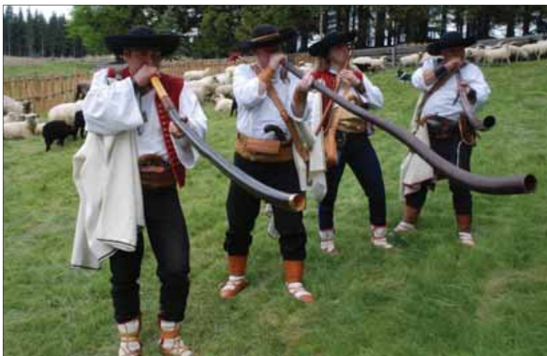
Nadšencov, čo sa na regionálnej úrovni starajú o zachovanie a rozvoj kultúrnych tradícií, istotne poteší trend, že MK SR každý rok zvyšuje dotácie práve na tento cieľ.

V globalizovanom rýchlym svete sociálno-sietových informácií neraz hľadáme identifikačné prvky, o ktoré sa môžeme podeliť s inými, ale nám blízkymi ľuďmi. Pri formovaní národnej identity hrajú kultúrne prvky nesmierne dôležitú úlohu – územie národa sa vylučuje sice geograficky, ale silnejšie jazykovo, kuchynou a kultúrou – zvykmi, odevmi, pesničkami, tradíciami. Národná identifikácia, spojenie so „svojou krvou“ je psychologickou obranou pred cudzím svetom. A kde inde ako v kultúrnych javoch (piesňach, slovesnosti, hrách, zvykoch...) sa tak odrážajú sociálne vzťahy, etické a estetické názory, ktoré sú obrazom kolektívnych noriem