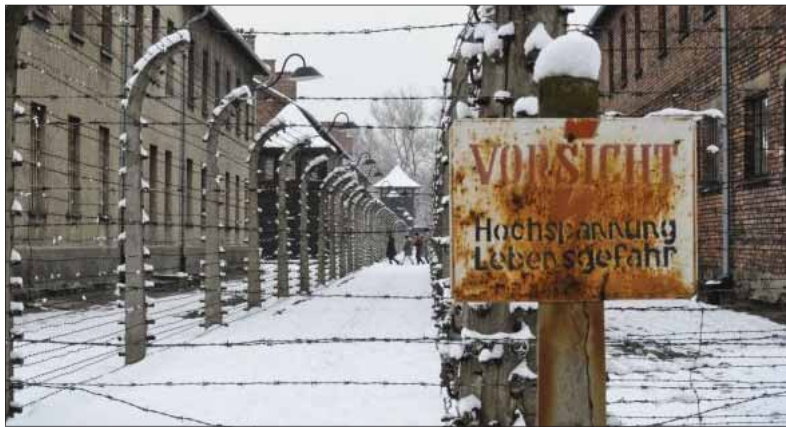
Nemecký vyhladzovací koncentračný tábor Auschwitz-Birkenau pri poľskom Osvienčime bol po tieto dni pri príležitosti 75. výročia jeho oslobodenia Červenou armádou opäť stredobodom mediálnej pozornosti, aj keď nie vždy objektívnej...

Cez zážitky z koncentračného tábora s navrátením sa k osobným spomienkam na tragické udalosti vojny reagoval na omyly človeka 20. storočia. Apeloval na ľudskú kolektívnu pamäť, aby sa tragédia zlyhania „človeka voči človeku“ už nezopakovala.