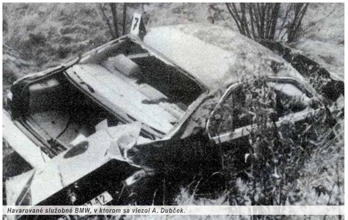
Havarované služobné BMW, v ktorom sa viedol A. Dubček.

Najslávnejší Slováč Dubček, ktorého svetoví politici, Svätý Otec Ján Pavol II., významné osobnosti, spisovatelia a umelci úprimne obdivovali a doteraz obdivujú, sa, žiaľ, na Slovensku dočkal znevažovania, odsúdenia a kritiky. Najviac sa o to pričínili niektorí vrcholoví pravíkoví politici z košičarskej KDH, SDKÚ, ako aj svetoobčania a im prisluhujúci politickí analytici a novinári – bývalí komunisti mu zazlievajú, že bol komunista. Hlúpo mudrujú, že pri okupácii v auguste 1968 mal organizovať ozbrojený odpor a nemal podpísať Moskovské protokoly. Svetoví politici a významné osobnosti však vedia, ako bol svet vtedy mocensky rozdelený a mier krehký – preto sú stále presvedčení, že Dubček patril a bude patriť medzi najpopulárnejších politikov 20. storočia.