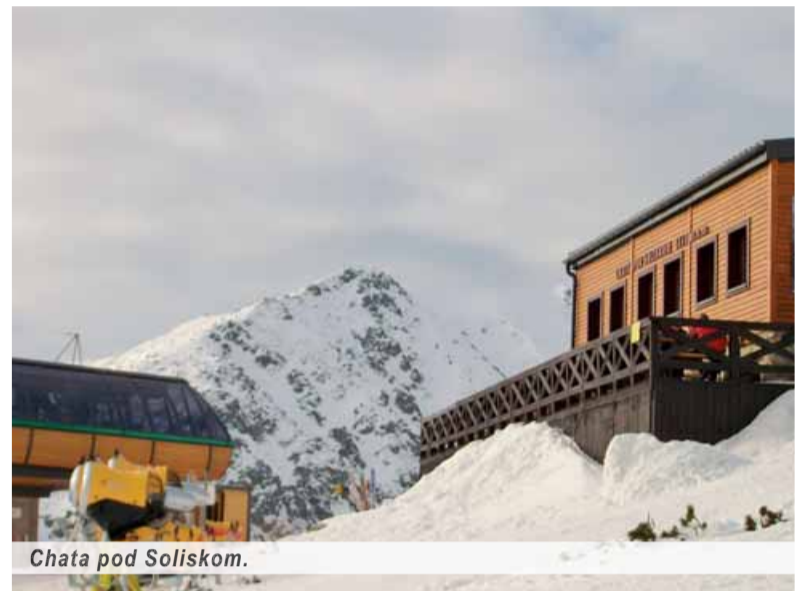
Chata pod Soliskom.