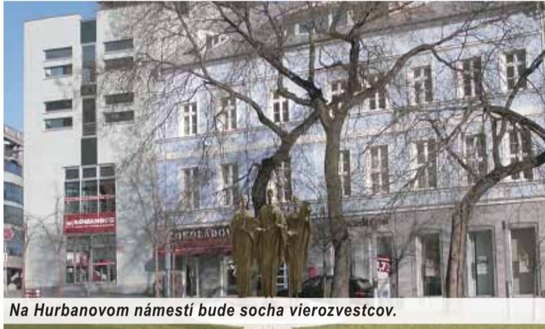
Na Hurbanovom námestí bude socha vierozvestcov.

Zasadnutie poslancov mestského zastupiteľstva je jednoznačne pre trpezlivé povahy. Kým sa páni a dámy na radnici dostali až k bodu venovanému problému kam vlastne súsošie umiestniť, prešlo niekoľko hodín. Aj napriek výrečnosti niektorých zúčastnených verdikt vyznel šalamúnsky dostratená. Svätí Cyril, Metod a Gorazd môžu byť osadení na Hurbanovom námestí. Ale musí to byť iné súsošie. Pripomína to známu rozprávku o múdrej dievčine, ktorej kráľ prikázal, aby za ním prišla ani nahá, ani oblečená, ani pešo, ani na koni.