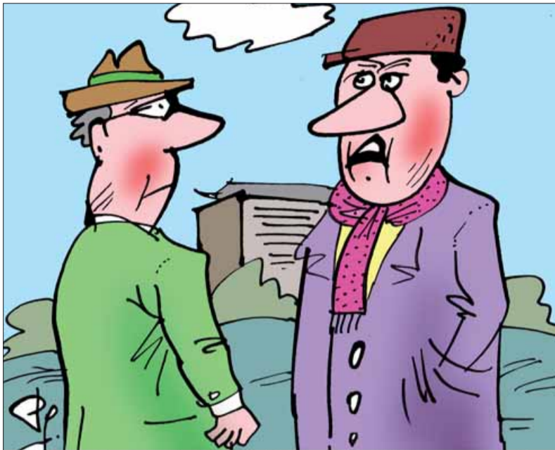
Kedysi pred ľuďmi ukrývali trezorové filmy, dnes trezorový Národný poklad.