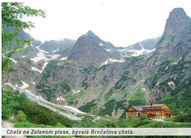
Chata na Zelenom plese, bývalá Brnčalova chata.

Až po dlhých rokoch, po takzvaných spoločensko-politických premenách, keď všemocný trh vtrhol všade, aj do tatranských osád, zrazu turistov začalo ubúdať. Skalní ešte chodievali do výšky nad 1 500 metrov nad morom, lebo tam vraj „koncentrácia snobov a biznisu klešala na nulu“, ale teraz ich zrejme aj odtiaľ vyženú plány na – použijeme eufemizmus – zosúkromnenie tatranských vysokohorských chát. Nejde o to či dnes, alebo zajtra. Dnes to vari ešte akútne nehrozí. Ale zábery na to, že možno už zajtra, sú v papieriach na stole.