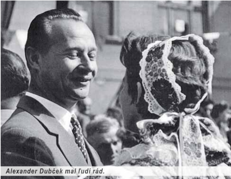
Alexander Dubček mal ľudí rád.

K Alexandrovi Dubčekovi som ako novinár od roku 1968 prechovával úprimnú úctu. Uchoval som si ju aj napriek tomu, že ma za propagáciu ním tvoreného socializmu s ľudskou tvárou normalizátori vyhnali z redakcie Smeny a vypudili na perifériu spoločnosti, kde som pod dozorom Štátnej bezpečnosti pobudol dvadsať rokov.