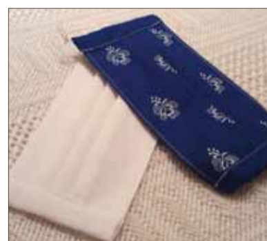
Mnohé matičiarky i matičiari po celom Slovensku začali doma vyrábať svojpomocne rúška a ponúkať ich tým, ktorí ich potrebujú.

novat činnosť, ktorej výsledkom je predovšetkým pomoc iným. MO MS v Tisovci srdečne pozdravuje všetkých pracovníkov Matice slovenskej v Martine a všetkých maticiarov po celom Slovensku. Nech vás v týchto dňoch sprevádza pokoj, radosť z drobností, ale najmä pevné zdravie.