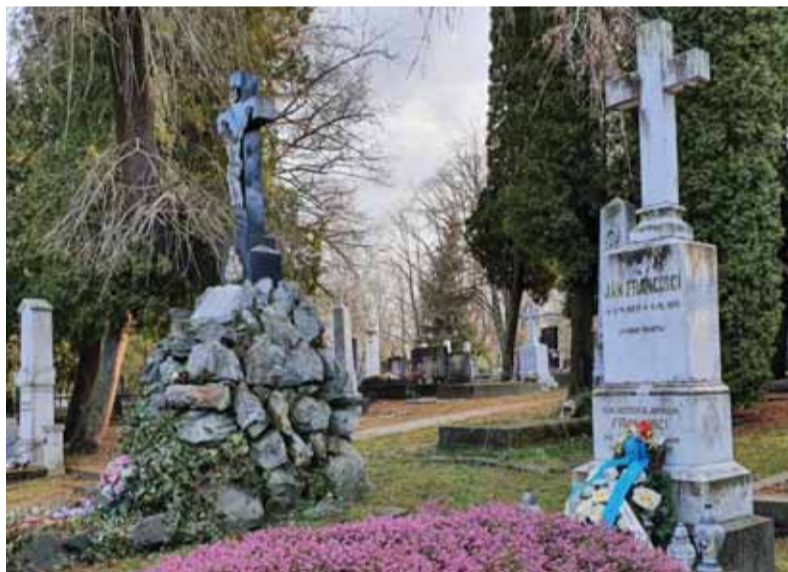
Matičiarci a vojenští veteráni si aj v týchto dňoch uctili pamiatku Jána FRANCISCIHO - RIMAVSKÉHO na Národnom cintoríne v Martine pri príležitosti jeho 115. výročia úmrtia.

V roku 1995 bol v posádkovom meste Martin v súlade s koncepciou výstavby vtedajšej Armády Slovenskej republiky sformovaný vojenský útvar – armádna jednotka, ktorá dostala názov Prápor rýchleho nasadenia. Bol to prvý profesionálny útvar vojakov z povolania. Formovanie tejto jednotky malo preukázať schopnosť Slovenskej republiky vycvičiť jednotku rýchlej reakcie a kooperovať na medzinárodných vojenských projektoch spoločne s prístupujúcimi a členskými