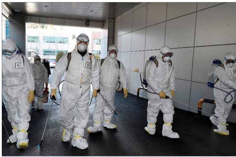
Zastavenie epidémie závisí od správnych rozhodnutí krízového štábu, zodpovednosti nás všetkých a dezinfekčných opatrení.

Po rokovaní vlády, jej ministrov, krízového štábu a prevádzkovateľov súkromných laboratórií sa podarilo výrazne zvýšiť denný počet testovaných potenciálnych nositeľov nákazy. Denná štatistika tak už dosahuje na počet tisíc testovaných. Potešiteľné je, že úmerne k počtu intenzívnejšieho testovania sa nepotvrdil porovnateľne zvýšený počet infikovaných, ten stúpa miernejším tempom. Krízový štáb a následne aj minister zdravotníctva vydali opatrenie, na základe ktorého je zakázaný domáci predaj respirátorov. Tie sú totiž podľa ministra zdravotníctva MUDr. Mareka Krajčího určené najmä pre zdravotnícky a záchranársky personál, u bežných užívateľov sú skôr veľkým rizikom pre šírenie nákazy, pretože sice chránia nositeľa, ale nijako nechránia ľudí, ktorí sa pohybujú v jeho okolí pred ním vydychovanou kvapôčkovou nákazou. Klasické doma šité rúška sú v tomto smere podľa ministra oveľa spoľahlivejšie.