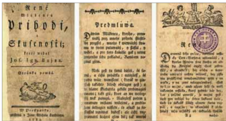
Faksimile knihy René mládenca príhody a skúsenosti

farníkov. Postavil si dokonca aj menšiu pálenicu. Mohol si to dovoliť – bolo to v časoch, keď ešte neexistovali spolky striezlivosti. Práve dobré hospodárenie a skromný životný štýl mu umožnili, aby pri vydávaní svojich literárnych prác