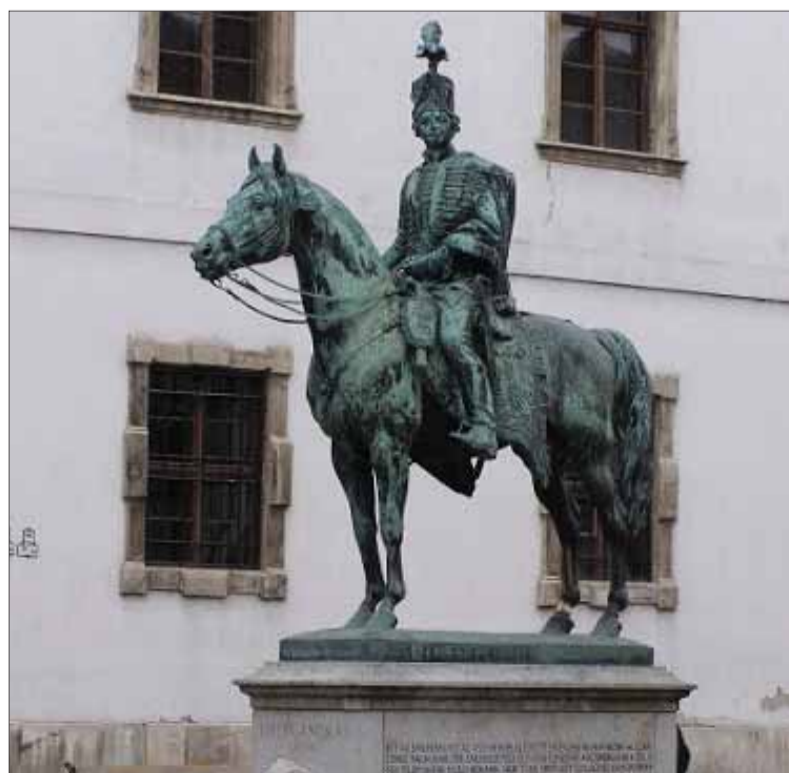
Jazdecký pomník maršala Andreja HADIKA v Budapešti