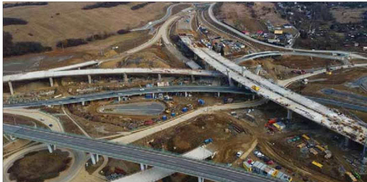
Do obdobia, keď – ľudovo povedané – kríza sedí na prípecku – vstupujeme zraniteľní aj tým, že máme nedobudovanú cestnú infraštruktúru, ktorá je pilierom ekonomiky aj v ťažkých časoch.

Svetová ekonomika sa od začiatku minulého roka prepadla o polovicu, čo napokon platí aj pre Slovensko, keď vtedajší rast HDP vyše štyri percentá sa znížil na dnešných 2,5 percenta. Keďže OECD nepočíta s nijakým výraznejším zlepšením, nemôžeme čakať, že pod Tatrami sa udejú hospodárske zázraky. Situáciu pritom vážne dramaturizuje blížiacia sa ekonomická stagnácia v súvislosti s koronavírusom.