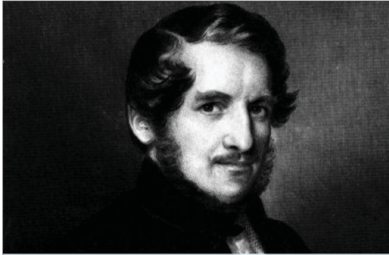
Autor prvého slovenského románu Jozef Ignác BAJZA

Kňazské pôsobenie v Dolnom Dubovom síce znamenalo len skromný príjem, ale Bajza ako roľnícky chlapec dokázal na cirkevných poliach a v sadoch rozvíjať moderné formy hospodárenia, ktoré boli vzorom pre jeho