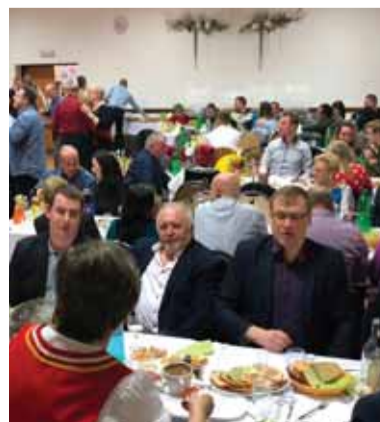
Atmosfera matičných hodov v Ondavských Matiašovciach.