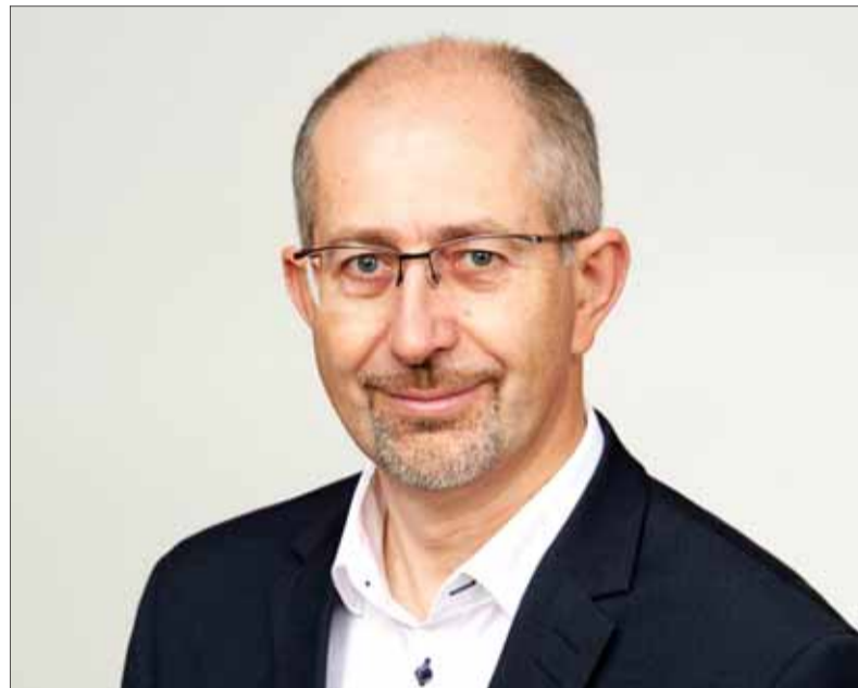
Slovenskú ekonomiku čaká výrazný prepád. Nová vládna koalícia sa aktuálne zamýšľa, ako pomôže aj malým a stredným podnikateľom – živnostníkom. Nielen veľkým firmám automobilového a iného priemyslu, ktoré majú dostatočné rezervy krízu prekonať.

Ak živnostník pozastaví živnosť, nemusí platiť odvody, ale bude