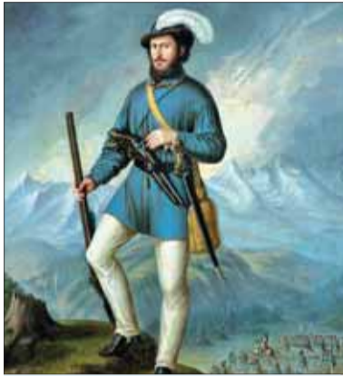
Janko Francisci patril medzi najodvážnejších štúrovcov. Kritizoval dokonca zmierlivejšie politické články L. Štúra v Slovenských národných novinách. Bol aktívny aj v Matici slovenskej.

Po revolúcii pracoval v štátnych službách v Banskej Bystrici a v rokoch 1853 – 1859 pôsobil ako župný komisár v Debrecíne. V roku 1860 sa stal v Budíne radcom kráľovskej miestodržiteľskej rady. Popri superintendantovi K. Kuzmánym sa stal svetským predstaviteľom slovenských evanjelických cirkví v Uhorsku. V rokoch 1861 – 1863 bol šéfredaktorom Pešťbudinských vedomostí. Stál na čele prípravného výboru Matice slovenskej, bol predsedom dočasného výboru Matice slovenskej a po jej založení sa stal doživotným čestným podpredsedom. V roku 1864 – 1865 bol hlavným županom Liptovskej stolice. Po rakúsko-uhorskom vyrovaní bol penzionovaný, presťahoval sa do Revúcej, kde pôsobil ako