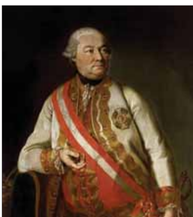
Poľný maršal Andrej HADIK, ktorý mal rodné korene v Turci, sa počas vojenskej kariéry vyznamenal v mnohých bitkách; počas Sedemročnej vojny dokázal so stotinou husárov obsadiť dokonca Berlín...

Andrej Hadik sa preslávil práve v tejto vojne, ktorú neskôr Winston Churchill označil ako skutočne prvú