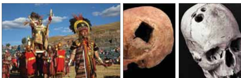
Inkovia aj Egypťania si už pred tisícročiami trúfli na trepanácie lebiek nielen na mŕtvych, ale aj na živých ľuďoch a zahojené rany dosvedčujú, že to boli úspešné "operačné výkony".

ľudská kostra, pripomínajúca nedoedený zvyšok strašnej obeť. Rituálny kanibalizmus je dokázaný aj v rozdrvených kostiach v Čertovej diere a vo Veľkých Rožkovciach. V jamách obidvoch lokalít sa našli ľudské kosti so stopami rezných rán. V lokalite Molpír sa našlo štyridsať ľudských kostier. Niektorí mŕtvi mali odrezané hlavy, iní ruky alebo nohy. V jednej z bronzových nádob sa nachádzala ľudská lebka, blízko nej bol umiestnený kamenný oltár, na ňom dve odťaté ženské ruky, ozdobené bronzovými a zlatými prsteňmi, zasypané obilím. Z ďalšej lebky bol vyrobený pohár, ktorý bol naplnený prosom. Zdá sa, že sa tu odohral obrovský, hromadný, krvavý obrad!