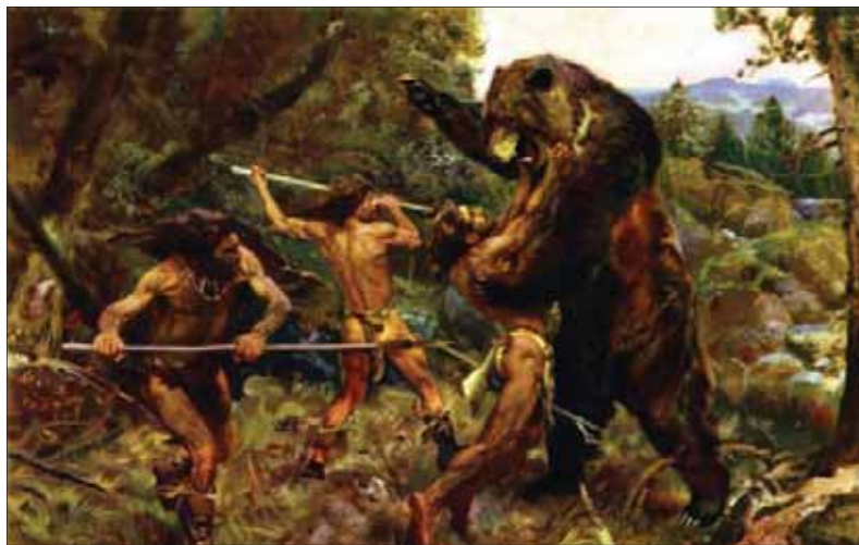
Po lovcoch medveďov sa zachovali stopy vo viacerých jaskyniach na Slovensku.

Podľa náhodne pohodeňných kostí možno predpokladať, že aj v Domici a v neďalekej Androvskej jaskyni naši predkovia pojedali ľudské mäso. V Androvskej jaskyni sa našla