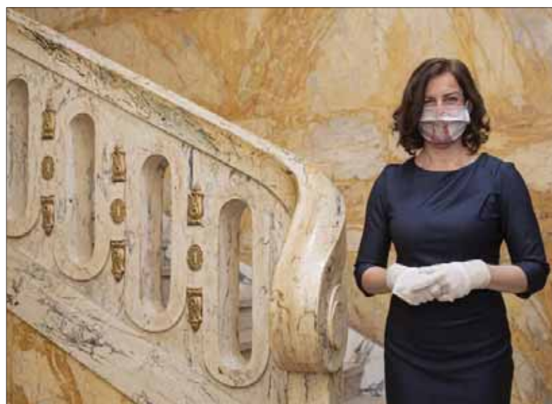
Osoby zahalené rúškami a v rukaviciach sme doteraz na oficiálnych portrétoch vládných činiteľov nevidali – tento patrí novej ministerke kultúry Natálii MILANOVEJ – uvidíme, aké zásadné zmeny do rezortu prinesie.

Ministerstvo pracuje v obmedzenom krízovom režime, pri komunikácii s úradom jeho pracovníci žiadajú verejnosť, aby uprednostnili elektronickú komunikáciu – emaily, elektronickú podateľňu. Úrad verejného zdravotníctva od 10.