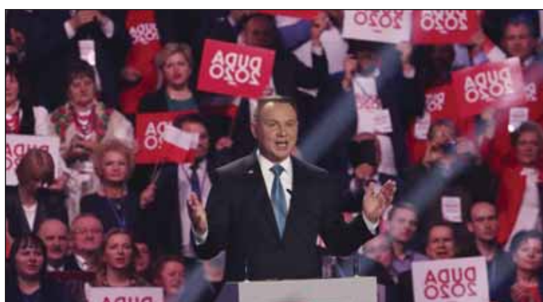
Podľa testov predvolebných nálad u našich severných susedov má najväčšie šance uspieť v prezidentských voľbách doterajší populárny prezident Andrzej DUDA.

Ani neprekvapuje, že najhlasnejšou hlásateľkou potreby preloženia volieb je najviac strácajúca predstaviteľka opozície M. Kidawa-Błońska, resp. jej zoskupenie Občianska koalícia. Okrem prirodzenej obavy o bezpečnosť a zdravie občanov sa za týmto skrýva aj úsilie o druhú šancu na nový dych. Nielen medzi analytikmi, ale aj v radoch tohto bloku sa objavujú dokonca úvahy a špekulácie o možnosti výmeny kandidátov v prípade, ak by kríza okolo pandémie