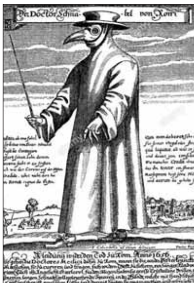
Lekár na ceste k nakaženému v maske a ochrannom plášti

Pamätný mor s katastrofálnymi následkami najmä na západnom Slovensku u nás aj v susednom Rakúsku zúrila v roku 1679. Epidémia sa najprv objavila vo Viedni začiatkom januára 1679.