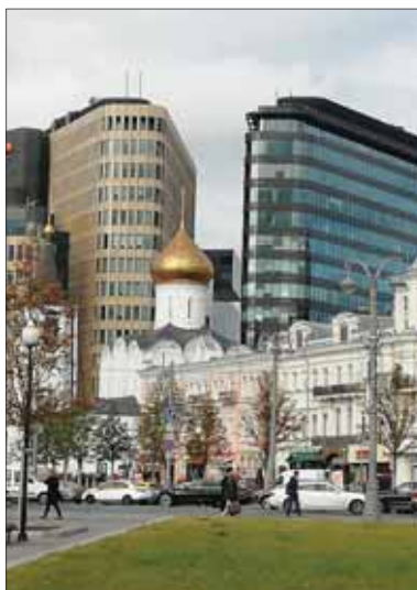
Moskovské paradoxy súčasnosti – pozlátané cibuľovité vežičky stáročných pravoslávnych chrámov v objatí moderných stavieb, kde sa naplno a neviazane uplatňuje architektonická vynachádzavosť a odvaha.

Na mávanie rukou, aby ste zastavili taxík, ako kedysi, keď vlastne v Moskve bolo každé auto taxík a každý si privyrábal, treba zabudnúť. Nikto nezastane. Moskovčania sa ma ujali ako malého dieťaťa, keď videli, ako sa neúspešne usilujem mávaním zastaviť jeden taxík za druhým. Kto v ruštine, kto v angličtine, ale každý srdečne ponúkol pomoc. Mali v mobilnom telefóne aplikáciu zdatného ruského konkurenta google – yandexu,