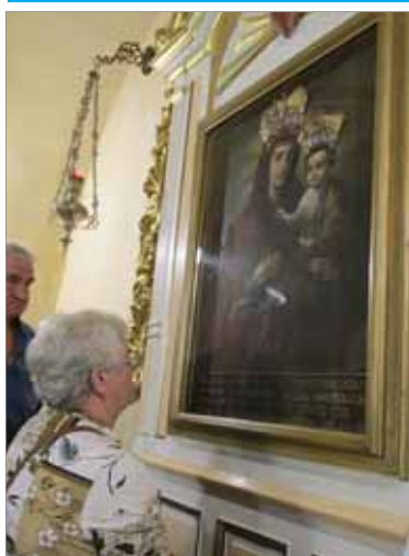
Veriaci pri zázračnej ikone klokočovskej plačúcej Bohorodičky

ju do Mukačevského hradu vyžiadala grófka Žofia Bátoriová, ktorá po smrti manžela Juraja Rákociho