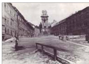
Námestie v Banskej Štiavnici s majestátnym Mariánskym stĺpom