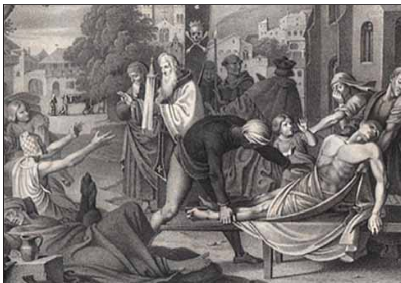
Morovej epidémii v Bazileji podľahli tisícky obyvateľov.

zavítala v roku 1509. Rozšírila sa z Viedne na Záhorie, potom do okolia Trnavy. Vyčítala aj za Dunajom, v Győri, vo Veszpréme a v Budíne. Panovník Vladislav II. aj s deťmi zo strachu ušiel z budínskeho kráľovského paláca do Prahy. Mnohé dediny na Záhorí zostali ľudoprázdne. Po skončení epidémie zemskí páni lákali na pusté majetky osadníkov najmä z Chorvátska, kde už šarapatili Turci. Prví chorvátski kolonisti, ktorí prišli do Lamača okolo roka 1513, spomínali, že južné Záhorie bolo pusté, niekdajšie polia pokrývali húštiny a v nich sa skrývali zbojníci.