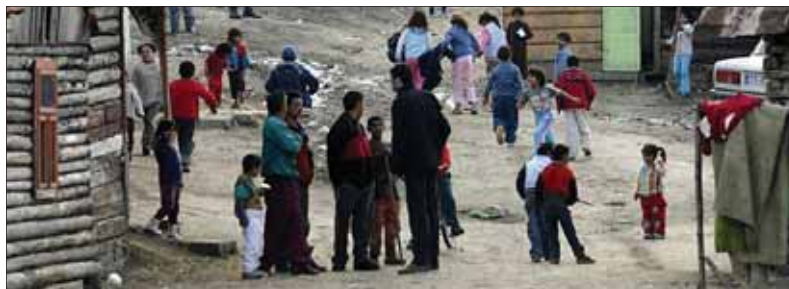
Na snímke osada Dobrá vôľa pri Spišských Vlachoch

Predseda poslaneckého klubu Smer Robert Fico opäť potvrdil, že Smer trvá na nominácii Ľuboša Blahu na čelo ľudskoprávneho výboru. „Ako je možné, že jeden inteligentný, sčítaný človek, ktorý toho má najviac načítané z národnej rady, akceptovaný Ľuboš Blaha nemôže byť predsedom výboru, ale