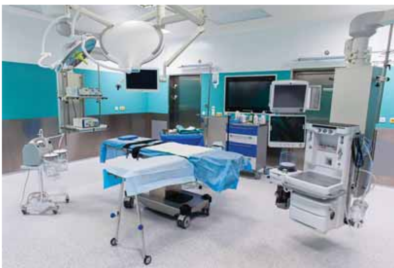
V začiatkoch transplantácií nebolo u nás zďaleka také prístrojové vybavenie ako dnes. Slovenskí lekári si ho museli dokonca vyrábať sami.

nie, a v imunológii nemajú skúsenosti, iba veľa o nej hovoria. Ide o jedincov, ktorí bez tvrdej práce v odbore chcú robiť teóriu a formulovať nejaké zásady. Naša generácia vychádzala práve z teórie a z náročnej laboratórnej práce. Najskôr sme sa zdokonalili v biochémii, v mikrobiológii a až potom sme mohli riešiť praktické otázky.