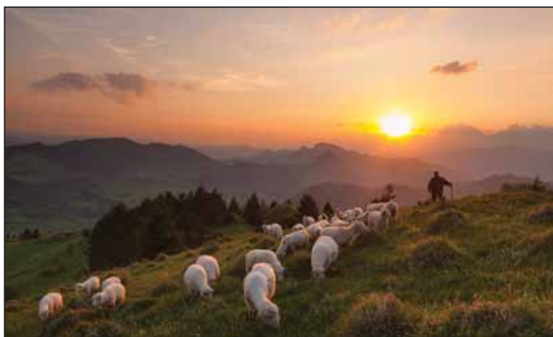
Ovčiarske pastorále – ako ho môžu precítiť iba tí, čo zostali chovu oviec verní...