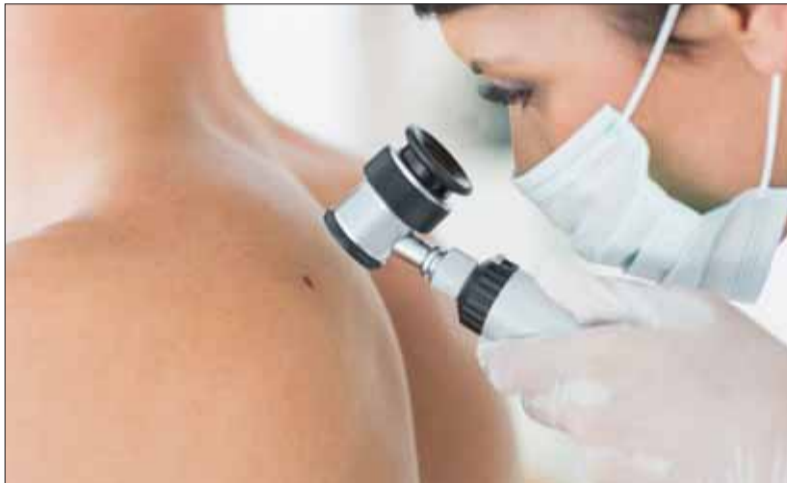
Aj akože „materinské znamienko“ môže byť zárodkom vážnej kožnej choroby...

A to nehovorím o nadmernom užívaní tabliet vitamínov C, D a E. Pacient si doslova nasype do úst naraz hrst vitamínov a zapije ich napríklad čistou citrónovo-grepovo-pomarančovou šťavou. A ešte denne vypije liter zázvorového čaju, dá si aspoň pol