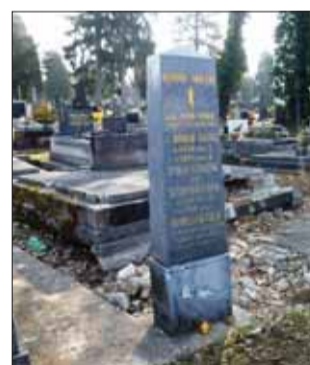
Posledné miesto odpočinku je národnou kultúrnou pamiatkou, no v súčasnosti sa nachádza vo veľmi zlom stave.

a samozrejme, fotozariadenie pre fotografovanie koloidným spôsobom, čo bolo na vtedajšiu dobu veľmi náročné. Zaujímavosťou zo svetlotlačiarenskej dielne Divaldovcov je, že na zadnej strane farebne vytlačenej pohľadníc uvádza v ľavom hornom rohu vytlačený emblém trojvršia s dvojramenným krížom, nad ktorým je kvet plesnivca – symbol Vysokých Tatier.