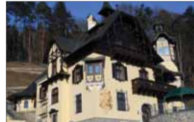
Legendárna literárna Vila Tereza, ktorú preslávila básnická zbierka Laca Novomeského.

Legenda hovorí, že história kúpeľných oplátok siaha až do osemnásťho storočia. Na ich vznik má zásluhu šikovný cukrár a kuchár z premonštrát-