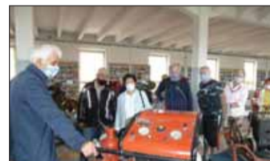
V Hasičskom múzeu v Martine-Priekope je mnoho unikátnych exponátov, ktoré zaujali najmä mužských návštevníkov, ktorí si so záujmom prezreli hlavne motorové striekačky a pohonné agregáty.

foriem z celého sveta a množstvo fotografického materiálu. Múzeum je jedinečné v strednej Európe, veď niektoré jeho exponáty pochádzajú ešte z 19. storočia. Po prehliadke uhasili smäd v blízkom občerstvovacom zariadení.