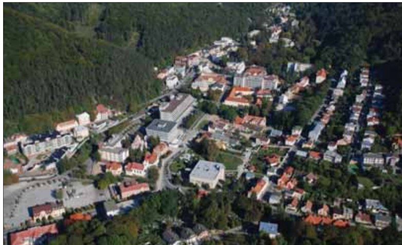
Letecký pohľad na kúpeľné mestečko Trenčianske Teplice, ležiace v nádhernej doline plnej zelene pod vrchom Klepáč

Podľa starej povesti liečivé pramene v lokalite dnešných Trenčianskych Teplíc objavil chomý pastier pri hľadaní zatúlanej ovečky. Našiel malé jazierko s horúcou vodou, z ktorého sa šírila sivý zápach, a po niekoľkých kúpeľoch v ňom sa jeho boľavé kĺby uzdravili. Teplé pramene v lokalite museli poznať už začiatkom nášho letopočtu lovecké národy Kvádov a Markomanov. Poznali ich zrejme i rímske légie – napovedá to aj nápis na trenčianskej hradnej skale z roka 179. Prvý písomný záznam o prameňoch však pochádza až z roka 1247. Od 13. do 19. storočia patrilo územie