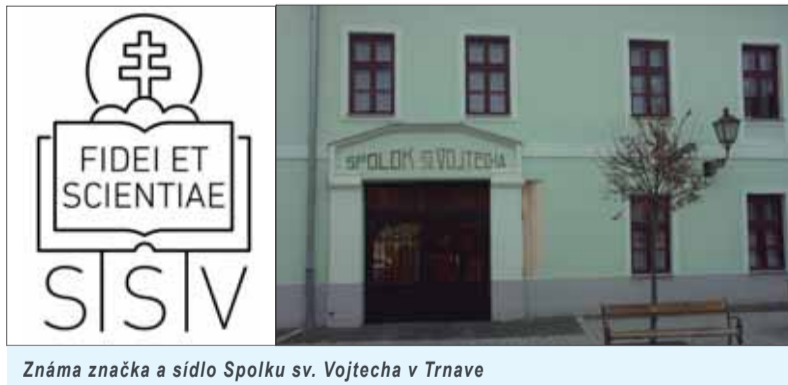
Známa značka a sídlo Spolku sv. Vojtecha v Trnave

Uhorská vláda nedovolila pomenovať spolok podľa našich vierozvestcov sv. Cyrila a sv. Metoda, teda obnoviť úctu k nim a hlásiť sa k ich dedičstvu, vrátane v ich časoch existujúcej samostatnej cirkevnej provincie, naši mali záujem, aby sa celý národ hlásil k veľkomoravskej ideji, čo by znamenalo utužiť národnú jednotu.