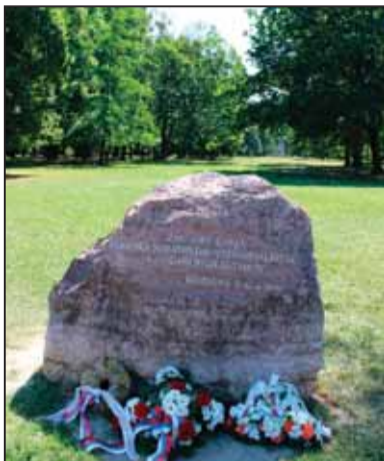
Základný kameň k pomníku slovenského vystaňovalectva v Sade Janka Kráľa v Petržalke

Deň zahraničných Slovákov je sviatkom státisícov našich krajanov, žijúcich po rôznych historických etapách vystaňovalectva, emigrácie či súčasnej ekonomickej migrácie mimo svojej vlasti či domoviny predkov. Slováci takto splynúvajú so svetom však, našťastie, v prevažnej miere, nezabúdajú na svoje korene, pôvod, jazyk, reč a kultúru. Zveľaďujú svoju slovenskosť, dbajú o zachovanie národného povedomia a kultúrnej identity. Deje sa tak prakticky už od začiatku 18. storočia, keď začali osídľovať Dolnú zem a jej oblasti v dnešnom Maďarsku, Rumunsku, Srbsku a Chorvátsku. Deň zahraničných Slovákov ako sviatok všetkých našich krajanov si pripomínáme od roka 1993, teda od vzniku samostatnej Slovenskej republiky.