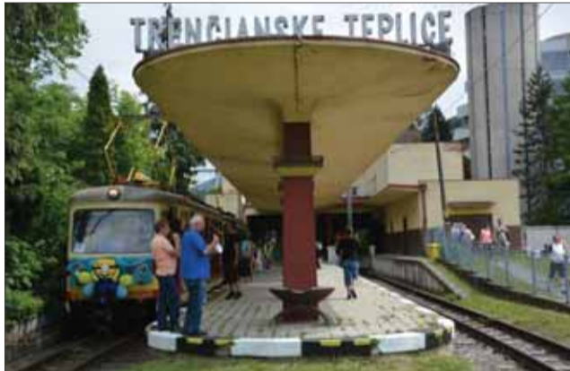
Nostalgia za električkovú úzkokojajkou...

Kúpele Trenčianske Teplice sa špecializujú na liečbu a prevenciu ochorení pohybového aparátu, stavy po operáciách a úrazoch, chronických reumatických ochorení pri niektorých civilizačných chorobách, chorôb z povolania, ale aj ochorení z oblasti internej medicíny, gynekologických a kožných ochorení vrátane psoriázy. K najčastejším diagnózam návštevníkov termálnych kúpeľov patrí kúpeľná liečba po operácii – endoprotéza napríklad bedrového kĺbu, kolena a podobne, kúpeľná liečba po operácii chrbtice. Všeobecnou indikáciou kúpeľnej liečby je zlepšenie pohyblivosti a zmiernenie bolestivých stavov a zachovanie udržateľnej kvality života vo vyššom veku. Dôležitý je pozitívny vplyv kúpeľnej liečby na psychiku chorých.