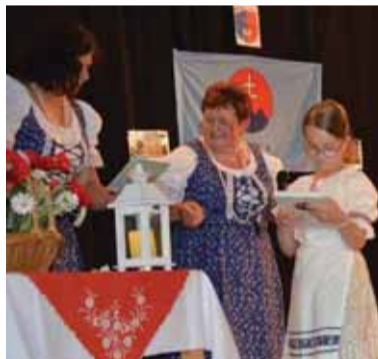
Na záver podujatia Knihomole vo Veľkých Lovciach odmenili školákov knihami.

Podakovanie patrí obci Veľké Lovce za pomoc, ktorú MO MS neustále poskytuje. Patrí aj všetkým za účasť a akúkoľvek pomoc pri organizovaní podujatia.