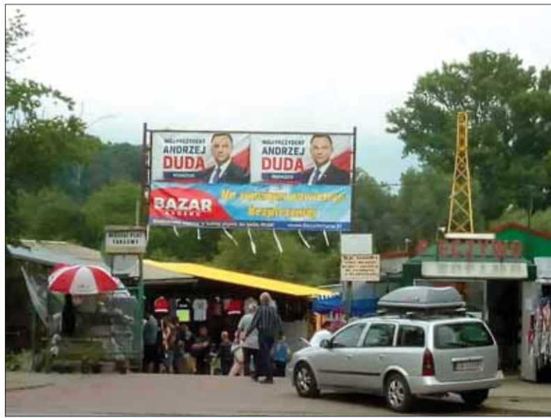
Poľsko posledné týždne doslova žilo predvolebnou kampaňou, ako dosvedčuje aj predvolebný billboard umiestnený na vstupnej bráne populárneho trhoviska v Krosne.

Napriek nápadnej zmene tónu provládnych médií, vedúcich dosiaľ proti nim ťažkú vojnu, obviňujúc ich najmä z proruskosti (čo sa považuje za najťažšiu zradu), možno očakávať pomerne slabú odozvu na ich apely na vlastenecké čítanie adresované Konfederácii. Zvlášť ak K. Bosak nedal svojim voličom odporúčanie koho voliť. Mnoho jeho sympozantov, ako vidno v diskusiách na sociálnych sieťach, má pochoopenie pre toto gesto, pričom deklaruje svoju rozhodnosť ignorovať tradičné argumenty o menšom zle. Rovnako Trzaskowski nemôže automaticky počítať s podporou Hołowniových voličov, ktorí zrejme tiež vo veľkom odignorujú druhé kolo. Enigmou je možná účasť v prvom kole abstinujúcich voličov, ktorí taktiež môžu prekvapiť. Za týchto okolností je predvídať víťaza volieb ťažko. Predpokladá sa dá len to, že rozdiel medzi kandidátmi sa môže pohybovať v rozmedzí jedného percenta. Z daných pomerov možno predpokladať, že kým Dudova kampaň motivovaná úsilím presvedčiť Bosakových voličov bude viac konfrontačná, Trzaskowski, naopak, sa bude štylizovať skôr ako „šriteľ pokoja“. Neutralizuje najvýraznejšie prejavy svojej liberálnej agendy tak, aby bol priechodnejší aj u vidieckeho voliča. Dôležitú rolu pri konečnom rozhodnutí v tejto situácii mnoho analytikov vidí v priamej diskusii oboch kandidátov, ku ktorej dosiaľ nedošlo, a či vôbec bude zatiaľ nevedno, vzhľadom na opatrnosť oboch strán, ktoré si uvedomujú, že v nej môžu veľa získať, ale aj takmer všetko stratiť.