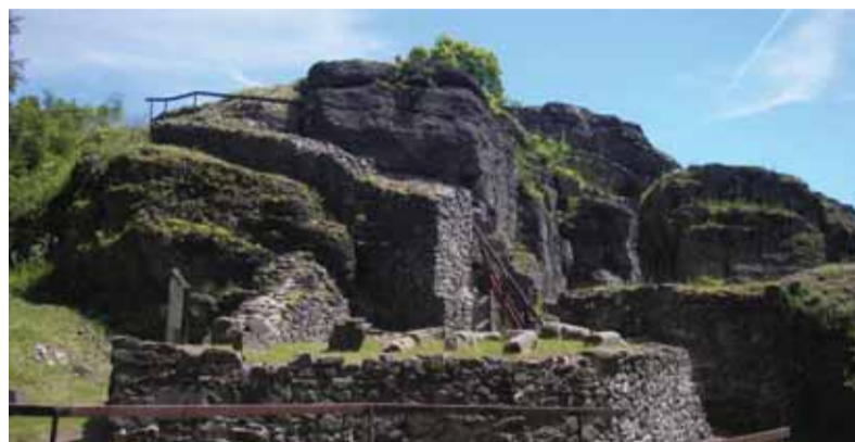
Na Sitne v stredoveku vyrástol hrad, ktorý bol dôležitým oporným bodom proti osmanskému nebezpečenstvu. Skazu mu však privodili kuruci počas stavovských povstaní, ktorí ho premenili na ruiny...

„Zo Sitna najkrajšiu panorámu poskytuje sever, a síce pohľad na najbližšie okolie.“ pokračuje Andrej Kmeť. „Tam biely svätoantonský kaštieľ v zeleni ako plávajúca labuť na zelenom jazere v nádherom rozsiahlom parku; tam roztratená sem tam po „visáciach“ Štiavnica kopcoch“ (cituje Hollého) so sveto-