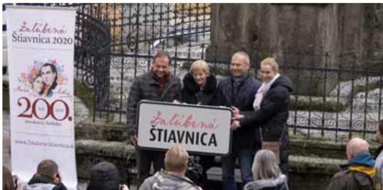
Slávnostný vstup do projektu Zaľúbená Štiavnica sa uskutočnil pred niekoľkými mesiacmi.

Kto z nás, ešte zo školských lavíc, by si nespomenul na azda najslávnejšiu strofu básne Andreja Sládkoviča Marína? Možno mi tvojich úst sa odrieknuť, / možno mi ruku nedostať, / možno mi v diaľky žiaľne utieknuť, / možno mi nemilým ostať, / možno mi ústam smädcom umierať, / možno mi žiaľil' v samote, / možno mi život v púšťach zavierať, / možno mi nežiť v živote, / možno mi seba samého zhubiť: / nemožno mi ťa neľubiť!