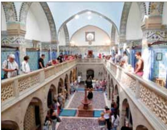
Architektonický skvost Hammam

Hammam je jeden z typov parných kúpeľov, aké mali kedysi k dispozícii len členovia bohatej šľachty a finanční magnáti. Priaznivé efekty parného