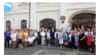
Účastníci slávnostného aktu odhaľovania tabule