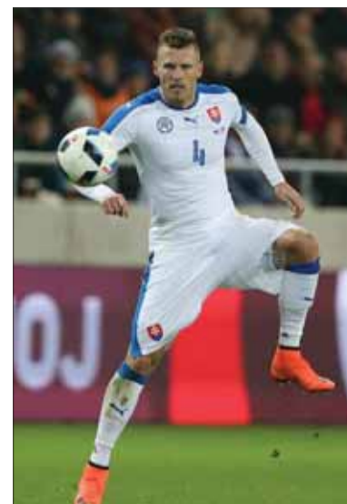
Ján ĎURICA patril dlhé roky k oporám mužstiev, za ktoré nastupoval doma i v zahraničí, a rovnaké hodnotenie si vyslúžil aj v reprezentačnom drese svojej vlasti.

V nevydarenom prvom zápase s Walesom možno rozhodol moment, keď na začiatku zápasu Marek Hamšík nepremenil svoju vyloženú šancu. Platilo staré známe: nedáš – dostaneš. Prehrali sme 1 : 2. Podobne ako v Južnej Afrike aj tu sme kalkulovali, že ak vyhráme s Walesom, s Rusmi chytíme jeden bod, sme v osemfinále. Nakoniec všetko dopadlo úplne inak. Ak sme chceli postúpiť do vyradovacej fázy turnaja, museli sme nad Ruskom bezpodmienečne zvíťaziť. Podarilo sa. Mali sme tri body. Pre mňa osobne to