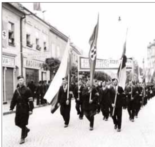
Pochod gardistov počas osláv vzniku Slovenského štátu