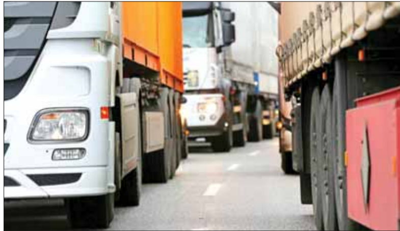
Dovážame už všetko! Denne k nám privážajú tovary kolóny kamiónov – ich počet sa zo sedemsto počas každého pracovného dňa v roku 2018 zvýšil už na terajších osemstodvadsaťtri!

Minister pôdohospodárstva Ján Mičovský sa vyjadril k Strategickému plánu na najbližších sedem rokov. Potravinovú bezpečnosť považuje za kľúčovú prioritu. „Tie miliardy, ktoré prúdili z rôznych štruktúrnych schém, neboli dobre využívané. Žalostný stav musíme zmeniť a posunúť sa hore. Zápornú bilanciu o množstve dovážaných potravín chceme v najbližších