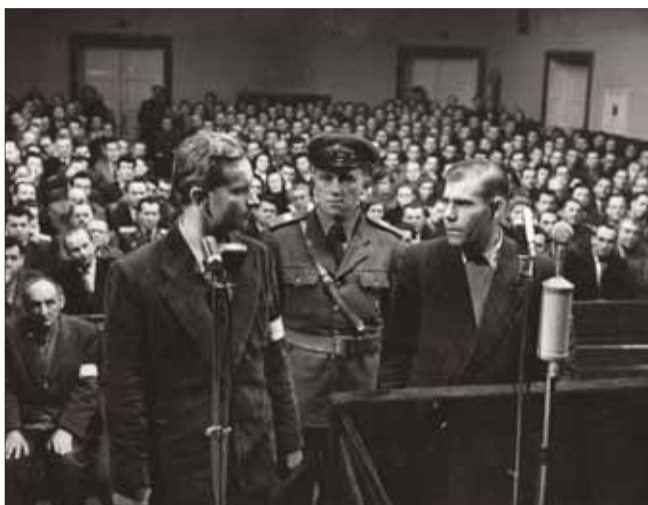
Snímka z procesu s členmi Hlinkovej gardy z roku 1958

V historiografii pred roka 1989 a, bohužiaľ, i u niektorých autorov aj dnes prevláda čierno-biele videnie dejín, ktoré z členov Hlinkovej gardy, poprípade jej ozbrojených zložiek v čase SNP, automaticky robí vrahov a „fašistov“.