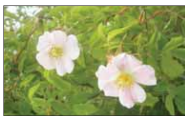
Tam hore na Sitne biela ruža kvitne...

Jeho archeologické výskumy potvrdili osídlenie ľuďom lužickej kultúry z konca doby bronzovej. Val vtedajšieho hradiska je dodnes viditeľný. Asi v 13. storočí postavili na Sitne hrad, ktorý bol sídlom feudálneho panstva, ale aj dôle-