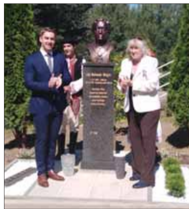
Miestny odbor Matice slovenskej v Dubnici nad Váhom bol spoluorganizátorom odhalenia busty Jánovi Baltazárovi Maginovi. Bol kňazom a vlastencom. Pamätník odhalili v spolupráci s mestom Dubnica nad Váhom.

stala tradícia. Rovnako zakúpil pre farnosť nové zvony, liturgické predmety, obstaral nový organ, zadovážil krstiteľnicu, posvätné rúcha. Veľkou mierou sa podieľal na dobudovaní kaplnky v Dubnickom kaštieli, kde aj slúžieval sväte omše. Okrem kňazských povinností sa však aktívne zaujímal aj o históriu. Rovnako venoval veľkú pozornosť duchovnému rozvoju dubnickej farnosti. J. B. Magin sa natrvalo zapísal do dejín slovenského národa tým, že na dubnickej fare napísal v roku 1723 Apológiu čiže Obranu Slovákov.