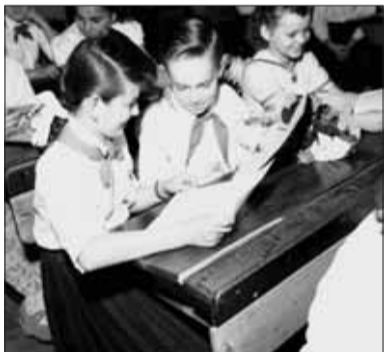
Pionierska organizácia bola najväčším oficiálnym združením socialistickej mládeže. Veľakrát boli pionieri zneužívaní na politické aktivity komunistickej strany. Pioniermi museli byť všetci žiaci povinne.

aj špačinskí komunisti, ktorí dovtedy podporovali „obrodný proces“. Už nehorlili za socializmus s ľudskou tvárou, ale poukázali na to, že normalizačný dokument Poučenie z krízového vývoja strany a spoločnosti „môžeme právom zaradiť medzi najpravdivejšie, najdôslednejšie a najrealistickejšie dielo, ktoré naša strana za svojej 50-ročnej histórie vydala“. Vo svetle týchto okolností pracoval aj MNV, ktorý „svojou činnosťou, masovopolitickou a organizátorskou prácou prispel ku konsolidácii pomerov v obci i okrese“. Za to všetko, pravdaže, mali Špačincania ďakovať Sovietskemu zväzu, „ktorý 21. 8. 1968 vstúpil so svojimi vojskami na naše územie a takto nás zachránil od nepriateľských živlov“. Jedna vec sú slová, ktoré sa stali súčasťou socialistického folklóru, druhou stranou mince sú skutky, ku ktorým prichádzalo počas normalizácie, a neobišli ani výchovno-vzdelávací proces v obci.