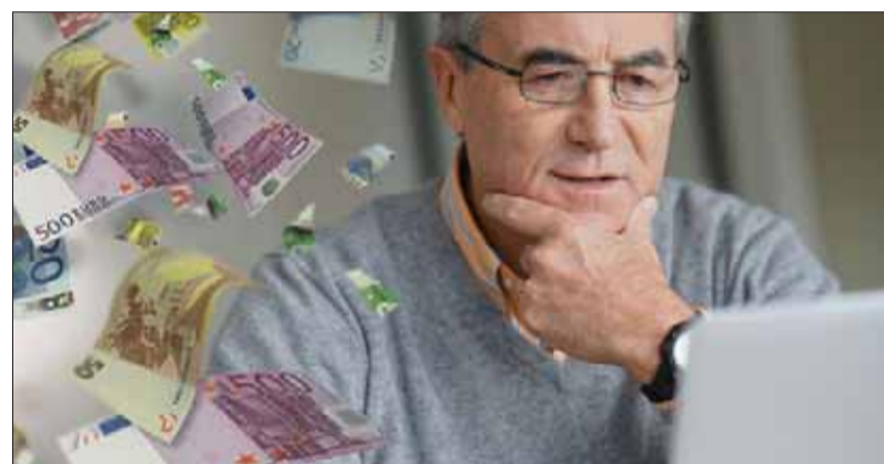
Vláda prináša balík sociálnych opatrení vo výške päťsto miliónov eur.

Rezort práce predloží do medzirezortného pripomienkového konania návrh zákona o trinástom dôchodku. Ide tak meniť zákon, ktorý ešte prijala bývalá vláda. Minister práce Milan Krajniak povedal, že dôchodcovia dostanú viac ako dvojnásobok toho, na čo boli zvyknutí. Trinásť dôchodok majú dostať seniori v tomto roku, na tom sa nič nemení. „Zákon