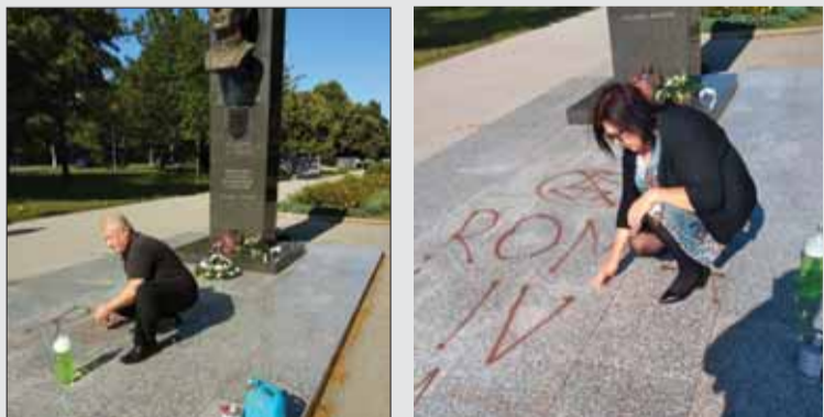
Manželia vlastenci z bratislavskej Rače ručne a svojpomocne vyčistili celý pamätník Andreja Hlinku v bratislavskom Ružinove.