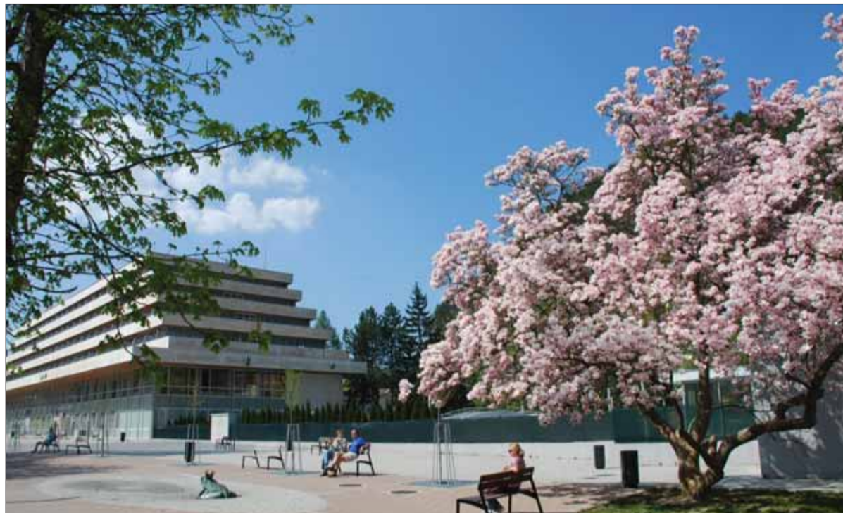
Kúpeľná liečba je súčasťou komplexnej rehabilitácie. Pôsobí na viacerých úrovniach. Jedny z najznámejších slovenských kúpeľov vybudovali v Trenčianskych Tepliciach.

Nám sa podarilo v roku 1997 dosiahnuť, že hipoterapia sa stala oficiálnou liečebnou metódou, akcep-