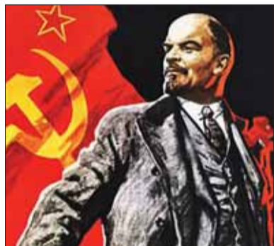
Na triednych nástenkách nemohli visieť náboženské symboly, ale tvrdá prosociet- ská propaganda. Čím bola nástenka viac „ideologická“, tým bol triedny učiteľ lepšie odmeňovaný...

Samozrejme, iná bola situácia v mestách a iná na dedinách. Nedá sa síce paušalizovať, keďže praktická realizácia vždy závisela od horlivých riaditeľov či straníkov, predsa len na dedine, kde bolo silnejšie náboženské čítanie a ľudia sa bližšie poznali, nebola situácia natoľko vyhrtená. V Bratislave ako hlavnom meste si dali záležať na tom, aby sa náboženstvo vyučovalo čo najmenej, ak vôbec. V školskom roku 1962/1963 úrady dovolili vyučo-