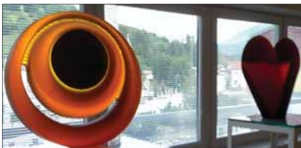
Tradícia a viera – dva zo základných pilierov terchovského podujatia