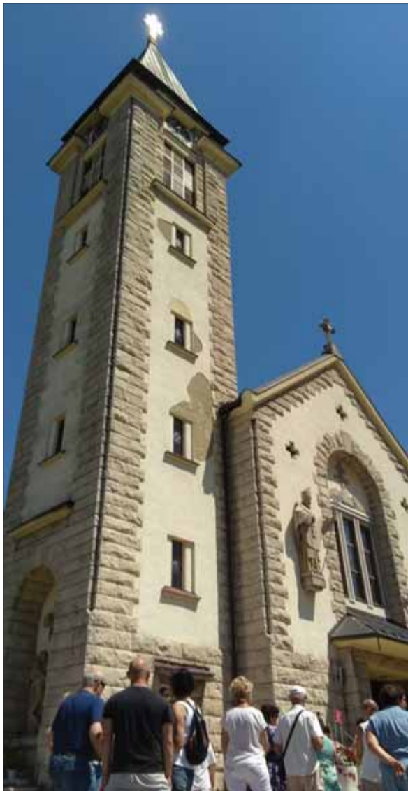
Najväčší slovenský kostol zasvätený svätým Cyrilovi a Metodovi navrhoval architekt Dušan Jurkovič.

A ešte niečo podstatné a aktuálne sa udialo. Nie tak dávno, v máji 2013, začali Terchovčania pokrývať svoj kostol novou medenou strechou, vlastnými silami a za vlastné, medzi cirkevníkmi vyzbierané financie. Ktorí aj takto prejavili svoj úprimný vzťah