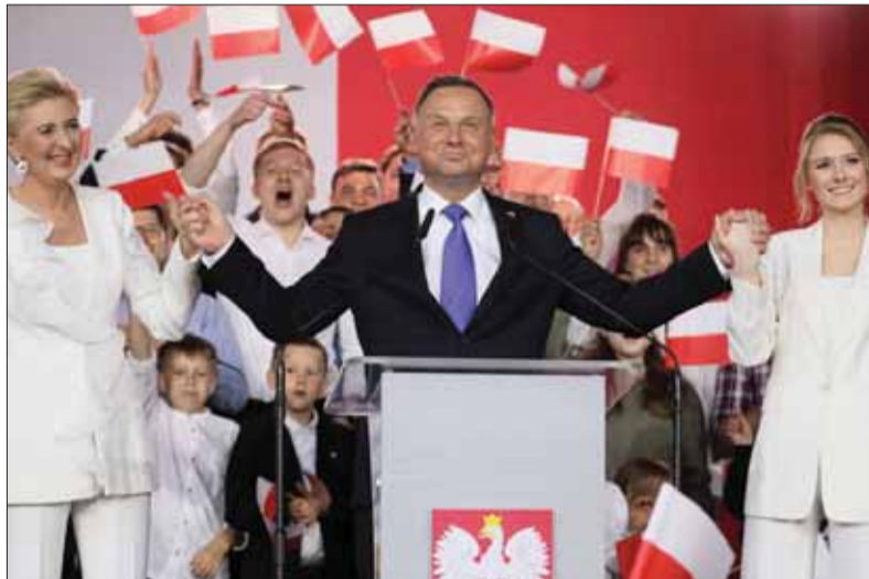
Vítaz prezidentských volieb v Poľsku Andrzej DUDA spolu so svojou manželkou a s dcérou ďakuje voličom za podporu.

Andrzej Duda vyhral s historicky najnižším rozdielom v histórii poľských volieb od povolenia komunistickej diktatúry. Dvojpercentným náskokom pred svojím protivníkom, kandidátom opozičnej Občianskej platformy, liberálom Rafałom Trzaskowskim prekonal aj svoj doterajší rekord spred piatich rokov, keď vyhral nad Bronisławom Komorowskim. Lenže vtedy to bolo len pri päťdesiatpäťpercentnej volebnej účasti. Volebná účasť v terajších voľbách stúpila na výnimočných šesťdesiatosem percent, čím sa priblížila rekordnej, dosiaľ najvyššej účasti z volieb v roku 1995. A. Duda v druhom kole zvýšil počet svojich voličov o 1,8 milióna, pričom celkovo získal úctyhodných takmer 10,5 milióna voliča – teda najväčší počet voličov, aký doteraz získal jeden z kandidátov. Napohľad nevelký dvojpercentný rozdiel medzi kandidátmi predstavuje pri takýchto obrovských číslach takmer štyristopäťdesiat tisíc hlasov. Zaujímavosťou je, že Duda v druhom kole vyhral len v šiestich vojvodstvách na juhovýchode krajiny. Naproti tomu Trzaskowski získal prevahu v desiatich vojvodstvách na severozápade a v centrálnej časti krajiny. Zjednodušene by sa tiež dalo povedať, že prezidenta zvolil vidiek