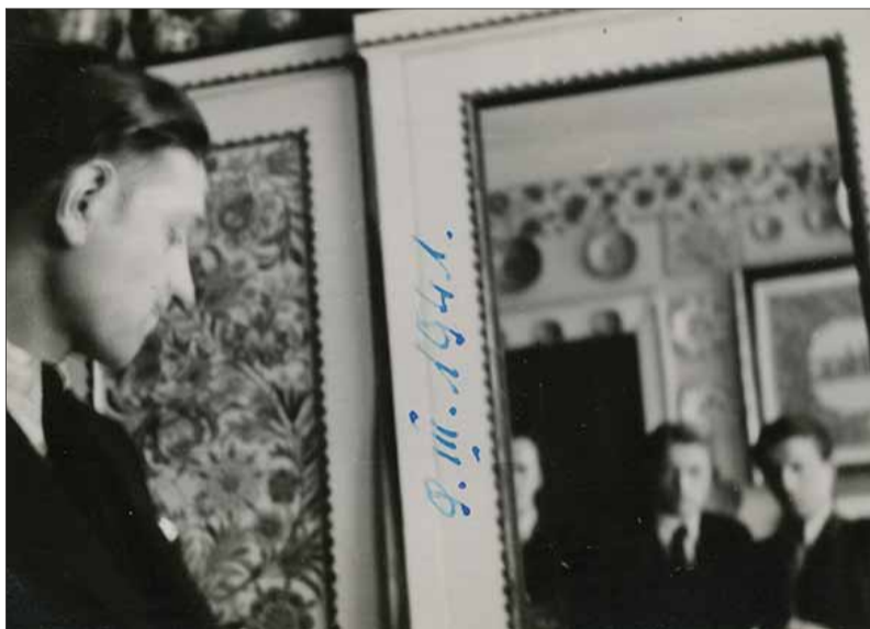
Majster vo svojom ateliéri, 1941

Povstanie, príchod a prechod frontu negatívne vplyvali na život a tvorbu umelca i jeho spolupracovníkov. Pod vplyvom udalostí urobil náčrt veľkého obrazu, ktorý chcel venovať predstaviteľom slovanských národov zúčastnených na odboji... v národných krojoch. Po vojne sa všetko zmenilo: hospodárske a politické pomery, štátny útvar, kultúrne smerovanie i ľudské hodnoty. Väčšina obyvateľstva na Slovensku mala existenčné problémy... Načrtnutý vlastenecký všeslovanský obraz