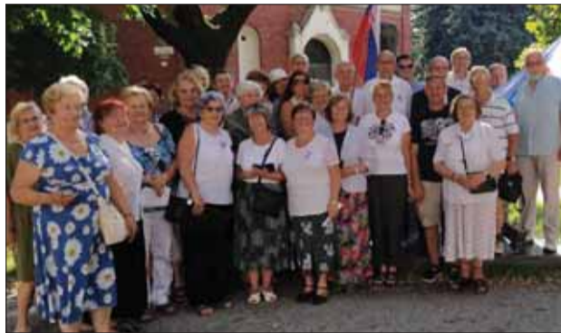
Cyrilo-metodskú tradíciu si pripomenuli aj matičiari v metropole východného Slovenska. Matica sa k tejto tradícii dlhodobo hlási a ctí si ju.

V Košiciach sa podujatie venované sv. Cyrilovi a Metodovi usporadúva od roka 1993. Keď bola v roku 1997 osadená busta katolíckemu kňazovi Štefanovi Moysesovi, slávi sa tento sviatok každoročne pri jeho buste. Inak to nebolo ani tohto roka, keď si 5. júla symbolicky pripomínáme 1157. výročie príchodu sv. Cyrila a Metoda na Veľkú Moravu. Štefan Moyses je neodmysliteľne spätý s týmito svätcami, pretože v tento deň si pripomínáme výročie jeho skonu, ktoré pripadlo na 1006. jubileum spomienky na týchto svätých.