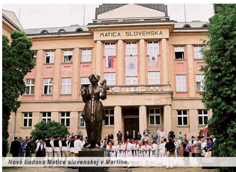
Nová budova Matice slovenskej v Martine.

Zarážajúce názory súčasného predsedu Zahraničného výboru nášho parlamentu F. Šebeja