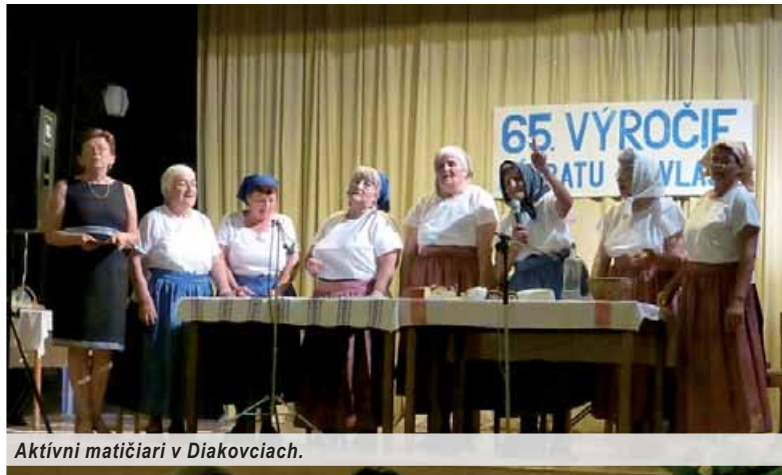
Aktívni matičiari v Diakovciach.

Kým na jar prebehlo v Sereďi iba spomienkové stretnutie návratcov z Maďarska, v jesenných mesiacoch si v jednotlivých obciach a mestách pripomínajú Slováci z Maďarska 65. výročie slávnostnejšie. Matičiari v Diakovciach boli medzi