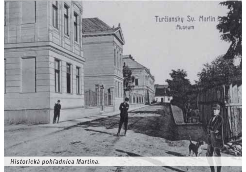
Historická pohľadnica Martina.