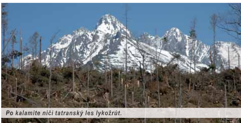
Po kalamite ničí tatranský les lykožrút.

Napriek tomu, alebo možno práve preto, že na Slovensku sa dlhodobo tretí sektor považuje za výkonný politický orgán oprávnený rozhodovať o všetkom, dostali sa až dvaja bývalí ministri životného prostredia pred prokurátora; dokonca ich spis už prevzal aj Úrad boja proti korupcii. Obvinenie je postavené na konštatovaní, že ministri v roku 2004 nepovolili v lokalite postihnutej veternou smrťou ťažbu kalamitného dreva. Ibaže – v piatom stupni ochrany, v ktorom sa táto lokalita nachádza, je takáto ťažba zákonom jasne zakázaná. A tak do jednej pasce padol minister bývalej SMK spolu s ministrom bývalej SNS. Dôvod tohto právneho nezmyslu spočíva práve v existencii istej odnože ekoterorizmu na