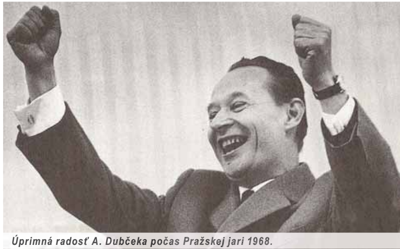
Úprimná radosť A. Dubčeka počas Pražskej jari 1968.

Po roku 1990 sa Alexander Dubček vo funkcii predsedu parlamentu pričínil o prijatie zákonov, ktoré obnovili občiansku spoločnosť, pluralitu politického systému a zahrnuli do nášho zákonodarstva Listinu základných ľudských práv z legislatívy Európskej únie. Európska agenda bola po roku 1990 pre Dubčeka kľúčová. Jeho prvá zahraničná cesta vo funkcii predsedu FZ ČSSR viedla už v januári 1990 do Štrasburgu, kde nadviazal prvé oficiálne kontakty s Parlamentným zhromaždením Rady Európy a prebral Cenu mieru Alexandra Sacharova, ktorú mu udelil Európsky