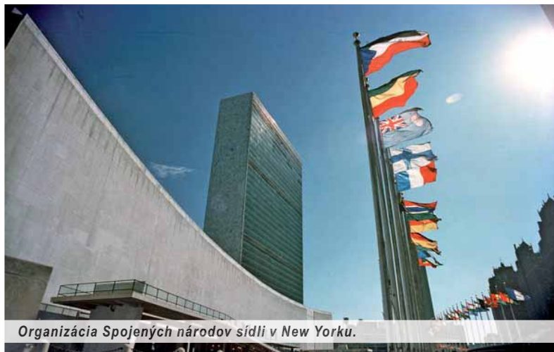
Organizácia Spojených národov sídli v New Yorku.

BRATISLAVA (Ján ČERNÝ) – „Organizácia Spojených národov je v danej chvíli pre triezveho pozorovateľa, ktorý na to nepozera ružovými okuliarmi, v mnohých aspektoch skôr škodlivá ako prospešná organizácia,“ povedal František Šebej pri príležitosti nedávneho Dňa OSN, ktorý sa už od roku 1948 celosvetovo pripomína vždy 24. októbra.