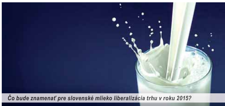
Čo bude znamenať pre slovenské mlieko liberalizácia trhu v roku 2015?

Brusel ponúkol pomoc jednotlivým krajinám Únie v rámci takzvaného mliečného balíčka. Ide o súbor opatrení, ktoré môžu štáty využiť, aby zmiernili dosah zrušenia kvót na svojich poľnohospodárov. Producenti mlieka sa tak budú môcť zlučovať do organizácií a ich prostredníctvom rokovať s odberateľmi o výkupných cenách. V jednom takom združení budú môcť byť zastúpení poľnohospodári, ktorých chovy neprekročia spolu 33 percent domácej