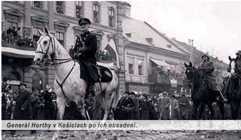
Generál Horthy v Košiciach po ich obsadení.

Druhý ročník filmovej prehliadky Festival slobody priniesol okrem iných pozoruhodných filmov aj krátkometrážny, ale aj nízkonákladový dokument – úplne ojedinelé filmárske dokumentárne dielo Arbitráž . Film z dielne Ústavu pamäti národa – znie to neuveriteľne – je v poslednom desaťročí prvým pokusom rečou filmového dokumentu zachytiť a uchovať výpovede pamätníkov na udalosti niekoľkých dní v roku 1938.