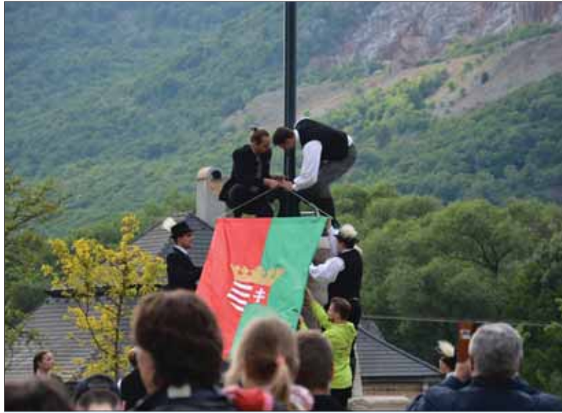
Letný tábor v Slavci-Gombaseku v okrese Rožňava sa stal v čase, keď si pripomíname storočnicu od podpisu Mierovej zmluvy v Trianone, miestom ojedinelej provokácie, keď tamojší iredentisti tu vyvesili na stožiar vlajku, ktorá pripomínala niekdajšie ponížujúce postavenie Slovákov v Uhorsku.

Nechcú si totiž priznať, že tisícročné Uhorsko je už minulosťou. Aj keď mnoho slovenských Maďarov sa postupne zmierilo s touto historickou skutočnosťou, niektorí zaslepení iredentisti dodnes podnecujú nenávisťné vášne proti štátotvornému slovenskému národu. V deň stého výročia Trianonu štvrtého júna 2020 Občianske združenie Sine Metu v priestoroch Gombaseckého letného tábora provokatívnym spôsobom vztýčilo „felvidécku“ vlajku, symbolizujúcu „odtrhnutie jednotného“ maďarského národa od svojej „materskej“ krajiny. Chvalabohu, väčšina slovenských Maďarov už dnes odmieta takéto provokatívne akcie. Uvedomujú si, že ako národnostná menšina majú na Slovensku oproti Slovákom v Maďarsku nadštandardné postavenie.