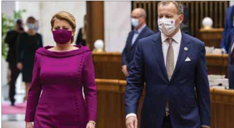
Mnohí pozorovatelia charakterizovali prvú správu prezidentky o stave republiky ako vyváženú.

Prezidentka skritizovala stav digitálnej infraštruktúry a zdôraznila potrebu jej zlepšenia. Tiež poukázala na to, že hospodársky model, ktorý bol založený na nízkych mzdách a na lákaní priamych zahraničných investícií, sa už zrejme vyčerpal. Slovensko by podľa prezidentky malo podporovať domáce podnikateľské prostredie. Skutočnosť, že je dielňou svetových