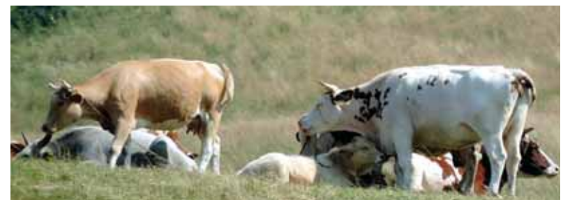
Nová slovenská vláda si stanovila významný cieľ v poľnohospodárstve – potravinovú sebestačnosť vo všetkých potravinách mierneho klimatického pásma.