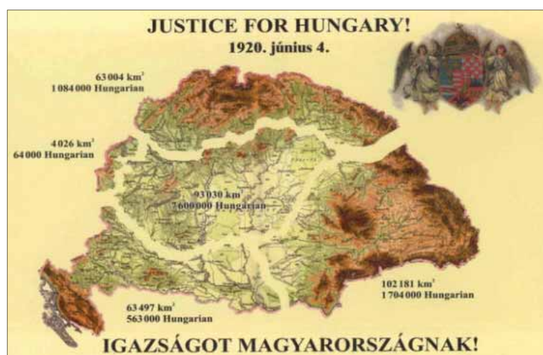
Toto má byť spravodlivosť pre Maďarsko, ako si ju predstavujú mnohí u našich južných susedov.

Po zlých skúsenostiach s národným útlakom a maďarizáciou sa nikto nemôže čudovať našim predkom, že bojovali za vystúpenie z tisícročného uhorského štátneho zväzku s Maďarmi. Uhorsko výrazne stratilo svoje pôvodné princípy, na ktorých sa budovala jeho štátnosť až do 18. storočia, keď sa spustil proces legálnej a ilegálnej maďarizácie. Projekt „veľkého Uhorska“ pod dominanciou Maďarov v strednej Európe zlyhal pre neschopnosť politických elít Uhorska riešiť národnostnú a sociálnu otázku, ako aj otázku demokratizácie spoločnosti. Koleso dejín sa pohlo a v rokoch 1918 až 1920 sa cesty moderného slovenského a maďarského národa rozišli. Práve Trianonom získali Maďari svoj vlastný národný štát, ktorý im mnohonárodnostné Uhorsko pre svoju multietnickú povahu nemohlo dať. Nepochopenie podstaty národno-emancipačných hnutí národov Uhorska sa skončilo jeho rozpadom. Žiaľ, toto nepochopenie pretrváva v časti maďarského obyvateľstva dodnes. Ako keby ich predkovia žili v inom Uhorsku než Slováci, Rumuni, Chorváti, Srbi, Poliaci, Nemci, Židia či Rusíni. Po Trianone pripadla Maďarsku tretina územia Uhorska, ostatné jeho časti pripadli národom, ktoré na nich žili. Zároveň je historickým faktom, že Najvyššia rada spojencov nedokázala stanoviť novú hranicu medzi