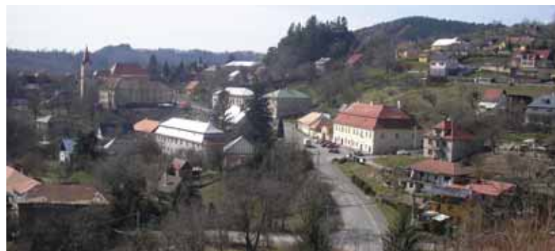
V niekdajšom Piargu – dnes v Štiavnických Baniach, sa narodil astronóm svetového mena Maximilián HELL.

S napätím očakávali 3. jún 1769. Obávali sa počasia, ktoré je v týchto