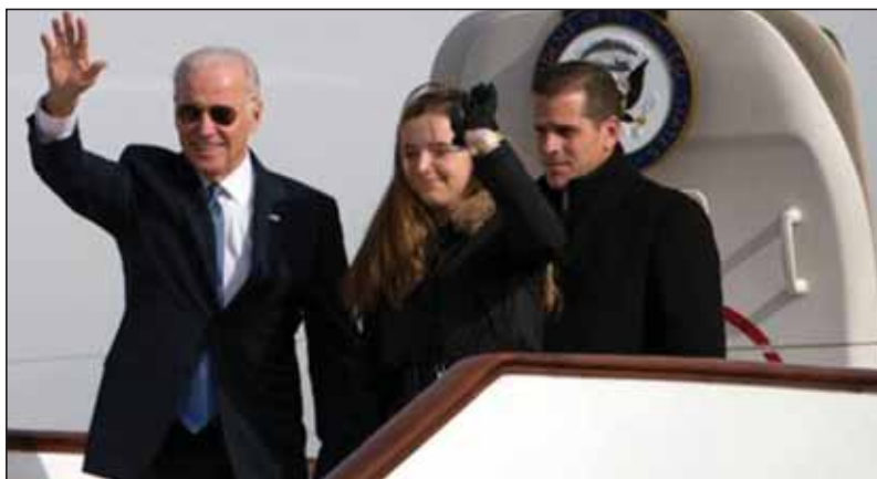
Rodina bývalého viceprezidenta a terajšieho uchádzača o post prezidenta USA za Demokratickú stranu Josepha Robinetta Bidena Jr. má v Ukrajine viaceré nie celkom „kôšer“ záujmy a aktivity.