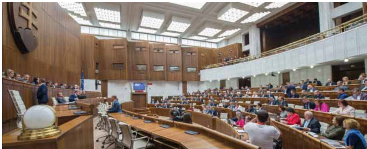
Len krátko po konštituovaní novej Národnej rady Slovenskej republiky nastávajú v jednotlivých jej poslaneckých kluboch rošády a presuny, ba reálne sa predpokladá aj vznik nových stranických zoskupení.