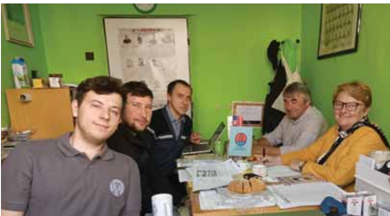
Začiatkom júna sa uskutočnilo bilančné aj „povzbudzujúce“ stretnutie matičných pracovníkov Banskobystrického kraja.

Prvé stretnutie matičných pracovníkov v Banskobystrickom kraji sa konalo štvrtého júna 2020 v novej matičnej kancelárii vo Zvolene. Zaujímalo nás, ako matičiari prežili dlhý čas núdzového stavu, spôsobeného novým koronavírusom a chorobou Covid-19, bez stretávania. Rokovanie prebiehalo akoby po zimnom spánku, s radosťou na nové príležitosti a s novou silou. Bilancovali sme, ktoré odbory sa zobudia bezproblémovo, ktoré zaspia na večnosť alebo ktorým pôjdeme pomôcť a „nasilu“ ich zobudíme. Zistili sme, že niektoré odbory potrebujú možno len naštartovanie, pretože sil majú stále dosť. Na druhú stranu, mnohé odbory tento čas využili na systematickú prípravu plánovaných podujatí. Ku koncu stretnutia sme sa dohodli na revitalizácii viacerých odborov, ktorým chceme podať pomocnú ruku pri zobúdzaní sa k životu. Najviac nádeje vkladáme do toho, že