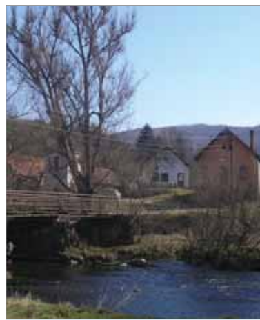
Most v centre obce Slatinka

ktorá sa písomne prvýkrát spomína v roku 1388, začala platiť stavebná uzávera a väčšina z asi dvesto päťdesiatich obyvateľov sa musela voľky-nevoľky presťahovať do Zvolena alebo do Zvo-