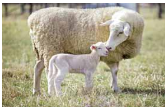
Koronavírusová pandémia prehĺbila aj problémy slovenského ovčiarstva, keď „odstrihla“ roky zaužívaný systém vývozu jahniat do Talianska.

Jahňacie mäso býva na našich tanieroch iba výnimočne, a to je škoda. Patrí k tomu najzdravšiemu, čo medzi mäsom možno nájsť. Obsahuje výrazné množstvo protizápalových omega-3 mastných kyselín aj kyseliny olejovej pre zdravé srdce, ktorú najčastejšie prijímame v olivovom oleji. Preto by si náš organizmus zaslužil, aby sa nám na jedálnom lístku objavovala jahňacina oveľa častejšie. Nielenže vyniká jemnosťou, ale je plná minerálov potrebných pre zdravé fungovanie tela. Navyše je jahňacie mäso