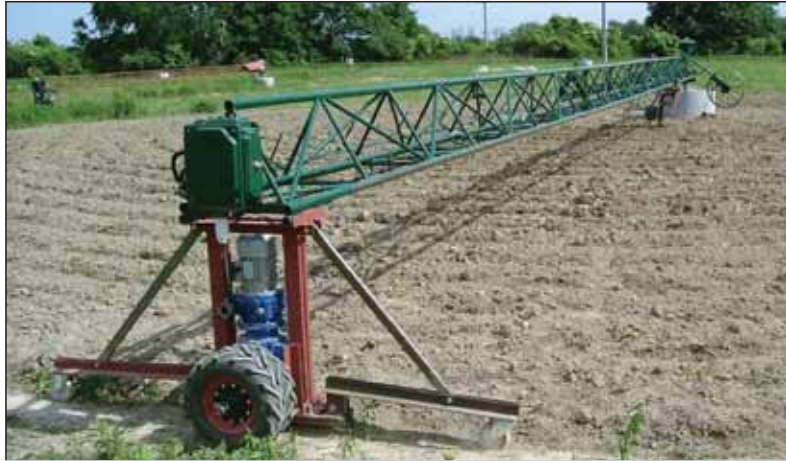
Pestovanie zeleniny v kruhu s použitím mostovej technológie

„Asi desať percent povrchu zemskej kôry sa využíva na produkciu potravín, čo v rozvinutých krajinách spravidla znamená, že po týchto plochách sa pohybuje voľne