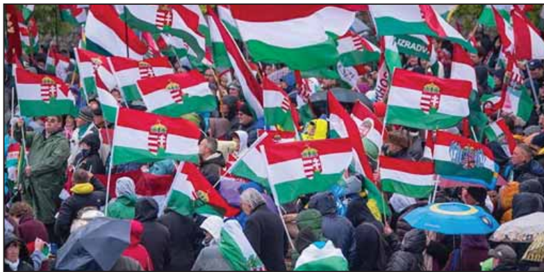
Niekdajšie masové spomienkové podujatia na Mierovú zmluvu z Trianonu pri okrúhlych výročiach, plné konfrontačných tónov, tentoraz vláda našich južných susedov odložila, zrejme pod tlakom svetovej pandémie aj nevyriešených sporov s Európskou úniou.