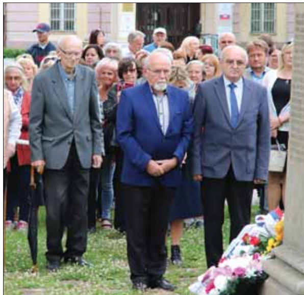
Takmer z troch desiatok obcí v Liptove prišli divadelní ochotníci do Liptovského Mikuláša, aby na mieste, kde v auguste 1830 uviedol Gašpar Fejérpataky-Belopotocký komédiu Jána Chalupku Kocúrkovo, vzdali v Roku slovenského divadla hold tomuto národovcovi, ale aj svojim predchodcom, ktorí v Liptove i po celom Slovensku udržujú takmer dvestoročnú tradíciu ochotníckeho divadelníctva.

Na počesť Gašpara Fejérpatakyho-Belopotockého a z úcty a vďaka liptovským ochotníkom bola ulica pred budovou Národnej kultúrnej pamiatky Čierny orol v Liptovskom Mikuláši v pondelok 15. júna miestom stretnutia účastníkov podujatia, ktoré sa konalo pri príležitosti sto deväťdesiateho výročia vzniku ochotníckeho divadla na Slovensku a Roku slovenského divadla.