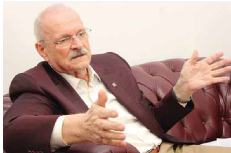
Matica stále má byť a pôsobiť ako správca slovenskej identity, kultúry a národného povedomia. Jej poslanie je najmä v hľadaní porozumenia a dobrého spolunažívania s národnostnými menšinami – to sú odporúčania bývalého prezidenta Ivana Gašparoviča.

Podľa môjho názoru na Slovensku dnes neexistuje nijaká relevantná kresťanská politická strana, nie je ňou ani KDĽ. Súčasný politický subjekt nie sú budované na základe kresťanstva, ale ho akceptujú skôr z hľadiska politického ako ideologického. To, že niekoľko takých politických strán medzi sebou podpísalo tzv. pakt o neútočení, bojovali v podstate o rovnakého kresťanského voliča, ktorý pochopil, že im nejde ani tak o kresťanskú morálku, ale o ich podporu. To sa im stalo nakoniec osudným. Aj sám kresťanský volič si to uvedomil.