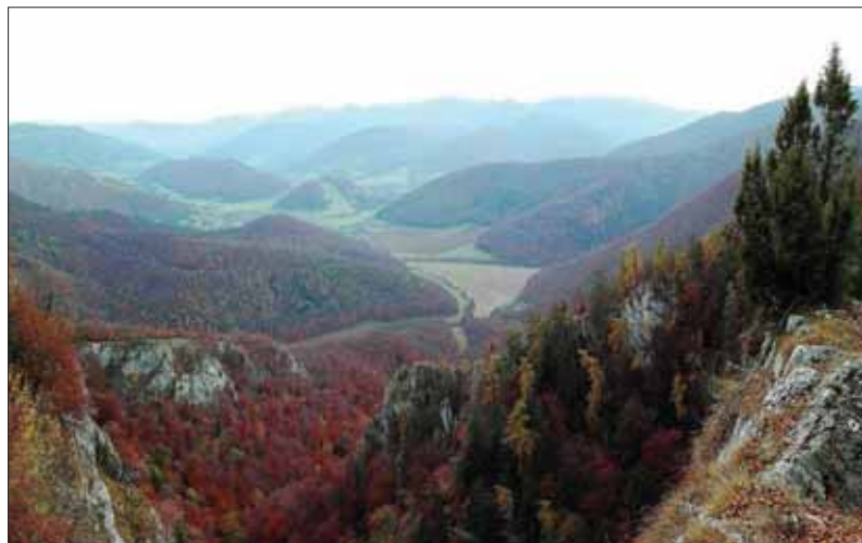
Zonácia má v Národnom parku Muránska planina vytvoriť až päťdesiatpercentné bezzásahové územie a dosiahnuť tak medzinárodné platný štandard...

samosprávnym krajom, ktorý má pripravený projekt akejsi pracovne ovčej vlny, hodnota ktorej sa tým zvyšuje. Naviazať na to by mali iné projekty, ktoré by mali do regiónu priniesť ďalšie pracovné možnosti, najmä v rámci takzvaného mäkkého turizmu. Finančnú podporu