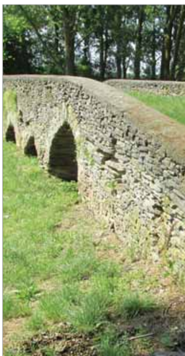
Most svätého Gottharda v Lelesi je kultúrna pamiatka zo 14. storočia

točnili mnohé vodohospodárske úpravy, ktoré zmenili vodný režim tak, že bývalý tok rieky Tickey pod mostom vyschol, takže v súčasnosti gotický most preklenuje už len suché koryto. Aj na samotnom moste sa podpísal zub času, keď kamene postupne zvetrali a uvoľňovali sa z konštrukcie. Zastaviť tento proces a vynoviť historický most – kultúrnu pamiatku, sa podarilo v roku 1994 vďaka prostriedkom z fondu Pro Slovakia. V súčasnosti je tento most turistická atrakcia. Menšie opravy na ňom pravidelne robí obec. Neďaleké lužné lesy a močiare ukrývajú mnoho vzácných živočíšnych druhov. Spomínaný kláštor premonštrátov je zasa najstarší na Zemline. V písomných prameňoch sa spomína už v roku 1214. Cesta k nemu viedla práve cez romantický, históriou dychajúci most, ktorý odborníci považujú za najstarší starobylý most na území Slovenska. Ten zo Spišských Drahoviec je síce o storočie starší, ale už bol upravovaný, takže jeho pôvodný stav a vzhľad je zachovaný iba vo vrchnej časti mosta.