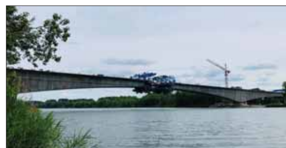
Šiesty most cez Dunaj je súčasťou diaľničného obchvatu Bratislavy.

Celkovo ide o najdrahší infraštruktúrny projekt v dejinách nezávislého Slovenska. Výška investície sa pohybuje na úrovni 1,9 miliardy eura. Koncesionárom projektu D4/R7 je spoločnosť Zero Bypass Limited, ktorá zabezpečuje financovanie, výstavbu a prevádzku obchvatu Bratislava počas tridsiatich rokov. D4R7 Construction je hlavným dodávateľom projektu.