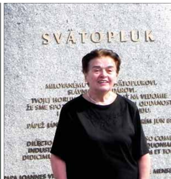
Na fotografickej koláži z redakčného archívu je veľká slovenská herečka a vlastenka Eva KRISTINOVÁ v rôznych obdobiach života vo chvíľach „pracovných“ i sviatočných...