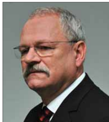
Bývalý prezident Jeho Excelencia Ivan Gašparovič v exkluzívnom rozhovore pre náš týždenník vyslovil viaceré odporúčania, ako riešiť konflikt rezortného ministerstva s jeho najstaršou inštitúciou.