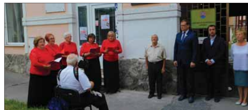
Na pietnom akte uctenia Juraja Janoška v Lučenci sa zúčastnili aj predstavitelia Matice slovenskej .

Matica slovenská odhalí bustu Andreja Hlinku v Košiciach