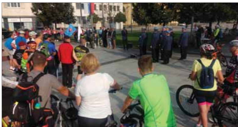
Takmer sto cyklistov pozdravilo 29. augusta tohto roka výročie SNP už siedmou symbolickou cyklojazdou organizovanou mladými matičkami po miestach, ktoré sú s ozbrojeným vystúpením Slovákov proti fašizmu spojené.

Na podujatí okrem položenia kytic a vencov organizátori cyklo-