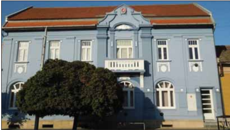
Budova Matice slovenskej v Báčskom Petrovci

zo Spolku vojvodinských Slovakistov v zime 1989. Zásadný podnet na jej oživotvorenie však odznel 29. decembra 1989 na zasadaní rozšíreného predsedníctva Ochotníckeho divadla VHV scény v Petrovci. Zo zasadnutia bol prijatý