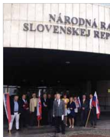
Účastníci tlačovej besedy ZSI Korene pred budovou Národnej rady SR