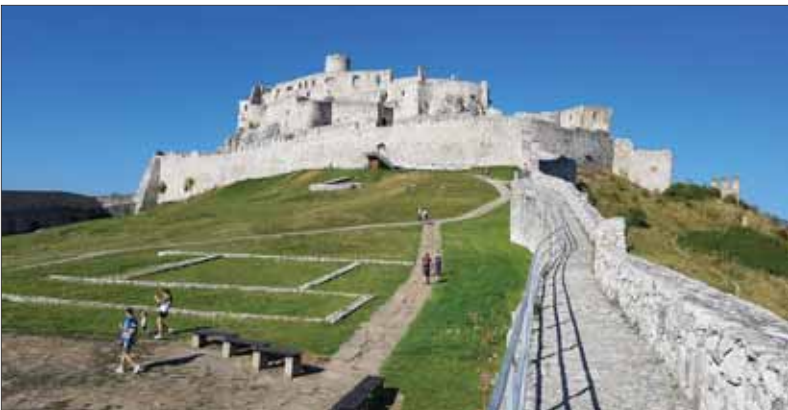
Spišský hrad v celej svojej majestátosti a kráse