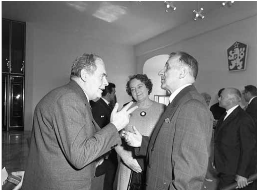
Ladislav Novomeský patril medzi komunistických politikov, ktorý si nedával obrúsok pred ústa. Kritizoval režim. Bol predsedom Matice slovenskej.

Novomeský, Clementis, Okáli, Mináč, ale aj Husák chceli budovať socializmus cestou, ktorá mala zdôrazniť slovenské kultúrne záujmy. Sám Novomeský bol predsedom aj čestným predsedom Matice slovenskej i Spolku slovenských spisovateľov. Na rozdiel od dogmatikov, pre ktorých robotník nemal vlasť, boli davisti na strane vlasteneckého socializmu, čo prízvukovali od SNP až po Košický vládny program. Či sa to podarilo, alebo nepodarilo naplniť, je na pováženie.