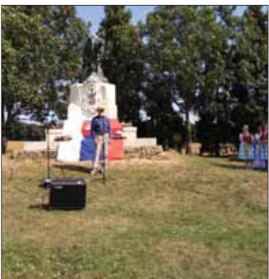
Jozef PROKEŠ počas vystúpenia pri pamätníku vozokanskej bitky