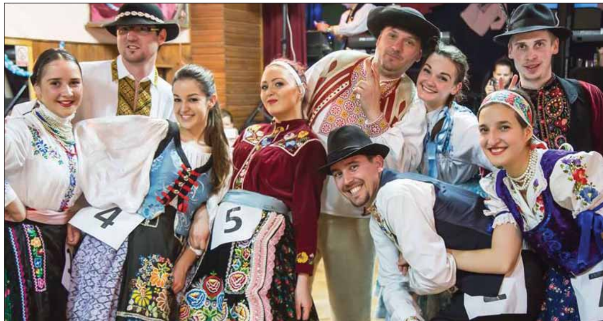
Mnohé kultúrne domy v mestách a obciach a podujatia v nich oživujú len nadšenci nezištným prístupom a úprimným vzťahom k zachovávaniu regionálnych zvykov a kultúrnych tradícií.

cia miestnej a územnej samosprávy. Všetci členovia asociácie sa zhodujeme v názore, že je nevyhnutné, aby štát venoval tomuto sektoru kultúry náležitú pozornosť. Zvlášť v tomto zložitom čase, keď sa tieto inštitúcie dostali do veľkých ťažkostí pre ich nútené zatvorenie po nariadení štátu.