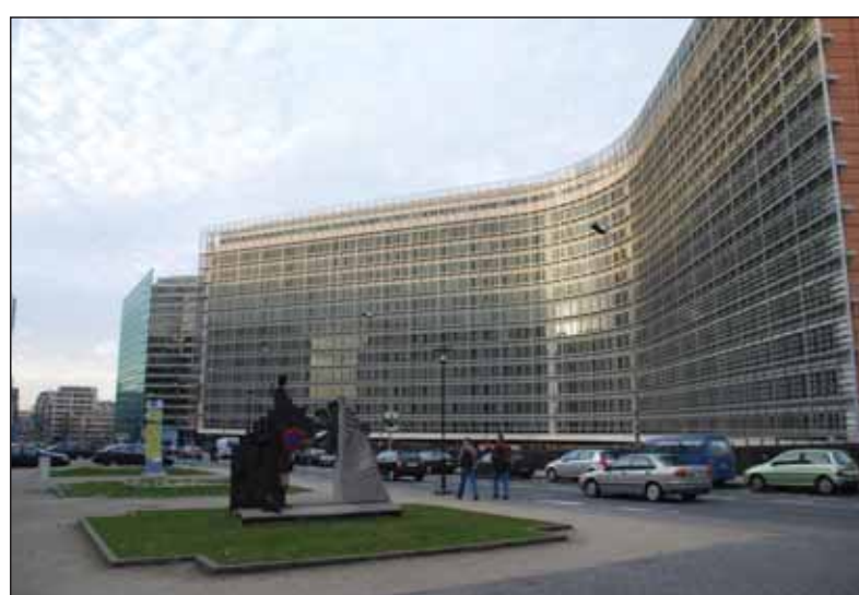
V bruselskej centrále EÚ sa rozhoduje o miliardách ekonomickej pomoci pre krajiny spoločenstva, ale prv ako ich jednotliví uchádzači dostanú, musia predložiť zmysluplné plány s odporúčaním, že musia byť prednostne zamerané na digitálne a zelené projekty.

Predchádzajúca koalíčná vláda presadzovala politiku sociálneho štátu cez sociálne balíčky, ktoré zvyšovali deficit verejných financií a verejného dlhu k HDP. Pomohli najmä dôchodcom a mladým rodinám, čo určite bolo správne. Škoda, že sa popri nich nemyslelo aj na potrebu vytvárania rezervných fondov, ktoré nám