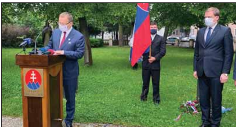
Predseda parlamentu Boris KOLLÁR ocenil prínos Maticy pre celú slovenskú spoločnosť už počas svojej prvej oficiálnej návštevy ustanovizne v Martine.

Predseda Národnej rady SR Boris Kollár pri tejto príležitosti vyzdvihol vo svojom príhovore v priamom prenose RTVS 1. 9. 2020 národno-emanipačný proces slovenského národa. „Slovenská národná rada prvého septembra 1992 prijala verejným hlasovaním a ústavou väčšinou sto štrnásť hlasov hierarchicky najvyššie postavený právny predpis mladého demokratického štátu – Ústavu Slovenskej republiky.“ Pripomenul, že jej prijatie sa stalo v roku zásadných zmien s väzbami na budúcnosť slovenského národa a národnostných menšín vyvrcholené prvého januára 1993 vznikom samostatnej a demokratickej Slovenskej republiky. „Tým sa dovŕšil stáročný národný pohyb na ceste k samostatnosti a k medzinárodne uznanéj demokratickej repub-