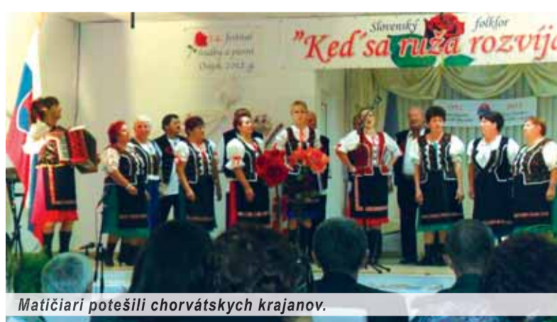
Matičiari potešili chorvátskych krajanov.