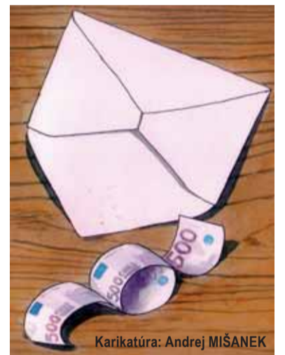
Karikatúra: Andrej MIŠANEK

moval o stave Národného pokladu. Venoval sa súčasnému stavu a predstavám nadácie, ako naložiť s nepeňažnou časťou Národného pokladu tak, aby plnil svoj pôvodný cieľ. Nepeňažnou časťou sa rozumie zozbierané umelecké predmety a predmety z drahých kovov – najmä zo zlata a striebra. Peňažnú časť Národného pokladu nadácia investovala do riskantných finančných operácií v podobe akcií CI Holdingu a neskôr aj Podielového družstva PDSI. Išlo asi o 23 miliónov vtedajších korún, dnes 870 tisíc eur. (Viac na 2. strane)