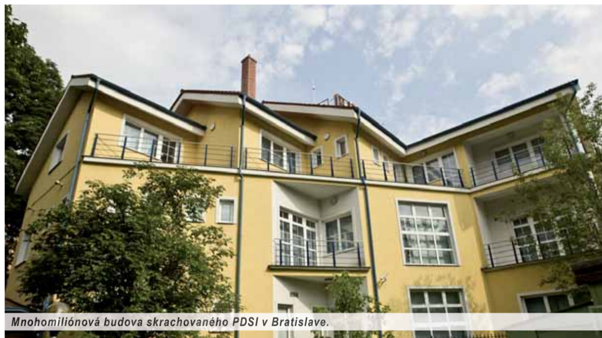
Mnohomiliónová budova skrachovaného PDSI v Bratislave.