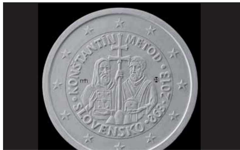
Na minci nemala byť svätožiara ani symbol križa na odevu svätých.