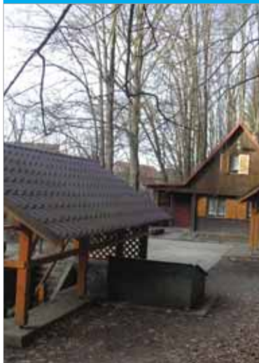
Voda prameňa Medokýš je bohatá na minerálne látky a je výsledkom dozvukov sopečnej činnosti Javoria v mladších treťohorách.

krásy – priveľa fliaš nevydržalo dlhú prepravu.