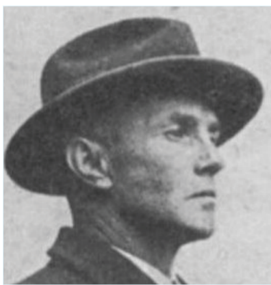
Ministerský predseda Štefan TISO

Sidor napísal po francúzsky štyridsaťdvastránkový Pamätný spis pre Svätého Otca pápeža Pia XII. „o slovenskej a českej otázke“. Poukázal v ňom na vzrastajúce slovenské národné povedomie a na slovenské štátne uvedenie, ktoré sa na Slovensku stalo politickým faktorom. Pokiaľ ide o formu, v ktorej by sa program budúceho slovenského života mal uplatniť, na to sa treba opýtať Slovákov. V tomto dokumente Sidor kladie tieto otázky: 1. Sú Slováci za znovuvytvorenie ČSR alebo za udržanie SR? 2. Sú Slováci za spojenectvo so ZSSR alebo za federáciu Slovenska s Českom, Poľskom, Maďarskom,