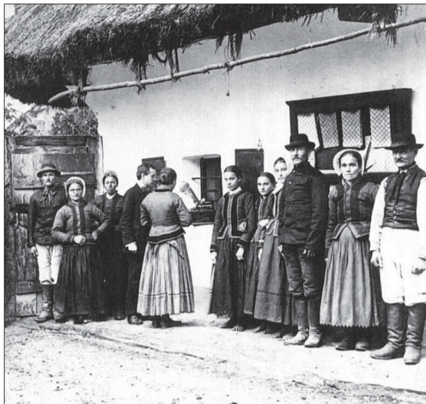
Na dobovej fotografii B. Bartók pri nahrávaní originálnych slovenských ľudových piesní.