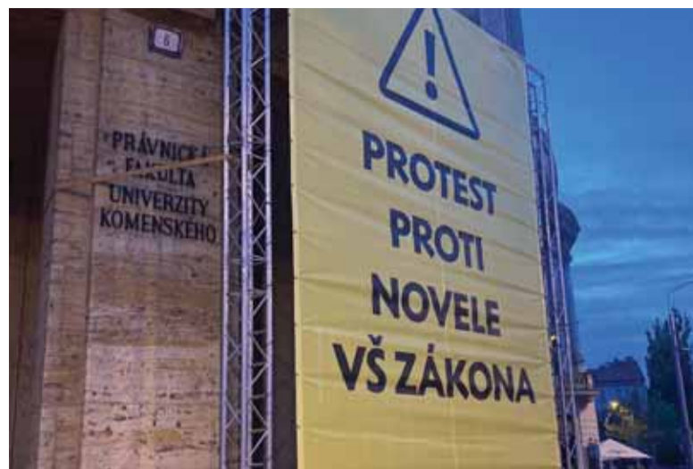
So zasahovaním štátu do nezávislosti akademického prostredia už verejne vyjadrili nesúhlas študenti aj pedagógovia. V Bratislave vyvesili na budovu Právnickej fakulty Univerzity Komenského protestný transparent.

Ministerstvom školstva navrhované zmeny nie sú, podľa nášho názoru, zmeny, ktoré by pomáhali a viedli k zvyšovaniu kvality vysokoškolského vzdelávania. Skôr naopak,