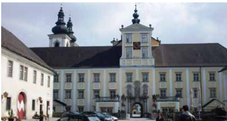
Kláštor v meste Kremsmünster, kde sa utiahli predstavitelia prvej Slovenskej republiky pred víťaznými americkými vojskami.