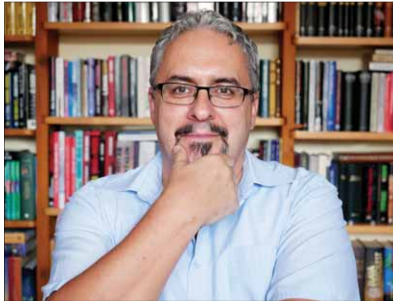
Slovenský autor M. JESENSKÝ sa venuje mysterióznym témam slovenskej minulosti.

tvorivosti skutočne otvorenej mysle, nám potom umožňuje nachádzať netradičné vysvetlenia, nečakané súvislosti a dostávať neobvyčajné odpovede aj na tie zdanlivo banálne otázky. Fantastický realizmus znie ako nejaký oxymoron, no v sku-