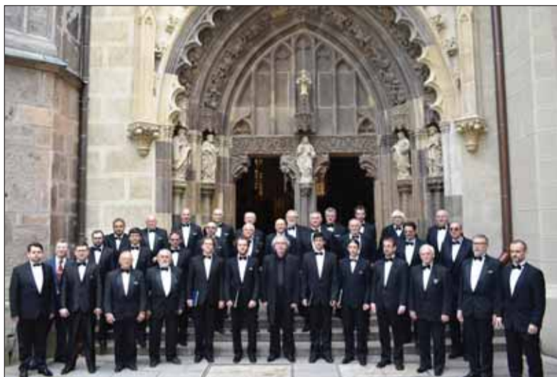
Spevácky zbor slovenských učiteľov oslávil storočnicu.

V nasledujúcich rokoch zbor vystúpil na rôznych festivaloch, koncertoch a súťažiach v Prahe, v maďarskom Debrecíne či vo Francúzsku v Paríži a v Lyone, neskôr dvakrát v Llangollene, kde získal dve ceny. Aj v tomto období preň komponovali zborové skladby známi