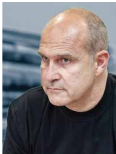
Mnohí občania doteraz tvrdia, že smrť M. Lučanského nebola samovražda.

Bol totiž porušený článok VI., ktorý hovorí, že o zasadnutí komisie, na ktorom sa má prijímať záverečná hodnotiacia správa, vyzrozumie komisia blízke osoby obvineného gen. Milana Lučanského a umožní im sa na zasadnutí zúčastniť, čo sa neudialo. Právny zástupca ani blízke osoby neboli vyzrozumené a nebolo im umožnené sa na zasadnutí komisie zúčastniť. Mrzí ma, že informácie z obsahu záverečnej správy sa ministerka spravodlivosti, generálny prokurátor a hlavne rodina dozvedeli z médií skôr ako o samotnej správe v zmysle štatútu rozhodla komisia.