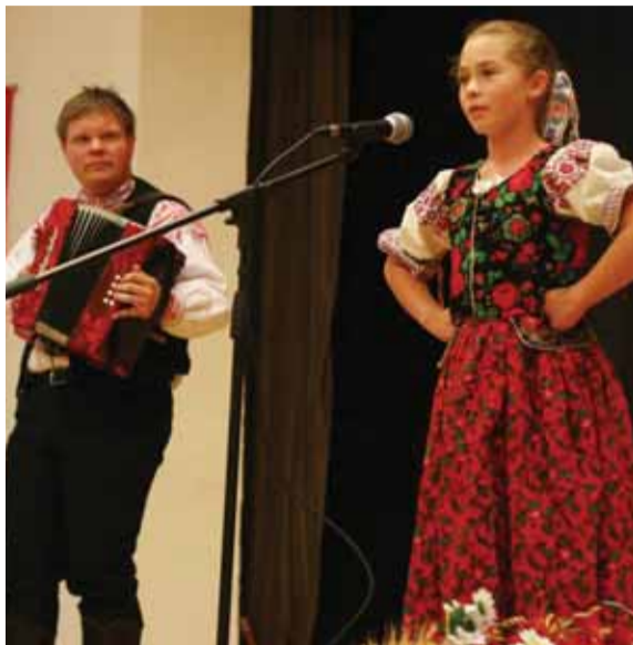
Folklorná skupina Dražovce má v repertoári diela komponistu Bélu Bartóka.

Svetovo uznávaný hudobný skladateľ Béla BARTÓK patril medzi najoriginálnejších a najprínosnejších predstaviteľov hudby 20. storočia. Koncom marca uplynulo stoštyridsať rokov od jeho narodenia. Ako etnomuzikológ a zberateľ ľudových piesní cestoval po rôznych krajinách. Neobišiel ani Slovensko, kde v rokoch 1906 až 1918 zozbieral vyše tritisícdeväťsto slovenských ľudových piesní.