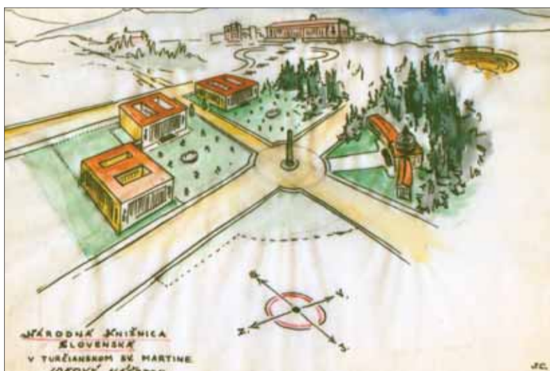
Návrhy Jozefa CINCÍKA na budovu a areál Slovenskej národnej knižnice

Pri príležitosti 20. výročia vzniku Československej republiky sa reálne uvažovalo o začiatku výstavby budovy SNK. Desiateho júla 1938 bol slávnostne položený základný kameň „paláca slovenskej vedy, literatúry, umenia a národnej kultúry“. Za touto