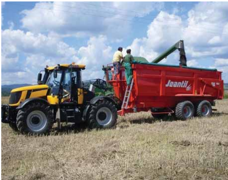
Minister pôdohospodárstva a rozvoja vidieka SR J. Mičovský nedokázal vybaviť z miliardového plánu obnovy pre slovenských agrárnikov nič. V parlamente pripravuje opozícia návrh na jeho odvolanie.

„Spomeňme si na tých niekoľko dní počas prvej vlny pandémie koronavírusu, keď sme v obchodoch dočasne nevedeli kúpiť niektoré druhy trvanlivých potravín. Droždie sa stalo pomaly luxusom. Zákazníci v panike vykupili, čo sa dalo. A národ v priamom prenose na pár dní zistil, o čom je životaschopné domáce poľnohospodárstvo a potravinárstvo.“ Znie text protestu a výzvy ministromi Mičovskému na webovej stránke SPPK. „Uvedomelosť krajiny spočíva aj v tom, že si dlhodobo posil-