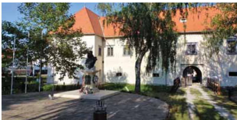
Kaštieľ v Borši bol obnovený. Rekonštrukciu financovala najmä maďarská vláda. Kvôli pandémie sa pre verejnosť otvorí už 1. júna.