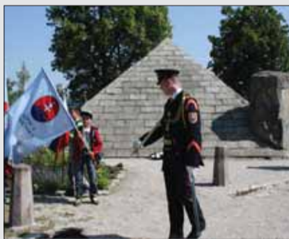
Mohyla na mieste Štefánikovej smrteľnej tragédie

Vo svojom príhovore vyzdvihol veľký prínos generála Milana Rastislava Štefánika pri formovaní Česko-slovenskej republiky, ktorá oslobodila Slovensko spod maďarského útlaku a zabezpečila slovenskému národu politický a kultúrny rozvoj. Podľa jeho názoru je len málo takých osobností slovenských dejín, ktoré sa zapísali do srdca celých generácií Slovákov ako práve Milan Rastislav Štefánik. Nezabudol tiež spomenúť jeho osobnosť, kariérne a politické úspechy i to, že vďaka svojim osobným kontaktom na najvyšších politických miestach Dohodových mocností zabezpečil novému česko-slovenskému štátu medzinárodné uznanie. „O úspechu Štefánika ako vojaka i ako politika najvýraznejšie hovorí jeho vojenská kariéra. Málokedy sa totiž stáva, aby v priebehu štyroch rokov postúpil niekto vo vojenskej hierarchii z pozície obyčajného radového vojaka do hodnosti brigádneho generála. Štefánikovi sa to podarilo a česko-slovenské légie, ktoré vybudoval v Rusku, vo Francúzsku a v Taliansku, svedčia o jeho organizačnom talente i vojenských schopnostiach.“