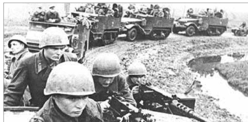
Motorizovaná ozbrojená jednotka Červenej armády sa presúva popri Hrone smerom na západ počas oslobodzovania Slovenska.

Samotné oslobodzovanie prebiehalo po viacerých etapách, niekedy aj so súčasne prebiehajúcimi útočnými operáciami. Boje boli z pohľadu oslobodzujúcich vojsk veľmi zložitú. Horský terén väčšiny Slovenska, predovšetkým stredného, už svojím prírodným charakterom dával nemeckej obrane výhodu a cha-