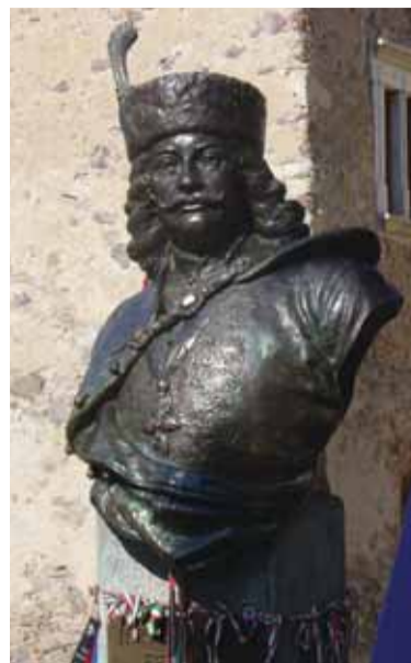
František II. Rákoci – pre Viedeň zradca, pre Uhorsko hrdina...

Vzniku samostatnej Uhorskej konfederácie by prospelo uznanie Francúzska, ktoré bolo protivníkom Habsburskej ríše, lenže napriek tichej podpore na verejné uznanie nedo-