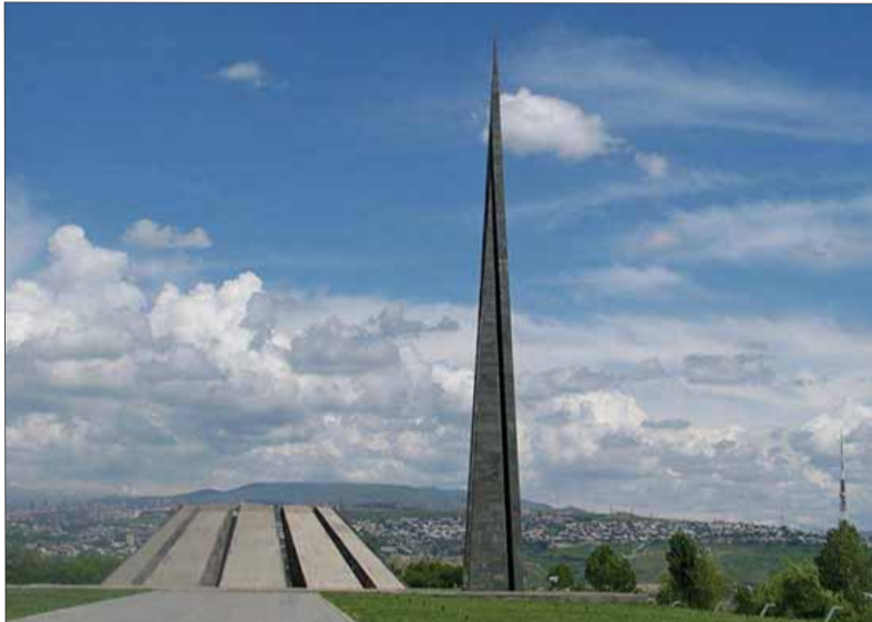
Memoriál v Jerevane pripomínajúci utrpenie Arménov počas genocídy spáchanej osmanským Tureckom

Dnes je situácia iná. Novodobý turecký „sultán“ Recep Tayyip Erdogan svojou politikou zameranou na čoraz agresívnejšie presadzovanie nielen svojich osobných ambícií, ale najmä tureckých mocenských záujmov nakoniec pre-