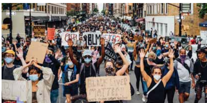
Po smrti černocho, ktorého zabil americký policajt, sa po celom svete rozšírili demonštrácie kampane Black Lives Matter.

Táto vlna intolerancie, ktorú dnešný liberalizmus priniesol, naberá masový celospoločenský charakter. Aj úsilie o zrušenie Matice slovenskej sa v našich slovenských podmienkach