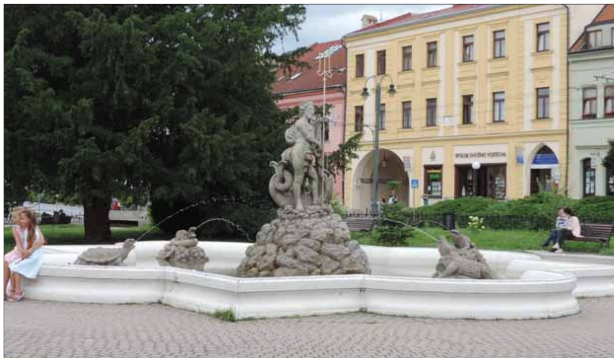
Neptúnova fontána v prešovskom parčíku na Hlavnej ulici je miestom oddychu obyvateľov aj ich malých ratoleští. Vila v Kmeťovom stromoradí na Vajanského 30 podlieha zubu času.