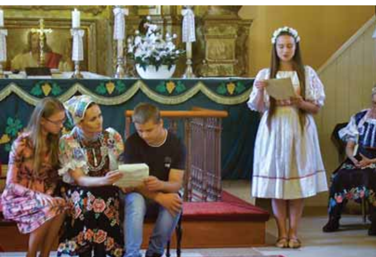
V evanjelickom kostole v Hrochoti sa, aj keď s oneskorením zaviným pandémiou, uskutočnili spomienkové oslavy 200. výročia narodenia básnika Andreja Sládkoviča, kde excelentne účinkoval aj herec a recitátor Juraj SARVAŠ.