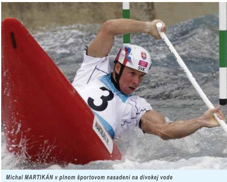
Michal MARTIKÁN v plnom športovom nasadení na divokej vode

Áno, päť olympijských kovov rôznych farieb má neobyčajne veľkú športovú i spoločenskú hodnotu, ale takmer takú istú majú medaily zo šampionátov sveta i Európy. Tých bolo skutočne veľa. Časť jeho početnej zbierky tvorí pätnásť zlatých, tri strieborné a šesť bronzových medailí zo zápolení o tituly majstrov sveta, ale podobnú kolekciu tvoria aj medaily z európskych vôd – pätnásť za prvé, päť za druhé a dve za tretie miesta.