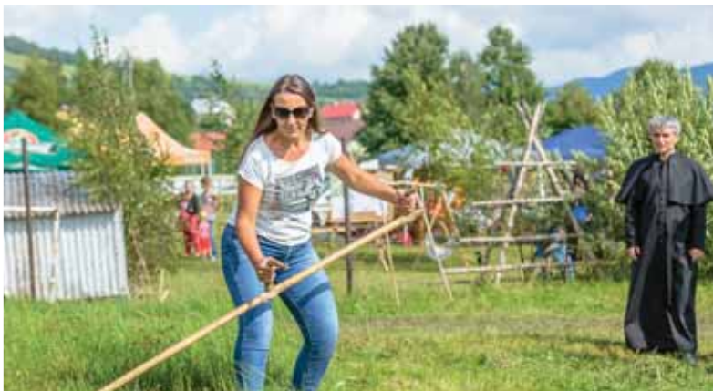
Prakticky od samého začiatku Horehronských slávností koscov a hrabačiek organizátori „otvárajú“ aj ženskú kategóriu, aby aj nežnéjšie polovičky mohli ukázať, že sa vedú zvrátať nielen s vareškou v kuchyni, ale aj s kosou.