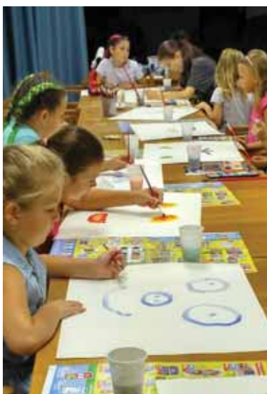
Sústreďenie malých kurzistov pri maľovaní návrhov na výzdobu hodvábných šatiek

dielka. Napokon v piatok vyrábali z ovčieho rúna brošne, ktoré si pripínali na tričká, a niektoré aj darovali. Týždeň im ubehol ako voda, hoci viaceré deti chceli pokračovať aj ďalší týždeň. Galantský organizátori veria, že sa deťom program kreatívneho týždňa páčil a prídu aj na ďalšie tvorivé dielne.