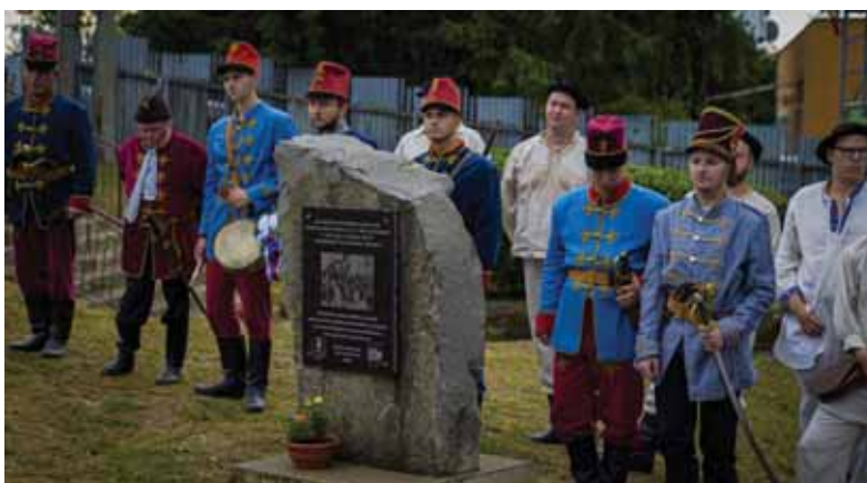
Protagonisti matičného divadelného kolektívu predviedli na miestach roľníckeho povstania z roka 1831 rekonštrukcie vtedajších udalostí.

odbor MS z Cabova a Vranova nad Topľou. Spomienkové podujatie pripravil Miestny odbor MS v Komáranoch, kde pred dvoma rokmi Matica v spolupráci s obcou odhalila pamätník Východoslovenskému roľníckemu povstaniu, ktorý rozšíril sieť pamätníkov na východnom Slovensku venovaných udalostiam z roka 1831. Podobné pamätníky sa nachádzajú v neďalekom Jastrabí nad Topľou, Čaklove, Zámotove, vo Vranove nad Topľou a inde. Ďalšie podujatie venované 190. výročiu Východoslovenského roľníckeho povstania sa uskutoční v septembri v Haniske pri Prešove, kde sa nachádza monumentálny pamätník venovaný spomínaným udalostiam.