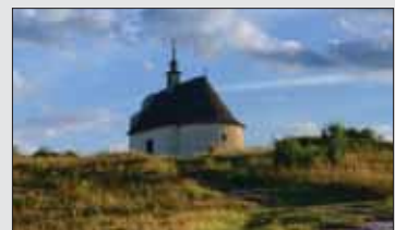
Prirodňú rezerváciu Sívá brada odkúpil štát od súkromníka za stopäťdesiat tisíc eur...

Neviem, čo bolo skôr, či Mňačko a jeho reportáže z konca pražských ciest, alebo moje vlastné „pražské novinárske cesty“ a k nim pripnutá spomienka na inšpiratívneho spisovateľa – na jeho spôsob zobrazovania reality, v ktorej sa pohyboval.