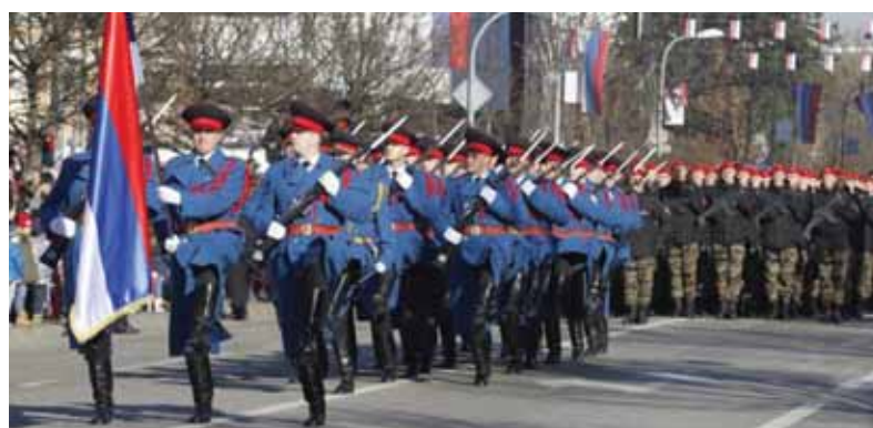
Defilé uniformovaných zložiek Ministerstva vnútra a polície Republiky Srbskej počas slávnostnej prehliadky pri príležitosti oslavy Dňa republiky 9. januára 2022 v Banja Luke

Ak by sme veľmi zjednodušene definovali tieto nenaplnené ciele, môžeme uviesť, že bosniacki moslimovia, teda Bosniaci, túžili po suverénnom celistvom a národnom štáte pod svojou kontrolou. Bosniacki Srbi po tom, čo pochopili, že Bosna ako celok