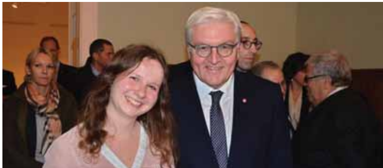
Nemecký prezident Frank-Walter Steinmeier sa po prvý raz navštívil Slovensko v roku 2017 a zavítal aj do Žiliny, kde sa v Rosenfeldovom paláci stretol a besedoval s miestnymi občanmi.

Najväčšia opozičná kresťansko-demokratická únia CDU, ktorá po