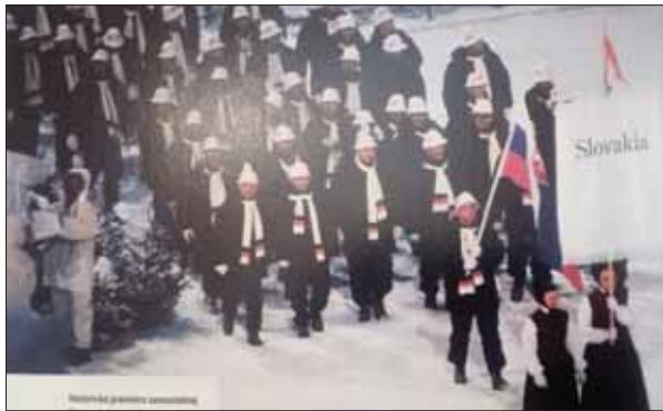
Historicky prvé defilé slovenských olympionikov. Vlajkonosičom výpravy SR bol hokejista Peter ŠTASTNÝ.

Začnime tými lepšími. Najväčšiu radosť urobili hokejisti, ktorí sa na OH dostali doslova v hodine dvanástej. Už vo svojom premiérovom stretnutí nečakane remizovali so Švédskom 4 : 4 (2 : 1, 0 :