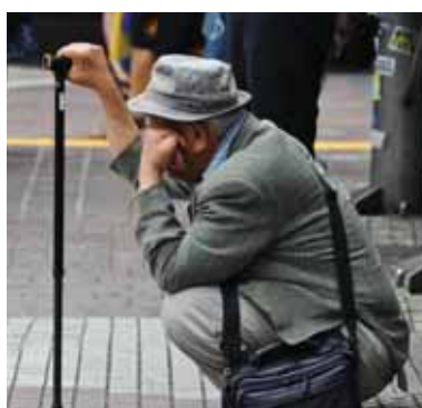
Slovenskí penzisti majú oprávnené obavy z budúcnosti.

Oba systémy dôchodkového zabezpečenia počítajú s reformou, keďže náklady na ich fungovanie sú najväčšou nákladovou položkou vo verejných rozpočtoch, ktorých podiel na HDP nedovoľuje v prípade Česka plniť kritériá ich prípadného vstupu do eurozóny a v slovenskom prípade zabezpečiť ich trvalú udržateľnosť. V Programovom vyhlásení terajšej vlády sa píše o potrebe zvýšenia základnej časti penzie všetkým, vyššie penzie za výchovu detí, zavedenie nového štátneho a verejného fondu kvôli sporeniu či skorší odchod do dôchodku pre náročné profesie. Navyše sa plánuje znížiť percentá sociálneho poistenia pre zamestnávateľov, čo však znamená zníženie príjmov a zvýšenie výdavkov, a tiež sa počíta s tým, že pracujúci dôchodcovia majú platiť nižšie dane. Z čoho sa majú opísané zmeny zaplatiť tak, aby bola zabezpečená aj udržateľ-