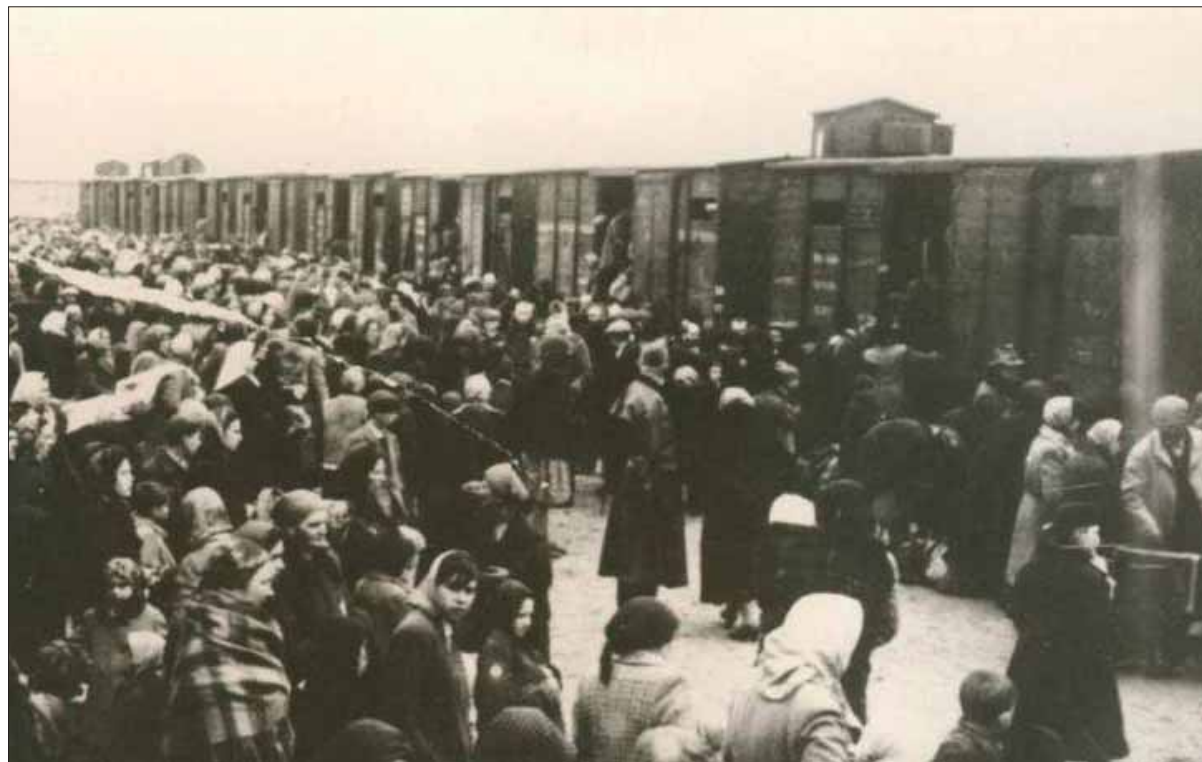
Z Maďarska deportovali vyše 400-tisíc Židov v 137 transportoch. Za deportácie Židov z obsadených území Slovenska Maďarmi nie sú zodpovední Slováci.

O prenasledovaní občanov židovskej národnosti v období existencie prvej Slovenskej republiky sa hovorí pomerne veľa. Oveľa menej pozornosti však slovenskí historici venujú útrapám Židov z územia Košíc a okolitých oblastí Abovského regiónu, ktoré po Viedenskej arbitráži pripadli Maďarsku. Pre obyvateľov Košíc, ktorí sa hlásili k slovenskej národnosti (napr. podľa sčítania z roka 1930 v meste napočítali 42 245 Slovákov a 11 504 Maďarov), bol výsledok udalostí Viedenskej arbitráže z novembra 1938 doslova katastrofou.