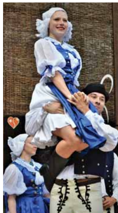
Do zoznamu nehmotného kultúrneho dedičstva pribudli dva párové tance s vyhadzovaním partnerky.

päť súborov a skupín, ktoré uchovávajú a prezentujú hudobné i tanečné tradície predkov, nerátajúc dychové skupiny a školské súbory. Môžete ich stretnúť na mnohých podujatiach, v Gazdovskom dvore v Turej Lúke, na remeselných kurzoch, usporadúvaných Centrom tradičnej kultúry v Myjave, na jarmokoch, trhoch a, pravdaže, vo výkladnej skrini oblasti – medzinárodnom folklórnom festivale. Ten sa koná v Myjave každoročne v júni a patrí medzi najvýznamnejšie folklórne podujatia nielen na Slovensku, ale i v Európe.