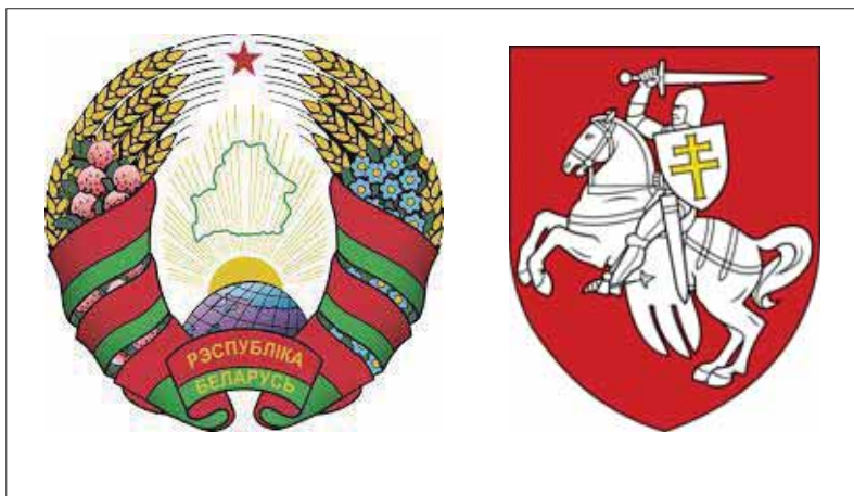
Rozpoltenosť bieloruského národa odráža aj dualita medzi národnou a štátnou symbolikou.

Bieloruská národná idea sa dostala do spoločenského diskurzu aj vďaka tlačí. V roku 1906 začali vychádzať v bieloruštine noviny Naša niva, neskôr aj ďalšie pod názvom Belarus. Novú šancu pre Bielorusov priniesol pád cára a rozvrát impéria, na troskách ktorého sa následkom brestlitovského mieru 25. marca 1918 skonštituovala Bieloruská ľudová republika. Tento štát ako nárazníkový útvar pod nemeckou kuratelou nebol síce príkladom suverénnej štátnej konštrukcie. Nemal vojsko ani ústavu. Aj tak však predstavuje dôležitý medzník na ceste k bieloruskej národnej emancipácii a štátnosti. Vďaka nemu Bielorusi mohli prvýkrát oficiálne inaugurovať svoju národnú symboliku. Prihlásili sa ňou k historickému dedičstvu Litovského veľkokniežatstva – prvej historickej litovsko-bieloruskej štátnosti. Z jej tradície prevzali štátny znak – erb v národnom červeno-bielom farebnom stvárnení