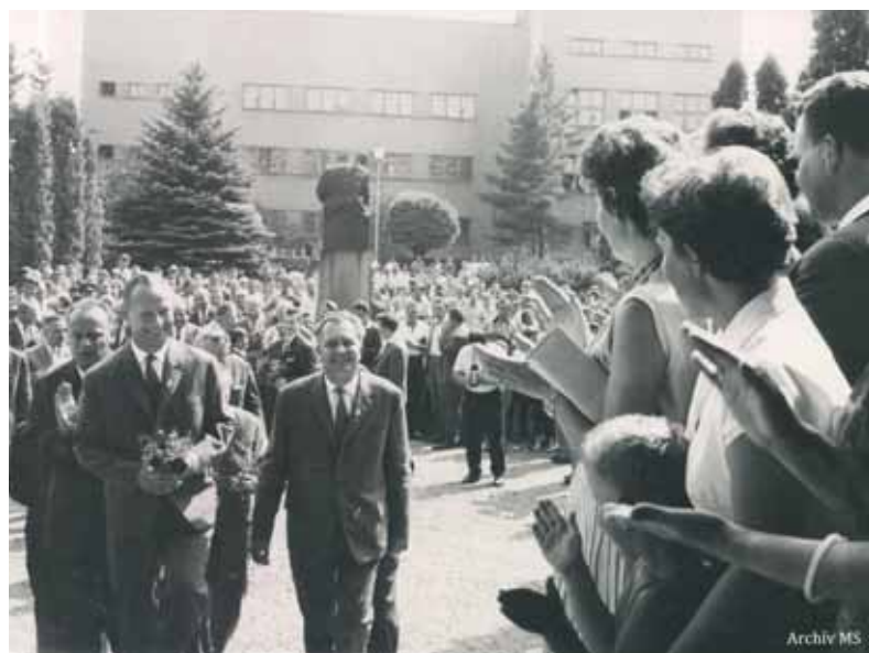
Oslavy storočnice ustanovizne v roku 1963 znamenali prelom v nazeraní na miesto Matice slovenskej v spoločnosti, k čomu pomohla aj návšteva A. DUBČEKA v Martine.

armády a ostatných účastníkov položila delegácia vence na cintoríne SNP v Priekope na hrob padlých hrdinov, ako aj na cintoríne v Martine pri symbolickom pomníku s citátom P. O. Hviezdoslava. Tiež si prezrela výstavu Sto rokov Matice slovenskej v Slovenskom národnom múzeu v Martine. Nasledoval kultúrny program slávnostným predstavením opery SND z Bratislavy Svätopluk od Eugena Suchoňa v amfiteátri v Martine, čo bolo vhodne vybrané dielo s mimoriadne silnou výpovednou hodnotou. Program pokračoval aj nasledujúci deň prehliadkou najlepších slovenských súborov LUT s pásmom poézie, hudby, piesní a tancov Zem spieva v prírodnom amfiteátri v Martine a slávnostným zasadnutím Rady Matice slovenskej v Divadle SNP v Martine, kde vystúpil, okrem iných, s príhovorom aj samotný Alexander Dubček. V prejave vysoko hodnotil miesto ustanovizne v dejinách, no nezmišnil sa o možnosti širšieho kultúrneho pôsobenia, nebol na to ešte vhodný čas.