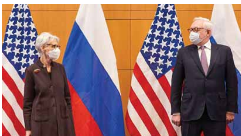
Námestníčka ministra zahraničných vecí USA Wendy Shermanová a námestník ruského ministra zahraničných vecí Sergej Rjabkov počas stretnutia na rokovaní v Ženeve z 10. januára 2022.

Rokovania sa začali 10. januára v Ženeve rozhovormi medzi americkou a ruskou delegáciou. Pokračovali 12. januára v Bruseli zasadnutím Rady NATO – Rusko a o deň neskôr 13. januára pod hlavičkou Organizácie pre bezpečnosť a spoluprácu v Európe (OSBE) vo Viedni. Najdôležitejšie rozhovory prebehli s predstaviteľmi USA. Americkú delegáciu na rokovaniach v Ženeve viedla námestníčka ministra zahraničných vecí USA Wendy Shermanová. Na čele ruského tímu bol Sergej Rjabkov. Schôdzka trvajúca približne osem hodín sa konala