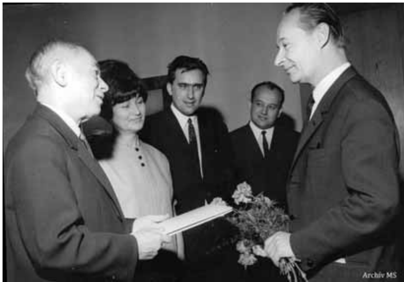
Matičná delegácia odovzdáva Alexandrovi DUBČEKovi v Prahe osvedčenie o udelení čestného členstva v Matici slovenskej.