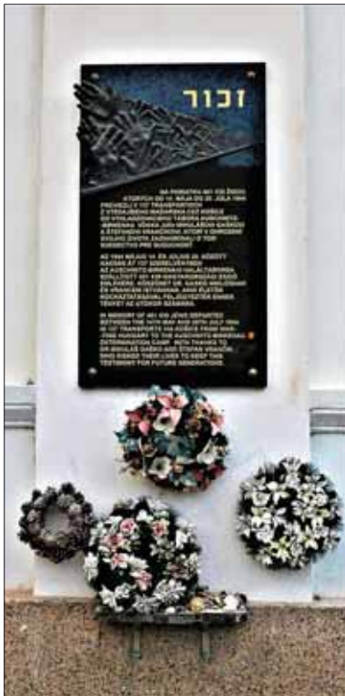
Pomník na obeť holokaustu v Košiciach

No i napriek tomu považovali nacisti priebeh boja proti židovstvu v Maďarsku za pomalý a žiadali zintenzívnenie deportácií. Maďarská vláda však odmietla spolupracovať a v reakcii na túto požiadavku