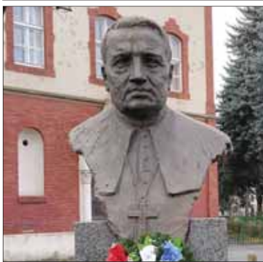
Košickí matičiari na vedúce osobnosti Matice slovenskej nezabúdajú.

Už v roku 1856 oživil myšlienku P. J. Šafárika a Jána Kollára o potrebu