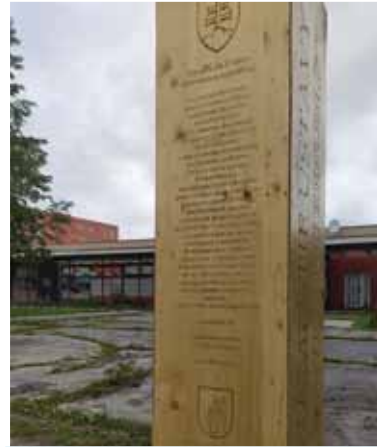
Historickú udalosť prijatia Ústavy SR v Liptovskom Mikuláši pripomína aj tento drevený obelisk.

okoloidúcim na známosť, že námestie pred Domom MS v Liptovskom Mikuláši nesie názov Námestie Ústavy SR.