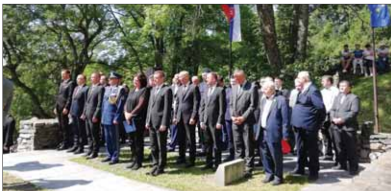
Delegácie zo Slovenska aj zo zahraničia na Stretnutí generácií vo fašistami vypálenej obci Kalište

V polovici augusta sa konalo už tradičné Stretnutie generácií v Kališti, na ktorom si účastníci pripomenuli 76. výročie ukončenia druhej svetovej vojny. Hlavnými organizátormi boli Oblasťný výbor Slovenského zväzu protifašistických bojovníkov a Múzeum Slovenského národného povstania v Banskej Bystrici.