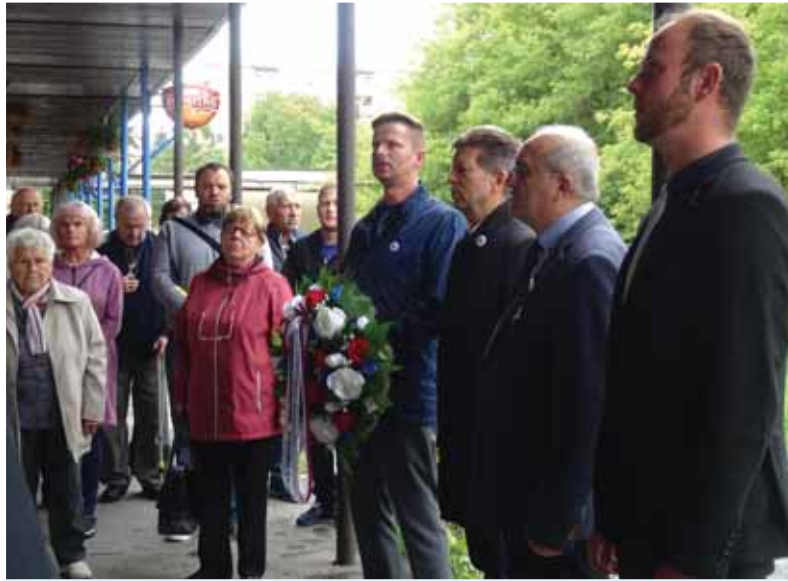
Matičiari v Liptovskom Mikuláši si jeden deň pripomenuli Deň Ústavy SR a uskutočnili aj svoje valné zhromaždenie, na ktorom zaznela aj potešujúca informácia o schválení pomenovania Námestia Ústavy SR pred Domom MS.