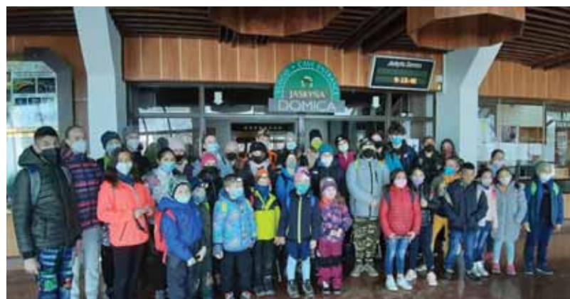
Za víťazstvo v súťaži získali školáci z Dobšinej výlet do jaskyne Domica.

Vlajší rok vyhlásila Medzinárodná speleologická únia za Medzinárodný rok jaskýň a krasu. Pri tejto príležitosti vyhlásila Správa slovenských jaskýň súťaž pod názvom Jaskyne okolo nás. Žiaci ZŠ Eugene Rufiniho z Dobšinej sa do tejto celoslovenskej súťaže zapojili hneď v dvoch kategóriách – tí najmladší jednotlivci a starší ako kolektív.