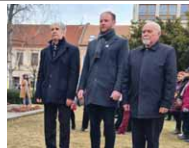
Liptovskí maticní predstavitelia počas pietneho aktu.