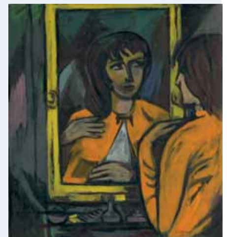
Žena pred zrkadlom (olej, 1967; v zbierkach Tatranskej galérie v Poprade)