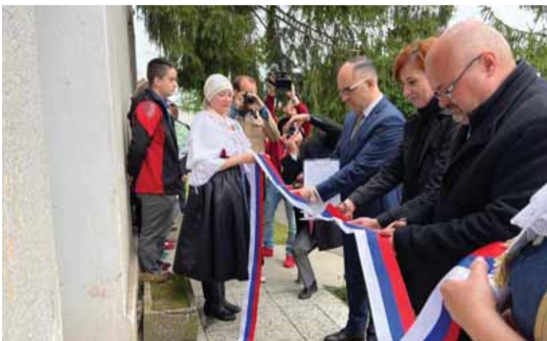
V Palárikovom rodisku v Rakovej i v jeho pôsobisku v Majcichove sa v uplynulých dňoch uskutočnili aj zásluhou Matice slovenskej spomienkové slávnosti.

Ján Palárik je pozoruhodnou postavou slovenských dejín, ktorá si zaslúži pozornosť. Jeho filozofická erudovanosť, ako aj vtip, ktorý aplikoval vo svojich divadelných hrách, sú inšpiratívnym zdrojom pre badanie. Napokon Palárikove hry boli niekoľkokrát sfilmované a inscenované na doskách divadiel. Keď dosadíte namiesto kritiky maďarónstva kritiku odnárodnosti amerikanofilov, ukáže sa ich nadčasovosť.