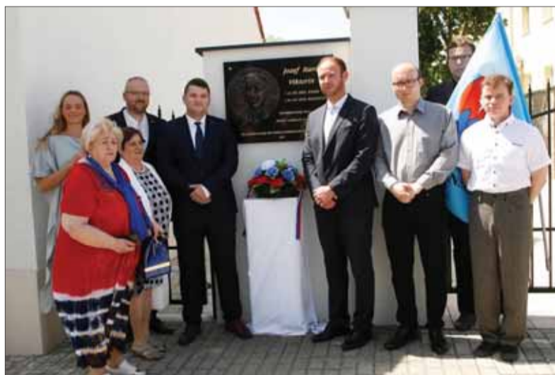
Poslanci slovenského parlamentu, zástupcovia rodiska a matiční funkcionári pri slávnostnom akte odhalenia pamätnej tabule J. K. VIKTORINovi v jeho rodisku Zavare