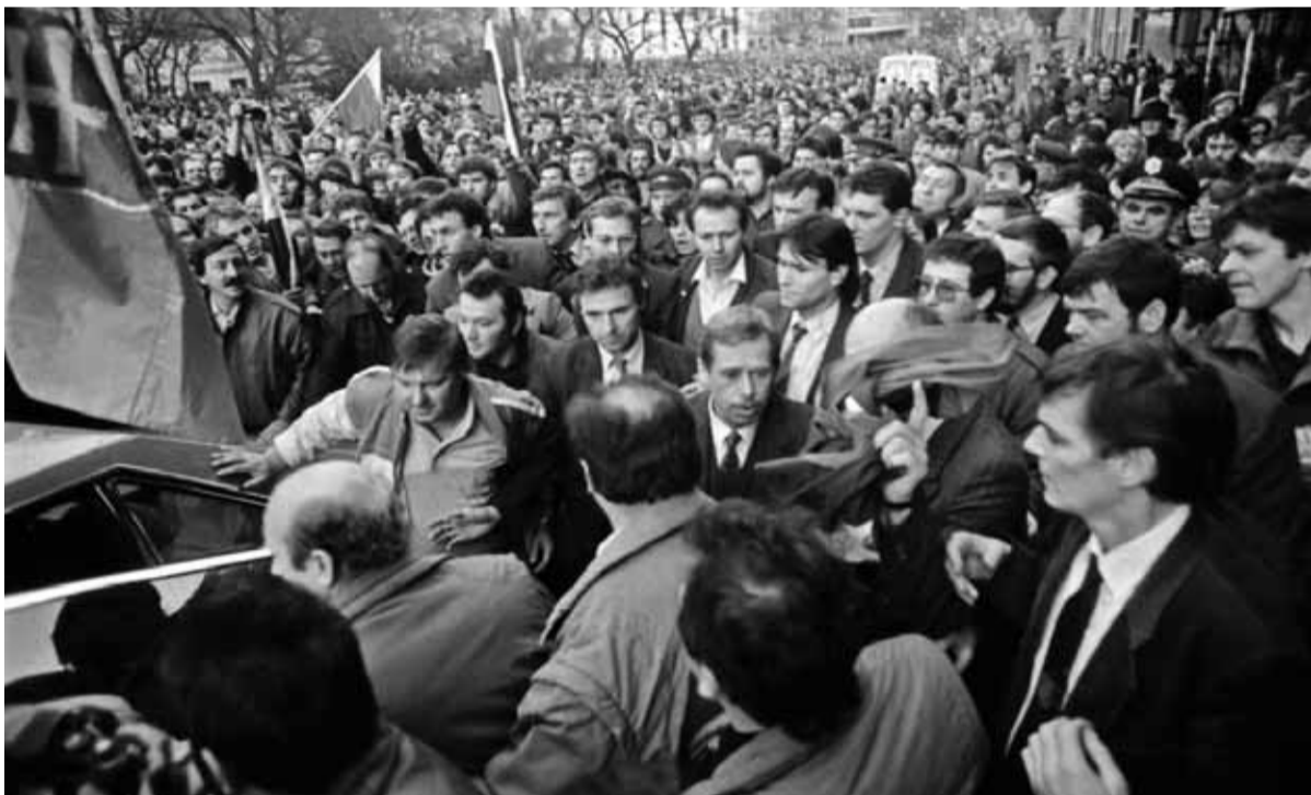
Prvý federálny prezident Václav HAVEL bol čechoslovakista. Nikdy nepochopil potreby a zápas Slovákov o vlastnú štátnosť. Na Námestí SNP v Bratislave ho zato demonštranti zasypali vajčkami.