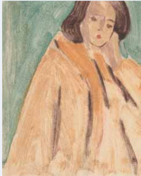
Žena v žltom (grafika, 1944 – 1945; v zbierkach Slovenskej národnej galérie v Bratislave)

sívnych lyrikov slovenskej maľby 20. storočia, bol členom pražských umeleckých spolkov Mánes (v roku 1944 mu usporiadal v Topičovom salóne prvú samostatnú výstavu), Hollar a Skupiny výtvarných umelcov 29. augusta.