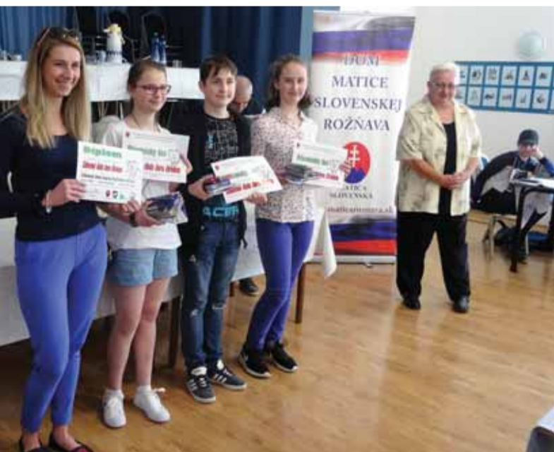
Logické myslenie, ale aj zmysel pre zábavu a vtip museli preukázať žiaci z ôsmich ZŠ okresu Rožňava, najmä však víťazi matičnej súťaže Zábavné čísla v rodisku Jura Hronca v Gočove, počas ktorej sa spritomnila aj pamiatka na tohto vedca a matematika.