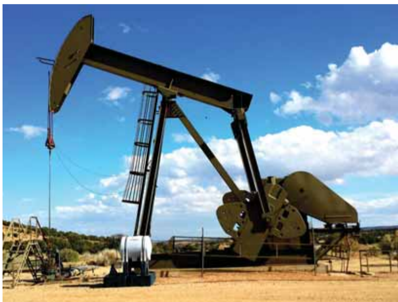
Požiadavka na diverzifikáciu zdrojov energetických nosičov má racionálny základ, ale tých doterajších sa nemožno zbaviť z večera na ráno...

čoraz väčšieho počtu domácností. V roku 2020 sa lídri členských krajín EÚ dohodli na vypracovaní plánu Zelenéj dohody pre Európu, ktorej cieľom bolo do roka 2050 dosiahnuť na starom kontinente uhlíkovú neutralitu. Tá predpokladala, že namiesto neobnoviteľných fosílnych palív sa výroba elektriny a tepla zabezpečí obnoviteľnými zdrojmi. To sa do dnešného dňa nepodarilo realizovať. Dôvodom neboli zhoršené klimatické podmienky využívania vody, slnka a vetra na výrobu elektriny a tepla, ale i zatváranie uhoľných baní či odstavovanie aj funkčných jadrových elektrární, čo spolu s negatívnymi následkami koronavírusovej pandémie boli ďalšie príčiny zvyšovania cien energetických zdrojov. K poklesu emisií skleníkových plynov do roka 2030 o päťdesiatpäť percent oproti terajšiemu