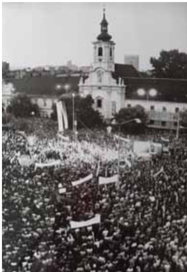
Demonštrácie za uzákonenie spisovnej slovenčiny v roku 1992 naplnili námestia slovenských miest. V Bratislave sa ich stretlo vyše osemdesiat tisíc.