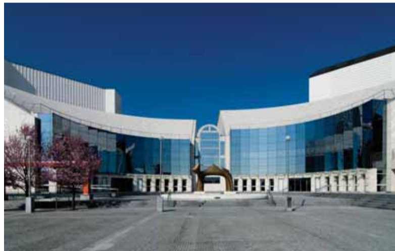
Nie je veľa krajín, kde by reprezentatívne súbory opery a činohry pôsobili pod jednou strechou s jedným vedením a najmä so spoločnou ekonomikou.

napríklad sólisti sú vo väčšine prípadov výlučne externými agentúrnymi „zamestnancami“. Druhá skupina sú klasické štátne divadlá, v ktorých sú všetci členovia ich umeleckých súborov kmeňovými zamestnancami. Plus v malej, nutnej miere externisti. Systém agentúrneho zamestnávania sa v súčasnosti, bohužiaľ, začal uplatňovať v opere SND. Generálny riaditeľ začal odrazu prepúšťať sólistov, ktorí boli doteraz kmeňovými zamestnancami. Na oplátku sú im ponúkané externé zmluvy. Ich náplň práce však ostala zachovaná. Robia to isté, čo robili predtým. Nastal preto oprávnený strach, čo bude ďalej. Právom sa pýtajú, akým spôsobom