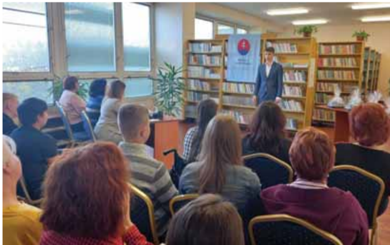
V pôsobisku štúrovského romantického básnika Janka Kráľa v Zlatých Moravciach matičiari už po štvrtý raz pripravili súťaž v prednese jeho literárnych textov a pôvodne dve kategórie pre žiakov a stredoškôlkov tentoraz rozšírili aj na súťažné vystúpenia dospelých.

Uplynulý mesiac rezonovalo meno štúrovca Janka Kráľa na viacerých podujatiach. Dvojsté výročie jeho narodenia si v apríli pripomenuli tak spisovateľov rodny Liptovský Mikuláš, ako aj mesto Zlaté Moravce, kde Kráľ prežil najväčšiu časť života a naposledy vydychol.