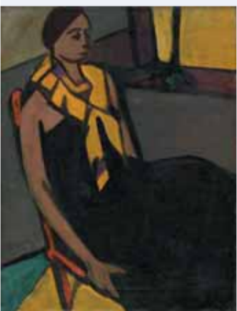
Žena so šatkou (olej, 1936 – 1939; v zbierkach Oravskej galérie v Dolnom Kubíne)