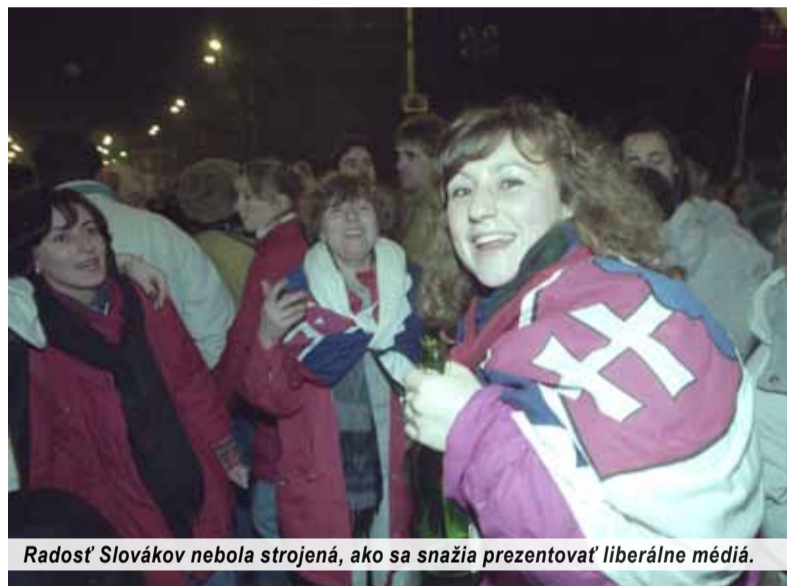
Radosť Slovákov nebola strojená, ako sa snažia prezentovať liberálne médiá.

Na druhý deň samostatnosti Slovenskú republiku už uznalo 62 štátov sveta. Na stretnutí s diplomatmi 2. januára 1993 sa im Mečiar prihováral týmito slovami: „Preživa-