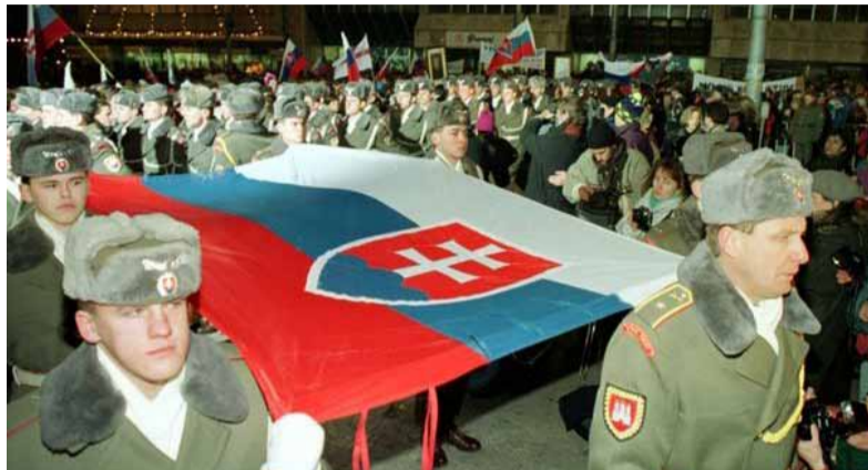
Oslavy vzniku Slovenskej republiky.

Vierolomnosť českej strany pri rokovaniach predsedov parlamentov o zmluve medzi SR a ČR niektorí vnímavejší pozorovatelia považovali za začiatok konca spoločného štátu. Onedlho sa v Mladej fronte dnes objavil titul Vo Svite bili Čechov . Pravda, nie bez príčiny. Provakácii, keď horeli autá so slovenskými poznávacími značkami na území ČR, bolo dosť. Horeli aj české na Slovensku. Média sledili po senzáciách a tie plodili najmä národnostnú neznášanlivosť.