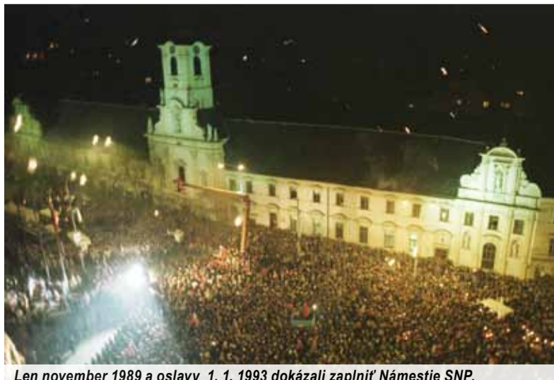
Len november 1989 a oslavy 1. 1. 1993 dokázali zaplniť Námestie SNP.

Zákony, demokratickými prostriedkami, bezbolestne sme „vybojovali“ národnú samostatnosť. Svet nás za to chválil. Po jej dosiahnutí sme v národnej aktivite výrazne poľavili. HZDS, pronárodný politický subjekt, stíchlo a z politickej scény sa úplne vytratilo. Mediá sa dostali do rúk zahraničiaci, antislováci. Ale nedosiahli, čo chceli. Šesťdesiat percent Slovákov dnes hodnotí akt osamostatnenia ako pozitívne rozhodnutie. Národovcov, matičiarov, dobrých Slovákov dnešný stav prebúdzá z driemot a aktivizuje. Čaká nás náročná robota – revitalizovať národné povedomie.