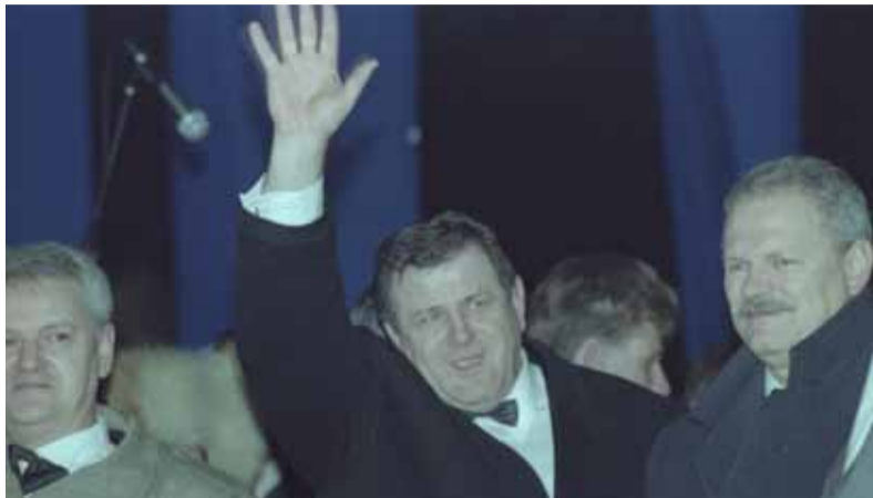
Na oslavy vzniku štátnosti prišiel aj vtedajší premiér V. Mečiar. Vľavo R. Kováč, vpravo I. Gašparovič.

Prvý pokus o zmŕtvychvstanie slovenského národa sa uskutočnil 14. marca 1939. Slovenské povedomie sa úspešne upevňovalo, hospodárski experti dosiahli také výsledky, že o slovenskej korune sa hovorilo, že je tatranským dolárom. V krajine pod Tatrami počas vojny potraviny neboli na prídela tak ako v susedných krajinách.