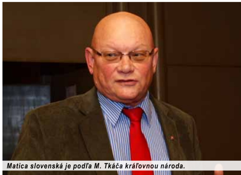
Matica slovenská je podľa M. Tkáča kráľovnou národa.

Poslanie Matice je teda jasné: ako kráľovná, ochrankyňa národa – akoby pod tajomným plaštom Patrónky Slovákov Sedembolestnej – musí mať