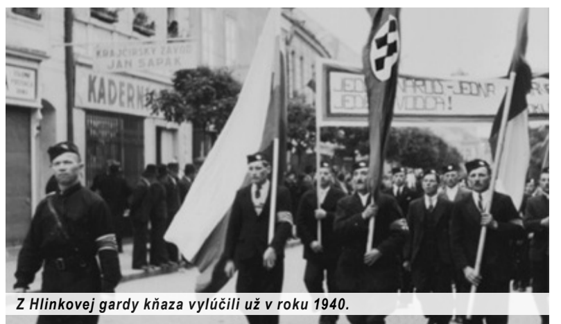
Z Hlinkovej gardy kňaza vylúčili už v roku 1940.