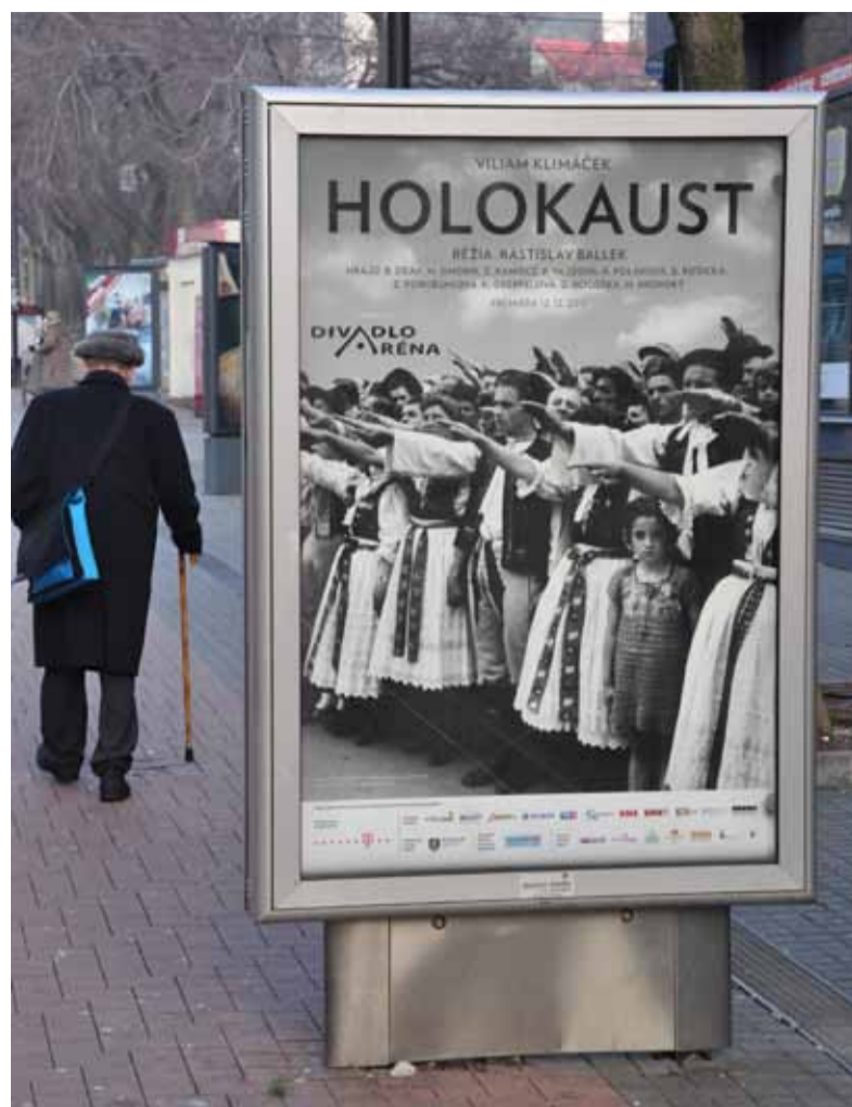
Ako nás prezentuje reklama na divadelnú hru?