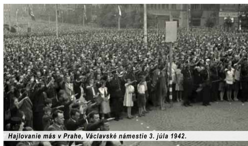
Hajlovanie más v Prahe, Václavské námestie 3. júla 1942.

Pretrieť minulosť jednou farbou znamená, že už si neprečítame, čo tam bolo v skutočnosti napísané.