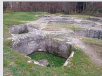
Vyhlbené jamy v travertínovej kope nazývajú miestni rímske kúpele.