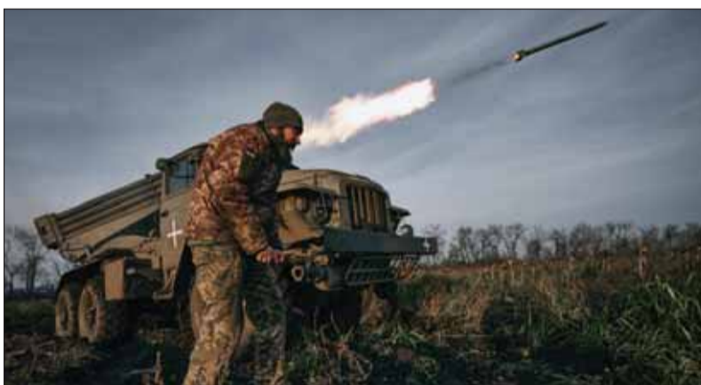
Frontová línia rusko-ukrajinského konfliktu zamrzla ako v prvej svetovej vojne.

Americký analytický portál 19FortyFive, ktorého výstupy citujú