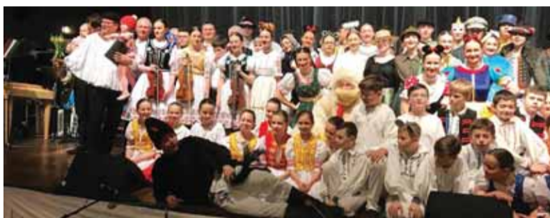
Aj na Zemplíne sa udržiavali fašiangové zvyky a humenský folkloristi zo súborov Chemlon a Chemloňáčik so svojimi zložkami ich v minulých dňoch priťažlivo uviedli v programe Deti spod Vihorlatu.