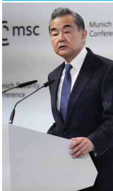
Vysoký čínsky diplomat Wang I predložil svetovému spoločenstvu mierový plán vojny na Ukrajinu. Západné krajiny ho odmietli skôr ako samotná Ukrajina.

mentality studenej vojny, pretože nepriamo legitimizuje dôvody agresie Ruskej federácie na Ukrajinu. Píše sa v ňom, že bezpečnosť krajiny by sa nemala presadzovať na úkor iných. „Bezpečnosť regiónu by sa nemala dosiahnuť posilňovaním alebo rozširovaním vojenských blokov. Legitímne bezpečnostné záujmy a obavy všetkých krajín sa musia brať vážne a náležite riešiť. Neexistuje jednoduché riešenie zložitého problému. Všetky strany by mali v súlade s víziou spoločnej, komplexnej, kooperatívnej a udržateľnej bezpečnosti a majú na pamäti dlhodobý mier a stabilitu sveta pomáhať vytvárať vyváženú, účinnú a udržateľnú európsku bezpečnostnú štruktúru.“