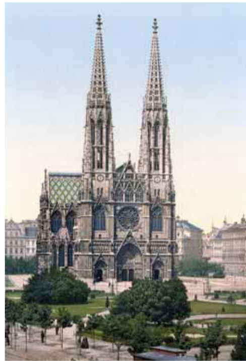
Na mieste atentátu na vládu postavili chrám vďaka Božského Spasiteľa za jeho záchranu.

a Ľudovít Košut, ktorí svojimi proklamáciami rozpalujú vášne a v tajnosti vraj pripravujú sprisahanie. Bezpečnostné orgány zvýšili ostrážitosť predovšetkým v Uhorsku, kde panovalo napätie a od potlačenia revolúcie tu odhalili niekoľko sprisahaneckých skupín.