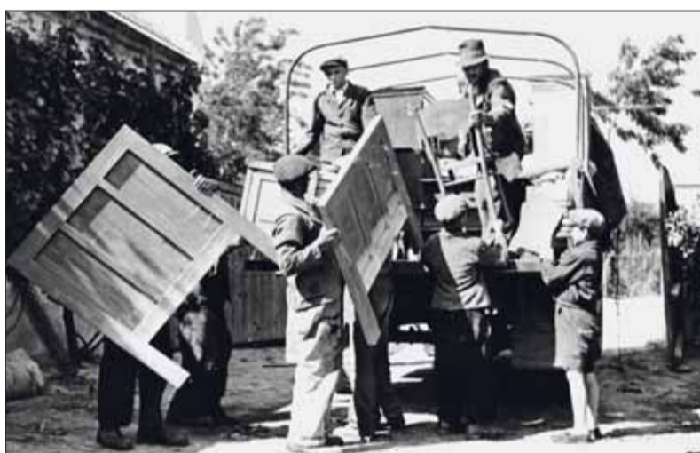
Mnohé rodiny sa museli na základe dohody medzi vtedajším Česko-Slovenskom a Maďarskom vystáhať v roku 1947 zo svojich domovov.

Nikto nespochybňuje obeť druhej svetovej vojny. Treba si však klásť jednoduchú otázku. Je naozaj skutočným a úprimným zámerom