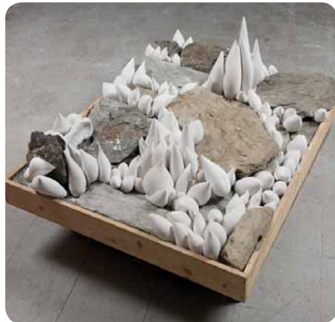
Krajina II. (kameň, sadra, drevo, 1983; v zbierkach Slovenskej národnej galérie)