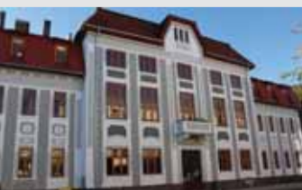
Vynovený objekt zvolenskej knižnice