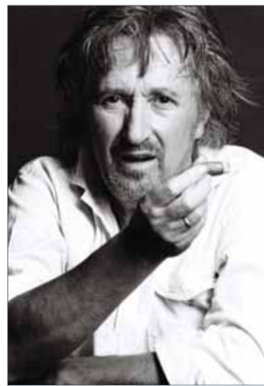
Nezabudnuteľný režisér Juraj JAKUBISKO.

tvami Nostradama. V Post coitum zase vyjadril kritiku promiskuitných sexuálnych vzťahov bez lásky, individualizmu a duševnej prázdnoty. Napokon „po svojom“ interpretoval aj osud Alžbety Bátoriovej. Posledným dokončeným filmom je pokračovanie Perinbaba. Počas života dlhodobo udržiaval kontakt s režisérom Elom Havettom, inšpiroval sa Fellinim, Truffautom či Godardom. Narodenie, život a smrť na rozmedzí času a dejín, to bola hlavná téma jeho filmov. V jednom z posledných rozhovorov zhrnul, že skoro všetky jeho filmy sa dotýkajú smrti a že nie sme na tomto svete po prvý