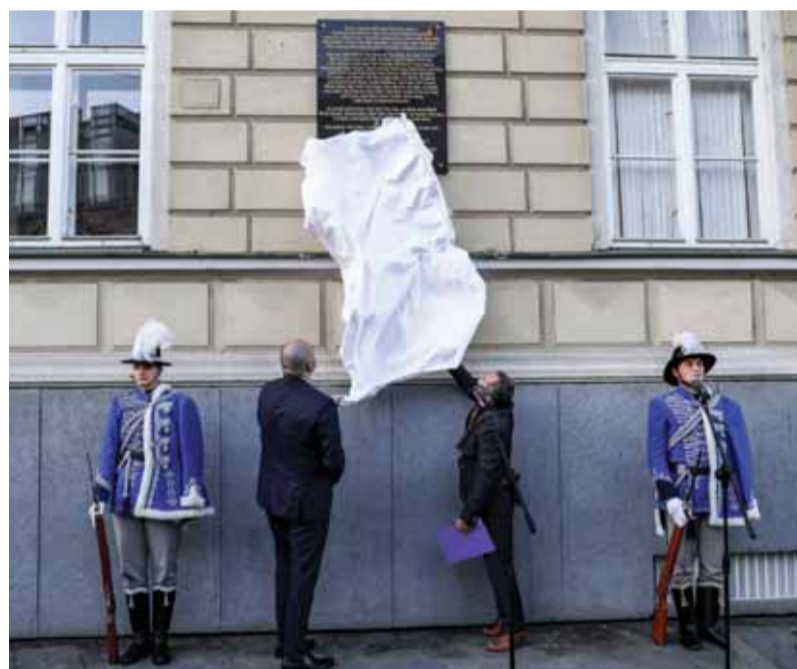
V deň 30. výročia zániku spoločného štátu Čechov a Slovákov odhalila Matica slovenská na priečelí budovy Slovenskej národnej rady v Bratislave pamätnú tabuľu so zoznamom slovenských poslancov, ktorí hlasovali za ústavný koniec federácie bez jediného prejavu násillia.

Bol veľmi dôležitý, ale najskôr vo voľbách v roku 1992 musel zvíťaziť pronárodný blok strán. Deklarácia síce neznamenal zmena v štátoprávnom usporiadaní, no deklarovali sme, že sme zvrchovaní na svojom území, že si chceme vytvoriť vlastný štát, ktorý bude reprezentovať našu zvrchovanosť. Keď som tú deklaráciu písal, uvedomoval som si, aký je to veľmi dôležitý krok. Parlamentná cesta k samostatnosti však predpokladala víťazstvo pronárodných strán aj vo