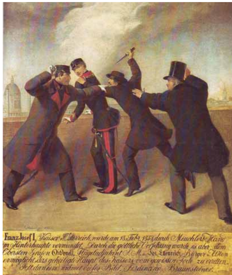
Dobová kresba zaznamenala atentát na cisára vo Viedni.