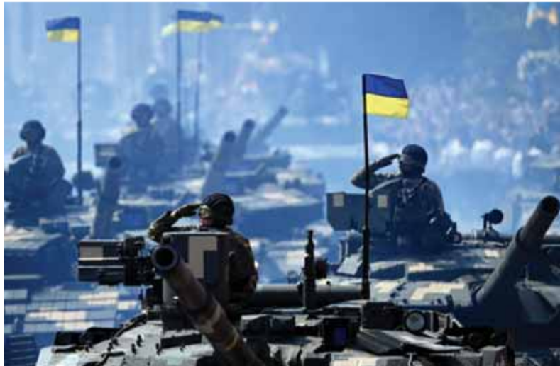
Nové tanky s ukrajinskými vlajkami nastupujú na front rusko-ukrajinskej vojny.

Slovenskí colníci argumentovali, že ide o dovoz a po oprave o vývoz na Ukrajinu, teda prevoz medzi členským a nečlenským štátom Európskej únie. A to podlieha clu. Navrhli nemeckým firmám zložiť kauciu vo výške päťiny hodnoty dovážanej a vyvážanej obrnenej techniky. Pri ich cene 5 až 7 miliónov eur za kus je 20-percentná kaucia riadna suma, z ktorej by sa podľa slovenskej argumentácie malo odrátať clo. To, čo vyzeralo ako úspech, sa premenilo na zlý byrokratický sen. V Berlíne narastal hnev, konštatujú nemecké médiá. Musel byť zapojený dokonca úrad kancelára, vraj aj Biely dom, minister obrany dvakrát