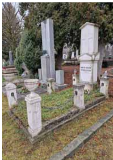
Prvý pamätník Martinovi Kukučínovi víta návštevníkov Národného cintorína v Martine.