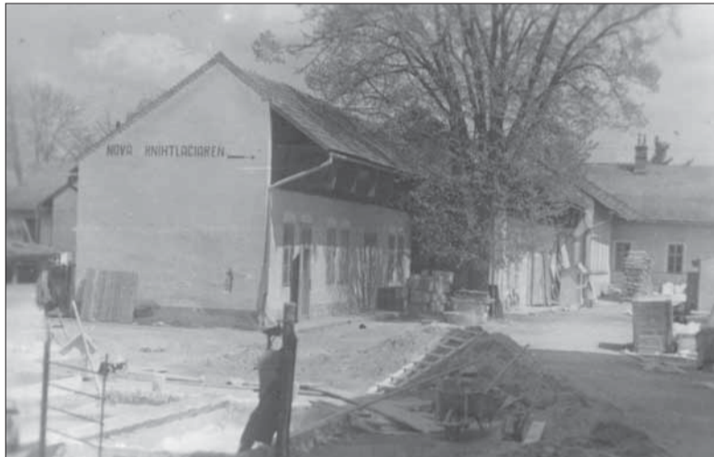
Kunayovský dom v Martine s nápisom Nová knihtlačiareň – pred asanáciou a výstavbou areálu Neografie