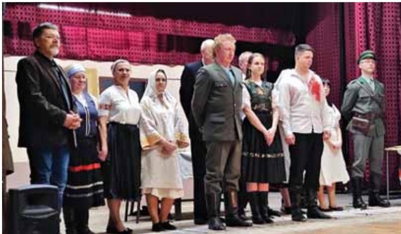
Divadelný súbor Hrušov v Skýcove na budúci rok oslávi tridsiate výročie vzniku.