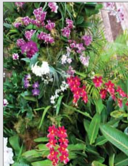
V zajatí farebnej krásy a tvarovej pestrosti orchideí