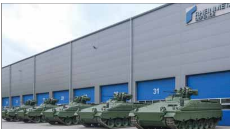
Výroba bojových vozidiel, ktoré sa vyrábajú v nemeckom zbrojárskom podniku Rheimetall, sa výrazne zvýšila.

Paradoxom plánovaných rozpočtov do roka 2026 je pokles podielov daní, ktoré odvádzajú spolkové krajiny federálu – ten dosiahne sumu dvesto miliárd eur, ktoré ostanú na prospech rozpočtov nielen jednotlivých spolkových krajín a aj obcí.