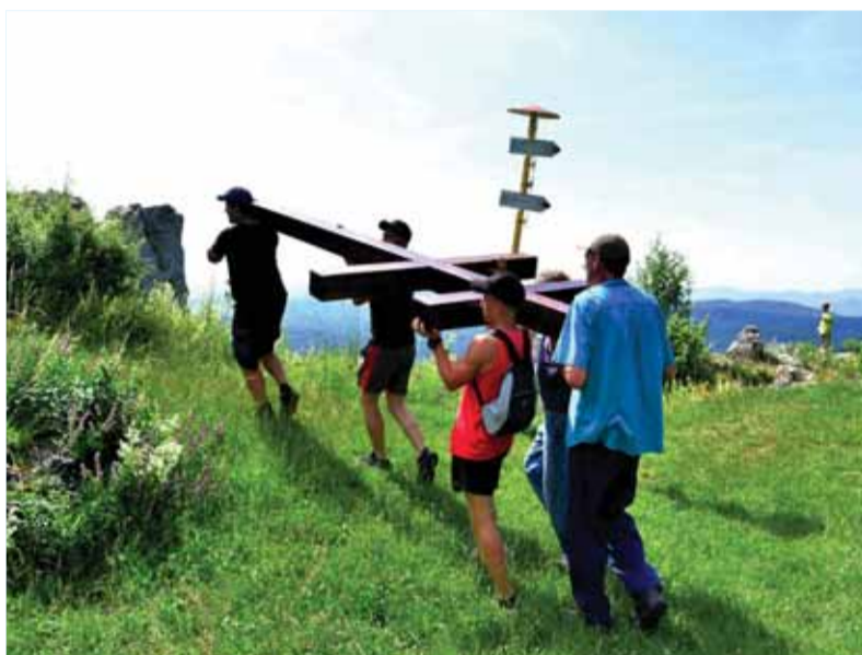
Jasenovčania už raz práce obnovovali cyrilometodský dvojkriž na Vyšehrade. Vynášali ho na vlastných plecích...

Nie všade majú dvojkriže v úcte. V Spišskej Novej Vsi v roku