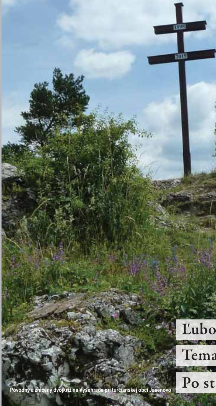
Pôvodný a zničený dvojkriž na Vyšehrade pri turčianskej obci Jasenovo