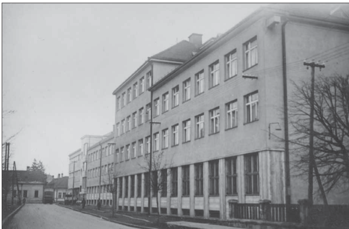
Budova Neografie v roku 1947. V súčasnosti sa v nej nachádza evanjelická škola.