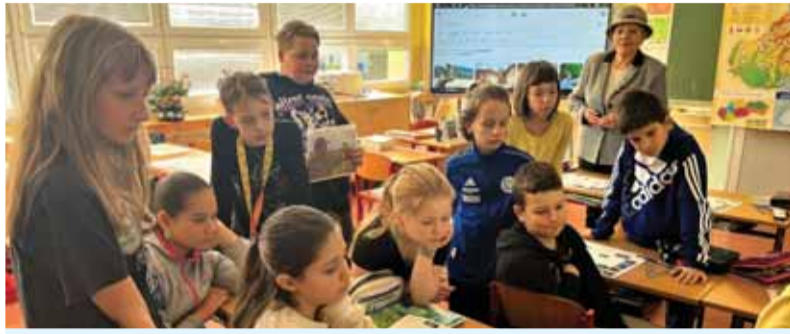
Spišskonovoveské matičiarky pripravili pre školákov aj zaujímavý vedomostný kvíz.