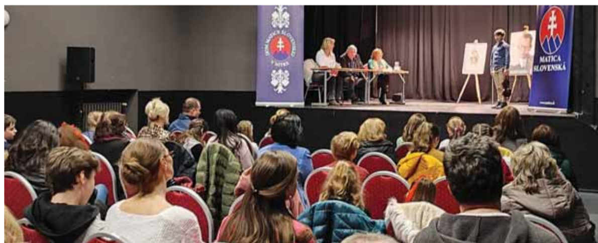
Finálne kolo pôvodnej matičnej súťaže v prednese sa konalo v Dome Matice slovenskej v Nitre.

Do krajského kola matičnej súťaže v prednese slovenských povestí Šaliansky Matka v Nitre postúpilo dvadsaťjeden úspešných žiakov základných škôl a osemročných gymnázií z okresných kôl. Postupovú súťaž pred finále, ktoré sa uskutoční 20. apríla tohto roka v Šali, organizoval po dlhšej odmlke opäť nitriansky Dom MS s príspevom Regionálneho úradu školskej správy v Nitre.