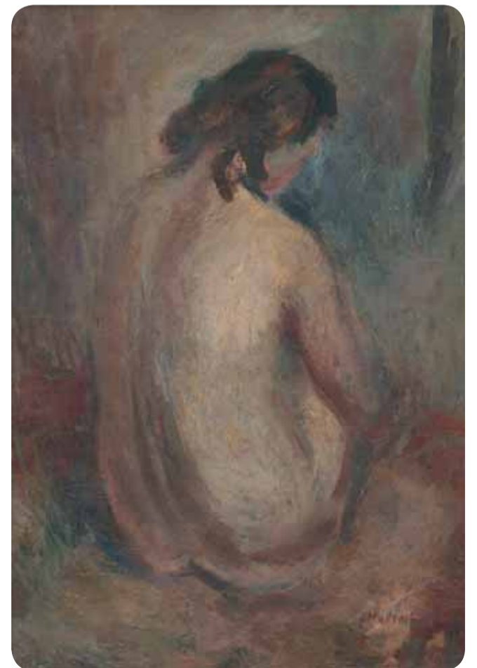
Zadumaná (olej, 1931; v zbierkach Oravskej galérie)

Klasik slovenskej výtvarnej moderny Ján Mudroch zomrel 4. februára 1968 v Bratislave vo veku 58 rokov.