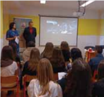
Predseda MS medzi žiakmi