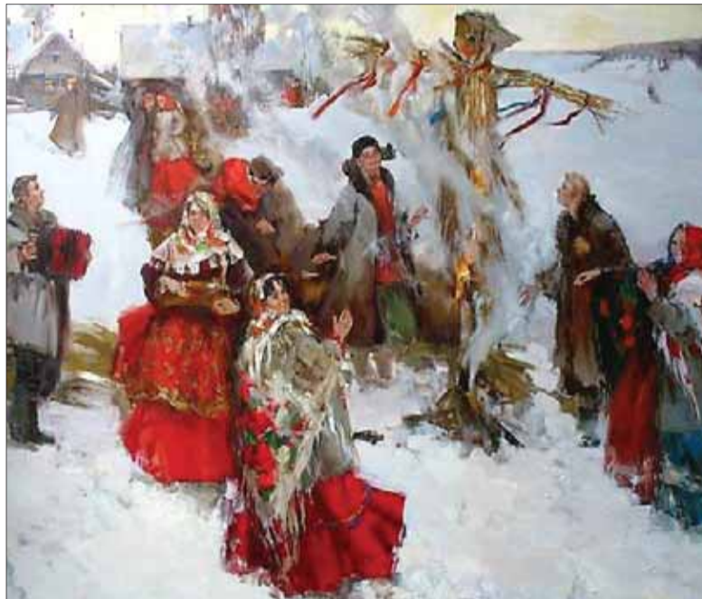
Vynášanie Moreny a víťanie jari inšpirovalo aj výtvarných umelcov.

„Korene tohto prastarého obradu súvisia s predkresťanským výročným obyčajovým cyklom. Morena symbolizovala zimu, s ktorou sa spájala temnota a napokon aj smrť. Vidiecke spoločenstvo pocítovalo potrebu zbaviť sa jej, poslať s ňou do nenávratna všetko zlé,