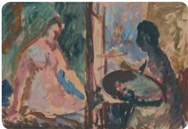
Maliar a model (tempera, 1940; v zbierkach Oravskej galérie)